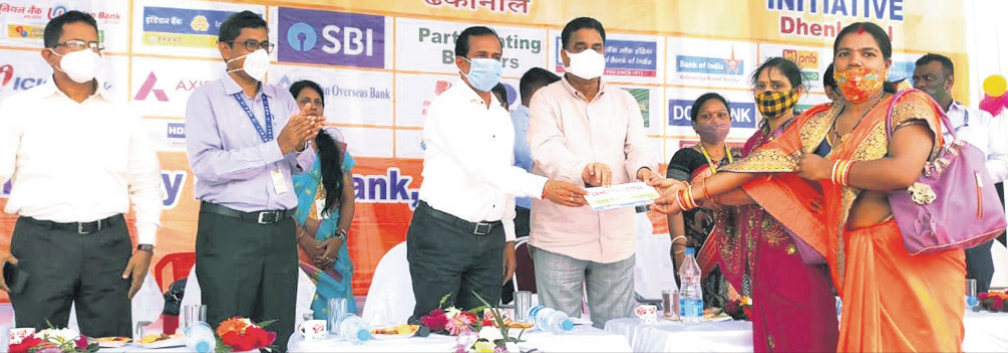
ଜଣେ ହିତାଧିକାରୀଙ୍କୁ ରଶ ବାବଦ ଚେକ୍ ପ୍ରଦାନ କରାଯାଇଛି।