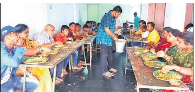
ଲକ୍ଷ୍ମୀବଜାର ପକ୍ଷରୁ ଆୟୋଜିତ ପ୍ରସାଦ ସେବନ କାର୍ଯ୍ୟକ୍ରମରେ ଶ୍ରଦ୍ଧାକୁମାରୀ।