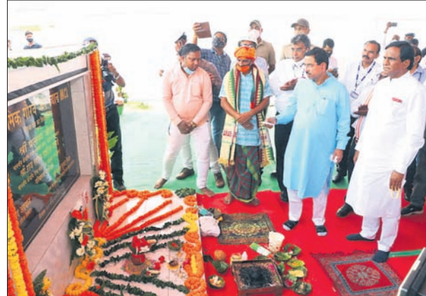
ହିଲୁକା ଏରିଆରେ ଖାତର ପାର୍କର ଭିତ୍ତିପ୍ରସ୍ତର ସ୍ଥାପନ କରୁଛନ୍ତି କେନ୍ଦ୍ରମନ୍ତ୍ରୀ।