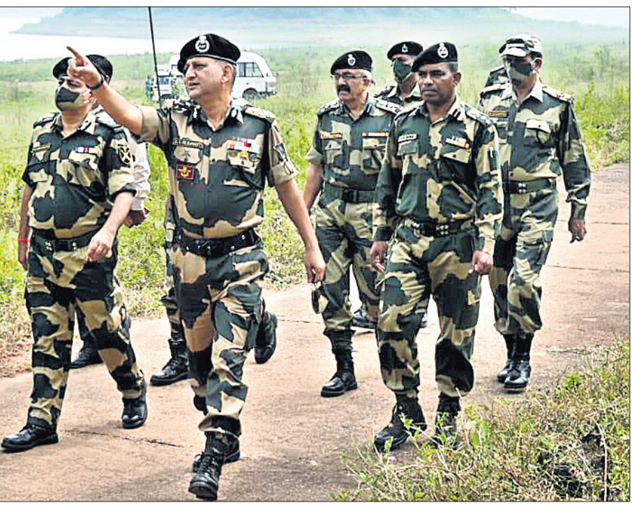
ଚିତ୍ରକୋଣାର ହତ୍ୟାକରୁଡ଼ା, କାନିବାର ବିସ୍ଫୋଟ କ୍ୟାମ୍ପରେ ଏଡିଜି ସମୀକ୍ଷା କରୁଛନ୍ତି।