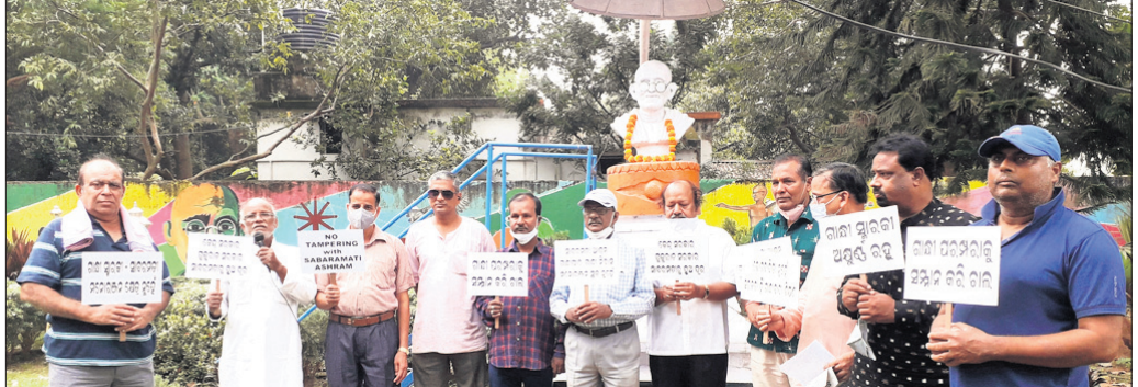
ଗାନ୍ଧୀଙ୍କ ପ୍ରତିମୂର୍ତ୍ତି ନିକଟରେ ଧାରଣା ଦେଇଥିବା ବିଭିନ୍ନ ସଙ୍ଗଠନର କର୍ମକର୍ତ୍ତାମାନେ।

ଅପରପକ୍ଷେ ଓଡ଼ାପଡ଼ା ବ୍ଲକ୍ ଏହି ଦଳର ସଦସ୍ୟ। ୨ଦିନ ତଳେ ଏହାର ମୃତ୍ୟୁ ଘଟିଥିବା ଅନୁମାନ କରାଯାଉଥିବା ବେଳେ କାରଣ ଅସ୍ପଷ୍ଟ ରହିଛି। ଘଟଣାର ତଦନ୍ତ ଜାରି ରହିଥିବା ବନଖଣ୍ଡ ଅଧିକାରୀ କହିଛନ୍ତି। ଏଥିପୂର୍ବରୁ ଗତ ୨୩ ତାରିଖରେ ଗଠିଆ ବ୍ଲକ୍ ଷଡ଼ଙ୍ଗା ରେଞ୍ଜି ଧରିଆନାଳୀ ସଂରକ୍ଷିତ ଜଙ୍ଗଲରେ ଏକ ଅସୁସ୍ଥ ଦଳର ଚିକିତ୍ସାଧୀନ ଅବସ୍ଥାରେ ମୃତ୍ୟୁ ଘଟିଥିଲା।