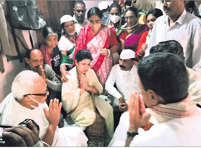
ମମିତାଙ୍କ ପରିବାର ସଦସ୍ୟଙ୍କ ସହିତ କଂଗ୍ରେସ ରାଷ୍ଟ୍ରୀୟ ସାଧାରଣ ସମ୍ପାଦକ ସମେତ ଅନ୍ୟମାନେ ଆଲୋଚନା କରୁଛନ୍ତି।