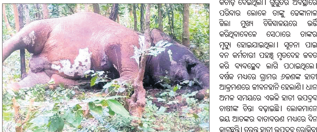
କପିଳାସ ବନାଞ୍ଚଳ ଅନ୍ତର୍ଗତ ରାମେଇ ସଂରକ୍ଷିତ ଜଙ୍ଗଲରେ ଠାବ ହୋଇଥିବା ମୃତ ହାତୀ।