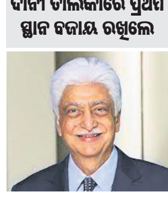
ଦାନୀ ତାଲିକାରେ ପ୍ରଥମ ସ୍ଥାନ ବଜାୟ ରଖିଲେ

ନୂଆଦିଲ୍ଲୀ, ୨୮।୧୦ ଆର୍ଥିକ ଦର୍ଶି ୨୦୨୦-୨୧ରେ ଫ୍ରେଡ଼ା ପ୍ରତିଷ୍ଠାତା ଅଜାମ ପ୍ରେମଜୀ ଦୈନିକ ହାରାହାରି ୨୧ କୋଟି ଟଙ୍କା ହିସାବରେ ମୋଟ ୯୭୮୩ କୋଟି ଟଙ୍କା ଦାନ କରିଛନ୍ତି।