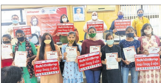
ଅତିଥିକ ଗହଣରେ ସମର୍ଥକ ହୋଇଥିବା କିଶୋରୀମାନେ।

ନୟାଗଡ଼ ଅଫିସ୍, ୨୯୧୧୦ ବାଲ୍ୟ ବିବାହ ପରି ସମାଜିକ ବ୍ୟାଧି ନୟାଗଡ଼ ଜିଲ୍ଲାରେ ବିଚାର କାରଣ ପାଇଛି। ଏହାକୁ ରୋକିବା ନେଇ ସରକାରୀ ସ୍ତରରେ କାର୍ଯ୍ୟକ୍ରମ ଚାଲିଥିଲେ ମଧ୍ୟ କାଠିକର ପାଠ ହେଉଛି। ବାଲ୍ୟ ବିବାହକୁ ରୋକାଯିବା ପାଇଁ ସରକାରୀ ସ୍ତରରେ କରାଯାଉଥିବା ଉପାୟକୁ ଦୂରାଦୃଷ୍ଟି କରାଯିବାକୁ ନିଷ୍ପତ୍ତି ହୋଇଛି।