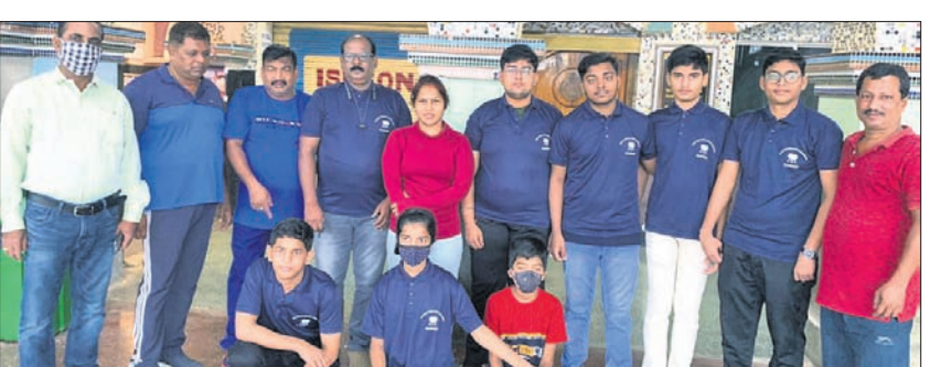
ଡେନିସ ପ୍ରତିଯୋଗିତାରେ ଭାଗ ନେବାକୁ ଥିବା କ୍ରୀଡ଼ାବିତମାନେ।

ବୃକ୍ଷପୁର ଅଫିସ୍, ୨୯୧୧୦ ଓଡ଼ିଶା ଚେରୁଲ ଟେନିସ ସଂଘ ପକ୍ଷରୁ ୨୭ତମ ରାଜ୍ୟସ୍ତରୀୟ ଚେରୁଲ ଟେନିସ ପ୍ରତିଯୋଗିତା ଶୁଭାଦାନ ଆରମ୍ଭ ହୋଇଛି। କଟକସ୍ଥିତ ଜବାହରଲାଲ ନେହେରୁ ଜନତୋର ଷ୍ଟାଡ଼ିୟମ ଠାରେ ଆସନ୍ତା ୨ ତାରିଖ ପର୍ଯ୍ୟନ୍ତ ଏହି ପ୍ରତିଯୋଗିତା ଚାଲିବ। ଏଥିରେ ଅଂଶ ଗ୍ରହଣ କରିବା ନିମନ୍ତେ ବୃକ୍ଷପୁର ଚେରୁଲ ଟେନିସ ସଂଘର ୧୩ କ୍ରୀଡ଼ାବିତ ଶୁଭାଦାନ କଟକ ଅଭିମୁଖେ ଯାତ୍ରା କରିଛନ୍ତି।