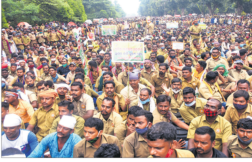
ଓଡ଼ିଶା ଟ୍ରାଇଭର ମହାସଂଘ ପକ୍ଷରୁ ଭୁବନେଶ୍ୱର ପିଏସ୍ମି ଛକରେ ବିକ୍ଷୋଭ କରାଯାଇଛି।

କରୋନା ସଂକ୍ରମଣ ସ୍ଥିତି ଉପରେ ଆଲୋଚନା କରାଯାଇଛି। ଏହା ପାଇଁ ଆମେ କିପରି ସତର୍କ ରହିବା ତାହା ଜଣାଉଛି।