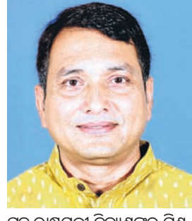
ଗୃହ ରାଷ୍ଟ୍ରମନ୍ତ୍ରୀ ଦିବ୍ୟଶଙ୍କର ମିଶ୍ର