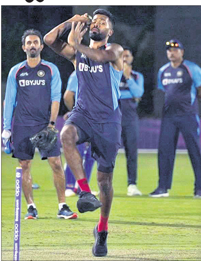
ଚେଣ୍ଟୁ ବୋଲ୍ ସଦୃଶ ବୋଲ୍ କରୁଛନ୍ତି ହାର୍ଡିକ ପାଠ୍ୟ। ଭାରତୀୟ ଦଳ ପାଇଁ ଏକ ବୋଲ୍ ସଦୃଶ ହୋଇଛି। ଚିନ୍ତା ଯୋଡ଼ି ଓ ଚେଣ୍ଟୁ ବୋଲ୍ ଭାରତୀୟ ଦଳ ପାଇଁ ଏକ ବୋଲ୍ ସଦୃଶ ହୋଇଛି।

ଭୁବନେଶ୍ୱର, ୩୦।୧୦: ଚିତ୍ର ୧୨ ପର୍ଯ୍ୟାୟରେ ବିରାଟ କୋହଲିଙ୍କ ନେତୃତ୍ୱାଧୀନ ଭାରତ ଉପକ୍ରମରେ ନ୍ୟୁଜିଲାଣ୍ଡକୁ ଭେଟିବ। ଗ୍ରୁପ୍-୨ରେ ଖେଳାଯିବାକୁ ଥିବା ଏହି ମ୍ୟାଚରେ ଭାରତୀୟ ଦଳ ପାଇଁ ବିଶେଷ ଭାବେ ଚିନ୍ତା କରାଯିବ। ଏହି ମ୍ୟାଚ୍ କ୍ୱାର୍ଟର ଫାଇନାଲ ମ୍ୟାଚ୍ ସଦୃଶ ହୋଇଛି। ଚେଣ୍ଟୁ ବୁଲ୍ ଦଳ ପାଇଁ ଏହି ମ୍ୟାଚ୍ ବିଜୟ ପାଇଁ ଚିନ୍ତା କରାଯାଉଛି। ପାକିସ୍ତାନ ବିପକ୍ଷରେ ପ୍ରଥମ ମ୍ୟାଚରେ ପାକିସ୍ତାନ ଓଭର ହୋଇଥିଲା। ଭାରତ ଗତ ରବିବାର ପାକିସ୍ତାନ ଓଭର ୧୦ ଉଇକେଟରେ ପରାସ୍ତ ହୋଇଥିଲା। ସେହିପରି ନ୍ୟୁଜିଲାଣ୍ଡ ୫ ଉଇକେଟରେ ପାକିସ୍ତାନ ଓଭର ହୋଇଥିଲା। ଭାରତୀୟ ଦଳ ଏହି ପରାସ୍ତ ହେବାକୁ ଶିକ୍ଷାଲାଭ କରିଥିବେ ବୋଲି ଆଶା କରାଯାଉଛି। ପାକିସ୍ତାନ ବିପକ୍ଷରେ ଭାରତ ପାଇଁ ଏକ ବୃକ୍ଷାନ୍ତ ସାଧ୍ୟତା ହୋଇଛି। ଏହାକୁ ଭୁଲି ଭାରତ ନୂଆ ଆରମ୍ଭ କରିବା ଲକ୍ଷ୍ୟରେ ରହିଛି। ଭାରତ ପୁରୁଣା ଟ୍ରୁଟି ସୁଧାରି ପଡିଆକୁ ଓହ୍ଲାଇବ। ନ୍ୟୁଜିଲାଣ୍ଡ ଏକ କ୍ୱାଲିଟି ତଥା ବିଶ୍ୱସ୍ତରୀୟ ଦଳ ହୋଇଥିବାରୁ ଭାରତ କଡ଼ା ପରୀକ୍ଷାରେ ସମ୍ମୁଖୀନ ହେବ। ନ୍ୟୁଜିଲାଣ୍ଡ ପାଇଁ ମଧ୍ୟ ବିଜୟ ଅପରିହାର୍ଯ୍ୟ ହୋଇପାରେ। ଅଭିଜ୍ଞ ନୁତ ବୋଲର ଚିନ୍ତା ଯୋଡ଼ି ଓ ଚେଣ୍ଟୁ ବୋଲ୍ ଭାରତୀୟ ବ୍ୟାଟ୍ସମ୍ୟାନଙ୍କ ପାଇଁ ବ୍ୟାଲେଜ୍ ସୃଷ୍ଟି କରିବେ। ତେବେ ତାରକା ବ୍ୟାଟର ତଥା ଅଧିନାୟକ କେନ୍ଦ୍ର ଫିଲିପ୍ସର ଉପସ୍ଥିତି ଓପନର ମାର୍ଗ ଚୁପ୍ କରୁଛି। ଚିନ୍ତା ଯୋଡ଼ି ଓ ଚେଣ୍ଟୁ ବୋଲ୍ ଭାରତୀୟ ଦଳ ପାଇଁ ଏକ ବୋଲ୍ ସଦୃଶ ହୋଇଛି। ଚିନ୍ତା ଯୋଡ଼ି ଓ ଚେଣ୍ଟୁ ବୋଲ୍ ଭାରତୀୟ ଦଳ ପାଇଁ ଏକ ବୋଲ୍ ସଦୃଶ ହୋଇଛି। ଚିନ୍ତା ଯୋଡ଼ି ଓ ଚେଣ୍ଟୁ ବୋଲ୍ ଭାରତୀୟ ଦଳ ପାଇଁ ଏକ ବୋଲ୍ ସଦୃଶ ହୋଇଛି।