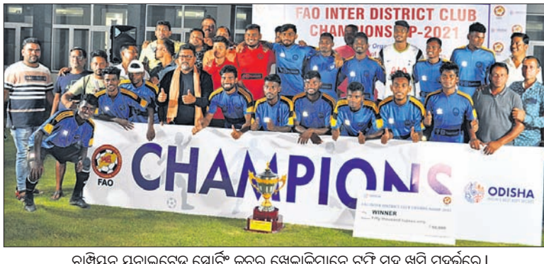
ଚାମ୍ପିୟନ ୟୁନାଇଟେଡ୍ ସ୍ପୋର୍ଟିଂ କ୍ଲବ୍ ଖେଳାଳିମାନେ ଗ୍ରୀଟି ସହ ଖୁସି ମୁହଁରେ।