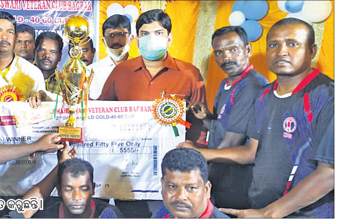
ଚାମ୍ପିୟନ ସିଂହପାଲି ଦଳକୁ ଅଭିନନ୍ଦନାରେ ପୁରସ୍କୃତ କରୁଛନ୍ତି।