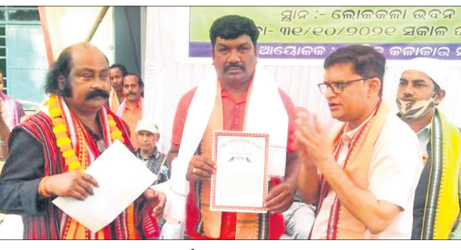
ମୁଖ୍ୟଅତିଥି ଜଣେ କଳାକାରଙ୍କୁ ସମର୍ଥନ କରୁଛନ୍ତି।

ମୁଖ୍ୟଅତିଥି ଜଣେ କଳାକାରଙ୍କୁ ସମର୍ଥନ କରୁଛନ୍ତି। କଳାକାରଙ୍କୁ ସମର୍ଥନ କରାଯାଇଥିଲା।