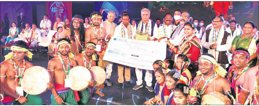
ଉପସାହାୟକ ମୁଖ୍ୟମନ୍ତ୍ରୀ ଉପେଶ୍ୱରୀ ସିଂହପାଲଙ୍କୁ ଉପସାହାୟକ ସଂକଳନ ପତ୍ରର ଛାପ ନୂତନ ଦ୍ୱିତୀୟ ଶ୍ରେଣୀ ପୁରସ୍କାର ପ୍ରଦାନ କରାଯାଇଛି।