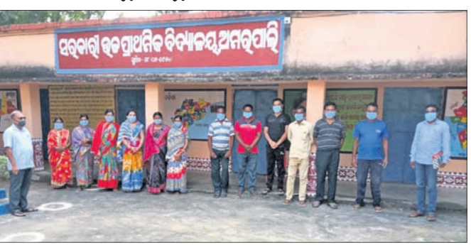
ଅମରପାଲି ଯୁପି ସ୍କୁଲ ନୂତନ ପରିଚାଳନା କମିଟି ସଦସ୍ୟମାନେ।