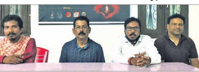
ସୁବର୍ଣ୍ଣପୁରର ସାହିତ୍ୟ, କଳା ଓ ସଂସ୍କୃତିକ ଅନୁଷ୍ଠାନର କର୍ମକର୍ତ୍ତା ସୂଚନା ଦେଉଛନ୍ତି।