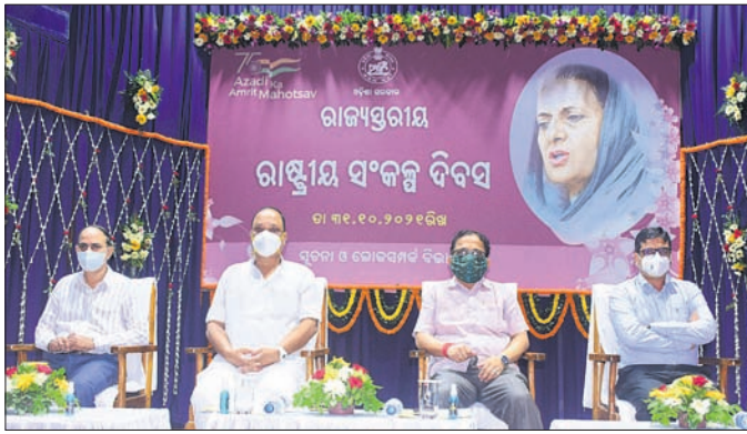
ରାଷ୍ଟ୍ରୀୟ ସଂକଳ୍ପ ଦିବସ ପାଳନ ଅବସରରେ ଉପସ୍ଥିତ ଅତିଥିମାନେ ।