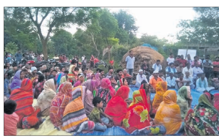
ଜଳପ୍ରକଳ୍ପକୁ ବିରୋଧ କରି ଏକାଠି ହୋଇଥିବା ଗ୍ରାମବାସୀ।

ବାଲେଶ୍ଵର ଜିଲ୍ଲା ଭୋଗରାଇ ବ୍ଲକ୍ ଅଧୀନ ଦେଉଳା (ଅଭୟନଗର) ଗ୍ରାମରେ ପ୍ରସ୍ତାବିତ ୨୧୨ କୋଟି ଟଙ୍କାର ଦ୍ଵିତୀୟ ମେଘା ପାନୀୟ ଜଳପ୍ରକଳ୍ପ ସ୍ଥାନାନ୍ତର ଦାବିରେ ଆନ୍ଦୋଳନ ଚଳିଛି। ଏଥିପାଇଁ ଶନିବାର ସନ୍ଧ୍ୟାରେ ଉଦ୍ଘାଟନ ହେବାକୁ ଥିବା ଗ୍ରାମବାସୀ ପ୍ରକଳ୍ପ ସ୍ଥାନରେ ମେଳି ହୋଇ ପ୍ରଶାସନ ବିରୋଧରେ ରଣରୁଦ୍ଧା ଦେଇଥିଲେ। ଏହା ଆନ୍ଦୋଳନରେ କଂଗ୍ରେସ ଦଳ ସାମିଲ ହୋଇଥିଲା। ରବିବାର ଗ୍ରାମରେ ଘନଘନ ବୈଠକ କରାଯାଇଥିବାବୁଦ୍ଧି ଉଦ୍ଘୋଷନାକୁ ପରିଚ୍ଛେଦିତ କରି ଦିଆଯାଇଛି।