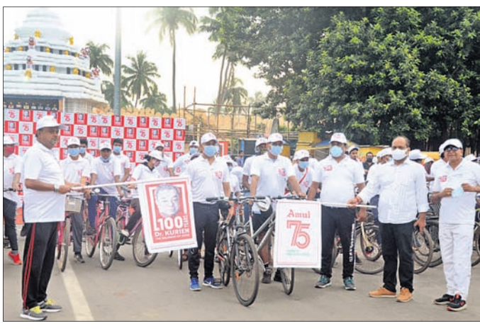
ପୁରୀ ଉପଜିଲାପାଳ ଭବନର ସାହୁ ପତାକା ଦେଖାଇ ଶୋଭାଯାତ୍ରାର ଶୁଭାରମ୍ଭ କରୁଛନ୍ତି।

ପାଣିରେ ଯୋଗି ହୋଇଥିବା ଧାତବ କଣିକାର ସାମ୍ରାଜ୍ୟ ହେଉଛି ଚିତ୍ତିଏସ୍। ସାଧାରଣତଃ ଜଳରେ କ୍ୟାଲସିୟମ, ମ୍ୟାଗ୍ନେସିୟମ, କ୍ଲୋରାଇଡ୍, ସଲ୍ଫେଟ୍, ବାଇକାର୍ବୋନେଟ୍ ଆଦି ପଦାର୍ଥ ସୂକ୍ଷ୍ମ ରୂପରେ ରହିଥାଏ। ଏହାକୁ ବାଦ୍ ଦେଲେ ଅନ୍ୟ ପଦାର୍ଥ ମଧ୍ୟ ବ୍ରୁବାଭୂତ ଆକାରରେ ଥାଏ। ଚିତ୍ତିଏସ୍ ପରିମାଣରୁ ପାଣିର ମାତ୍ରା କଣାପଡ଼ିଥାଏ। ଅଧିକ ଚିତ୍ତିଏସ୍ ପାଣିର ସ୍ୱାଦକୁ ସ୍ୱାଦହୀନ କରୁଥିବାବେଳେ ଏହା ସ୍ୱାସ୍ଥ୍ୟ ପାଇଁ କ୍ଷତିକାରକ।