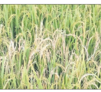
ଅଗାଡ଼ି ହୋଇ ଯାଇଥିବା ଧାନ କେଣ୍ଡା।

ଚଳିତବର୍ଷ ଧାନ କେଣ୍ଡା ଗର୍ଭରୁ ବାହାରିବା ସମୟରେ ଲଗାତାର ଲଘୁତାପ ଜନିତ ବର୍ଷା ହୋଇଥିଲା। ପଶୁପକ୍ଷର ଉଦ୍‌ବୃତ୍ତ ବର୍ଷାପାଣିରେ କଳେଶ୍ଵର ବ୍ଲକ୍ ଅଞ୍ଚଳର ବ୍ୟାପକ ଧାନଜମି ବୁଡ଼ି ରହିଥିଲା। ଏବେ କେଣ୍ଡାରୁ ଧାନ ବାହାରିବା ପରେ ୫୦ ପ୍ରତିଶତ ଅଗାଡ଼ି ହୋଇଥିବା ଦେଖିବାକୁ ମିଳିଛି। ଏନେଇ ଚାଷୀ ମୁଖରେ ହାତଦେଇ ସଞ୍ଜିତ। ସମଗ୍ର ଉତ୍ତର ବାଲେଶ୍ଵରରେ ଚଳିତବର୍ଷ ସର୍ବାଧିକ ଧାନଚାଷ କଳେଶ୍ଵର ବ୍ଲକ୍ରେ ହୋଇଥିବା କୃଷି ବିଭାଗ ତଥ୍ୟରୁ ଜଣାପଡ଼ିଛି। ମୋଟ ୨୦୨୦ ହଜାର ହେକ୍ଟର ଜମିରେ ଧାନଚାଷ ହୋଇଥିବା ବେଳେ ବିଭିନ୍ନ ଚଳିଆ ଅଞ୍ଚଳରେ ଧାନଚାଷ ପଟି ନଷ୍ଟ ହୋଇଛି। ଏହା ବ୍ୟତିତ ଅକ୍ଟୋବର ୭ ଓ ୧୮ ତାରିଖରେ ପ୍ରବଳ ବର୍ଷା ହୋଇଥିଲା। ଏପରିକି ଗୋଟିଏ ଗୋଟିଏ ଦିନରେ ୨୧୨ ମି.ମି. ବର୍ଷା ରେକର୍ଡ କରାଯାଇଥିଲା। ପଶୁପକ୍ଷର ଉଦ୍‌ବୃତ୍ତ ବର୍ଷାପାଣି ଓ କଳେଶ୍ଵର ଅଞ୍ଚଳରେ ଲଗାଣ ବର୍ଷାଯୋଗୁଁ ବିଭିନ୍ନ ସ୍ଥାନରେ ଧାନଚାଷ ପାଣିରେ ବୁଡ଼ିରହିଥିଲା। ସେହି ସମୟରେ ବାହାରିଥିବା ଧାନକେଣ୍ଡାରେ ପାଣି ପଶି