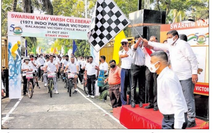
ଅତିଥିମାନେ ପତାକା ହଲାଇ ମାରାଥନ ଦୌଡ଼ର ଶୁଭାରମ୍ଭ କରୁଛନ୍ତି।

୧୯୭୧ରେ ପାଳିଯାଇଥିବା ସହ ଯୁଦ୍ଧରେ ଭାରତର ଅକ୍ତୋବର ବିଜୟକୁ ସ୍ମରଣାର୍ଥକ ଭାବେ ପାଇଁ ଚଳିତ ବର୍ଷ ସମଗ୍ର ଦେଶରେ ପାଳନ ହେଉଛି ସ୍ଵର୍ଣ୍ଣ ବିଜୟ ବର୍ଷ। ଏହି ଯୁଦ୍ଧରେ ସାମିଲ ରାଜ୍ୟର ବୀର ଯବାନମାନଙ୍କୁ କେନ୍ଦ୍ର ଓ ରାଜ୍ୟ ସରକାରଙ୍କ ପକ୍ଷରୁ ସମ୍ମାନିତ କରିବା ପାଇଁ ନିଷ୍ପତ୍ତି ନିଆଯାଇଛି। ସ୍ଵର୍ଣ୍ଣ ବିଜୟ ବର୍ଷ ପାଳନ ଅବସରରେ ଏକ ବିଜୟ ମଣ୍ଡଳ ଶୋଭାଯାତ୍ରା ଦେଶର ବିଭିନ୍ନ ରାଜ୍ୟ ପରିଭ୍ରମଣ କରି ଆସନ୍ତା ୬ ତାରିଖରେ