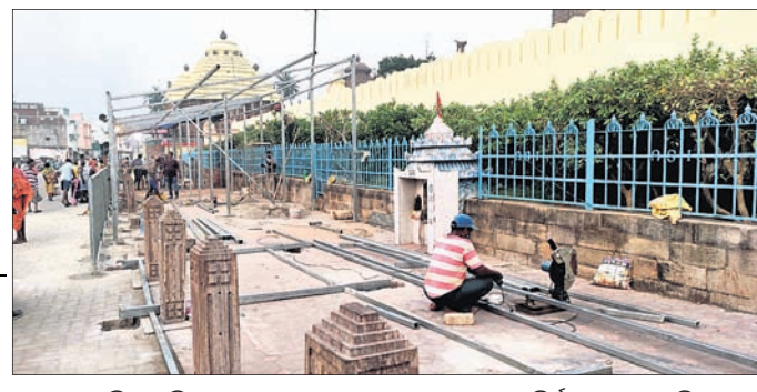
ଶ୍ରାମନିର ପଶ୍ଚିମବଙ୍ଗର ସମ୍ପୂର୍ଣ୍ଣ ପ୍ରଶାସନ ପକ୍ଷରୁ ଶେଡ଼ ନିର୍ମାଣ କରାଯାଇଛି।

ପୁରୀ ଅଧିକ୍ଷ, ୩୧।୧୦ ନୂତନ ଏଓପିଆନୁଯାୟୀ ସୋମବାର ଠାରୁ ପୁରୀ ସହରବାସୀ ଶ୍ରାମନିର ପଶ୍ଚିମ ଦ୍ୱାର ଦେଇ ପ୍ରବେଶ କରି ମହାପ୍ରଭୁଙ୍କୁ ଦର୍ଶନ କରିପାରିବେ। ଏଥିପାଇଁ କୋଭିଡ୍ କଟକଣା ପାଳନ ସହ ଆବଶ୍ୟକ ପରିଚୟପତ୍ର ଓ କୋଭିଡ୍ ନେଗେଟିଭ୍ ରିପୋର୍ଟ କିମ୍ବା ବୁକିଂ ଟିକା ନେଇଥିବାର ପ୍ରମାଣପତ୍ର ଦେଖାଇବାକୁ ପଡ଼ିବ। ସୂଚନାଯୋଗ୍ୟ, ପୂର୍ବରୁ ପୁରୀ ସହରବାସୀ କେବଳ ସିଂହଦ୍ୱାର ଦେଇ ଦର୍ଶନ ସୁଯୋଗ ପାଇଥିଲେ। ଏ ନେଇ ଜିଲା ପ୍ରଶାସନ ପକ୍ଷରୁ ପଶ୍ଚିମଦ୍ୱାର ନିକଟରେ ସ୍ୱତନ୍ତ୍ର ବ୍ୟବସ୍ଥା କରାଯାଇଛି। ମେଟାଲ ଡିଟେକ୍ଟର ସମେତ ସାମାଜିକଜନ ଓ ଥର୍ମାଲ ଡିଟେକ୍ଟର ବ୍ୟବସ୍ଥା ହୋଇଛି। ଏହାଦ୍ୱାରା ପୁରୀ ସହରର ଅଧିକାଂଶ ଲୋକ ସରକ ଦର୍ଶନ ବ୍ୟବସ୍ଥାର ସୁଯୋଗ ପାଇବେ ବୋଲି ଜିଲାପାଳ ସମର୍ଥ ବର୍ଣ୍ଣା କହିଛନ୍ତି। ନିତିନିଆ ଦର୍ଶନ କରୁଥିବା