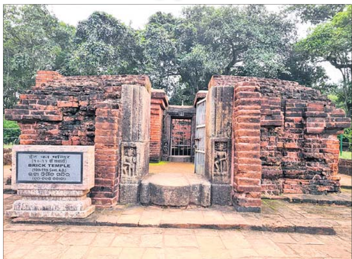
ଶ୍ରୀପଦ୍ମକେଶର ମନ୍ଦିର ବେଢାରେ ଥିବା ଜଗାରେ ନିର୍ମିତ ପ୍ରାଚୀନ ଶ୍ରୀନାରାୟଣ ମନ୍ଦିର।

ପୂର୍ବ ଆଲୋଚନାକୁ କାଟିଲେ ଶାମ୍ବକର ପ୍ରାୟଶ୍ଚିତ ପାଇଁ ସେ ଯେଉଁ ଚପସା କରିଥିଲେ ମୈତ୍ରୋତ୍ତରବନରେ (କୋଣାର୍କ) ତାହାର ସ୍ମାରକୀ ଦିବସ ହେଉଛି ଶାମ୍ବ ଦଶମୀ। ମନେହୁଏ ଏହି ସ୍ମାରକୀ ଦିବସ ଶାମ୍ବକ ଚପସାର ଦିବସ। ମୈତ୍ରୋତ୍ତରବନରେ ଏହା ହୋଇ ନ ଥିଲେ ଓଡ଼ିଶାର ଜନମାନସରେ ଏତେ ଗଭୀର ପ୍ରଭାବ ପକାଇ ନ ଥାନ୍ତା। ସେହି ଅର୍ଥୁର ଘଟଣାକୁ ସ୍ମରଣ ରଖିବା ପାଇଁ ନିଜର ପୁଣ୍ୟପର୍ବ ପରମ୍ପରାରେ ଓଡ଼ିଆ ଲୋକେ ଏକ ସ୍ୱତନ୍ତ୍ର ପର୍ବ ପାଳନ କରୁ ନ ଥାନ୍ତେ! କୋଣାର୍କରେ ଶ୍ରୀମହାଭାସ୍କରଙ୍କ ଉପାସନା ପ୍ରତିଷ୍ଠିତ ହେବା ପରେ ଶାମ୍ବ ଦଶମୀ ଏକ ପୁଣ୍ୟପର୍ବ ଭାବରେ ପାଳିତ ହେଲା। ଏହାକୁ ଏକ 'ଉତ୍ସବ' ବୋଲି ଗ୍ରହଣ କରାଯାଇଥିଲା। ଏହି ଉତ୍ସବ 'ଅର୍ଦ୍ଧଶତ' ଡଲେ ଆରମ୍ଭ ହେବାର ପରମ୍ପରା ପ୍ରତିଷ୍ଠିତ ହୋଇଥିଲା। ତେବେ ସମ୍ଭବତଃ ହୁଏ ଶାମ୍ବ କ'ଣ ସେଇ ଅର୍ଦ୍ଧଶତ ଡଲେ ସିଦ୍ଧି ଲାଭ କରିଥିଲେ! ପଦ୍ମତୋଳା ଗଣେଶେ ଶ୍ରୀପଦ୍ମକେଶର ମନ୍ଦିର ନିର୍ମାଣ ହୋଇଥିଲା ଆମେ ଜାଣୁ। ତେବେ ସେଇ ଗଣ ଦାହରେ ଅର୍ଦ୍ଧଶତ ଥିଲା କି? ଫଳରେ ମନ୍ଦିର ଏକାନ୍ତ ହୋଇ ରହିଥିବାରୁ ଅନେକ ଉତ୍ସବ ବ୍ୟବସ୍ଥାର ହେବା ପରେ ସମର୍ପଣ ପାଇଁ ହେଉଥିଲା। ଠିକ୍ ଯେପରି ଶ୍ରୀକ୍ଷେତ୍ରରେ