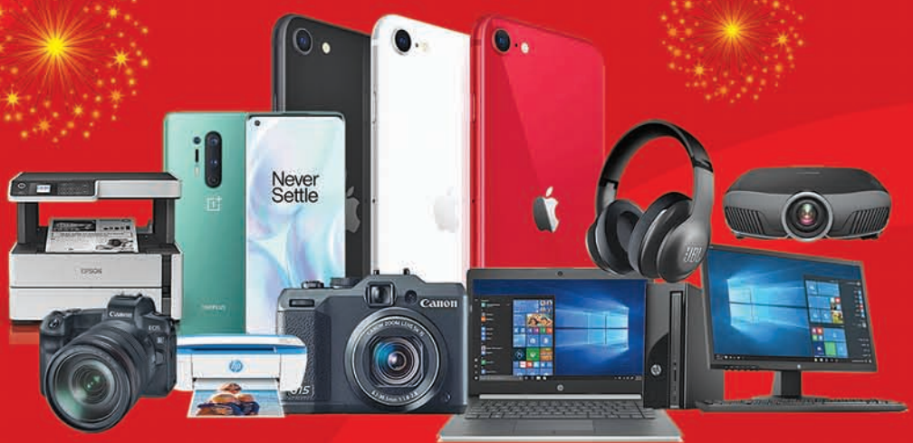
MOBILE PHONE, LAPTOP, DESKTOP, CAMERA, PRINTER, HEAD PHONE, PROJECTOR