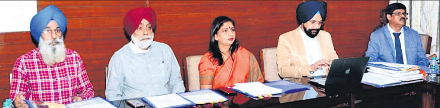
ଅନୁତ୍ପରାଧିତ ରୁଚୁ ନାନକ ବିଶ୍ୱବିଦ୍ୟାଳୟରେ ଅନୁଷ୍ଠିତ ବୈଠକରେ ଉପସ୍ଥିତ କର୍ମଚାରୀମାନେ।