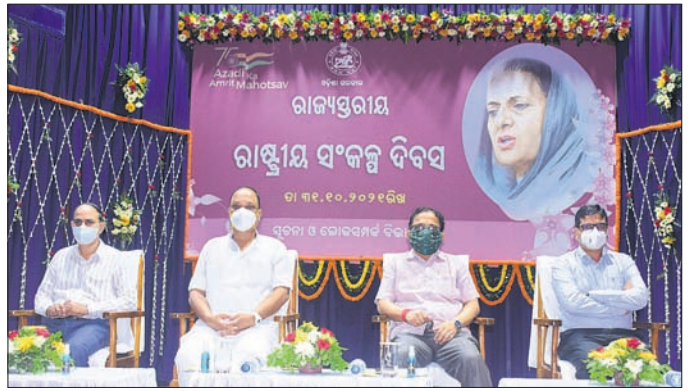
ରାଷ୍ଟ୍ରୀୟ ସଂକଳ୍ପ ଦିବସ ପାଳନ ଅବସରରେ ଉପସ୍ଥିତ ଅତିଥିମାନେ ।