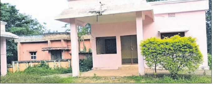
ଆରତି କାର୍ଯ୍ୟାଳୟରେ ସୋମବାର ତାଲା ଝୁଲୁଛି।

ଏକ୍ସିଡିଓ, ଦୁଇଜଣ କନିଷ୍ଠ ଯନ୍ତ୍ରୀ, ଜଣେ କିରାଣି, ଜଣେ ଚତୁର୍ଥ ଶ୍ରେଣୀ କର୍ମଚାରୀ ରହିବାର ବ୍ୟବସ୍ଥା ରହିଛି। ସେମାନଙ୍କ ରହିବାକୁ କାର୍ଯ୍ୟ ମଧ୍ୟ ୪ ବର୍ଷ ବିତିଯାଇଥିଲେ ମଧ୍ୟ ଅଧ୍ୟାପକ ଫଳକ ଲଗାଯାଇନାହିଁ। ଫଳରେ ନୂଆଗାଁ ବୁକ୍ରେ ଆରତି କାର୍ଯ୍ୟାଳୟ ଥିବା ବିଷୟରେ ଅନେକ ଜାଣି ପାରୁ ନାହାନ୍ତି। ସେହି କାର୍ଯ୍ୟାଳୟରେ ଜଣେ