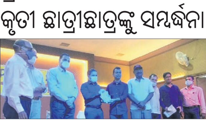
କୃତୀ ଛାତ୍ରୀଙ୍କୁ ଅତିଥିକ ସ୍ୱାଗତ ସମର୍ଥନ।