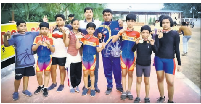
କୋଚଙ୍କ ଗହଣରେ ସଫଳତା ହାସଲ କରିଥିବା ଝେଟର।

ଝେଟି ଆସୋସିଏସନ ଓଡ଼ିଶା ଆନୁଷ୍ଠାନିକରେ ଅକ୍ଟୋବର ୨୯ରୁ ୩୧ ପର୍ଯ୍ୟନ୍ତ ବଲାଙ୍ଗୀର ଜିଲ୍ଲା କଞ୍ଚାବାଣିର ଏକ ଘରୋଇ ବିଦ୍ୟାଳୟରେ ବୃତ୍ତୀୟ ରାଜ୍ୟ ରୋଲର ଝେଟି ଚମ୍ପିୟନସିପ୍ ଓ ଅଷ୍ଟମ ରାଜ୍ୟସ୍ତରୀୟ (୨୦୨୧-୨୨) ଚୟନ ଶିବିର ଅନୁଷ୍ଠିତ ହୋଇଥିଲା।