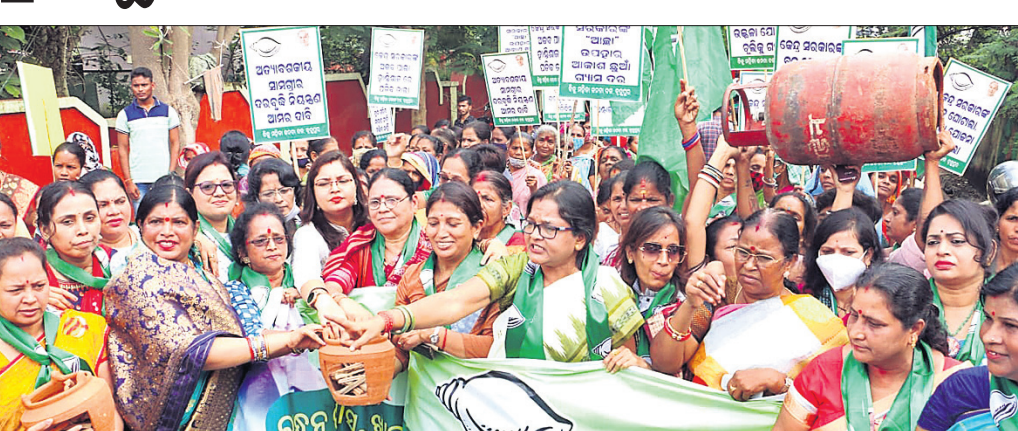
ମହିଳା ବିଜେଡିର ଶୋଭାଯାତ୍ରା ଓ ବିରୋଧ।