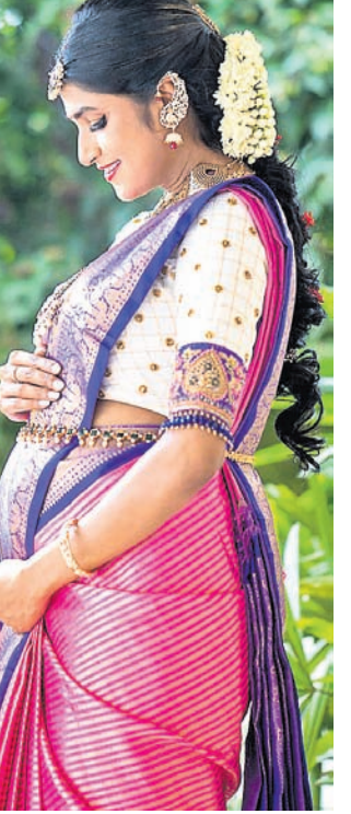
ସଚେତନ ହୋଇ ପ୍ରାକୃତିକ ଉପାୟରେ ଶରୀରରେ ରୋଗ ପ୍ରତିରୋଧକ ଶକ୍ତି ବୃଦ୍ଧି କରିବା ପାଇଁ ତେଣୁ କରିବା ଉଚିତ। -ରାଜବେଦ୍ୟ, ସାଲଲୋ ରୋଗିନ୍ଦ୍ରପୁର କଟକ, ମୋ: ୯୪୩୭୦୩୭୨୭୫