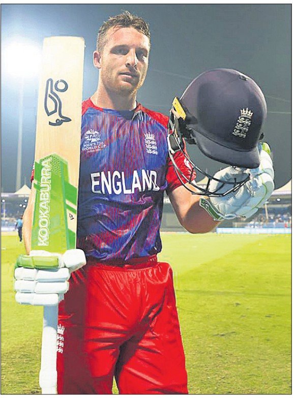
ଇଂଲଣ୍ଡର ଅଧିନାୟକ ବଟଲରଙ୍କ ଶତକ ମାରି କ୍ୟାପ୍‌ଟେନ ପ୍ରଥମ ଚିଠି ଶତକ ହାସଲ କରିଥିବା ଖେଳାଳୀ ବଟଲର।

ଶାରକା, ୧୧୧୧ ୧୨୦ ବିଶ୍ୱକପ୍ ପ୍ରଥମ ୧୨ ପର୍ଯ୍ୟାୟ ପ୍ରଥମ-୧ର ଏକ ମ୍ୟାଚରେ ଇଂଲଣ୍ଡ ଓ ଓଡ଼ିଶା ମଧ୍ୟରେ ଖେଳିଥିଲା। ଗୁଜରାଟ ଶତକ ଖେଳିଥିଲା। ଯୋଗ୍ୟ ଖେଳାଳୀମାନଙ୍କୁ ଏହି ମ୍ୟାଚରେ ଚୟନ କରାଯାଇଥିଲା। ଓପନର ଖେଳାଳୀ ବଟଲରଙ୍କ ଅପରାଜିତ ଶତକ ସହାୟତାରେ ଇଂଲଣ୍ଡ ପ୍ରଥମେ ବ୍ୟାଟିଂ କରି ନିର୍ଦ୍ଧାରିତ ୨୦ ଓଭରରେ ୪ ରନ କେବଳ ହରାଇ ୧୨୩ ରନ ସଂଗ୍ରହ କରିଥିଲା। ଚ୍ୟୁରାହି ବ୍ୟାଟିଂ ପାଇଁ ଆମନ୍ତ୍ରଣ ପାଇଥିବା ଇଂଲଣ୍ଡ ୩୫ ରନରେ ୩ ଓଭରରେ ହରାଇ ପ୍ରାରମ୍ଭିକ ବ୍ୟାଟିଂ ବିପର୍ଯ୍ୟୟର ଶିକାର ହୋଇଥିଲା। ଛାୟା ରଏ ୯, ବାଫିନ ମିଲନ ୬ ରନକରି ଓ ଜନ ବେୟାରଣ୍ଡେ ଖାତା ଖୋଲିବା ପୂର୍ବରୁ ପ୍ୟାଟିଲିୟନ ଫେରିଥିଲେ। ତେବେ ଚତୁର୍ଥ ଓଭରରେ ଅଧିନାୟକ ଇଆନ ମୋଗାନ ଓ ବଟଲର ୬୮ ବଲ୍‌ରେ ୧୧୨ ରନକରି ଛୁଟି ସମ୍ପାଦନା ସହ ବଲ୍‌କୁ ଚ୍ୟାଲେଞ୍ଜିଂ ଷ୍ଟୋର ପ୍ରଦାନ କରିଥିଲେ। ୩୬ ବଲ୍‌ରେ ୧ ଚୋକା ଓ ୩ ଛକା ସହ ୪୦ ରନ ସଂଗ୍ରହ କରି ଆଉଟ ହୋଇଥିଲେ। ବଟଲର ୬୬ଟି ବଲ୍‌ରେ ସମ୍ପୂର୍ଣ୍ଣ ସହାୟତା ହୋଇ