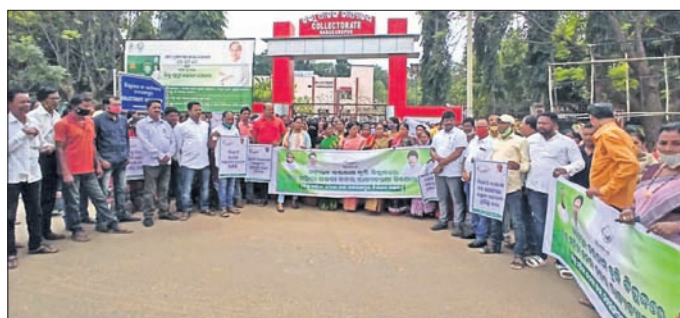
ନବରଙ୍ଗପୁରରେ ହୋଇଥିବା ବିଶୋଭ କାର୍ଯ୍ୟକ୍ରମରେ ବିଜେଡି କର୍ମୀମାନେ।