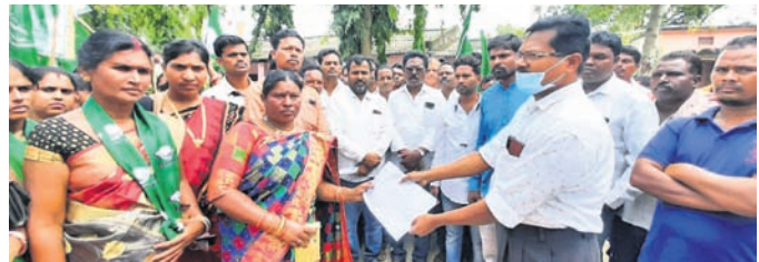
ଏକିଟି ଦାବିପତ୍ର ଗ୍ରହଣ କରୁଛନ୍ତି।