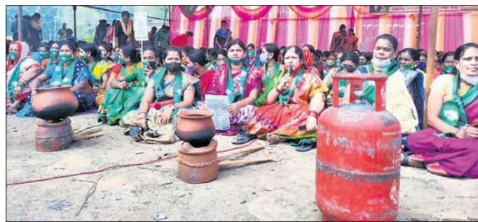
ରାୟଗଡ଼ା ମହିଳା ବିଜେଡିର ପ୍ରତିବାଦ।