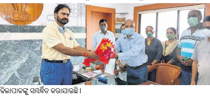
ଜିଲ୍ଲାପାଳଙ୍କୁ ସମ୍ବର୍ଦ୍ଧିତ କରାଯାଇଛି।