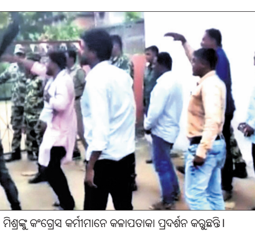
ମନ୍ତ୍ରୀ ଦିବ୍ୟଶଙ୍କର ମିଶ୍ରଙ୍କୁ କଂଗ୍ରେସ କର୍ମୀମାନେ କଳାପତାକା ପ୍ରଦର୍ଶନ କରୁଛନ୍ତି।