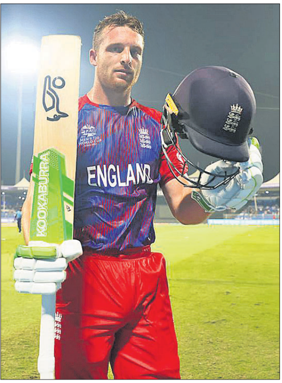
ଇନିଂସର ଅଧିନ ବଲ୍‌ରେ ଛକା ମାରି ବ୍ୟାଟିଂରେ ପ୍ରଥମ ଚିଠି ଶତକ ହାସଲ କରିଥିବା ଜୋସ୍ ବଟଲର।

ଶାରଳା, ୧୧୧୧ ୧୨୦ ବିଶ୍ଵକପ୍ ପ୍ରଥମ ୧୨ ପର୍ଯ୍ୟାୟ ଗ୍ରୁପ୍-୧ର ଏକ ମ୍ୟାଚ୍‌ରେ ଇଂଲଣ୍ଡ ଓ ଓଡ଼ିଶା ପରସ୍ପରକୁ ଭେଟିଛନ୍ତି। ଗ୍ଲାନାୟ ଶାରଳା କ୍ରକେଟ୍ କ୍ଲବ୍‌ରେ ଯୋଗଦାନ ହେବା ପରେ ଇଂଲଣ୍ଡ ପକ୍ଷରୁ ଓଡ଼ିଶାକୁ ଚ୍ୟାଲେଞ୍ଜିଂ କରିବାକୁ ନିଷ୍ପତ୍ତି ନେଇଥିଲା। ଓପନର ଲୋକ ଚଟଲରଙ୍କ ଅପରାଜିତ ଶତକ ସହାୟତାରେ ଇଂଲଣ୍ଡ ପ୍ରଥମେ ୩୮୦ କରି ନିର୍ଦ୍ଧାରିତ ୨୦ ଓଭରରେ ୪ ଉଇକେଟ୍ ହରାଇ ୧୨୩ ରନ ସଂଗ୍ରହ କରିଥିଲା। ଚ୍ୟାଲେଞ୍ଜିଂ ପାଇଁ ଆମନ୍ତ୍ରଣ ପାଇଥିବା ଇଂଲଣ୍ଡ ୩୫ ରନରେ ୩ ଉଇକେଟ୍ ହରାଇ ପ୍ରାରମ୍ଭିକ ବ୍ୟାଟିଂ ବିପର୍ଯ୍ୟୟର ଶିକାର ହୋଇଥିଲା। ଛାୟନ ରଏ ୯, ବାଫ୍ରି ମିଲନ ୬ ରନକରି ଓ ଜନି ବେୟାରଣ୍ଡେ ଖାତା ଖୋଲିବା ପୂର୍ବରୁ ପ୍ୟାଟିଲିୟନ ଫେରିଥିଲେ। ତେବେ ଚତୁର୍ଥ ଉଇକେଟ୍‌ରେ ଅଧିନାୟକ ଇଅନ ମୋଗାନ ଓ ବଟଲର ୬୮ ବଲ୍‌କୁ ୧୧୨ ରନକରି ଛୁଟି ସମ୍ବଳିବା ସହ ବଲ୍‌କୁ ଚ୍ୟାଲେଞ୍ଜିଂ ଷ୍ଟୋର ପ୍ରଦାନ କରିଥିଲେ। ୩୬ ବଲ୍‌କୁ ୧ ଚୋକା ଓ ୩ ଛକା ସହ ୪୦ ରନ ସଂଗ୍ରହ କରି ଆଉଟ ହୋଇଥିଲେ। ବଟଲର ୬୬ଟି ବଲ୍‌ର ସମ୍ପୂର୍ଣ୍ଣ ସହାୟତା ହୋଇ