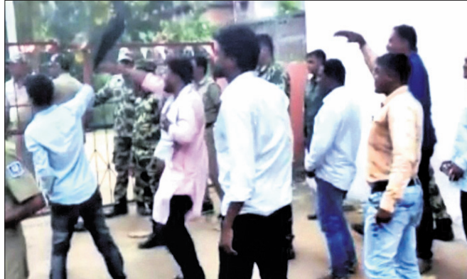
ମନ୍ତ୍ରୀ ଦିବ୍ୟଶଙ୍କର ମିଶ୍ରଙ୍କୁ କଂଗ୍ରେସ କର୍ମୀମାନେ କଳାପତାକା ପ୍ରଦର୍ଶନ କରୁଛନ୍ତି।