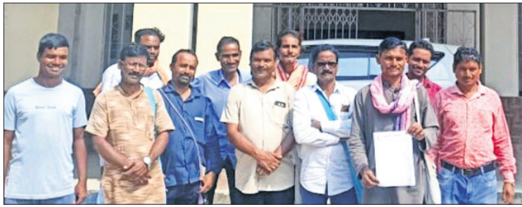
ଜିଲ୍ଲାପାଳଙ୍କୁ ଫେରାଦ ହୋଇଥିବା ଚାଷୀମାନେ ।