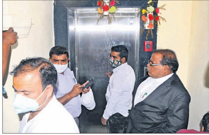
ଲିଫ୍ଟରେ ଫସିଥିବା ଆଇନଜୀବୀମାନଙ୍କୁ ଉଦ୍ଧାର କରାଯାଇଥିବା ଦୃଶ୍ୟ।

ପୁରୀ ଜିଲ୍ଲାପାଳଙ୍କ କାର୍ଯ୍ୟାଳୟ ପରିସର ଲିଫ୍ଟରେ ବୁଧବାର ୮ ଜଣ ଆଇନଜୀବୀ ପ୍ରାୟ ୨୦ ମିନିଟ୍ ଫସିରହିଥିଲେ। ଏହି ସମୟରେ ସେମାନେ ଅନ୍ତରାଳରେ ଥିବା ଅନୁଭବ କରିଥିଲେ। ଏ ନେଇ ଜଣାପଡ଼ିବା ପରେ ଲିଫ୍ଟ ଚାଳକ ଖୋଲାଯାଇ ସେମାନଙ୍କୁ ଉଦ୍ଧାର କରାଯାଇଥିଲା।