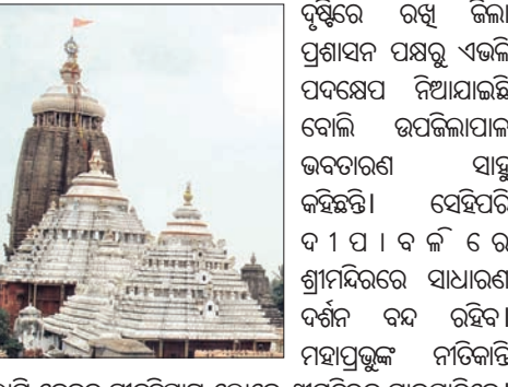
ଲାଗି କେବଳ ସାବୁତପ୍ରାୟ ଲୋକେ ଶ୍ରୀମନ୍ଦିରକୁ ଯାଇପାରିବେ।

ଶ୍ରୀମନ୍ଦିର ସିଂହଦ୍ୱାର ସମ୍ମୁଖରେ ଗୁରୁବାର ଦିନ ଚାରିପାଖେ ୧୪୪ ଧାରା ଲାଗି ଦିଆଯାଇଛି। ଏହା ପୂର୍ବରୁ ଶ୍ରୀମନ୍ଦିର ଓ ଚତୁର୍ଦ୍ଧାପାର୍ଶ୍ୱରେ ଜଳସମାଗମ ନ ହେବା ପାଇଁ ୧୪୪ ଧାରା ଲାଗି କରାଯାଇଥିଲା। ଗୁରୁବାର ଭୋର ୪ଟାରେ ପରବର୍ତ୍ତୀ ମଧ୍ୟର୍ହଣ ରାତ୍ର ପର୍ଯ୍ୟନ୍ତ ଏହି କଟକଣା ବଳବତ୍ତର ରହିବ।