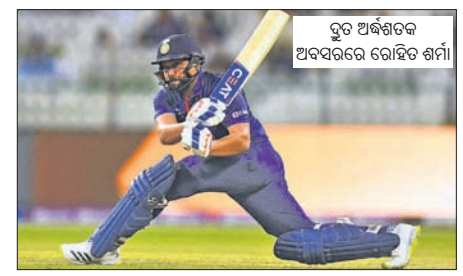
ଦୁଇ ଅର୍ଦ୍ଧଶତକ ଅବସରରେ ରୋହିତ ଶର୍ମା

ଆରୁଧୀ, ୩।୧୧ ଟି୨୦ ବିଶ୍ୱକପର ରୁଧିରୀ ଅନୁଷ୍ଠିତ ଏକ ଗୁରୁତ୍ୱପୂର୍ଣ୍ଣ ମ୍ୟାଚରେ ଭାରତ ୬୬ ରନରେ ଆଫଗାନିସ୍ତାନକୁ ହରାଇ ଦେଇଛି। ବିରାଟ କୋହଲିଙ୍କ ଦଳ ୨୦ ଓଭରରେ ୨ ଉଇକେଟ ହରାଇ ୨୧୦ ରନ କରିଥିଲା। ଆଫଗାନିସ୍ତାନ ୨୦ ଓଭରରେ ୧୪୪ ରନ କରିବାକୁ ସକ୍ଷମ ହୋଇଥିଲା। ଚଳିତ ବିଶ୍ୱକପରେ କ୍ରମାଗତ ୨ ପରାଜୟ ପରେ ଭାରତ ପ୍ରଥମ ବିଜୟ ସହ ପଏଣ୍ଟ ଖାତା ଖୋଲିଛି। ଅନ୍ୟପକ୍ଷରେ ୪ ମ୍ୟାଚରୁ ଆଫଗାନିସ୍ତାନର ଏହା ଦ୍ୱିତୀୟ ପରାଜୟ। ଚନ୍ଦ୍ର ହାରି ପ୍ରଥମେ ବ୍ୟାଟିଂ ଆମନ୍ତ୍ରଣ ପାଇଥିବା ଭାରତ ପକ୍ଷରୁ କୋହଲିଙ୍କ ରାହୁଲ ଓ ରୋହିତ ଶର୍ମା ଓପିଂ ଭାଗୀଦାରିରେ ୮୮ ବଲ୍ଲୁ ୧୪୦ ରନ ଯୋଗକରିଥିଲେ।