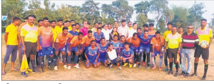
ଅତିଥିକ ରହଣରେ ଖେଳାଳିଙ୍କୁ ।