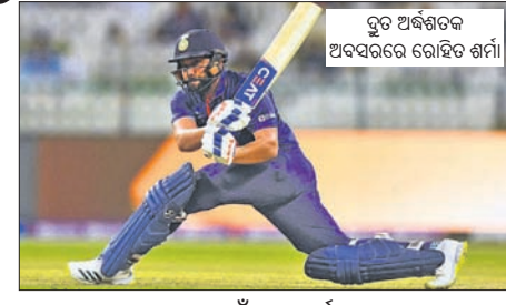
ବୃତ୍ତ ଅର୍ଦ୍ଧଶତକ ଅବସରରେ ରୋହିତ ଶର୍ମା

ଆସୁଥିବ, ୩।୧୧ ଲୋକେଶ ରାହୁଲ ଓ ରୋହିତ ଶର୍ମାଙ୍କ ଶତକାନ୍ତ ଓପନିଂ ଭାଗ୍ୟାଦି ପରେ ରିଷଭ ପଟ୍ଟ ଓ ହାର୍ଦ୍ଦିକ ପାଣ୍ଡ୍ୟାଙ୍କ ବିଶ୍ୱାସର ବ୍ୟାପ୍ତି ସହାୟତାରେ ଭାରତ ରୁଧିରୀ ଅନୁଷ୍ଠିତ ଆଫଗାନିସ୍ତାନ ବିପକ୍ଷ ଟି୨୦ ବିଶ୍ୱକପ ମ୍ୟାଚରେ ବୃହତ୍ ଷ୍ଟୋର କରିଛି। ବିରାଟ କୋହଲିଙ୍କ ନେତୃତ୍ୱାଧୀନ ଦଳ ୨୦ ଓଭରରେ ୨ ରନକେଟ ହରାଇ ୨୧୦ ରନ ସଂଗ୍ରହ କରିଛି। ଭାରତ ପ୍ରଥମ ୨ଟି ମ୍ୟାଚରେ ପାକିସ୍ତାନ ଓ ନ୍ୟୁଜିଲାଣ୍ଡଠାରୁ ହାରି ଯାଇଥିବା ବେଳେ ଏହି ମ୍ୟାଚରେ ବଡ଼ ବ୍ୟବଧାନରେ ବିଜୟ ଆବଶ୍ୟକ କରୁଛି। ଚତୁର୍ଥ ପ୍ରଥମେ ବ୍ୟାଟିଂ ଆମକୁଣ୍ଡ ପାଇଥିବା ଭାରତ ପକ୍ଷରୁ ଲୋକେଶ ରାହୁଲ ଓ ରୋହିତ ଶର୍ମା ଓପନିଂ ଭାଗ୍ୟାଦିରେ ୮୮ ବଲ୍ରେ ୧୪୦ ରନ ଯୋଗକରିଥିଲେ।