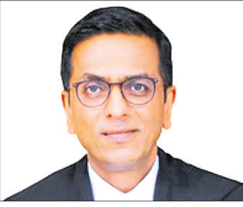
ଡି.ଓ.ଇ. ଚନ୍ଦ୍ରଚୂଡ଼ ନୂଆଦିଲ୍ଲୀ, ୩।୧୧

ପରିପ୍ରେକ୍ଷାରେ ଜଣ୍ଡିସ୍ ଚନ୍ଦ୍ରଚୂଡ଼ଙ୍କ ମନ୍ତବ୍ୟ ବିଶେଷ ଗୁରୁତ୍ୱ ବହନ କରୁଛି। ଅଭିଯୁକ୍ତମାନଙ୍କୁ ଅନୁଲୋଚନାରେ ଆଇନଗତ ସହାୟତା ପ୍ରଦାନ ନିମନ୍ତେ ଉର୍ଦ୍ଧ୍ୱାଧିକ କୋର୍ଟ ଏବଂ ଇ-ସେବା କେନ୍ଦ୍ରଗୁଡ଼ିକର ଶୁଭାରମ୍ଭ ଅବସରରେ ଆଲୋଚନା ସମ୍ବନ୍ଧରେ ଆଲୋଚନା ପରେ ଆଲୋଚିତ ଏକ ଅନୁଲୋଚନା କାର୍ଯ୍ୟକ୍ରମକୁ ସମ୍ପାଦିତ କରି ଜଣ୍ଡିସ୍ ଚନ୍ଦ୍ରଚୂଡ଼ କହିଛନ୍ତି, ଜେଲରେ ଜାମିନ ଅର୍ଥର ପହଞ୍ଚାଇବାରେ ବିଳମ୍ବ ନ୍ୟାୟିକ ବ୍ୟବସ୍ଥାରେ ଏକ ଗମ୍ଭୀର ତ୍ରୁଟି। କେବଳ ବିଚାରାଧୀନ କ-ଏଡ଼ା ନୁହେଁ, ଦଣ୍ଡାଦେଶରୁ ଛାଡ଼ି ପାଇଥିବା ଦୋଷୀଙ୍କ କ୍ଷେତ୍ରରେ ମଧ୍ୟ ଏପରି ହେଲେ ତାହା ତାଙ୍କର ମାନବୀୟ ସ୍ୱାଧୀନତା ପ୍ରତି ବିପଦ। ଏହା ପୂର୍ବରୁ ପ୍ରଧାନ ବିଚାରପତି ଏନ୍.ଭି. ରମନାଙ୍କ ଅଧ୍ୟକ୍ଷତାରେ ଗଠିତ ଖଣ୍ଡପୀଠ ମଧ୍ୟ ଜାମିନ ରାୟଗୁଡ଼ିକୁ କାର୍ଯ୍ୟକାରୀ କରାଇବାରେ ବିଳମ୍ବକୁ ନେଇ ଅସତ୍ୟୋଷ ବ୍ୟକ୍ତି କରିଥିଲେ। ଏହାସହ ରାୟ ପହଞ୍ଚାଇବା ଲାଗି ଏକ ସୁରକ୍ଷିତ, ବିଶ୍ୱାସନୀୟ ଏବଂ ଭରସାଯୋଗ୍ୟ ମାଧ୍ୟମ ପ୍ରତିଷ୍ଠା କରାଯିବ ବୋଲି ଖଣ୍ଡପୀଠ ରୋଡ଼ ଜେଲରେ ରହିବାକୁ ପଡ଼ିଥିଲା। ଏହି