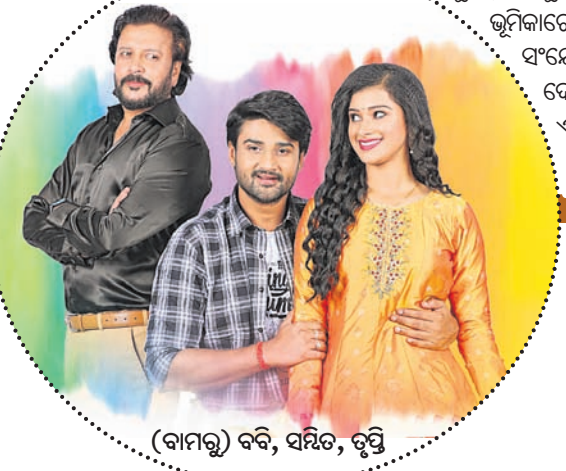
(ବାମକୁ) ବଦି, ସମିତ, ତୁସୁ