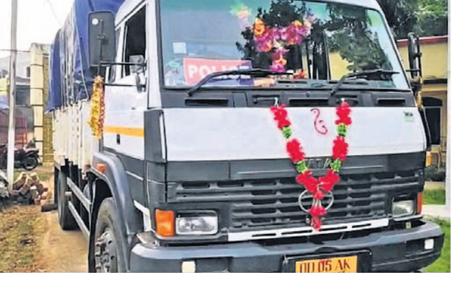
କାଠ ସହ କବଚ ପୋଲିସ୍ ଭ୍ୟାନ।

ପାରଳାଖେମୁଣ୍ଡି, ୩।୧୧ (ଡି.ଏନ୍.ଏ.) ଗଜପତି ଜିଲ୍ଲା ପାରଳାଖେମୁଣ୍ଡିରେ ଏକ ପୋଲିସ୍ ଭ୍ୟାନରେ ଶାଗୁଆନ କାଠ ଚୋରାଚାଲାଣ ହେଉଥିବା ବେଳେ ଧରାପଡ଼ିଛି। ଏହି ଘଟଣାରେ ସ୍ଥାନୀୟ ବନ ବିଭାଗ ମଙ୍ଗଳବାର ରାତିରେ ୪ ଜଣ ପୋଲିସ୍ କର୍ମଚାରୀଙ୍କୁ ଅଟକ ରଖିଛି। ରାତି ପ୍ରାୟ ୩ଟାରେ ପାରଳାଖେମୁଣ୍ଡି ଥାନାର ପୋଲିସ୍ ଭ୍ୟାନରେ ଶାଗୁଆନ କାଠ, ପଟା, ଗଣ୍ଡି ଚାଲାଣ ହେଉଥିଲା। ଖବରପାଇ ରାତି ପାହୋଲି କରୁଥିବା ବନ ବିଭାଗର ଏକ ସ୍ୱତନ୍ତ୍ର ଟିମ୍ ପୋଲିସ୍ ଭ୍ୟାନକୁ ରାମସଞ୍ଚାର ନିକଟରେ ଅଟକାଇଥିଲା। ସେଠାରେ ଗାଡ଼ିକୁ ଯାଞ୍ଚ କରିବାରୁ ସେଥିରେ ଥିବା ୩୫ ଘନଫୁଟ ଶାଗୁଆନ କାଠ, ପଟା ଓ ଗଣ୍ଡିକୁ ଜବତ କରାଯାଇଛି। ଏଥିରେ ସମ୍ପୃକ୍ତ ଥିବା ବନ ବିଭାଗର ଏକ ସ୍ୱତନ୍ତ୍ର ଟିମ୍ ପୋଲିସ୍ ଭ୍ୟାନକୁ ଅଟକ ରଖି ପଚରାଉଚରା