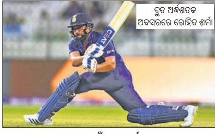
ଦ୍ରୁତ ଅର୍ଦ୍ଧଶତକ ଅବସରରେ ରୋହିତ ଶର୍ମା

ଆବୁଧାବି, ୩।୧୧ ଲୋକେଶ ରାହୁଲ ଓ ରୋହିତ ଶର୍ମାଙ୍କ ଶତକାନ୍ତ ଓପନିଂ ଭାଗାଦାରି ପରେ ରିଷଭ ପଟ୍ଟ ଓ ହାର୍ଦିକ ପାଣ୍ଡ୍ୟାଙ୍କ ବିଶ୍ୱୋରକ ବ୍ୟାଟିଂ ସହାୟତାରେ ଭାରତ ରୁଧିରୀ ଅନୁଷ୍ଠିତ ଆଫଗାନିସ୍ତାନ ବିପକ୍ଷ ତିନିଦିନୀ କୋହଲିଙ୍କ ନେତୃତ୍ୱାଧୀନ ଦଳ ୨୦ ଓଭରରେ ୨ ଉଇକେଟ୍ ହରାଇ ୨୧୦ ରନ ସଂଗ୍ରହ କରିଛି। ଭାରତ ପ୍ରଥମ ୨ଟି ମ୍ୟାଚରେ ପାକିସ୍ତାନ ଓ ନ୍ୟୁଜିଲାଣ୍ଡଠାରୁ ହାରି ଯାଇଥିବା ଏହି ମ୍ୟାଚରେ ବଡ଼ ବ୍ୟବଧାନରେ ବିଜୟ ଆବଶ୍ୟକ କରୁଛି।