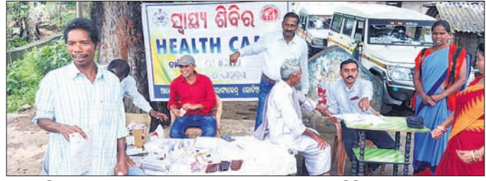
ନେରେଡ଼ିବାଲାସାରେ ଆନ୍ଧ୍ର ପକ୍ଷରୁ କରାଯାଇଥିବା ସ୍ୱାସ୍ଥ୍ୟସେବା ଶିବିର।

ପଟ୍ଟାଜୀ, ୩।୧୧(ବି.ଏ.ଏ.) ଶିବିର ସ୍ଥାନରେ ପହଞ୍ଚି ଓଡ଼ିଶାର ଏହି କୋରାପୁଟ ଜିଲ୍ଲା ପଟ୍ଟାଜୀ ବ୍ଲକ ଅନ୍ତର୍ଗତ ନେରେଡ଼ିବାଲାସାରେ ଓଡ଼ିଶାର ସ୍ୱାସ୍ଥ୍ୟ ଶିବିର କେତେକ ଗ୍ରାମବାସୀ ମଙ୍ଗଳକାର ବିରୋଧ କରିଛନ୍ତି।