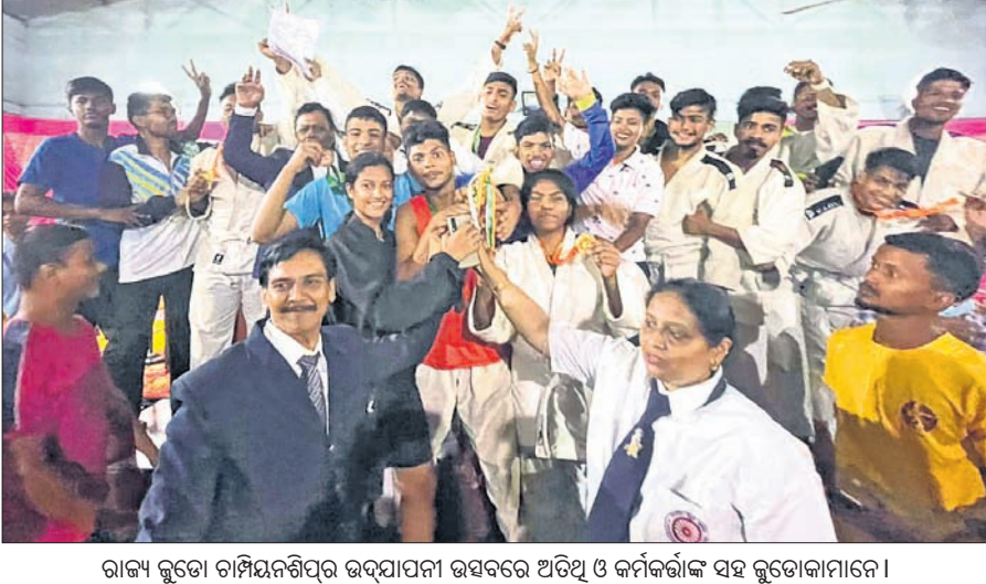
ରାଜ୍ୟ କ୍ରୀଡ଼ା ପ୍ରତିଯୋଗିତା ଉଦ୍‌ଯାପନା ଉତ୍ସବରେ ଅତିଥି ଓ କର୍ମକର୍ତ୍ତାଙ୍କ ସହ କ୍ରୀଡ଼ାକାରୀମାନେ ।

ଭୁବନେଶ୍ୱର, ୩।୧୧ (କ୍ରୀଡ଼ା ପ୍ରତିନିଧି): ବଲାଙ୍ଗୀର ଜିଲ୍ଲା କ୍ରୀଡ଼ା ସଂଘ (ବିଡିଜେଏ) ଏବଂ ଓଡ଼ିଶା ରାଜ୍ୟ କ୍ରୀଡ଼ା ସଂଘ (ଓଏସଜେଏ) ଦ୍ୱାରା ଏକ ଉପଲକ୍ଷରେ ପ୍ରତିଯୋଗିତା ପ୍ରସାରିତ ହୋଇଛି । ପ୍ରତିଯୋଗିତାରେ ଅଂଶଗ୍ରହଣ କରିଥିଲେ । ସିନିୟର ବର୍ଗରେ ଭୁବନେଶ୍ୱର କ୍ରୀଡ଼ା ସଂଘ ରାଜ୍ୟ ସର୍ବୋତ୍ତମ ଏବଂ ସମ୍ବଲପୁର ରନର୍ସଅପ୍ ହୋଇଛନ୍ତି ।