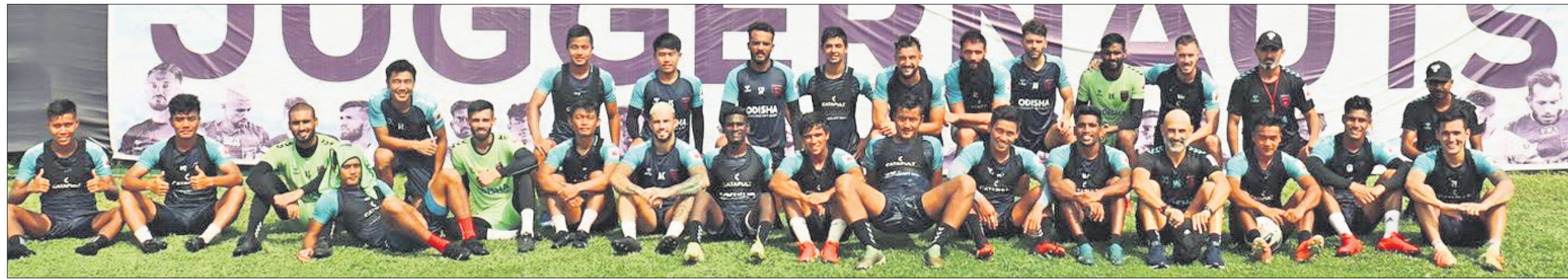
ଓଡ଼ିଆ ଲୁପ୍ଟରଲିଂ ପାଇଁ ମନୋନୀତ ଓଡ଼ିଶା ଏସ୍ପି ଦଳ ।