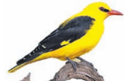
ଉତ୍ତର- ହଳଦୀବସନ୍ତ (୨)

ନୀଳ ଆକାଶରେ ଉଡ଼ି ବୁଲୁଥାଏ ହଳଦୀ ରଙ୍ଗର ଦେହ, ଶୁଭାଶିଷ ଭାଳେ ଗଛ ଉପରେ ବସି ସଜଳ ମନକୁ ମୋହେ ।