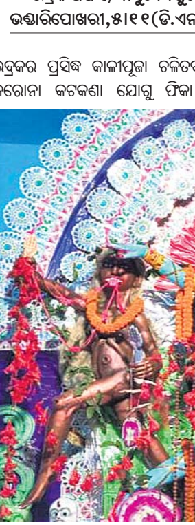
ଭଦ୍ରକ ଜିଲ୍ଲା ଭଣ୍ଡାରିପୋଖରୀ ମଞ୍ଜୁରାଚୋଡ଼ ବଜାରରେ ପୂଜା ପାଉଥିବା ମା' ଶ୍ୟାମାକାଳୀ।

ଭଦ୍ରକ ଅଫିସ/ବାସୁଦେବପୁର/ ଭଣ୍ଡାରିପୋଖରୀ, ୫୧୧୧ (ଡି.ଏନ.ଏ.): ୧୩ଟି ମଣ୍ଡପରେ ପୂଜା ପାଉଛନ୍ତି ମା' କାଳୀ। କଟକଣା ଯୋଗୁ ଚାରିପଟୁ ମଣ୍ଡପ ଆବକ ହୋଇଛି।