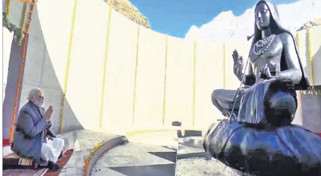
ଆଦି ଶଙ୍କରାଚାର୍ଯ୍ୟଙ୍କ ସମାଧି ପାଠରେ ପ୍ରଧାନମନ୍ତ୍ରୀ ନରେନ୍ଦ୍ର ମୋଦି ପ୍ରାର୍ଥନା କରୁଛନ୍ତି।

ଚେରାଇ, ୫।୧୧ ପ୍ରଧାନମନ୍ତ୍ରୀ ନରେନ୍ଦ୍ର ମୋଦି ଶୁକ୍ରବାର ଭରତରାଷ୍ଟ୍ର କେଦାରନାଥ ପାଠରେ ଆଦି ଶଙ୍କରାଚାର୍ଯ୍ୟଙ୍କ ପୁନଃ ନିର୍ମିତ ସମାଧି ଉଦ୍ଘାଟନ କରିବା ସହ ଦଶଶିଖି ଧରି ରାଜ୍ୟର ବିକାଶ କାମ ରହିବ ବୋଲି କାମନା କରିଛନ୍ତି।