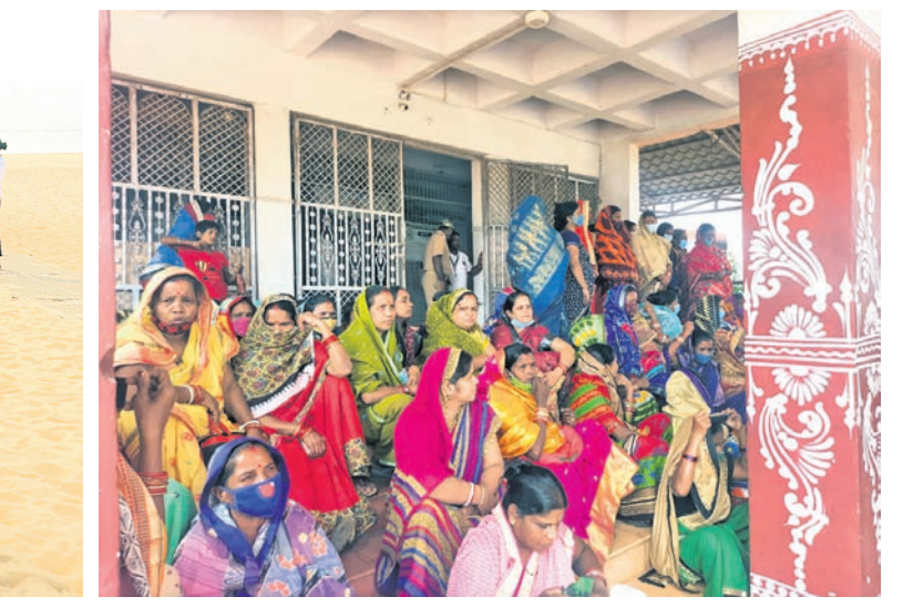
ପୋଖରୀ ନିଲାମ ଅନିୟମିତତା ପ୍ରତିବାଦରେ ଶୁକ୍ରବାର ଖୋର୍ଦ୍ଧା ଜିଲାପାଳଙ୍କ କାର୍ଯ୍ୟାଳୟ ଆଗରେ ମହିଳାମାନେ ଧାରଣାରେ ବସିଛନ୍ତି।