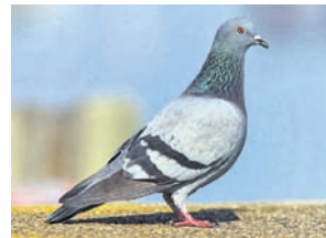
ଉତ୍ତର- ପାରା (୩)

ଚିଠି ଦିଆ ନିଆ ମାଧ୍ୟମରେ ଥିଲା ପୁରୁବ କାଳରେ ସିଏ, ପକ୍ଷୀଗଣ ମଧ୍ୟେ ସବୁଠୁ ନିରାହ ଗୁରୁ ଗୁରୁ ରା ଦିଏ ।