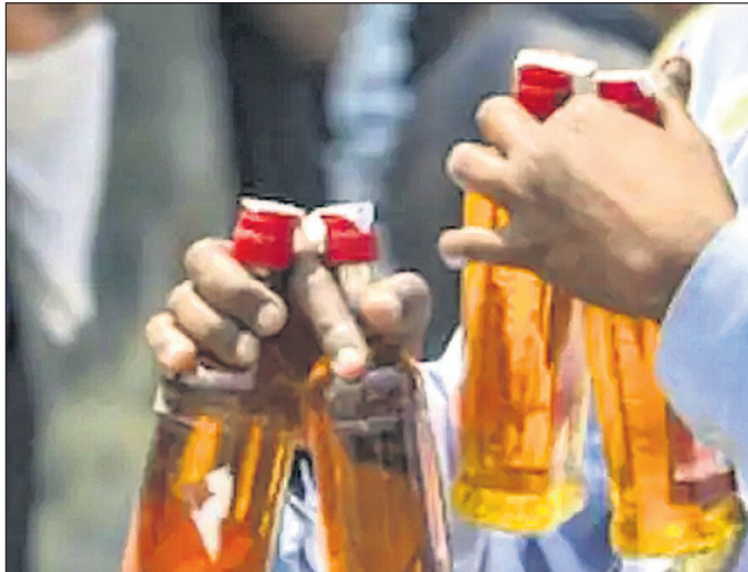
ମଦ ପିଇ ୬ ଜଣଙ୍କ ମୃତ୍ୟୁ ଘଟିଥିଲା। ଅନ୍ୟପକ୍ଷରେ ମୁଖ୍ୟମନ୍ତ୍ରୀ ନାଟାଶ କୁମାର କହିଛନ୍ତି, ପୁଣିଥରେ ଲୋକଙ୍କ ମଧ୍ୟରେ ସଚେତନତା ସୃଷ୍ଟି କରିବାକୁ ହେବ।

ପଦ ସମ୍ପୂର୍ଣ୍ଣ ନିଷେଧ ହୋଇଥିବା ବିହାରରେ ବିଷାକ୍ତ ମଦ ପିଇ ୩୫ ଜଣଙ୍କ ଜୀବନ ଯାଇଛି। ଗୋପାଳଗଞ୍ଜ ଏବଂ ପଶ୍ଚିମ ଚମ୍ପାରନ୍ ଜିଲ୍ଲାରେ ବୁଲୁଥିବା ୩୫ ଜଣଙ୍କ ମୃତ୍ୟୁ ହେବା ସହ ଅନେକ ଲୋକ ବିଷାକ୍ତ ମଦ ପିଇ ଅସୁସ୍ଥ ହୋଇପଡ଼ିଛନ୍ତି।