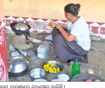
ବିଦ୍ୟାଳୟ ବାରଣ୍ଡାରେ ରୋଷେଇ ଚାଲିଛି।

ଦେବଗଣ, ୫୧୧୧(ସ.ପ୍ର.) ପ୍ରାଥମିକ ବିଦ୍ୟାଳୟରେ ଦୀର୍ଘଦିନ ହେବ ଆଶ୍ରୟ ନେଇଛନ୍ତି। ନିଜେ ଅସୁସ୍ଥ ଥିବାରୁ ପଢ଼କରଣ କୋର୍ସ ସି ଧାରଣା କରିବାକୁ ସକ୍ଷମ ନୁହେଁ।