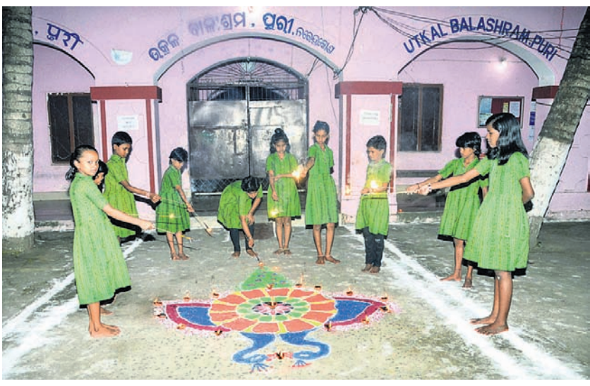
ପୁରୀର ଉତ୍କଳ ବାଳାଶ୍ରମ ଅନ୍ତେବାସୀମାନେ ଝୋଟି ପକାଇବା ସହ ଦୀପା କାଳି ଦୀପାବଳି ପାଳନ କରୁଛନ୍ତି।

ଖୋର୍ଦ୍ଧା ଜିଲା ନରଗରତ୍ ଭଗବତୀ କ୍ଲବ୍ ଆନୁକୁଲ୍ୟରେ ଚାଲିଥିବା ଫୁଟବଲ ଟୁର୍ନାମେଣ୍ଟ ଉନ୍ମୋଦିତ ହୋଇଯାଇଛି। ଏଥିରେ ୮ଟି ଦଳ ଅଂଗ୍ରହଣ ଯାଇଥିଲେ। ହଠାତ୍ ଗୁହାଳରୁ ଧୂଆଁ ବାହାରୁଥିବା ଦେଖି ଗୁହାଳ ବାସିନ୍ଦା ଗାଈ ଓ ବାହୁରି ଫିରେଇ ଦେଇଥିଲେ। ଖବରପାଇ ଅଭିଗମ କର୍ମଚାରୀ ପହଞ୍ଚି ନିଆଁକୁ ଆୟତ୍ତ କରିଥିଲେ। ସରକାରଙ୍କ ମାଧ୍ୟମରେ ଗୁହାଳ ଯୋଜନାରେ ସହାୟତା ପାଇଁ ସତେନ ପ୍ରଶାସନ ନିକଟରେ ନିବେଦନ କରିଥିଲେ।