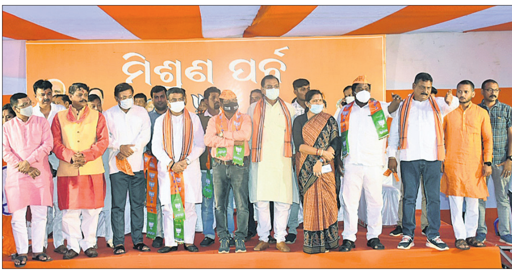
ରାଜ୍ୟ ଭାଜପା କାର୍ଯ୍ୟକ୍ରମରେ ଶୁକ୍ରବାର ଅନୁଷ୍ଠିତ ମିଶ୍ରଣ ପର୍ବରେ କେନ୍ଦ୍ରମନ୍ତ୍ରୀ ଧର୍ମେନ୍ଦ୍ର ପ୍ରଧାନ ଓ ଅନ୍ୟମାନେ।