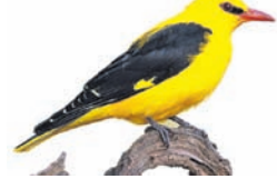
ଉତ୍ତର- ହଳଦୀବସନ୍ତ (୨)

ନୀଳ ଆକାଶରେ ଉଡ଼ି ବୁଲୁଥାଏ ହଳଦୀ ରଙ୍ଗର ଦେହେ, ଶୁଭାଶିଷ ଭାଳେ ଗଛ ଉପରେ ବସି ସଜଳ ମନକୁ ମୋହେ ।