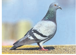
ଉତ୍ତର- ପାରା (୩)

ଚିଠି ଦିଆ ନିଆ ମାଧ୍ୟମରେ ଥିଲା ପୁରୁବ କାଳରେ ସିଏ, ପକ୍ଷୀଗଣ ମଧ୍ୟେ ସବୁଠୁ ନିରାହ ଗୁରୁ ଗୁରୁ ରା ଦିଏ ।