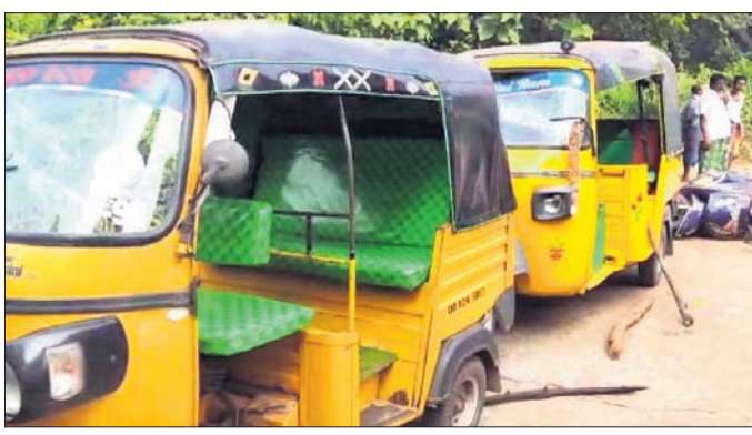
ଗଣଶଗୋଳରେ କଳା ଯାଇଥିବା ଅଟୋ ଓ ବାଇକ୍।