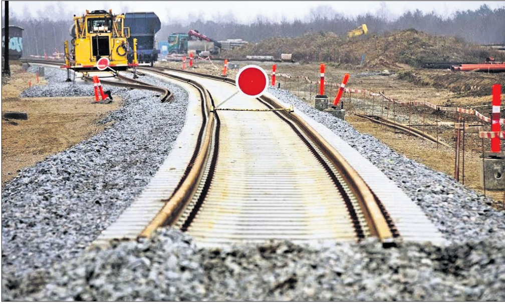
ଖୋର୍ଦ୍ଧା-ବଲାଙ୍ଗୀର ରେଳପଥର ବିଭୁପାଲି ନିକଟରେ ଚାଲିଥିବା କାମ। ଭବନ ପକ୍ଷରୁ ଉଦ୍‌ବେଗ ପ୍ରକାଶ ପାଇବା ସହ ଆବଶ୍ୟକ ପଦକ୍ଷେପ ଗ୍ରହଣ କରିବାକୁ ଓଡ଼ିଶାର ପୁଣ୍ୟ ଶାସନ ସଚିବଙ୍କ ସହ ଆଲୋଚନା ହୋଇଥିବା ସୂଚନା ମିଳିଛି। ଏହାସହ ଜଙ୍ଗଲ କ୍ଷତିକୁ ଅଣଜଙ୍ଗଲ କ୍ଷତିରେ ପରିବର୍ତ୍ତନ, ଗଛ ସଂଖ୍ୟା ନିରୂପଣ, ଗଛ କଟା ବାବଦ କ୍ଷତିପୂରଣ, ଏପ୍‌ଆର୍‌ଏଫ୍‌(ଫ୍‌ରେଷ୍ଟ୍ ରାଇଟ୍ ଆକ୍ଟ) ସାଚିଫିକେଟ,