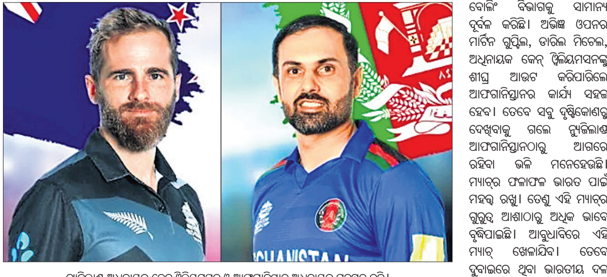
ନ୍ୟୁଜିଲାଣ୍ଡ ଅଧିନାୟକ କେନ୍ ଭିଲିୟମ୍ସନ୍ ଓ ଆଫଗାନିସ୍ତାନ ଅଧିନାୟକ ମହମ୍ମଦ ନବୀ

ଆକ୍ସାରି, ୬।୧୧ ଚିତ୍ର ୨୦ ବିଶ୍ୱକପ୍ ଗ୍ରୁପ୍ ୧୨ ପର୍ଯ୍ୟାୟରେ ନ୍ୟୁଜିଲାଣ୍ଡ ଓ ଆଫଗାନିସ୍ତାନ ପରସ୍ପରକୁ ଭେଟିବାକୁ ଯାଉଛନ୍ତି। ସ୍ଥାନୀୟ ଜାଏଦ କ୍ରିକେଟ୍ ଷ୍ଟାଡ଼ିୟମରେ ରବିବାର ଖେଳାଯିବାକୁ ଥିବା ଏହି ମ୍ୟାଚ୍ ଉପରେ ଭାରତ ସମେତ ସାରା ବିଶ୍ୱର ନଜର ରହିଛି। ଏହି ମ୍ୟାଚ୍ରେ ଆଫଗାନିସ୍ତାନ ଟ୍ୟୁଜିଲାଣ୍ଡକୁ ପରାସ୍ତ କରିପାରିଲେ ଭାରତ ସେମିଫାଇନାଲକୁ ଚଢ଼ାବ ସୁଯୋଗ ରହିବ। ତେଣୁ ଭାରତ ସମେତ କୋଟି କୋଟି ଭାରତୀୟ ପ୍ରଶଂସକ ଆଫଗାନିସ୍ତାନ ବିଜୟ ପାଇଁ ପ୍ରାର୍ଥନା କରିବେ। ଅନ୍ୟପଟେ ଯଦି ନ୍ୟୁଜିଲାଣ୍ଡ ଏହି ମ୍ୟାଚ୍ରେ ବିଜୟ ହେଲା ତାହେଲେ ଭାରତ ପାଇଁ ସେମିଫାଇନାଲ ସହ ରାସ୍ତା ବନ୍ଦ ହୋଇଯିବ। ଆଫଗାନିସ୍ତାନକୁ ହରାଇଲେ ନ୍ୟୁଜିଲାଣ୍ଡ ୮ ପଦ୍ମ ହାସଲ କରିବ ଓ ସିଧାସଳଖ ସେମିଫାଇନାଲକୁ ଉଠିବ। କେବଳ ସେତିକି ନୁହେଁ ଭାରତକୁ ଅତିମ ଚପା ପଞ୍ଚମରେ ନାହିଆକୁ ବୁହର୍ ବ୍ୟବଧାନରେ ହରାଇବା ମଧ୍ୟ ନିହାତି କରୁଛି। ତେଣୁ ଆଫଗାନିସ୍ତାନର ପ୍ରଦର୍ଶନ ଉପରେ ଭାରତର ଭାଗ୍ୟ ନିର୍ଭର କରୁଛି। ନ୍ୟୁଜିଲାଣ୍ଡ ବିଜୟୀ ହେଲେ ସେମାନେ ଖେଳାଯିବାକୁ ଥିବା ନାହିଆ ବିପକ୍ଷ ଭାରତର ଅତିମ ଲିଗ୍ ଗ୍ରୁପ୍ ହରାଇବ। ନ୍ୟୁଜିଲାଣ୍ଡ