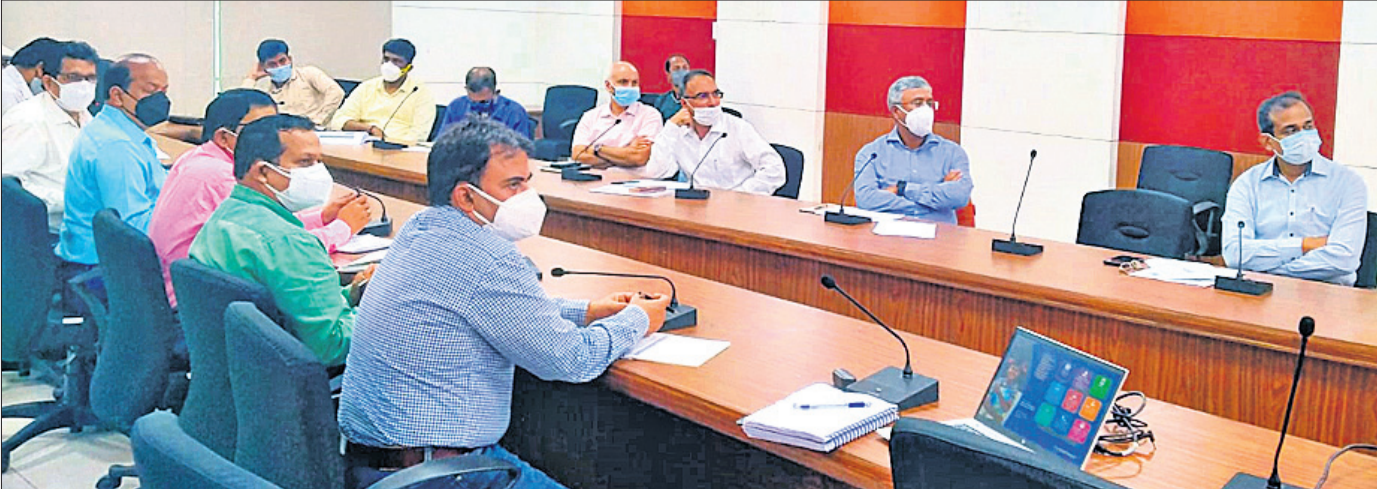
ଲୋକସଭା ଭବନରେ ଆୟୋଜିତ ବୈଠକରେ ପଶୁମ ଓଡ଼ିଶା ବିକାଶ ପରିଷଦ ଅଧ୍ୟକ୍ଷ ଅଧିକାରୀ ଏବଂ ଅନ୍ୟମାନେ।

ରାଜ୍ୟରେ ସୂର୍ଯ୍ୟମୁଖୀ ଓ ସୋରିଷ ଭଳି ଚୈକିତ୍ୟକ ସହିତ ତାଳିକାତୀୟ ଶସ୍ୟ ଉତ୍ପାଦନ ବୃଦ୍ଧି କରାଯିବ। ଏଥିପାଇଁ ଆବଶ୍ୟକ ପଦକ୍ଷେପ ନେବାକୁ ଓଡ଼ିଶା କୃଷି ଓ ବୈଷୟିକ ବିଶ୍ୱବିଦ୍ୟାଳୟକୁ ଦାୟିତ୍ୱ ଦିଆଯାଇଛି। ଅକ୍ଟୋବର ୮ରେ ଲୋକସଭା ଭବନରେ ଆୟୋଜିତ ଏକ-କର୍ମକ୍ରମକୁ ମିଳିତ୍ୱା ମତାମତ ଓ ସୁପାରିସ ଉପରେ ଚର୍ଚ୍ଚନା ନିମନ୍ତେ ଶନିବାର ଅନୁଷ୍ଠିତ ବୈଠକରେ ଅଧ୍ୟକ୍ଷତା କରି ମୁଖ୍ୟମନ୍ତ୍ରୀଙ୍କ ପ୍ରମୁଖ ପରାମର୍ଶଦାତା ତଥା ପଶୁମ ଓଡ଼ିଶା ବିକାଶ ପରିଷଦ ଅଧ୍ୟକ୍ଷ ଅଧିକାରୀ ଏହି ସୂଚନା ଦେଇଛନ୍ତି। ଏହି ବୈଠକରେ ଅଂଶଗ୍ରହଣ କରିଥିବା ବିଭାଗ କର୍ମଚାରୀଙ୍କୁ ପାଇଥିବା ଅଭିଜ୍ଞତା, ବେଶର ଅନ୍ୟାନ୍ୟ ସ୍ଥାନକୁ ଆସିଥିବା ବଡ଼ କମ୍ପାନୀଗୁଡ଼ିକ ରଖିଥିବା ମତାମତ ଏବଂ ସେ ଦିଗରେ ଆଗେଇବା ନିମନ୍ତେ ସମ୍ପୂର୍ଣ୍ଣ ବିଭାଗ ଦ୍ୱାରା ସ୍ଥିର କରାଯାଇଥିବା ପଦକ୍ଷେପଗୁଡ଼ିକୁ ଉପସ୍ଥାପନ କରିବାକୁ କୁହାଯାଇଥିଲା। ରାଜ୍ୟରେ କୃଷି ଆପ୍ରେସ୍ ମାଧ୍ୟମରେ ସୂର୍ଯ୍ୟମୁଖୀ ଏବଂ ସୋରିଷ ଉତ୍ପାଦନ ବୃଦ୍ଧି ଉପରେ ଗୁରୁତ୍ୱ ପ୍ରଦାନ କରାଯିବ। ଏଥିପାଇଁ ଓୟୁସି ନିର୍ଦ୍ଦେଶ ଭାବେ କେତେକ କାର୍ଯ୍ୟକ୍ରମ ଗ୍ରହଣ କରିବ। ଶୈବିକ ଚାଷ ନିମନ୍ତେ ଚାଷୀମାନଙ୍କୁ ସଚେତନ କରାଯିବ। ଏଥିସହିତ ପରାମର୍ଶ