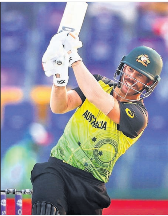
ଫ୍ରେସ୍‌ଇଣ୍ଡିଜ୍ ଅପ୍ ଦି ମ୍ୟାଚ୍ ଡେଇଁ ଖୁସି ହେଉଛନ୍ତି।

ଆକ୍ସାରି, ୬।୧୧ ଚଳିତ ଚିତ୍ର ୨୦ ବିଶ୍ୱକପ୍ରେ ଗ୍ରୁପ୍-୧ରେ ଅଷ୍ଟ୍ରେଲିଆ ଏକ ଗୁରୁତ୍ୱପୂର୍ଣ୍ଣ ବିଜୟ ହାସଲ କରିଛି। ଶନିବାର ଜାଏଦ କ୍ରିକେଟ୍ ଷ୍ଟାଡ଼ିୟମରେ ଖେଳାଯାଇଥିବା ମ୍ୟାଚ୍ରେ ଅଷ୍ଟ୍ରେଲିଆ ୨୨ଟି ବଲ୍ ବାଜିଆଇ ୮ ରନରେ ଫିରାକ୍ତ ହୋଇଥିଲା। ଏଥିପରେ ଅଷ୍ଟ୍ରେଲିଆର ସେମିଫାଇନାଲ ଆଶା ଉଜ୍ଜୀବିତ ରହିଛି। ତେବେ ଯଶଶ ଆପ୍ରିକା ଓ ଇଂଲଣ୍ଡ ମଧ୍ୟରେ ଖେଳାଯିବାକୁ ଥିବା ମ୍ୟାଚ୍ରେ ଫିରାକ୍ତ ହେଉଥିବା ଅଷ୍ଟ୍ରେଲିଆର ସେମି ଆଶା ନିର୍ଭର କରୁଛି। ନିଜର ଅଧିକ ଗ୍ରୁପ୍ ମ୍ୟାଚ୍ରେ ଚମ୍ପିୟନ୍ ଅଷ୍ଟ୍ରେଲିଆ ଫିଲ୍ଡିଂ କରିବାକୁ ନିଷ୍ପତ୍ତି ନେଇଥିଲା। ପ୍ରଥମେ ବ୍ୟାଟିଂ କରି ଫ୍ରେସ୍‌ଇଣ୍ଡିଜ ୭ ରନରେ ହରାଇ ୧୫୭ ରନ ସଂଗ୍ରହ କରିଥିଲା। ଜବାବରେ ଅଷ୍ଟ୍ରେଲିଆ ୧୬.୨ ଓଭରରେ ୨ ରନରେ ହରାଇ ୧୬୧ ରନ କରି ବିଜୟ ହୋଇଛି।