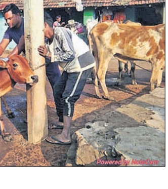
ଚୋରାପୁଟ ଜିଲ୍ଲା ପକ୍ଷରୁ ଚିକାକରଣ କରାଯାଇଛି।

ଚୋରାପୁଟ ଜିଲ୍ଲା ପକ୍ଷରୁ ଆନ୍ଧ୍ରକୁ ନିୟନ୍ତ୍ରଣ ନେଇ ଚିକାକରଣ କରାଯାଇଛି। ଏହା ଚୋରାପୁଟ ଜିଲ୍ଲା ପକ୍ଷରୁ ଆନ୍ଧ୍ରକୁ ନିୟନ୍ତ୍ରଣ ନେଇ ଚିକାକରଣ କରାଯାଇଛି।