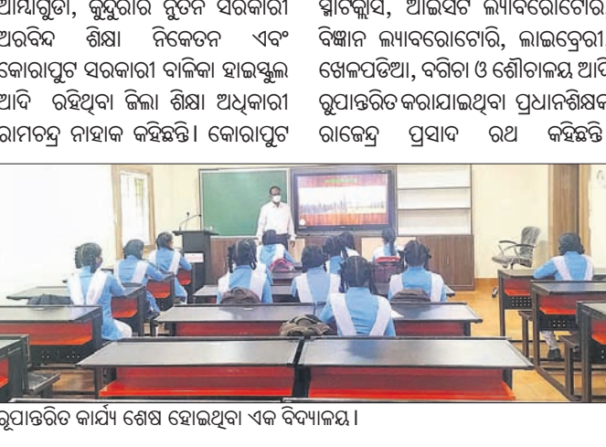
ରୂପାନ୍ତରିତ କାର୍ଯ୍ୟ ଶେଷ ହୋଇଥିବା ଏକ ବିଦ୍ୟାଳୟ।

କୋରାପୁଟ ଜିଲ୍ଲାରେ ୧୨ଟି ହାଇସ୍କୁଲରେ ରୂପାନ୍ତରିତ କାର୍ଯ୍ୟ ଶେଷ କରାଯାଇଛି। ଏହା କୋରାପୁଟ ଜିଲ୍ଲାରେ ୧୨ଟି ହାଇସ୍କୁଲରେ ରୂପାନ୍ତରିତ କାର୍ଯ୍ୟ ଶେଷ କରାଯାଇଛି।