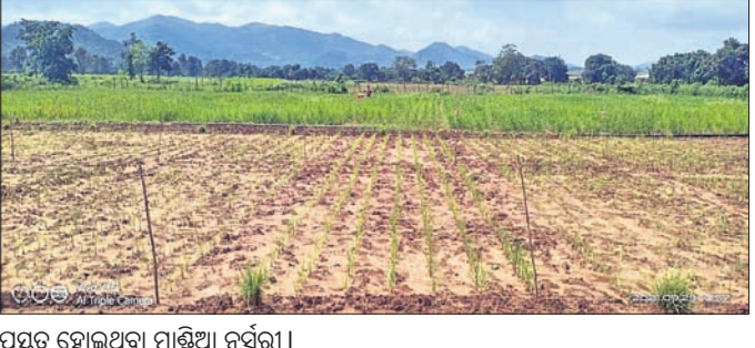
ପ୍ରସ୍ତୁତ ହୋଇଥିବା ମାଣ୍ଡିଆ ନର୍ସରୀ।

ବନ୍ଧୁଗାଁ, ୨୧୧ (ଡି.ଏନ.ଏ.) ବନ୍ଧୁଗାଁ ବ୍ଲକ କାର୍ଯ୍ୟାଳୟରେ ଶିବିର ଭୀମ ଭୋଇ ଭିକ୍ଷଣ ସାମର୍ଥ୍ୟ ଶିବିର ଆରମ୍ଭ ହୋଇଛି। ଏହା ବନ୍ଧୁଗାଁ ବ୍ଲକ କାର୍ଯ୍ୟାଳୟରେ ଆରମ୍ଭ ହୋଇଛି। ଏହା ବନ୍ଧୁଗାଁ ବ୍ଲକ କାର୍ଯ୍ୟାଳୟରେ ଆରମ୍ଭ ହୋଇଛି। ଏହା ବନ୍ଧୁଗାଁ ବ୍ଲକ କାର୍ଯ୍ୟାଳୟରେ ଆରମ୍ଭ ହୋଇଛି।