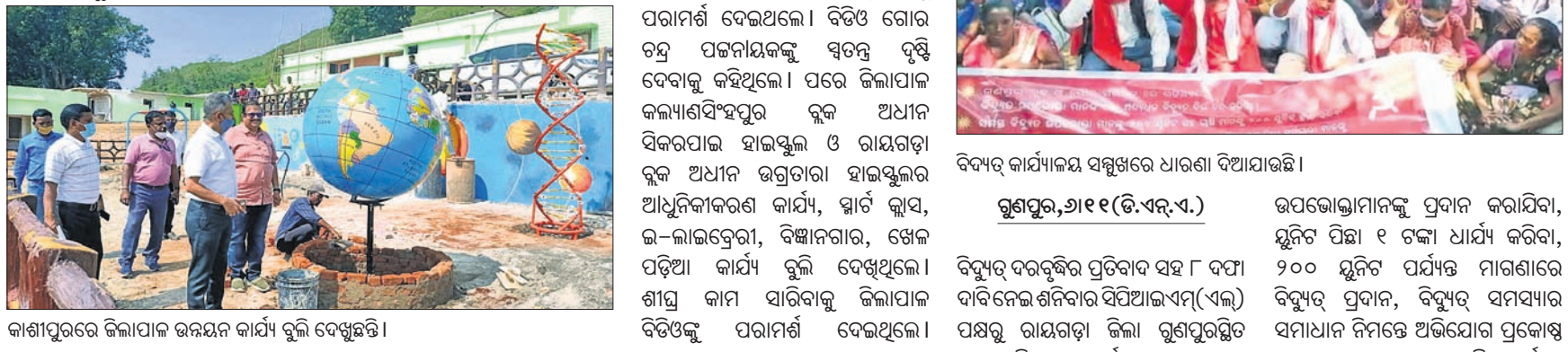
କାଶୀପୁରରେ ଜିଲ୍ଲାପାଳ ଉନ୍ନୟନ କାର୍ଯ୍ୟ ବୁଲି ଦେଖିଛନ୍ତି।

ରାୟଗଡ଼ା ଅଧିକାରୀ, ୬।୧୧(ବି.ଏନ.ଏ.)- ରାୟଗଡ଼ା ଜିଲ୍ଲାପାଳ ସରୋଜ କୁମାର ମିଶ୍ର ଶନିବାର କାଶୀପୁର ଓ କଲ୍ୟାଣସିଂହପୁର ବ୍ଲକ୍ ଗସ୍ତରେ ଆସି ଉନ୍ନୟନ ମୂଳକ କାର୍ଯ୍ୟର ସମୀକ୍ଷା କରିଛନ୍ତି। କାଶୀପୁର ଠାରେ ୫-ଟି ପଞ୍ଚାୟତ ସଭାରେ ସମୀକ୍ଷା କରାଯାଇଛି। ଉନ୍ନୟନ ମୂଳକ କାର୍ଯ୍ୟର ସମୀକ୍ଷା କରିବା ପାଇଁ ଜିଲ୍ଲାପାଳ ସରୋଜ କୁମାର ମିଶ୍ର ଶନିବାର କାଶୀପୁର ଓ କଲ୍ୟାଣସିଂହପୁର ବ୍ଲକ୍ ଗସ୍ତରେ ଆସି ଉନ୍ନୟନ ମୂଳକ କାର୍ଯ୍ୟର ସମୀକ୍ଷା କରିଛନ୍ତି। କାଶୀପୁର ଠାରେ ୫-ଟି ପଞ୍ଚାୟତ ସଭାରେ ସମୀକ୍ଷା କରାଯାଇଛି। ଉନ୍ନୟନ ମୂଳକ କାର୍ଯ୍ୟର ସମୀକ୍ଷା କରିବା ପାଇଁ ଜିଲ୍ଲାପାଳ ସରୋଜ କୁମାର ମିଶ୍ର ଶନିବାର କାଶୀପୁର ଓ କଲ୍ୟାଣସିଂହପୁର ବ୍ଲକ୍ ଗସ୍ତରେ ଆସି ଉନ୍ନୟନ ମୂଳକ କାର୍ଯ୍ୟର ସମୀକ୍ଷା କରିଛନ୍ତି।