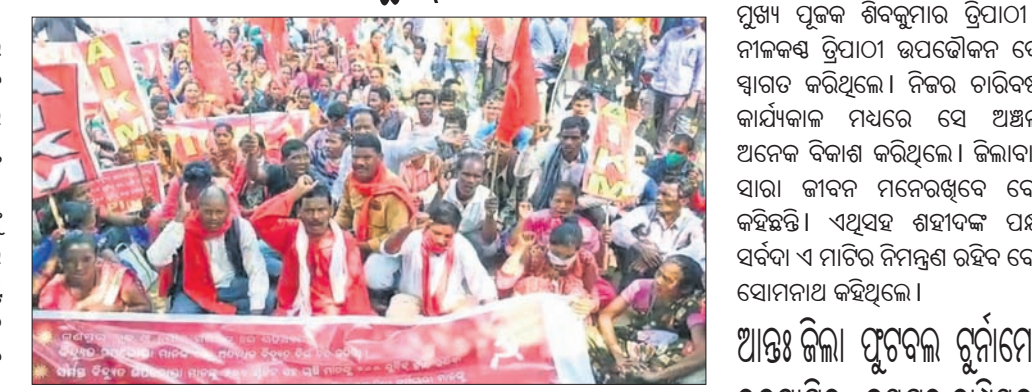
ବିଦ୍ୟୁତ୍ କାର୍ଯ୍ୟାଳୟ ସମ୍ମୁଖରେ ଧାରଣା ଦିଆଯାଇଛି।