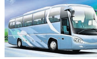
ଭୁବନେଶ୍ୱର, ୬/୧୧ (ବ୍ୟୁରୋ) କେନ୍ଦ୍ର ଓ ରାଜ୍ୟ ସରକାର ଟିକସ କମାଇବା ପରେ ରାଜ୍ୟରେ ଡିଜେଲ ମୂଲ୍ୟ ହ୍ରାସ ଘଟିଛି। ଡିଜେଲ ଲିଟର ପିଛା ପ୍ରାୟ ୧୦ଟଙ୍କା ୭୩ ପଇସା କମିଛି। ଏହାକୁ ଦୃଷ୍ଟିରେ ରଖି ରାଜ୍ୟ ସରକାର ବସ୍ ଭଡ଼ା ହ୍ରାସ କରିଛନ୍ତି। ଶନିବାର ଏ ନେଇ ରାଜ୍ୟ ପରଦାକୁ ୮୭ ପଇସାକୁ କମିଥିବା ବେଳେ ପରିବହନ କର୍ତ୍ତୃପକ୍ଷଙ୍କ ପକ୍ଷରୁ ବିଜ୍ଞପ୍ତି

ସାଧ୍ୟ ହେଲେ ସର୍ବନିମ୍ନ ୭ ବର୍ଷ ଜେଲଦଣ୍ଡ ଭୋଗିବ। ଅପରାଧ କରି ସମ୍ପତ୍ତି ବଢ଼ାଇଥିଲେ କୋର୍ଟରେ ଚାର୍ଜିଟ୍ ଦାଖଲ ପୂର୍ବରୁ ସମ୍ପତ୍ତି ବାଦ୍ୟାସ୍ତ ହେବ। କ୍ଷତ୍ରନ୍ତ କୋର୍ଟରେ ଏଭଳି ମାମଲାର ଶୁଣାଣି ହେବ। କୌଣସି ଅପରାଧୀ ସହ ସମ୍ପୃକ୍ତ ଜଣାପଡ଼ିଲେ ସରକାରୀ ଅଫିସରଙ୍କୁ ୩ରୁ ୧୦ ବର୍ଷ ଯାଏ ଜେଲ ଦଣ୍ଡଦଣ୍ଡ ବ୍ୟବସ୍ଥା ରହିବ। ମାମଲାରେ ସାକ୍ଷୀଙ୍କ ନାଁ, ଠିକଣା ସବୁ ରଖିବାକୁ ଅଫିସର ସୁଦ୍ଧା ବାଧ୍ୟ ହେବେ। କେବଳ କେବଳ କିମ୍ବା ରାୟ କପିରେ ସାକ୍ଷୀଙ୍କର କୌଣସି ତଥ୍ୟ ରହିବ ନାହିଁ। ସୂଚନାଯୋଗ୍ୟ ଯେ ଗୁଜରାଟ, ଉତ୍ତରପ୍ରଦେଶ ଓ ମହାରାଷ୍ଟ୍ରରେ ଗୁଣ୍ଡା ଆଇନ କାର୍ଯ୍ୟକାରୀ ହୋଇଛି।