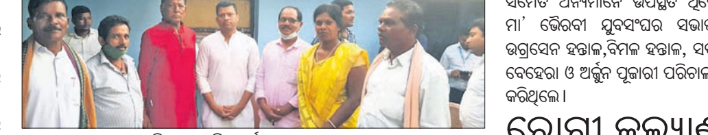
ପାପଡ଼ାହାଣ୍ଡି ବ୍ଲକ୍ରେ ୨ ହଜାରରୁ ଊର୍ଦ୍ଧ୍ଵ କର୍ମୀମାନେ।

ପାପଡ଼ାହାଣ୍ଡି, ୬।୧୧(ବି.ଏନ.ଏ.)- ପାପଡ଼ାହାଣ୍ଡି ବ୍ଲକ୍ରେ ୨ ହଜାରରୁ ଊର୍ଦ୍ଧ୍ଵ କର୍ମୀ ବିଜେଡିରେ ସାମିଲ ହେଲେ। ପାପଡ଼ାହାଣ୍ଡି ବ୍ଲକ୍ରେ ୨ ହଜାରରୁ ଊର୍ଦ୍ଧ୍ଵ କର୍ମୀ ବିଜେଡିରେ ସାମିଲ ହେଲେ।