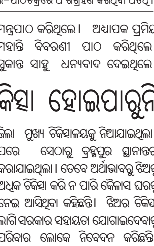
ଝିଅକୁ କୋଳରେ ଧରିଛନ୍ତି ମାଆ ଗୁଲି।

ଦଶମପୁର, ୨୧୧ (ଡି.ଏନ.ଏ.) ଦଶମପୁର ବ୍ଲକ ଅଧିକାରୀଙ୍କୁ ଅର୍ଥାଭାବରୁ ଝିଅର ଚିକିତ୍ସା ହୋଇପାରୁନି ବୋଲି କହିଥିଲେ। ଏହା ଦଶମପୁର ବ୍ଲକ ଅଧିକାରୀଙ୍କୁ ଅର୍ଥାଭାବରୁ ଝିଅର ଚିକିତ୍ସା ହୋଇପାରୁନି ବୋଲି କହିଥିଲେ।