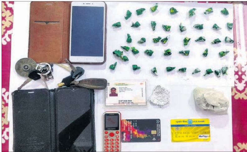
ଡକ୍ଟର ପରେ ଜବତ ସାମଗ୍ରୀ।

ଡେକାନାଲ ଗାଉଁସ ଥାନା ପୋଲିସ୍ ଘାଟଣାସ୍ଥଳୀରେ ବ୍ରାଉନସୁଗାର ବ୍ୟବସାୟରେ ଜବତ କରାଯାଇଥିବା ବିଭିନ୍ନ ଉପକରଣ ଓ ସାମଗ୍ରୀର ଫଟୋଗ୍ରାଫି ଗ୍ରହଣ କରାଯାଇଛି।