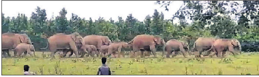
ବାରଙ୍ଗ, ୨।୧୧ (ଡି.ଏନ୍.ଏ.)

ଦକ୍ଷିଣ ଭାରତୀୟ ରାଜ୍ୟରେ ଅପରାଧରେ ହାତୀପଲ ବାହାରି ଅଭୟାରଣ୍ୟର ପାଦଦେଶରେ ଥିବା ବେଷୁଆ ଓ ଭାଲୁକା ଗ୍ରାମକୁ ଚାଲିଆସିଛନ୍ତି। ଏହି ହାତୀପଲ ଗାମଧ୍ୟକୁ ପଶିବାକୁ ଉଦ୍ୟମ କରୁଥିବାବେଳେ ଗ୍ରାମବାସୀ ଦେଖି ହୋଇଛନ୍ତି। କିଛି ବ୍ୟକ୍ତିଙ୍କୁ ଜଙ୍ଗଲ ମଧ୍ୟରେ ହିଁ ରହିଯାଇଛନ୍ତି। ଦିନକୁପୁର ବେଷୁଆ ଗ୍ରାମର କେତେକ ଲୋକ କୌଣସି କାର୍ଯ୍ୟରେ ଜଙ୍ଗଲ ଆଡ଼କୁ ଯିବାବେଳେ ହାତୀପଲ ଥିବା ଦେଖିଥିଲେ। ଫଳରେ ହାତୀପଲକୁ ଦେଖି ଗ୍ରାମରେ ଏକ ପ୍ରକାର ଭୟର ବାତାବରଣ ସୃଷ୍ଟି ହୋଇଛି। ପରେ ବନ ବିଭାଗକୁ ମଧ୍ୟ ଜଣାଇ ଦିଆଯାଇଛି। ଖବରପାଇ ଭଗୀପୁର ବନ ବିଭାଗ ପହଞ୍ଚି ହାତୀପଲକୁ ଗତିବିଧିକୁ ଜଣାଇଛନ୍ତି। ତେବେ ରାତିରେ ଘରକୁ କେହି ଏକା ନ ବାହାରିବା ପାଇଁ ବନ ବିଭାଗ ପକ୍ଷରୁ ଗ୍ରାମବାସୀଙ୍କୁ ସୂଚାଇ ଦିଆଯାଇଛି।