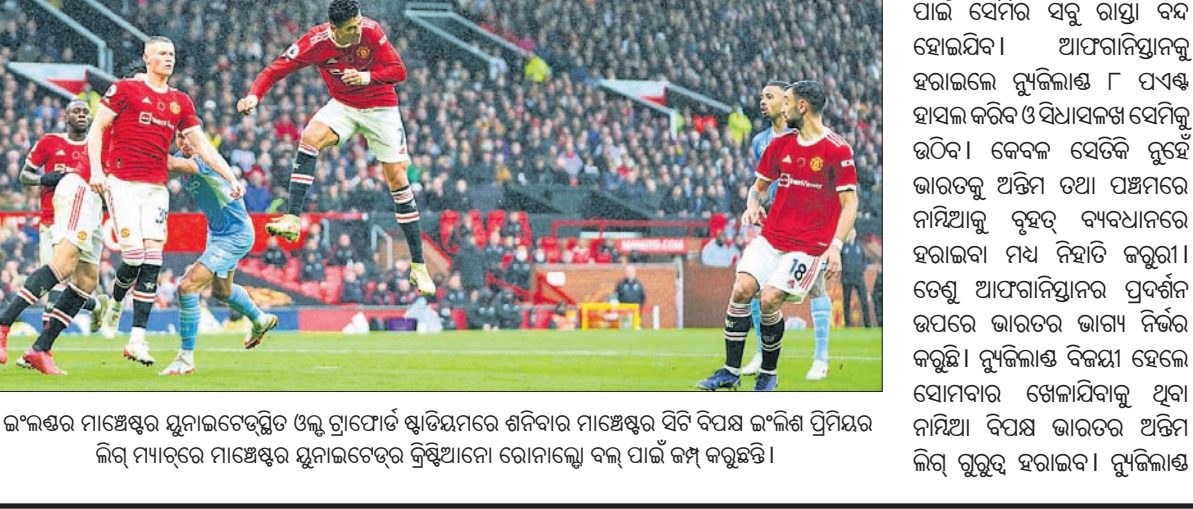
ଇଂଲଣ୍ଡର ମାକ୍ସେଲ୍ ସ୍ଟୁଭର୍ଟ ଓଲ୍ଡ୍ରାଫୋର୍ଟ୍ ଷ୍ଟାଡ଼ିୟମରେ ଶନିବାର ମାକ୍ସେଲ୍ ସ୍ଟୁଭର୍ଟ୍ ଡିପେକ୍ସ ଇଂଲଣ୍ଡ ପ୍ରତିନିଧାନ ଲିଗ୍ ମ୍ୟାଚ୍ରେ ମାକ୍ସେଲ୍ ସ୍ଟୁଭର୍ଟ୍ ଟ୍ରିସ୍ଟିଆନୋ ରୋନାଲ୍ଡୋ ବଲ୍ ପାଇଁ ଜମ୍ପ କରୁଛନ୍ତି।