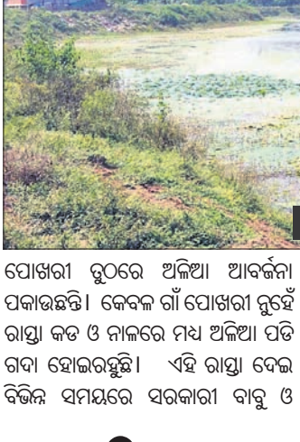
ପୋଖରୀ ହ୍ରଦରେ ପଡ଼ିଥିବା ଅଳିଆ।

ମାଲକାନଗିରି, ୨୧୧ (ଡି.ଏନ.ଏ.): ମାଲକାନଗିରି ଜିଲ୍ଲା ପଢ଼ିଆ ବ୍ଲକରେ ସ୍ଵଚ୍ଛ ଭାରତ ମିଶନ ବାଟବଣା ହୋଇଛି। ଏହା ମାଲକାନଗିରି ଜିଲ୍ଲା ପଢ଼ିଆ ବ୍ଲକରେ ସ୍ଵଚ୍ଛ ଭାରତ ମିଶନ ବାଟବଣା ହୋଇଛି। ଏହା ମାଲକାନଗିରି ଜିଲ୍ଲା ପଢ଼ିଆ ବ୍ଲକରେ ସ୍ଵଚ୍ଛ ଭାରତ ମିଶନ ବାଟବଣା ହୋଇଛି।