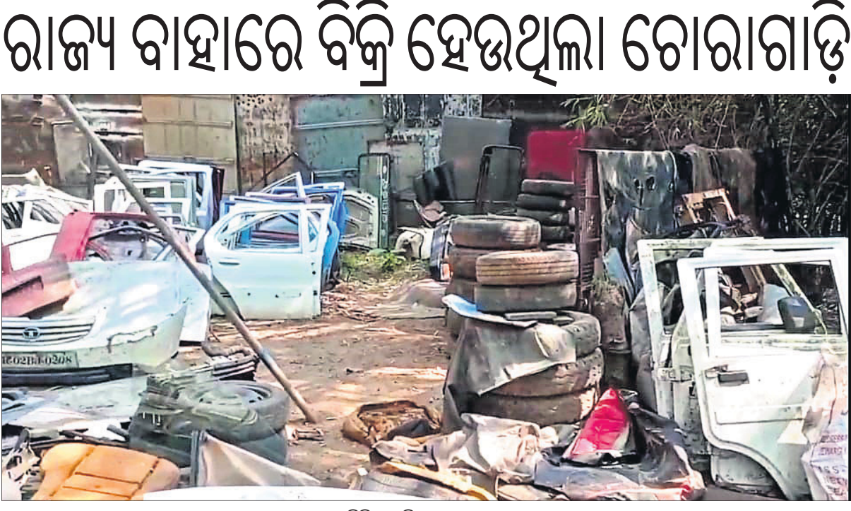
କଟା ହୋଇଥିବା ବିଭିନ୍ନ ଗାଡ଼ିର ଯନ୍ତ୍ରାଂଶ ଏବଂ ଅନ୍ୟ ସାମଗ୍ରୀ।

ଯାଜପୁର ଚାଉଳ, ୭.୧୧(ଡି.ଏନ.ଏ.) ଯାଜପୁର ସହରସ୍ଥ ଶିତଳେଶ୍ୱର ଅଞ୍ଚଳର ରାଧା କବାଡ଼ିଆ ଦୋକାନରେ ତୋରା ଗାଡ଼ି