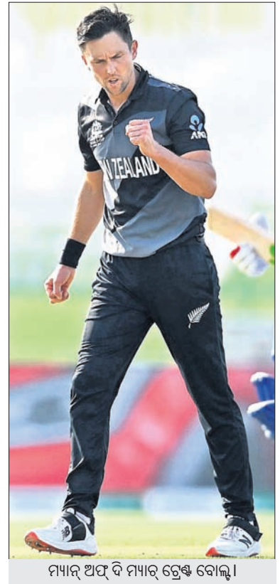
ମ୍ୟାଚ ଅଫ ଦି ମ୍ୟାଚ ଟ୍ରେଣିଂ ବୋଲ୍

ଆରୁଧି, ୭/୧୧ ଚଳିତ ଟି୨୦ ବିଶ୍ୱକପରେ ଦୁଇଜିଲ୍ଲା ଶ୍ରୀମତୀ ଦଳ ଭାବେ ସେମିଫାଇନାଲରେ ପ୍ରବେଶ କରିଛି। ରବିବାର ଗ୍ରୁପ୍-୨ର ଏକ ଗୁରୁତ୍ୱପୂର୍ଣ୍ଣ ମୁକାବିଲାରେ ଦୁଇଜିଲ୍ଲା ଶ୍ରୀମତୀ ଦଳ ଦୁଇଜିଲ୍ଲା ଶ୍ରୀମତୀ ଦଳକୁ ୮ ଉଇକେଟରେ ପରାସ୍ତ କରି ଏହି ସଫଳତା ହାସଲ କରିଛି। ଏଥିପାଇଁ ଭାରତ ପାଇଁ ଥିବା ସେମିଫାଇନାଲର ଯାତ୍ରା ଆଶା ମଧ୍ୟ ଶେଷରେ ଧୂଳିଧାର ହୋଇଛି। ଦୁଇଜିଲ୍ଲା