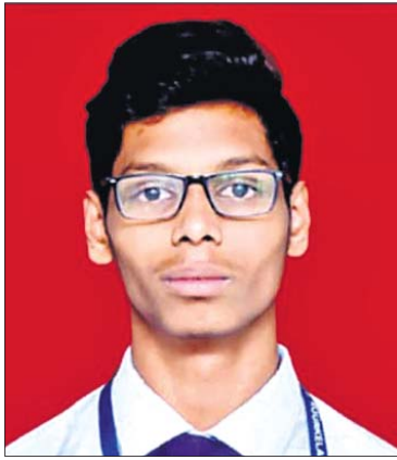
ସ୍ଵୟଂ ସମ୍ପୂର୍ଣ୍ଣ ସେନାପତି

ଉପାନ୍ତ ଅଞ୍ଚଳରେ ମଧ୍ୟ ଲୁଚିରହିଛି ପ୍ରତିଭା। ଏହାକୁ ସଦ୍ୟ ପ୍ରମାଣିତ କରି ଦେଖାଇଛନ୍ତି ଓଡ଼ିଶାର କୋରାପୁଟର ସ୍ଵୟଂ ସମ୍ପୂର୍ଣ୍ଣ ସେନାପତି। ନିଜ ପ୍ରଚେଷ୍ଟାରେ ୧୭ ବର୍ଷୀୟ ସ୍ଵୟଂ ସୁଚନା ଓ ପ୍ରଯୁକ୍ତି ବିଦ୍ୟା ଉପରେ ଗବେଷଣା କରି ୩୪ତମ କାମାୟ 'ଟେକ୍ ଆସେମ୍ବଲ-୨୦୨୧' ପାଇଁ ଶୁକ୍ରବାର ମନୋନୀତ ହୋଇଛନ୍ତି। ସେ ସର୍ବଭାରତୀୟ ସ୍ତରରେ ଦ୍ଵିତୀୟ ସ୍ଥାନ ଅଧିକାର କରି କୋରାପୁଟ ପାଇଁ ଗୌରବ ଆଣିଛନ୍ତି। ଏହି ସମ୍ମାନ କେନ୍ଦ୍ର ସୁଚନା ଓ ପ୍ରଯୁକ୍ତି ମନ୍ତ୍ରାଳୟ ପକ୍ଷରୁ ପ୍ରଦାନ କରାଯିବ। 'ଫିକ୍ସଡ୍ ଆଣ୍ଡ ସୁଥ୍ ଇଣ୍ଟରଫେସ୍ ଅଫ୍ ଷ୍ଟେଟ୍-ନେଟ୍' ଓ 'ଆଣ୍ଡରନେଟ୍ ଅଫ୍ ଆର୍ଟିଫିସିଆଲ୍