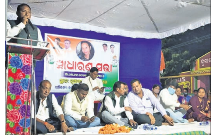
ଜୁନାଗଡ଼ରେ ଅନୁଷ୍ଠିତ ସାଧାରଣ ସଭାରେ ମଞ୍ଚାସୀନ କଂଗ୍ରେସର ନେତୃମଣ୍ଡଳୀ