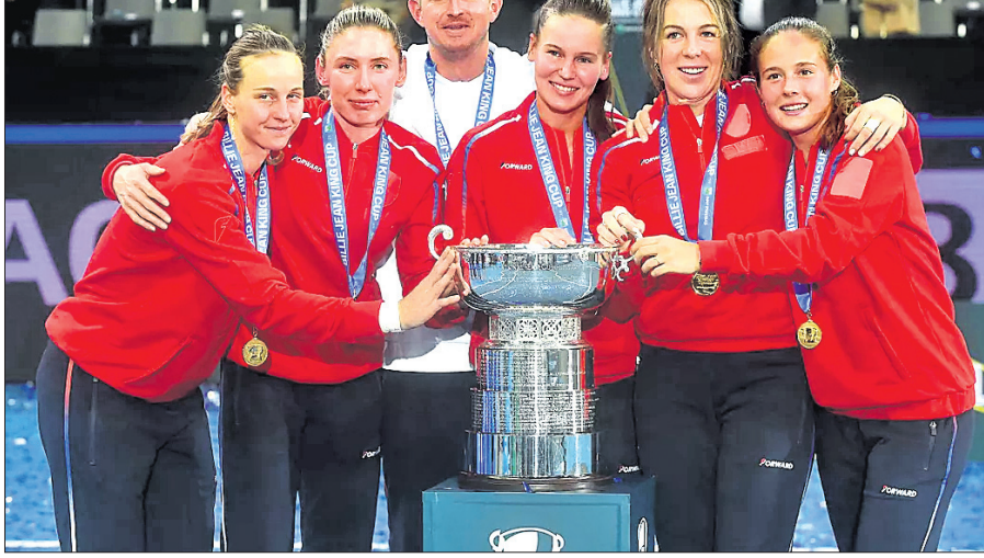
ବିଲି ଜିନ୍ କିଙ୍ଗ୍ କପ ଫାଇନାଲ ଜିତିବା ପରେ ଟ୍ରଫି ସହ ରୁଷିଆର ଟେନିସ୍ ଫେଡେରେଶନ ଦଳ।

ପ୍ରେସ୍, ୨୧.୧୧(ସପି) ରୁଷିଆ ଫାଇନାଲରେ ଉଭୟ ସିଙ୍ଗଲ୍ ମ୍ୟାଚ ଜିତିବା ପରେ ସୁଇଜରଲ୍ୟାଣ୍ଡକୁ ୨-୦ରେ ପରାସ୍ତ କରି ୫ମ ଥର ପାଇଁ ବିଲି ଜିନ୍ କିଙ୍ଗ୍ କପ ହାସଲ କରିଛି। ଟୋକିଓ ଅଲିମ୍ପିକ୍ସ ଟେନିସ୍ ମହିଳା ସିଙ୍ଗଲ୍ ଚାମ୍ପିୟନ ବେଲ୍ଜିଆ ବେନ୍ସିକ୍ସ ବିପକ୍ଷରେ ୩-୬, ୬-୩, ୬-୪ ସେଟ୍ରେ ବିଜୟ ସହ ଲିଭିଦମିଲା ସାମସୋନୋଭା ତାଙ୍କ ଦେଶ ପାଇଁ ନିର୍ଣ୍ଣାୟକ ପଏଣ୍ଟ ହାସଲ କରିଥିଲେ। ସାମସୋନୋଭା କହିଛନ୍ତି ଏହି ବିଜୟ ଦ୍ୱାରା ସେ ଏତେ ଖୁସି ଯେ, ତାହା ବିଶ୍ୱାସ କରିହେବ ନାହିଁ। ବାରିଆ ନାସାଦିକା ୬-୨, ୬-୪ରେ ବିଲି ଟିମ୍ମାନଙ୍କୁ ପରାସ୍ତ କରି ରୁଷିଆକୁ ୧-୦ରେ ଅଗ୍ରଣୀ କରାଇଥିଲେ। ସୁନାଯୋଗ୍ୟ, ପୂର୍ବରୁ ଏହି ପ୍ରତିଯୋଗିତା ଫେଡ୍ କପ ରୂପେ ପରିଚିତ ଥିଲା। ବିଜେତା ହିସାବରେ ରୁଷିଆ ଟ୍ରଫି ସମେତ ୧.୨ ନିୟୁତ ଡଲାର ଆର୍ଥିକ ପୁରସ୍କାର ଲାଭ କରିଛି। ଏହା ବ୍ୟତୀତ ରୁଷିଆର ଟେନିସ୍ ଫେଡେରେଶନ ମଧ୍ୟ ୬,୫୦,୦୦୦ ଡଲାର ଆର୍ଥିକ ପୁରସ୍କାର ପାଇଛି। ରୁଷିଆ ତରଫରୁ ପ୍ରଥମ ପଦାର୍ପଣ କରିଥିବା ୨୨ ବର୍ଷୀୟା ସାମସୋନୋଭା ଶୁକ୍ରବାର ମୁକ୍ତରାଷ୍ଟ୍ର ଆମେରିକା (ୟୁଏସ୍) ବିପକ୍ଷ ସେମିଫାଇନାଲରେ ଷ୍ଟୋକ୍ସ ଷ୍ଟେଡିଓରେ ୧-୬, ୬-୪, ୬-୩ ସେଟ୍ରେ ହରାଇଥିଲେ। ପରେ ଭାରୋନିକା କୁରଗେନୋଭାଙ୍କ ସହ ପାର୍ଟନରଶିପ୍ରେ ତବଲ୍ କୁରଗେନୋଭାଙ୍କ ସହ ପାର୍ଟନରଶିପ୍ରେ ତବଲ୍ ମ୍ୟାଚ ଜିତିଥିଲେ। ରୁଷିଆର ନମର ଥିନ ଖେଳାଳି