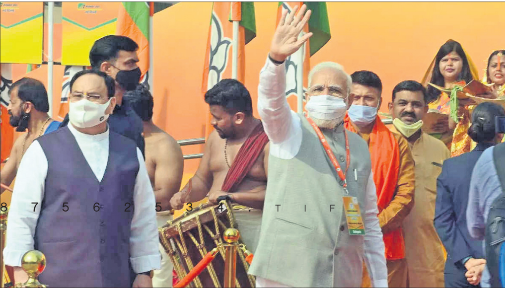
ଜାତୀୟ କାର୍ଯ୍ୟକାରୀତାରେ ପ୍ରଧାନମନ୍ତ୍ରୀ ନରେନ୍ଦ୍ର ମୋଦିଙ୍କ ସହ ଭାଜପା ରାଷ୍ଟ୍ରୀୟ ଅଧ୍ୟକ୍ଷ ଜେ.ପି. ନନ୍ଦା

ଭାଜପା ସଦସ୍ୟମାନେ ସାଧାରଣ ଜନତାଙ୍କ ପାଖକୁ ଯାଆନ୍ତୁ। ସେମାନେ ଦଳ ଓ ଲୋକଙ୍କ ମଧ୍ୟରେ ବିଶ୍ୱାସର ସେତୁରୂପ ସାଜନ୍ତୁ ବୋଲି ରବିବାର ନୂଆଦିଲ୍ଲୀରେ ଅନୁଷ୍ଠିତ ଭାଜପା ଜାତୀୟ କାର୍ଯ୍ୟକାରୀତା ବୈଠକରେ ପ୍ରଧାନମନ୍ତ୍ରୀ ନରେନ୍ଦ୍ର ମୋଦି ପରାମର୍ଶ ଦେଇଛନ୍ତି। ଏଥିସହ ଆଗାମୀ ୫ ରାଜ୍ୟ ବିଧାନସଭା ନିର୍ବାଚନରେ ଭାଜପା ଲୋକଙ୍କ ବିଶ୍ୱାସ ଜିତିବ ବୋଲି ମୋଦି ଆଶାବ୍ୟକ୍ତ କରିଛନ୍ତି। ଆସନ୍ତା ବର୍ଷ ଫେବୃଆରୀ-ମାର୍ଚ୍ଚ ଆଡ଼କୁ ଉତ୍ତର ପ୍ରଦେଶ, ଉତ୍ତରାଖଣ୍ଡ, ପଞ୍ଜାବ, ଗୋଆ ଓ ମଣିପୁରରେ ବିଧାନସଭା ନିର୍ବାଚନ ହେବ। ଏହାକୁ ଦୃଷ୍ଟିରେ ରଖି ଭାଜପା କାର୍ଯ୍ୟକାରୀତା ବୈଠକ ଅନୁଷ୍ଠିତ ହୋଇଛି। ପ୍ରଧାନମନ୍ତ୍ରୀ ମୋଦି ଉକ୍ତ ବୈଠକକୁ ସମୋ୍ତ କରି କହିଛନ୍ତି, ଭାଜପା କୌଣସି ନିର୍ଦ୍ଦିଷ୍ଟ କରିବାର ଚାହିଦାରେ ନୁହେଁ। ପରିବର୍ତ୍ତେ ସେବା, ସକଳ ଓ ସମର୍ପଣର ମୂଲ୍ୟବୋଧକୁ ନେଇ ଆରୋଜ ଚାଲିଛି। ନିକଟରେ ଅନୁଷ୍ଠିତ ତେଲଙ୍ଗାନାର ଏଲ୍‌ଏନାଏଫ ଉପନିର୍ବାଚନରେ ସଫଳତା ଭାଜପାର ବିକାଶ କାର୍ଯ୍ୟକାରୀତା ଗ୍ରହଣାୟତାକୁ ଦର୍ଶାଇଛି। ଭାଜପା ଲୋକଙ୍କ ସେବା କରିବାର ସଂକ୍ଷିପ୍ତ ପ୍ରତି ସମର୍ପଣ ଦେଲେ ପ୍ରଧାନମନ୍ତ୍ରୀ କହିଥିବା କେନ୍ଦ୍ରମନ୍ତ୍ରୀ ଭୃତ୍ୟ ଯାଦବ ଗଣମାଧ୍ୟମକୁ ସୂଚନା ଦେଇଛନ୍ତି। ଭାଜପା ରାଷ୍ଟ୍ରୀୟ ଅଧ୍ୟକ୍ଷ ଜେ.ପି. ନନ୍ଦା କହିଥିଲେ, ଦଳକୁ ଆହୁରି ସଙ୍ଗଠିତ