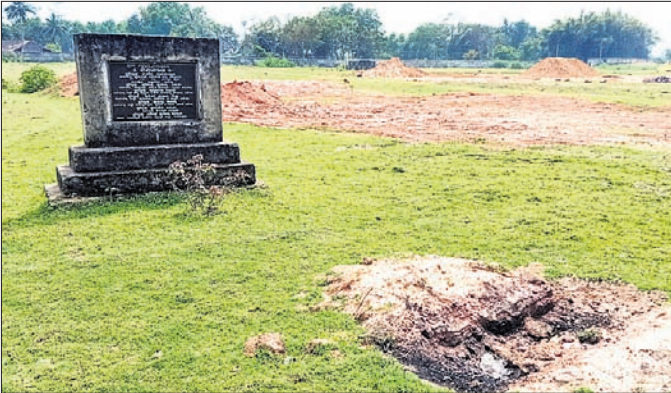
ନିର୍ମାଣାଧୀନ ବାଲେଶ୍ୱର ନୂଆ ବସ୍ତାଣୁ।

ଉପନିର୍ବାଚନର ବର୍ଷକ ପରେ ଗତ ଏପ୍ରିଲ ୧୩ରେ ମୁଖ୍ୟମନ୍ତ୍ରୀ ନବୀନ ପଟ୍ଟନାୟକ ଜିଲ୍ଲା ପାଇଁ ୧୫୫ କୋଟି ଟଙ୍କାର ପ୍ୟାକେଜ ଘୋଷଣା କରିଥିଲେ। ଏଥିରେ ବାଲେଶ୍ୱର ପୁରୁଣା ବସ୍ତାଣୁର ନବୀକରଣ ପ୍ରକଳ୍ପ ବ୍ୟବହାର କରାଯିବା କଥା ଅନ୍ତର୍ଭୁକ୍ତ ହୋଇଛି। ଏହି ପ୍ରକଳ୍ପକୁ ହାଉସିଂ ଆଣ୍ଡ ଅର୍ବାନ୍ ଡେଭଲପମେଣ୍ଟ ବିଭାଗ ରିଓ (ନଂ. ୧୮୨୬୪) ୨୮।୧୦।୨୦୨୧ ରିଖରେ ପ୍ରଶାସନିକ ସ୍ୱୀକୃତି ଅନୁମୋଦନ ହୋଇଛି। ସୁନହର ଜମିଦାରଙ୍କଠାରୁ ଓଡ଼ିଶା ରାଜ୍ୟ ସଡ଼କ ପରିବହନ ନିଗମ (ଓଏସଆର୍ଟିସି) ପକ୍ଷରୁ ୧୯୮୫ ଲକ୍ଷ ସହଦେବଖୁଣ୍ଟାରେ ୨୯୩୯୯ ଟଙ୍କା ପର୍ଯ୍ୟନ୍ତ ପରିମିତ ଜମି ନିଆଯାଇ ବସ୍ତାଣୁ ଆରମ୍ଭ ହୋଇଥିଲା। ପରେ ଓଏସଆର୍ଟିସି ପ୍ରଦାନ କରାଯାଇଛି। ନବୀକରଣ କରାଗଲେ ଯାତ୍ରୀଙ୍କ ପାଇଁ ସୁବିଧା ସହ ସୁରକ୍ଷା, ବ୍ୟବହାରକର