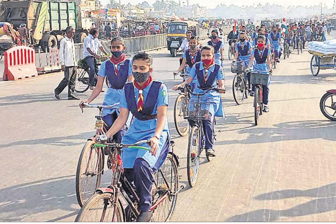
ଭାରତ ସ୍ଵାଧିକାରୀ ଗାଜପୁର ପ୍ରତିଷ୍ଠା ଦିବସ ପାଳନ ଅବସରରେ ରବିବାର ପୁରୀର ସ୍କୁଲ ପିଲାଙ୍କୁ ନେଇ ବୁଢ଼ିଶା ମନ୍ଦିର ନିକଟକୁ ବାହାରିଥିବା ସାଲକେଲ ଶୋଭାଯାତ୍ରା।

ରେକର୍ଡି କରାଯାଇଥିବା ଆକ୍ରମଣ ସମୟର ଦୃଶ୍ୟକୁ କିନରମାନେ ପୋଲିସ ନିକଟରେ ଦାଖଲ କରିଥିଲେ। ଭିତ୍ତି ଏବଂ ଫଟୋ ଆଧାରରେ ଦୁଇ ଅଭିଯୁକ୍ତଙ୍କୁ ପୋଲିସ ଗିରଫ କରି ରବିବାର କୋର୍ଟ ଚାଲାଣ କରିଥିଲା। କାମିନ ନାମସ୍ତର ପରେ ସେମାନଙ୍କୁ କାମାକ୍ଷାନଗର ଜେଲ ହାଜତକୁ ପଠାଇ ଦିଆଯାଇଛି। ଆକ୍ରମଣରେ ଆହତ କିନରଙ୍କୁ ପରଜଙ୍ଗ ଡାକ୍ତରଖାନାରେ ଡିକ୍ଵା କରାଯାଇଛି। ଜନସାଧାରଣଙ୍କ ସୁରକ୍ଷାରେ ନିୟୋଜିତ ଜଣେ ପୋଲିସ କର୍ମଚାରୀଙ୍କ ଏଭଳି କାର୍ଯ୍ୟକଳାପ ଖାଲିରେ କଳଙ୍କ ଛିଟା ପକାଇଥିବାବେଳେ ତାଙ୍କୁ ବହିଷ୍କାର କରିବାକୁ କିନରମାନେ ଦାବି କରିଛନ୍ତି। ଅନ୍ୟପକ୍ଷେ ପୋଲିସ ହାତରେ ଜଣେ ବିଭାଗୀୟ କର୍ମଚାରୀ ଗିରଫ ହେବା ସାଧାରଣରେ ଆଲୋଚନାରେ ବିଷୟ ହୋଇଛି।