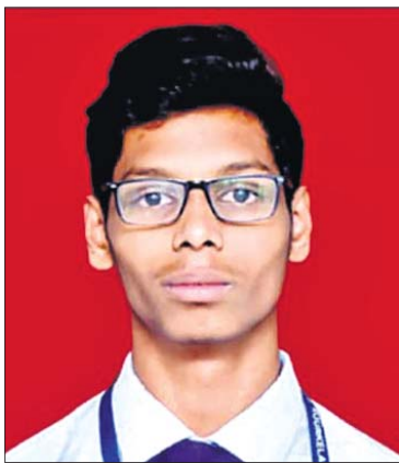
ସ୍ଵୟଂ ସମ୍ପୂର୍ଣ୍ଣ ସେନାପତି

ଉପାନ୍ତ ଅଞ୍ଚଳରେ ମଧ୍ୟ ଲୁଚିରହିଛନ୍ତି ପ୍ରତିଭା। ଏହାକୁ ସଦ୍ୟ ପ୍ରମାଣିତ କରି ଦେଖାଇଛନ୍ତି ଓଡ଼ିଶାର କୋରାପୁଟର ସ୍ଵୟଂ ସମ୍ପୂର୍ଣ୍ଣ ସେନାପତି। ନିଜ ପ୍ରଚେଷ୍ଟାରେ ୧୭ ବର୍ଷୀୟ ସ୍ଵୟଂ ସୁଚନା ଓ ପ୍ରଯୁକ୍ତି ବିଦ୍ୟା ଉପରେ ଗବେଷଣା କରି ୩୪ତମ କାମାୟ 'ଚେକ୍ ଆସେମ୍ବଲ-୨୦୨୧' ପାଇଁ ଶୁକ୍ରବାର ମନୋନୀତ ହୋଇଛନ୍ତି। ସେ ସର୍ବଭାରତୀୟ ସ୍ତରରେ ବିତ୍ତୀୟ ସ୍ଥାନ ଅଧିକାର କରି କୋରାପୁଟ ପାଇଁ ଗୌରବ ଆଣିଛନ୍ତି। ଏହି ସମ୍ମାନ କେନ୍ଦ୍ର ସୁଚନା ଓ ପ୍ରଯୁକ୍ତି ମନ୍ତ୍ରାଳୟ ପକ୍ଷରୁ ପ୍ରଦାନ କରାଯିବ। 'ଫିକ୍ସଡ୍ ଆଣ୍ଡ ସୁଥ୍ ଇଣ୍ଟରଫେସ୍ ଅଫ୍ ଷ୍ଟେଟ୍-ନେଟ୍' ଓ 'ଆଣ୍ଡରନେଟ୍ ଅଫ୍ ଆର୍ଟିଫିସିଆଲ୍