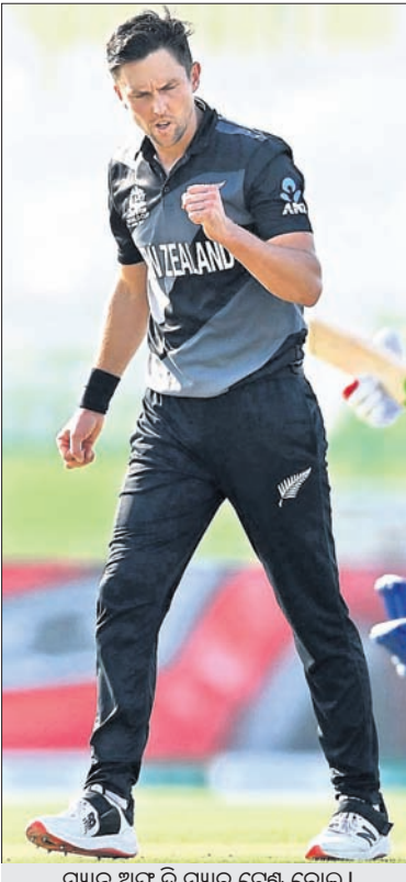
ମ୍ୟାଚ ଅଫ ଦି ମ୍ୟାଚ ଟ୍ରେଣ୍ଡ ବୋଲ୍।

ଟି୨୦ ବିଶ୍ୱକପ (ଆଜିର ମ୍ୟାଚ) ଭାରତ ବନାମ ନାମିଆ ସ୍ଥାନ: ବୁବାର, ସମୟ: ରାତି ୭ଟା ୩୦