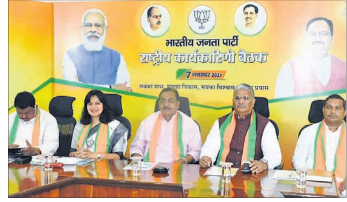
ଭାଜପା ରାଷ୍ଟ୍ରୀୟ କାର୍ଯ୍ୟକାରୀତା ବୈଠକରେ ଭବିଷ୍ୟତରେ ଓଡ଼ିଶାକୁ ଯୋଗଦେଇଥିବା ରାଜ୍ୟ ନେତୃବୃନ୍ଦ