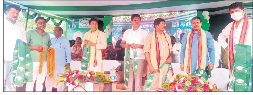
ଜୁନାଗଡ଼ରେ ଅନୁଷ୍ଠିତ ମିଶ୍ରଣ ପର୍ବରେ ଅତିଥିବୃନ୍ଦ

ଭାଜପାରେ ହିଂସାର କୌଣସି ସ୍ଥାନ ନାହିଁ। ମନିତା ହତ୍ୟା ଘଟଣାକୁ ନେଇ ଭୟଭୀତ ଭାଜପା ଓ କଂଗ୍ରେସ ଔଷଧ ବିକଳରେ ଚାଟିଆ କାମୁଡ଼ିବା ଭଳି ହେଉଛନ୍ତି। ସେମାନେ ଏହି ଘଟଣାରେ ହିଂସାତ୍ମକ ଓ ହାନି ରାଜନୀତି କରିବା ସହ କଳାହାଣ୍ଡିର ଛବିକୁ ରାଜ୍ୟରେ ମଳିନ କରିବାର ଲାଗି ପଡ଼ିଛନ୍ତି। ସେମାନେ ଯେତେ କଳାପତାକା ପ୍ରଦର୍ଶନ କରିବା ସହ ଅଣ୍ଡା ମାରିଲେ ମଧ୍ୟ ନବୀନ ସରକାରଙ୍କ ବିକାଶ ଧାରାକୁ ରୋଜି ପାରିବେନି ବୋଲି କଳାହାଣ୍ଡି ଜିଲ୍ଲା ଜୁନାଗଡ଼ ସହରଠାରେ ରବିବାର ଆୟୋଜିତ ବିଜେଡି କର୍ମୀ ସମ୍ମିଳନୀରେ ଯୋଗଦେଇ ଅଭିଯୋଗ