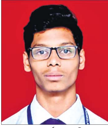
ସ୍ୱୟଂ ସମ୍ପୂର୍ଣ୍ଣ ସେନାପତି ।

ଉପାନ୍ତ ଅଞ୍ଚଳରେ ମଧ୍ୟ ଲୁଚିରହିଛି ପ୍ରତିଭା । ଏହାକୁ ସଦ୍ୟ ପ୍ରମାଣିତ କରି ଦେଖାଇଛନ୍ତି ଓଡ଼ିଶାର କୋରାପୁଟର ସ୍ୱୟଂ ସମ୍ପୂର୍ଣ୍ଣ ସେନାପତି । ନିଜ ପ୍ରଚେଷ୍ଟାରେ ୧୭ ବର୍ଷୀୟ ସ୍ୱୟଂ ସୂଚନା ଓ ପ୍ରଯୁକ୍ତି ବିଦ୍ୟା ଉପରେ ଗବେଷଣା କରି ୩୪ତମ କାତାୟ 'ଚେକ୍ ଆସେମ୍ବଲ-୨୦୨୧' ପାଇଁ ଶ୍ରଦ୍ଧାବାର ମନୋନୀତ ହୋଇଛନ୍ତି । ସେ ସର୍ବଭାରତୀୟ ସ୍ତରରେ ବିତାଣ ଗ୍ରାମ ଅଧିକାର କରି କୋରାପୁଟ ପାଇଁ ଗୌରବ ଆଣିଛନ୍ତି । ଏହି ସମ୍ମାନ କେନ୍ଦ୍ର ସୂଚନା ଓ ପ୍ରଯୁକ୍ତି ମନ୍ତ୍ରାଳୟ ପକ୍ଷରୁ ପ୍ରଦାନ କରାଯିବ । 'ଫିକ୍ସଡ୍ ଆଣ୍ଡ ସୁଅ ଇଣ୍ଟରଫେସ୍ ଅଫ୍ ଷ୍ଟେଟ୍-ନେଟ୍' ଓ 'ଆଷ୍ଟରନେଟ୍ ଅଫ୍ ଆର୍ଚିଟେକ୍ଚରାଲ୍