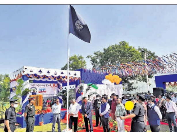
ପିଏସ୍‌ଇର ସ୍ଥାପନା ଦିବସ ଅବସରରେ ଉପସ୍ଥିତ ଅତିଥିମାନେ।

ସୂଚନା ଦେଇଥିଲେ। ଏହି ଅବସରରେ ‘ସ୍ୱାଧୀନତା ପରବର୍ତ୍ତୀ ଭାରତର ପ୍ରତିରକ୍ଷା ପ୍ରସ୍ତୁତ କ୍ଷେତ୍ରରେ ପିଏସ୍‌ଇର ଅବଦାନ’ ଏବଂ ‘ଭାରତୀୟ ପ୍ରତିରକ୍ଷା କ୍ଷେତ୍ରରେ ଆତ୍ମନିର୍ଭରତାର ଅନୁଭବ ପାଇଁ ତିଆରିଓଡ଼ର ଭୂମିକା’ ପ୍ରସଙ୍ଗରେ କୁଳକ ପ୍ରବନ୍ଧ ପ୍ରତିଯୋଗିତା ଆୟୋଜନ ହୋଇଥିଲା। ପିଏସ୍‌ଇ ପରିସରରେ ଗତ ୧ ତାରିଖରେ ‘ସ୍ୱଚ୍ଛ ଓ ସବୁଜ ଅଭିଯାନ’ ଅନ୍ତର୍ଗତ ୧୨୭ରୁ ଅଧିକ ଫଳ ଓ ଔଷଧ ଗାରାରୋପଣ କରାଯାଇଥିଲା। ୨୧ର ଅନୁଷ୍ଠିତ ରକ୍ତ ଦାନ ଶିବିରରେ ୧୨୭ରୁ ଅଧିକ ରକ୍ତ ଦାନ ସଂଗ୍ରହ ହୋଇଥିଲା। କାର୍ଯ୍ୟକ୍ରମରେ ଉଲ୍ଲେଖନୀୟ ଅବଦାନ ନିମନ୍ତେ ପିଏସ୍‌ଇର କର୍ମଚାରୀମାନଙ୍କୁ ତିଆରିଓଡ଼ର ଲାଭ୍ୟସ୍ତରୀୟ ପୁରସ୍କାର, ପୁଅ ମ୍ୟାନ ଅଫ୍ ଦି ଲୟର ପୁରସ୍କାର