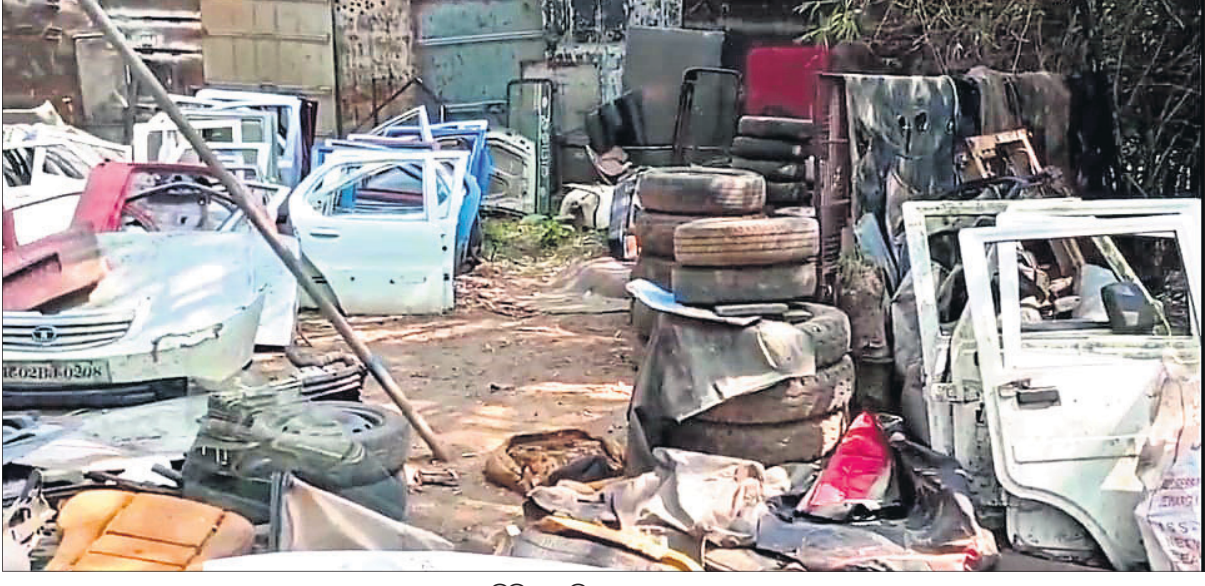
କଟା ହୋଇଥିବା ବିଭିନ୍ନ ଗାଡ଼ିର ଯନ୍ତ୍ରାଂଶ ଏବଂ ଅନ୍ୟ ସାମଗ୍ରୀ।

ଯାକପୁର ଚାଉଳ, ୭।୧୧ (ଡି.ଏନ.ଏ.): ଯାକପୁର ସହରରୁ ଶିତଳେଶ୍ଵର ଅଞ୍ଚଳର ରାଧା କବାଡ଼ିଆ ଦୋକାନରେ ଚୋରା ଗାଡ଼ି