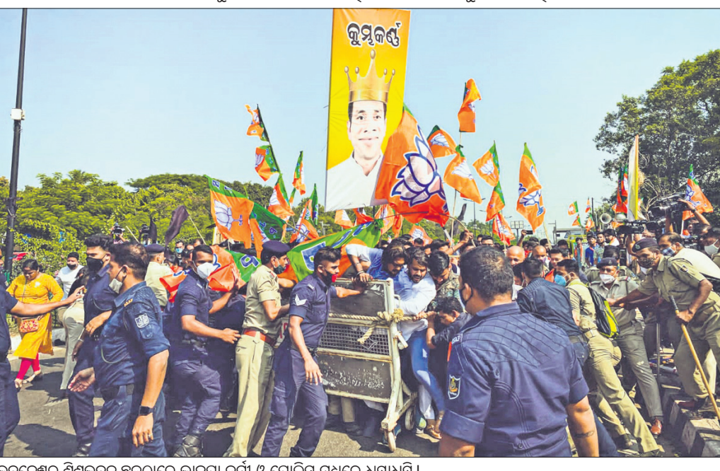
ଭୁବନେଶ୍ୱର ଶିଶୁଭବନ ଛକଠାରେ ଭାଙ୍ଗିବା କର୍ମୀ ଓ ପୋଲିସ ମଧ୍ୟରେ ଧସିଯାଇଥିଲା ।