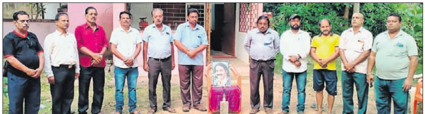
ସ୍ମୃତି ଚାରଣ ସଭାରେ ଉପସ୍ଥିତ ଖବରଦାତାମାନେ।