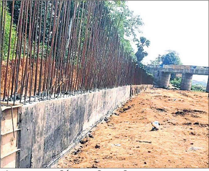
ବୈତରଣୀ ବାମ ପଟରେ ନିର୍ମାଣାଧୀନ କଂକ୍ରିଟ୍ ପାଟେରି।