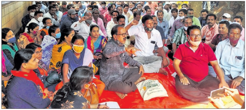
ଏଆରସିଏସ୍ କାର୍ଯ୍ୟାଳୟ ସମ୍ମୁଖରେ ନୟାଗଡ଼ ଜିଲ୍ଲାର ସମ୍ପାଦକମାନେ ଧାରଣାରେ ବସିଛନ୍ତି।