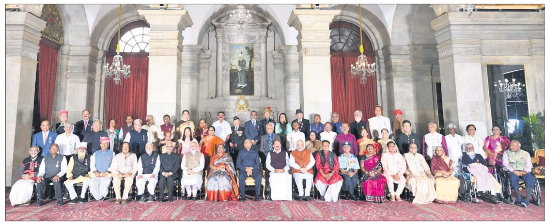
ରାଷ୍ଟ୍ରପତି ଭବନରେ ସୋମବାର ଆୟୋଜିତ ସ୍ୱତନ୍ତ୍ର ସମାରୋହରେ ରାଷ୍ଟ୍ରପତି ରାମନାଥ କୋବିନ୍ଦ, ଉପରାଷ୍ଟ୍ରପତି ଭୋଳାୟା ନାଲଡୁ, ପ୍ରଧାନମନ୍ତ୍ରୀ ନରେନ୍ଦ୍ର ମୋଦିଙ୍କ ଗହଣରେ ପୁରସ୍କୃତ ବ୍ୟକ୍ତିଗଣେ।