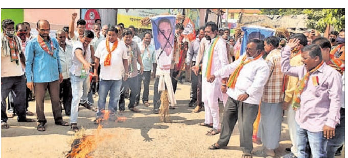
କରତ୍ୱି-ହପୁର ବ୍ଲକ କାର୍ଯ୍ୟାଳୟ ଆଗରେ କୁଶପୁଞ୍ଜିକା ଦାହ କରାଯାଇଛି।

କରତ୍ୱି-ହପୁର ଅର୍ଦ୍ଧ/ରାଜନଗର, ୮।୧୧ (ଡି.ଏନ.ଏ.)