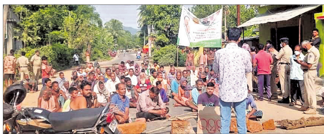
ବାଉଁଶବାଟିଠାରେ ରାଜାମା-କଣ୍ଠିଲୋ ରାସ୍ତାକୁ ଗୁଣାୟ ଲୋକ ଅବରୋଧ କରିଛନ୍ତି।