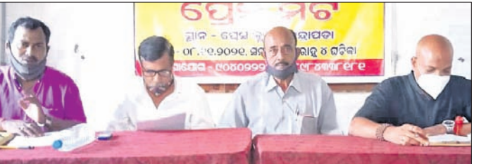
ବିଭିନ୍ନ ସୋସାଇଟି ପକ୍ଷରୁ ଅନୁଷ୍ଠିତ ଖବରଦାତା ସମ୍ମିଳନୀ।