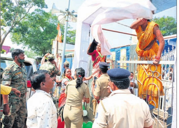
କଳାପୁଣ୍ଡା ବ୍ଲକ କାର୍ଯ୍ୟାଳୟରେ ବିରୋଧୀ ଦଳ କର୍ମୀମାନେ ଫାଟକରେ ତାଲା ପକାଇ ଦେଇଥିଲେ ।

ଆଗାମୀ ଉତ୍ତରପ୍ରଦେଶ ବିଧାନସଭା ନିର୍ବାଚନରେ ଦଳିତ ନେତା ଚନ୍ଦ୍ରଶେଖର ଆଜାଦ ପୁଖ୍ୟମନ୍ତ୍ରୀ ଯୋଗାଣ ଆଦିବିଦ୍ୟାଳୟ ବିରୋଧରେ ପ୍ରାର୍ଥୀ ହେବେ ବୋଲି ଘୋଷଣା କରିଛନ୍ତି । ୨୦୧୯ ଲୋକ ସଭା ନିର୍ବାଚନ ବେଳେ ସେ ବାରାଣସୀରୁ ପ୍ରଧାନମନ୍ତ୍ରୀ ନରେନ୍ଦ୍ର ମୋଦିଙ୍କ ବିରୋଧରେ ଲଢ଼ିବା ଲାଗି ଘୋଷଣା କରିଥିଲେ । ସେତେବେଳେ ତାଙ୍କର କୌଣସି ଦଳ ନ ଥିବାରୁ ସେ ପରେ ନିଷ୍ଠୁର ଓହରିଯାଇଥିଲେ । ଏଥର ସେ ଆଜାଦ ସମାଜ ପାର୍ଟି ନାମରେ ଦଳ ଗଠନ କରିଛନ୍ତି ଓ ଉକ୍ତ ଦଳରୁ ପ୍ରାର୍ଥୀ ହେବାକୁ ଯାଉଛନ୍ତି । ସେ ବିରୋଧୀ ଭାବେ ବିଭାଜନ କରିବା ପରିବର୍ତ୍ତେ ବିଏସ୍ପି ନେତ୍ରାଳ ପ୍ରାର୍ଥୀଙ୍କୁ ସମର୍ଥନ କରିବେ ବୋଲି କହିଛନ୍ତି ।