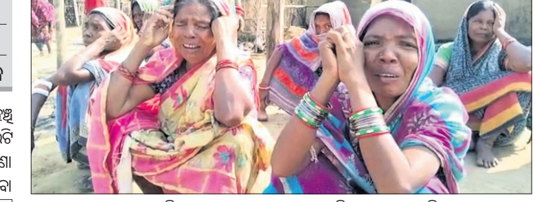
ଘର ପୋଡ଼ି ଛାଡ଼ିବାର ହୋଇଯାଇଥିବାରୁ ମହତାମାନେ କାନ୍ଦୁଛନ୍ତି।