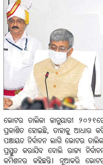
ଭୋଟର ତାଲିକା କାର୍ତ୍ତବ୍ୟରେ ୨୦୨୧ରେ ପ୍ରକାଶିତ ହୋଇଛି, ତାହାକୁ ଆଧାର କରି ପଞ୍ଚାୟତ ନିର୍ବାଚନ ଲାଗି ଭୋଟର ତାଲିକା ପ୍ରସ୍ତୁତ କରାଯିବ ବୋଲି ରାଜ୍ୟ ନିର୍ବାଚନ କମିଶନର କହିଛନ୍ତି। ନୂଆଦିଲ୍ଲୀ ଭୋଟର