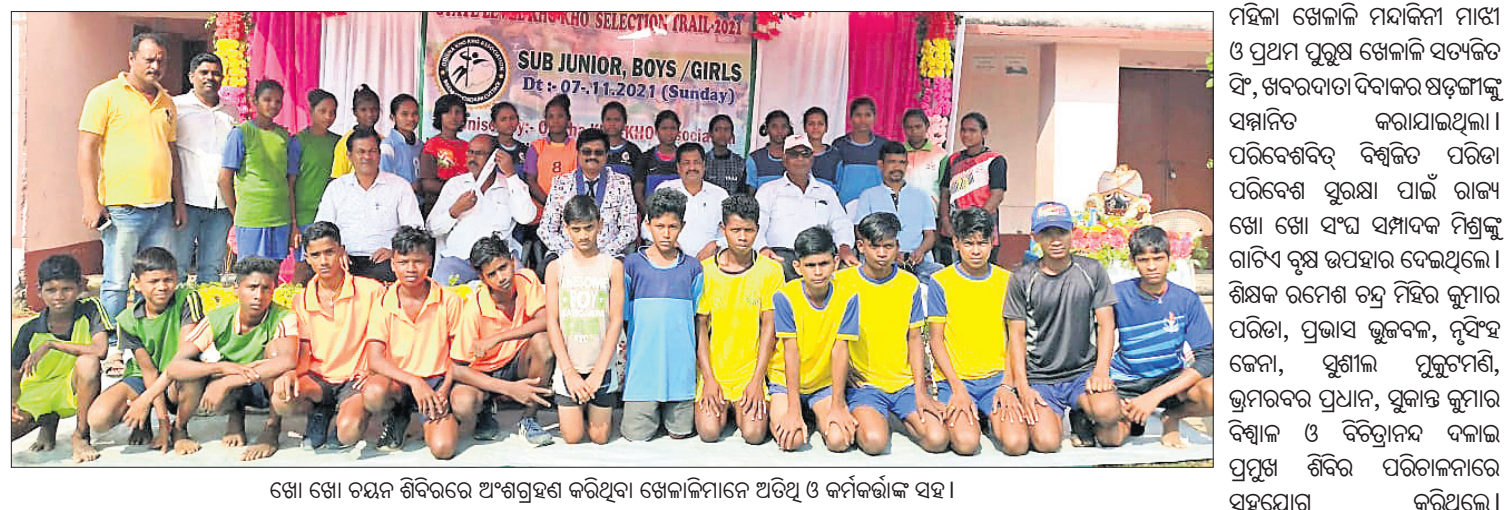
ଖୋ ଖୋ ଚୟନ ଶିବିରରେ ଅଂଶଗ୍ରହଣ କରିଥିବା ଖେଳାଳିମାନେ ଅତିଥି ଓ କର୍ମଚାରୀଙ୍କ ସହ।