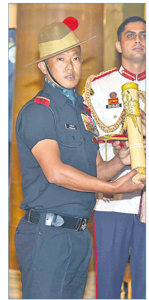
ନୂଆଦିଲ୍ଲୀସ୍ଥିତ ରାଷ୍ଟ୍ରପତି ଭବନରେ ରାଷ୍ଟ୍ରପତି ରାମନାଥ କୋବିନ୍ଦ ମହିଳା ବକ୍ସର ଏମ୍.ସି. ମେଡାଲ୍‌ମାନଙ୍କୁ ପଦ୍ମଭୂଷଣ ପୁରସ୍କାରରେ ସମ୍ମାନିତ କରୁଛନ୍ତି। ପଦ୍ମଭୂଷଣ ପୁରସ୍କାର ସହ ମହିଳା ବ୍ୟାଡ୍‌ମିଣ୍ଟନ ତାରକା ପି.ଜି. ସିନ୍ଧୁ। ପଦ୍ମଶ୍ରୀରେ ସମ୍ମାନିତ ମହିଳା ଯୁଗବଳ ତାରକା ଓଜନସ୍ୱେଦନେଦେବୀ, ଭାରତୀୟ ମହିଳା ହକି ଦଳର ଅଧିନାୟିକା ରାଣୀ ରାମପାଲ ଓ ତୀରହାକ ତରୁଣୀଦାସ ରାୟ।