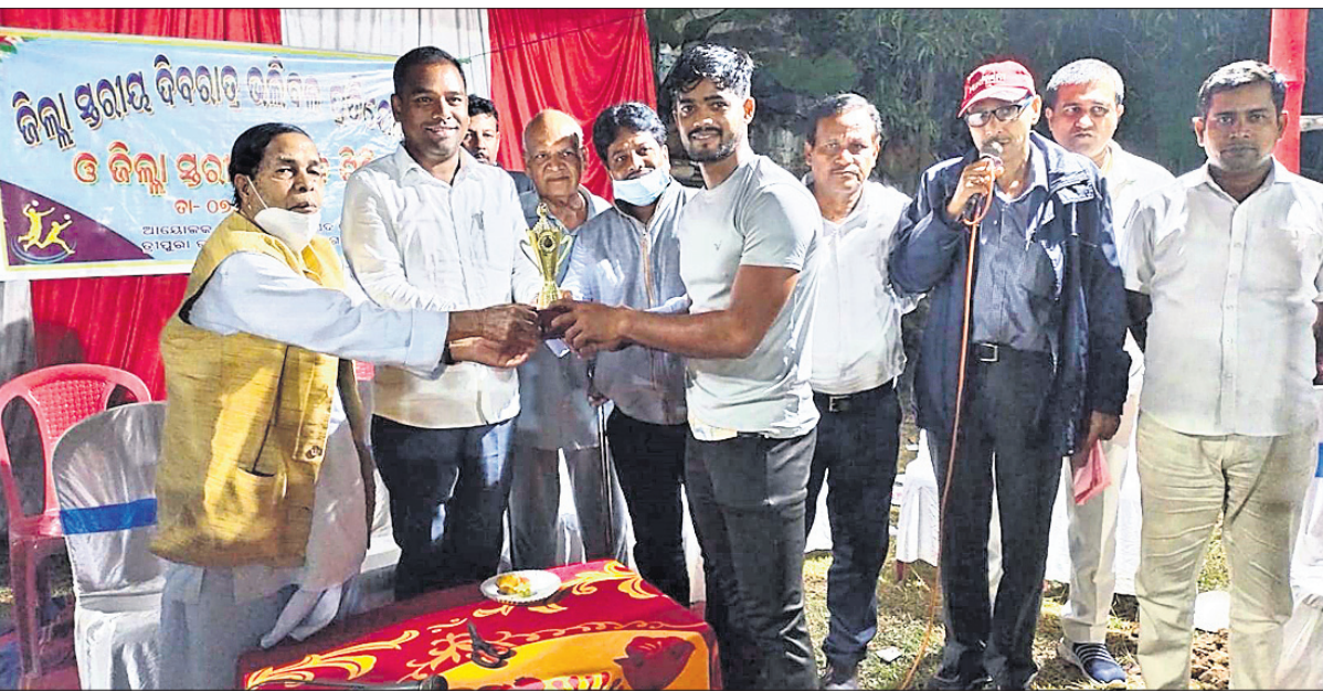
କୁଟା ଖେଳାଳିଙ୍କୁ ପୁରସ୍କୃତ କରାଯାଉଛି।