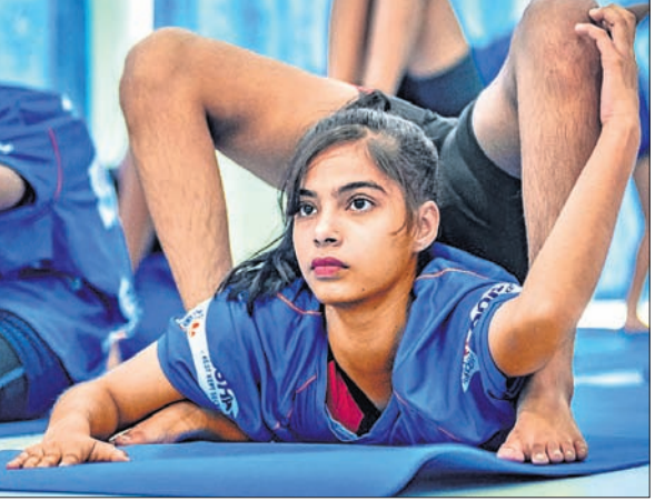
ଜଣେ ବାଳିକା ଯୋଗାସନ କରୁଛନ୍ତି।