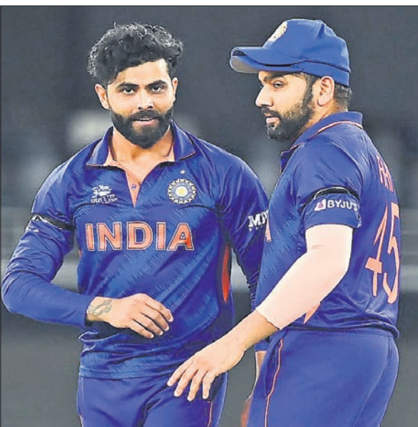
ରବୀନ୍ଦ୍ର କାଡେକା(ବାମ)କୁ ବଧେଇ ଜଣାଇଛନ୍ତି ରୋହିତ ଶର୍ମା।

ଭୁବନ, ୮।୧୧ ସେମିଫାଇନାଲ ବୌଦ୍ଧ ବାଦ ପଡ଼ି ସାରିଥିବା ଭାରତ ଚଳିତ ଟି୨୦ ବିଶ୍ୱକପରେ ବିଜୟ ସହ ଅଭିଯାନ ଶେଷ କରିଛି। ଏଥିସହ ଟି୨୦ ଅଧିନୀୟକତାରେ ବିରାଟ କୋହଲିଙ୍କ କାର୍ଯ୍ୟକାଳ ମଧ୍ୟ ଶେଷ ହୋଇଛି। ସୋମବାର ଅନୁଷ୍ଠିତ ଅନ୍ତିମ ଟ୍ରଫି ମ୍ୟାଚରେ ଭାରତ ୯ ଉଇକେଟରେ ନାହିଁଆକୁ ପରାସ୍ତ କରିଛି। ପ୍ରଥମେ ବ୍ୟାଟି କରିଥିବା ନାହିଁଆ ୨୦ ଓଭରରେ ୮ ଉଇକେଟ ହରାଇ ୧୩୨ ରନ କରିଥିଲା। ଭାରତ ୧୫.୨ ଓଭରରେ ମାତ୍ର ୧ ଉଇକେଟ ହରାଇ ୧୩୬ ରନ ସଂଗ୍ରହ କରି ନେଇଥିଲା। ବିରାଟଙ୍କ ଉତ୍ତରାଧିକାରୀଭାବେ ଟି୨୦ ମଙ୍ଗ ଧରଣକୁ ଯାଉଥିବା ରୋହିତ ଶର୍ମା ୩୬ ବଲ୍ରେ ୬ ଚୋକା ଓ ୨ ଛକା ସହ ସର୍ବାଧିକ ୫୬ ରନ କରି ଆଉଟ ହୋଇଥିବାବେଳେ ଲୋକେଶ ରାହୁଲ ୫୪(୩୬ ବଲ୍, ୪ ଚୋକା, ୨ ଛକା) ଓ ସୂର୍ଯ୍ୟକୂମାର ଯାଦବ ୨୫(୧୯ ବଲ୍, ୪ ଚୋକା) ରନରେ ଅପରାଜିତ ରହିଥିଲେ। ପ୍ରତିଯୋଗିତାକୁ ବିଦାୟ ନେଇ ସାରିଥିବା ଭାରତ କେବଳ ଔପଚାରିକତା ଦୃଷ୍ଟିରୁ ଏହି ମ୍ୟାଚ ଖେଳିଥିଲା। ଚିନ୍ ଇଣ୍ଡିଆ ଟି୨୦ ଅଧିନୀୟକ ଭାବେ ଶେଷ ମ୍ୟାଚ ଖେଳିଥିବା ବିରାଟ କୋହଲି ଚ୍ୟୁ ଜିଟି ପ୍ରଥମେ