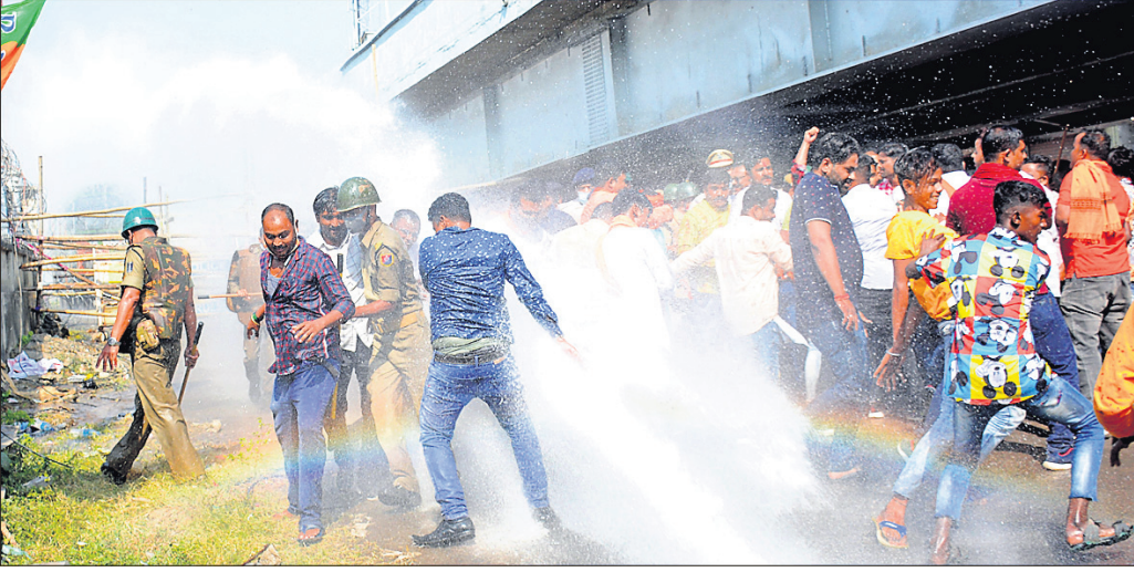
ଡିଆଇଜି ଅଫିସ ସମ୍ମୁଖରେ ଆନ୍ଦୋଳନକାରୀଙ୍କୁ ପୋଲିସ ପାଣିମାଡ଼ କରୁଛି ।