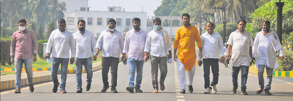
ସୁବ କଂଗ୍ରେସ ପକ୍ଷରୁ ଯୋଗଦାନ ଏକ ପ୍ରତିନିଧି ମଣ୍ଡଳୀ ରାଜ୍ୟପାଳଙ୍କୁ ସ୍ମାରକପତ୍ର ଦେଇ ଫେରୁଛନ୍ତି ।