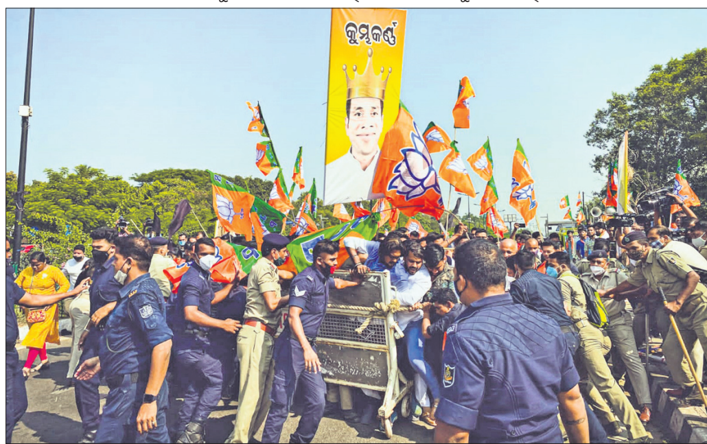
ଭୁବନେଶ୍ୱର ଶିଶୁଭବନ ଛକଠାରେ ଭାଙ୍ଗିବା କର୍ମୀ ଓ ପୋଲିସ ମଧ୍ୟରେ ଧସାଧସି ।