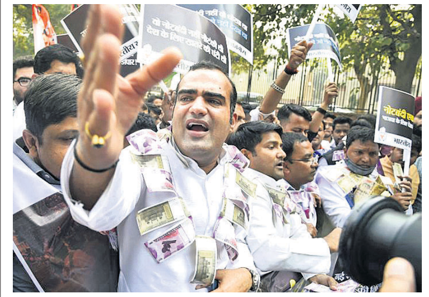
ଦିଲ୍ଲୀରେ ମୁକ୍ତ କଂଗ୍ରେସ ପକ୍ଷରୁ ବିପ୍ରାକରଣ ବିରୋଧରେ ବିକ୍ଷୋଭ ପ୍ରଦର୍ଶନ କରାଯାଇଛି।

ଶ୍ରୀନଗର, ୮୧୧: ଜମ୍ମୁ-କଶ୍ମୀରର ଅନନ୍ତନଗ ଜିଲ୍ଲାରେ ଯୋଗଦାନ କଲେ ଲକ୍ଷ୍ମୀ-୧-ତୋରଣ ଆତଙ୍କବାଦୀଙ୍କୁ ଗିରଫ କରାଯିବା ସହ ତାଙ୍କ ନିକଟରୁ ଅସ୍ତ୍ରଶସ୍ତ୍ର ଜବତ ହୋଇଛି।