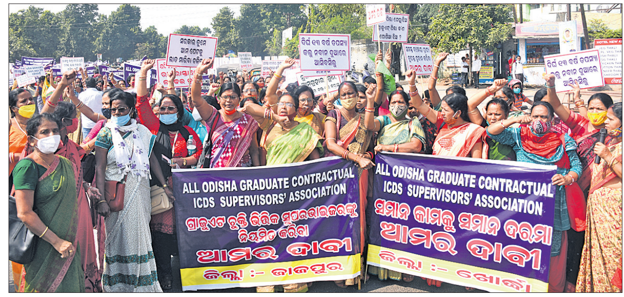
ବାକିର ନିୟମିତ କରିବା ସହ ବିଭିନ୍ନ ଦାବି ନେଇ ଅଲ୍ ଓଡ଼ିଶା ଗ୍ରାଜୁଏଟ୍ କଣ୍ଟ୍ରାକ୍ଟୁଆଲ୍ ଆଇଡିଏସ୍ ସୁପରଭାଇଜର୍ସ ଆସୋସିଏସନ୍ ପକ୍ଷରୁ ସୋମବାର ଭୁବନେଶ୍ୱର ମାଷ୍ଟରକ୍ୟାଣ୍ଟିନ ଛକରେ ଅନୁଷ୍ଠିତ ବିଶୋଭ ଶୋଭାଯାତ୍ରା।

ସେମାନଙ୍କ କାର୍ଯ୍ୟ ପରିସର ଭିତ୍ତି ତେବେ ସାଇବର ଏକ୍ସ୍ ପକ୍ଷରୁ କୁହାଯାଇଛି, ଦ୍ରବ୍ୟ ଥର ଯେତେବେଳେ ସମସ୍ୟାକୁ ଧରାଯାଇଥିଲା ତା'ର ତାତ୍ପର୍ଯ୍ୟ ଏତେ ନ ଥିଲା।