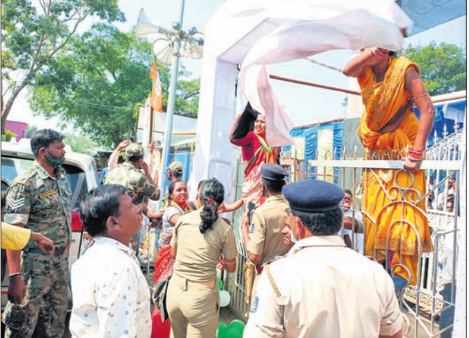
କଳାମୁଣ୍ଡା ବ୍ଲକ କାର୍ଯ୍ୟକ୍ରମରେ ବିରୋଧୀ ଦଳ କର୍ମୀମାନେ ଫାଟକରେ ତାଲା ପକାଇ ଦେଇଥିଲେ ।

ଆଗାମୀ ଉତ୍ତରପ୍ରଦେଶ ବିଧାନସଭା ନିର୍ବାଚନରେ ଦଳିତ ନେତା ଚନ୍ଦ୍ରଶେଖର ଆଜାଦ ପୁଖ୍ୟମନ୍ତ୍ରୀ ଯୋଗାଣ ଆଦିବିଦ୍ୟାଳୟ ବିରୋଧରେ ପ୍ରାର୍ଥୀ ହେବେ ବୋଲି ଯୋଗଦାନ ଦେଖାଯାଇଛି । ୨୦୧୯ ଲୋକ ସଭା ନିର୍ବାଚନ ବେଳେ ସେ ବାରାଣସୀରୁ ପ୍ରଧାନମନ୍ତ୍ରୀ ନରେନ୍ଦ୍ର ମୋଦିଙ୍କ ବିରୋଧରେ ଲଢ଼ିବା ଲାଗି ଯୋଗଦାନ କରିଥିଲେ । ସେତେବେଳେ ତାଙ୍କର କୌଣସି ଦଳ ନ ଥିବାରୁ ସେ ପରେ ନିଷ୍ଠୁର ଓହରିଯାଇଥିଲେ । ଏଥର ସେ ଆଜାଦ ସମାଜ ପାର୍ଟି ନାମରେ ଦଳ ଗଠନ କରିଛନ୍ତି ଓ ଉକ୍ତ ଦଳରୁ ପ୍ରାର୍ଥୀ ହେବାକୁ ଯାଉଛନ୍ତି । ସେ ବିରୋଧୀ ଭାବେ ବିଭାଜନ କରିବା ପରିବର୍ତ୍ତେ ବିଏସ୍ପି ନେତ୍ରାଳ ପ୍ରାର୍ଥୀଙ୍କୁ ସମର୍ଥନ କରିବେ ବୋଲି କହିଛନ୍ତି ।