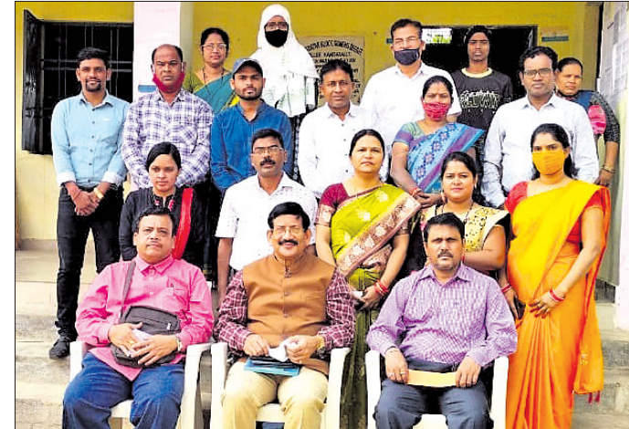
ମହିଳା ମହାବିଦ୍ୟାଳୟ କର୍ମଚାରୀଙ୍କ ଗହଣରେ ରାଜ୍ୟର ବିଶ୍ୱବିଦ୍ୟାଳୟ କୁଳପତି ।

କଲ୍ୟାଣୀ, ୯।୧୧(ଡି.ଏନ.ଏ.) ବଲାଙ୍ଗୀର ଜିଲ୍ଲା କଲ୍ୟାଣୀ ମହିଳା ମହାବିଦ୍ୟାଳୟର ମଙ୍ଗଳବାର ରାଜ୍ୟର ବିଶ୍ୱ ବିଦ୍ୟାଳୟ କୁଳପତି ପ୍ରଫେସର ଉପାଧ୍ୟକ୍ଷ ମହାପାତ୍ର ଓ ସିପିସି ଆସି ପରିଦର୍ଶନ କରିଥିଲେ ।