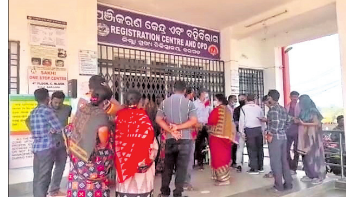
ଗ୍ରାମବାସୀ ତାଲାପକାଇରେ ତାଲା ପକାଇଛନ୍ତି ।

ବରଗଡ଼ ସହର ଉପକଣ୍ଠ ଖେଦାପାଲି (ବୁକୁଲ୍ଲା) ଛାଡ଼ି ଜିଲ୍ଲା ମୁଖ୍ୟ ତାଲାପକାଇରେ ବର୍ତ୍ତମାନ ନିଷ୍ପାଦନ ଏପର୍ଯ୍ୟନ୍ତ ବ୍ୟବସ୍ଥିତ ହୋଇପାରିନାହିଁ । ଡ୍ରେନେଜ ବ୍ୟବସ୍ଥା ଠିକ୍ ଭାବେ ହୋଇ ନ ଥିବାରୁ ତାଲା ପକାଇ ଆରମ୍ଭ ହୋଇଛି ।