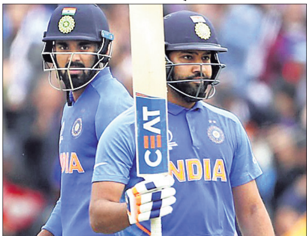
ଲୋକେଶ ରାହୁଲ ଓ ରୋହିତ ଶର୍ମା।