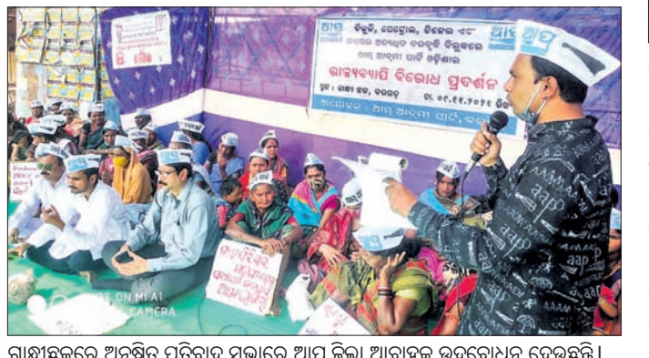
ରାଜ୍ୟସ୍ତରରେ ଅନୁଷ୍ଠିତ ପ୍ରତିବାଦ ସଭାରେ ଆପ୍ ଜିଲ୍ଲା ଆବାହକ ଉପସଭାପତି ଦେଉଛନ୍ତି ।