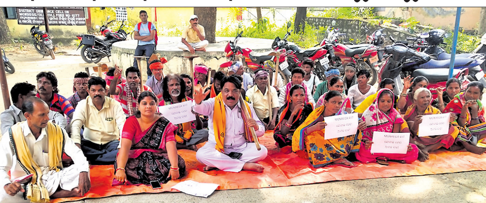
କାମ ଯୋଗାଣ ଦାବିରେ ପିଡି ଡିଆରଟିଏକ ଅଧିକ ସମ୍ବଳରେ ଦିଆଯାଇଥିବା ଧାରଣା ।

ସୋନପୁର, ୯।୧୧(ଡି.ଏ.) ଜିଲ୍ଲାରେ ଏମ୍.ଜି.ଏନ୍.ଆର.ଇ.ଜି.ଏ.ସ୍ୱରେ ଶ୍ରମିକଙ୍କୁ କାମ ମିଳୁନି । ଉଲ୍ଲକ୍ଷା ରୁକ୍ମର ମହତ୍ତ୍ୱ ପଞ୍ଚାୟତ, ସୋନପୁର ବ୍ଲକ ଖାରା ଓ ବଲି ପଞ୍ଚାୟତର ଶ୍ରମିକମାନେ ଗତ ୪ ମାସ ପୂର୍ବରୁ କାମ ମାଗିଥିଲେ ମଧ୍ୟ ପ୍ରଶାସନ କାମ ଯୋଗାଣ ନଥିବାରୁ ଅଭିଯୋଗ ହୋଇଛି ।