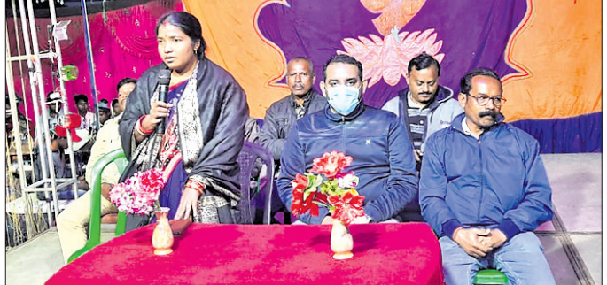
ବାର୍ଷିକ ଉତ୍ସବରେ ଯୋଗ ଦେଇଥିବା ଅତିଥିବୃନ୍ଦ ।