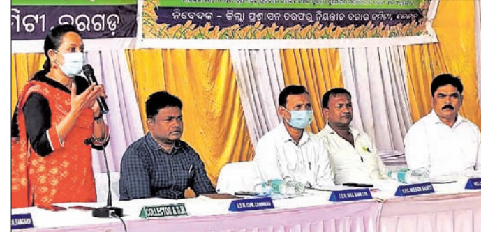
ଧାନ ସଂଗ୍ରହ ଉପରେ ବରଗଡ଼ ଜିଲ୍ଲାପାଳ ସୂଚନା ଦେଉଛନ୍ତି ।

ବରଗଡ଼ ଜିଲ୍ଲାରେ ଆସନ୍ତା ୨୫ତାରିଖରୁ ଖରିଫ ଧାନ ସଂଗ୍ରହ ପ୍ରକ୍ରିୟା ଆରମ୍ଭ ହେବ । ଏହି କ୍ରମରେ ମଙ୍ଗଳବାର ବରଗଡ଼ କୃଷକ ବଜାର ପରିସରରେ ଏକ ପ୍ରଶିକ୍ଷଣ ଶିବିର ଅନୁଷ୍ଠିତ ହୋଇଛି ।