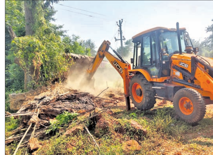
ଜବରଦଖଲ ଉଚ୍ଛେଦ କରାଯାଉଛି ।