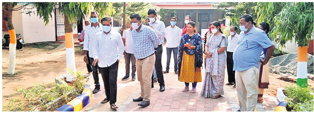
କେନ୍ଦ୍ରୀୟପାଳା ଉଚ୍ଚ ବିଦ୍ୟାଳୟ ଜିଲ୍ଲାପାଳ ପରିଦର୍ଶନ କରୁଛନ୍ତି ।