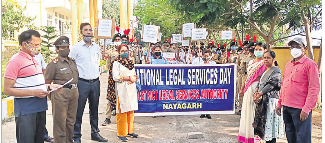
ଜିଲ୍ଲା ଆଇନ ସେବା ପ୍ରାଧିକରଣ ପକ୍ଷରୁ ବାହାରିଥିବା ସଚେତନତା ଗୋଷ୍ଠୀଯାତ୍ରା ।