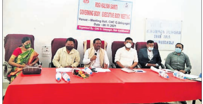
ବୈଠକରେ ଉପସ୍ଥିତ ଅତିଥିମାନେ ।