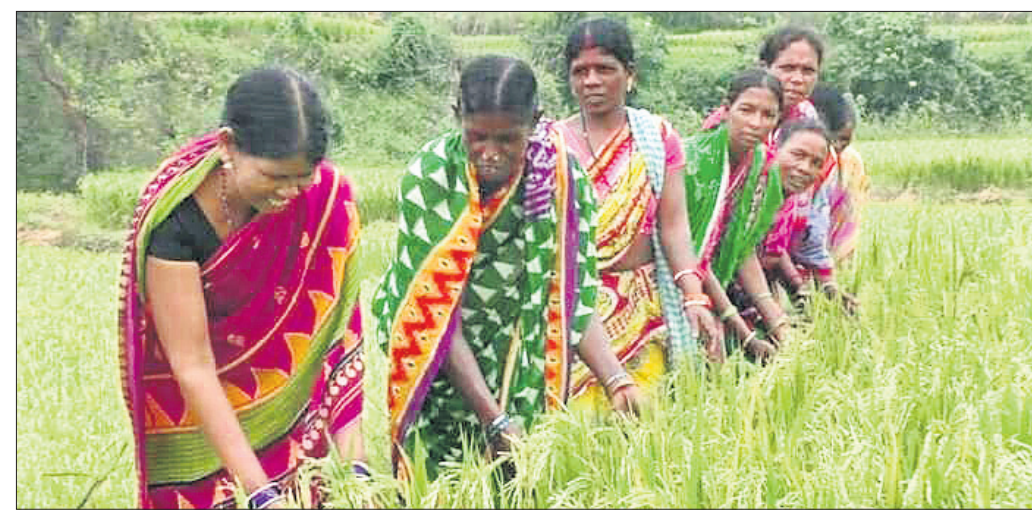
ବାସୁମତୀ ଧାନ ଚାଷ ।

ବାସୁମତୀ ଧାନ ଚାଷ କରି ସ୍ୱାବଲମ୍ବୀ ହେଉଛନ୍ତି ଆଦିବାସୀ ଚାଷୀ ପରିବାର । ଚାଷ ଓ ଚାଷୀଙ୍କ ଉନ୍ନତି ଲାଗି ସରକାର ବିଭିନ୍ନ ଯୋଜନା କରିଆସୁଛନ୍ତି । ହେଲେ ଆଜିର ଦିନରେ ଅଧିକାଂଶ ଚାଷୀ ଚାଷ କାମରୁ ବିପୁଳ ହେଉଥିବା ଦେଖିବାକୁ ମିଳୁଥିବା ବେଳେ ଆର.ଉଦୟଗିରି ବ୍ଲକ ଶବ୍ଦରପଲି ପଞ୍ଚାୟତର ଫଟାଗାଞ୍ଚଡ଼ା ଗ୍ରାମର ଶତାଧିକ ଆଦିବାସୀ ବାସୁମତୀ ଧାନ ଚାଷ କରି ସ୍ୱାବଲମ୍ବୀ ହୋଇଛନ୍ତି । ପୂର୍ବ ଅପେକ୍ଷା ଭଲ ଫସଲ ହେଉଥିବା ବେଳେ ଅଳ୍ପ କମ୍ପରେ ଏବେ ଲାହତି ଭାଙ୍ଗିଛି ସୁନାରେ ଫସଲ; ଯାହାକୁ ନେଇ ବେଶ୍ ଉତ୍ସାହିତ ଅଛନ୍ତି ଏହି ଆଦିବାସୀ ଜନଜାତି ଲୋକ । ପହାଡ଼ ପର୍ବତ ଘେରା ଆଦିବାସୀ ଅଧିକାଂଶ ଗଜପତି ଜିଲ୍ଲା ଆର.ଉଦୟଗିରି ବ୍ଲକ ଶବ୍ଦରପଲି ପଞ୍ଚାୟତର ଫଟାଗାଞ୍ଚଡ଼ା ଗ୍ରାମର