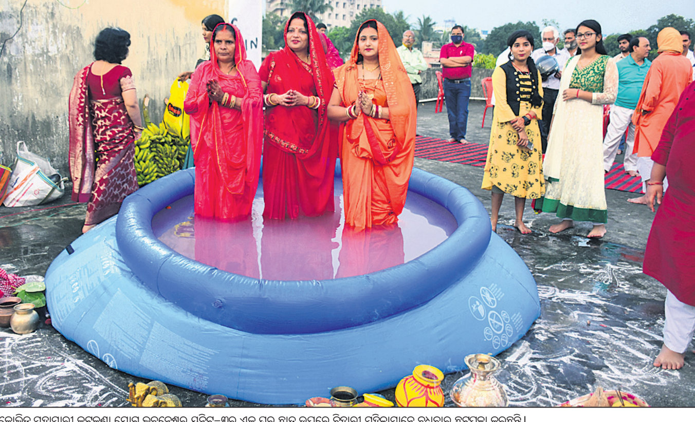
କୋଭିଡ୍ ମହାମାରୀ କଟକଣା ଯୋଗୁ ଭୁବନେଶ୍ୱର ଯୁନିଟ୍-୩ର ଏକ ଘର ଛାତ ଉପରେ ବିହାରୀ ମହିଳାମାନେ ବୁଧବାର ଛବ୍‌ପୁଜା କରୁଛନ୍ତି।