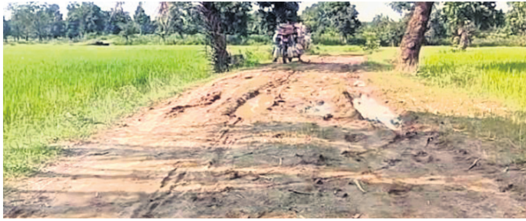
ଖରାପ ହୋଇପଡ଼ିଥିବା ରାସ୍ତା ।

ରାଜ୍ୟ ଓ କେନ୍ଦ୍ର ସରକାର ପ୍ରତ୍ୟେକ ଗ୍ରାମକୁ ବିଭିନ୍ନ ଯୋଜନାରେ ପକ୍ଷାଦତ୍ତ ନିର୍ମାଣ କରୁଛନ୍ତି । ଲୋକଙ୍କ ପାଇଁ ଯୋଜନା ପରେ ଯୋଜନା ହେଉଥିଲେ ସୁଦ୍ଧା ଏଥିରୁ ସେମାନେ ଉପକୃତ ହେଉନାହାନ୍ତି । ପ୍ରଶାସନିକ ଅବହେଳା ଏବଂ ବିଭାଗୀୟ ଅଧିକାରୀଙ୍କ ମନମୁଖି କାର୍ଯ୍ୟ ପାଇଁ ଅନେକ ଯୋଜନା କାର୍ଯ୍ୟକ୍ରମରେ ସମିତ ରହିଯାଉଛି । ଏପରି ଦେଖିବାକୁ ମିଳିଛି ମାଲକାନଗିରି ଜିଲ୍ଲା ଖଇରପୁଟ ବ୍ଲକ୍ କବରକୁଣ୍ଡ ଗ୍ରାମରେ । ଏହି ଗ୍ରାମରେ ୩୦ରୁ ଊର୍ଦ୍ଧ୍ୱ ପରିବାର ବସବାସ କରନ୍ତି । ଗ୍ରାମରୁ ବାହାରିବାକୁ ଯିବାକୁ ଗୋଟିଏ ମାତ୍ର ରାସ୍ତା ଅଛି, ଯାହାକି ପଞ୍ଚାୟତ ସହ ବିଭିନ୍ନ