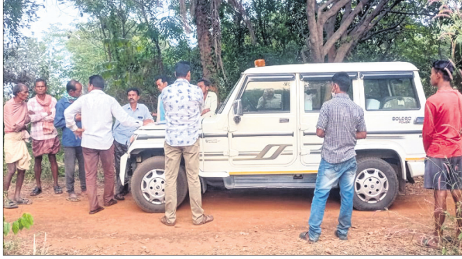
ଘଟଣାସ୍ଥଳରେ ପୋଲିସ୍ ତଦନ୍ତ କରୁଛି।

ଝାରସୁଗୁଡ଼ା ଅଫିସ, ୧୦।୧୧ ଝାରସୁଗୁଡ଼ା ଜିଲ୍ଲା ବନହରପାଲି ଥାନା ପୂଜାରୀପାଲି ଗ୍ରାମରୁ ପୋଲିସ୍ ବୁଧବାର ଜଣେ ବୃଦ୍ଧଙ୍କ ଶତଦିନ ପୂର୍ବରୁ ହତ୍ୟା ହୋଇଥିବା ଜଣାପଡ଼ିଛି। ପୂଜାରୀପାଲି ଗ୍ରାମରୁ ପୋଲିସ୍ ବୁଧବାର ଜଣେ ବୃଦ୍ଧଙ୍କ ଶତଦିନ ପୂର୍ବରୁ ହତ୍ୟା ହୋଇଥିବା ଜଣାପଡ଼ିଛି। ପୂଜାରୀପାଲି ଗ୍ରାମରୁ ପୋଲିସ୍ ବୁଧବାର ଜଣେ ବୃଦ୍ଧଙ୍କ ଶତଦିନ ପୂର୍ବରୁ ହତ୍ୟା ହୋଇଥିବା ଜଣାପଡ଼ିଛି। ପୂଜାରୀପାଲି ଗ୍ରାମରୁ ପୋଲିସ୍ ବୁଧବାର ଜଣେ ବୃଦ୍ଧଙ୍କ ଶତଦିନ ପୂର୍ବରୁ ହତ୍ୟା ହୋଇଥିବା ଜଣାପଡ଼ିଛି।