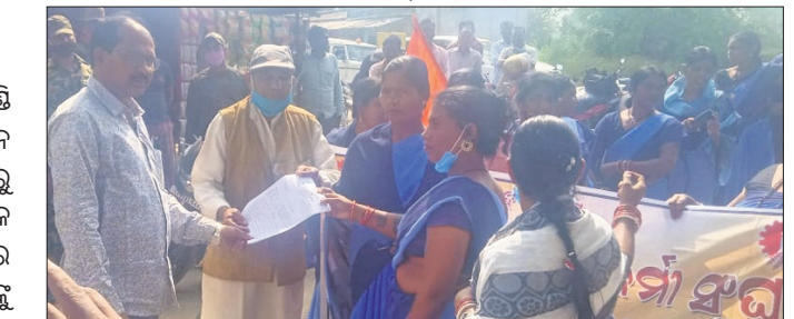
ବିତି ଓ ଦାବିପତ୍ର ଗ୍ରହଣ କରୁଛନ୍ତି।