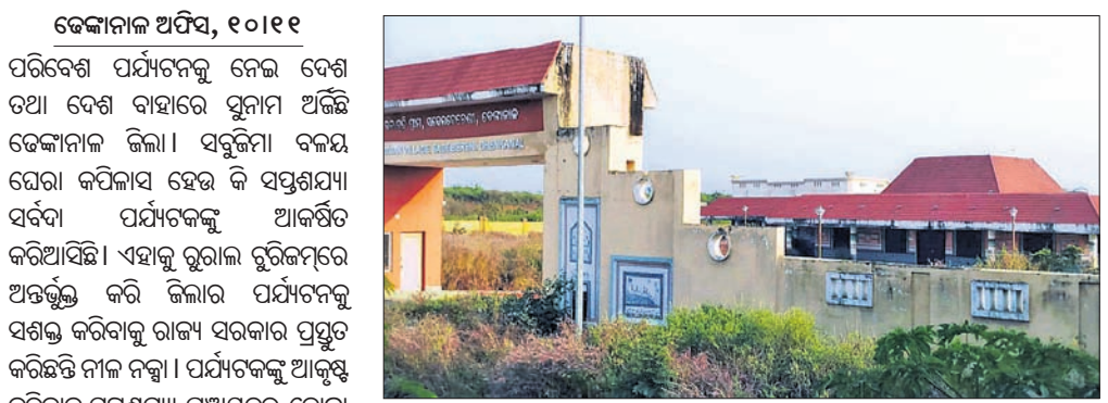
ନବଜୀବନପୁରରେ ନିର୍ମିତ କଳାକୃତି ଗ୍ରାମ।

ପର୍ଯ୍ୟଟନ ପୁରୀକୁ ଆକୃଷ୍ଟ କରିବା ପାଇଁ ୨୦୧୫ରେ ସିପିଏସ୍‌ଆର୍‌ଆଇରେ ୧୨୨ ଏକର ଜମିରେ ଶାମୁକା ପ୍ରକଳ୍ପ ଆରମ୍ଭ କରାଯାଇଥିଲା। ଏହି ପ୍ରକଳ୍ପରେ ବିକାସପୂର୍ଣ୍ଣ ହୋଇଥିବା ସହିତ ଗଲ୍‌ଫ୍ କୋର୍ଟ ଭାବେ କରାଯାଇଥିବା ଯୋଜନା ହୋଇଥିଲା। ଏଥିପାଇଁ ରାଜ୍ୟ ସରକାର ପାର୍ଟି, ସଡ଼କ ଓ ବିଦ୍ୟୁତ୍ ସଂଯୋଗ ସମାପ୍ତ ପ୍ରଥମ ପର୍ଯ୍ୟାୟରେ ୧୨୦ କୋଟି ଟଙ୍କା ଯୋଗାଇ ଦେଇଥିଲେ। ୬ ବର୍ଷ ପରେ ସେହି ପ୍ରକଳ୍ପ ଅଧ୍ୟାୟେ ପଡ଼ିବାରୁ ସେହିପରି କର୍ମକାରୀ ଓ ଧର୍ମାତ୍ମକରେ ଯୋଗଦେଇ ପର୍ଯ୍ୟଟନ ବିଭାଗର ବିକାସପୂର୍ଣ୍ଣ ହୋଇଥିବା ସହିତ ଗଲ୍‌ଫ୍ କୋର୍ଟ ଭାବେ କରାଯାଇଥିବା ଯୋଜନା ହୋଇଥିଲା। ଏଥିପାଇଁ ରାଜ୍ୟ ସରକାର ପାର୍ଟି, ସଡ଼କ ଓ ବିଦ୍ୟୁତ୍ ସଂଯୋଗ ସମାପ୍ତ ପ୍ରଥମ ପର୍ଯ୍ୟାୟରେ ୧୨୦ କୋଟି ଟଙ୍କା ଯୋଗାଇ ଦେଇଥିଲେ।