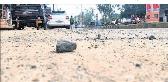
ଗାତକୁ ବାହାରି ରାସ୍ତାରେ ବିଛେଇହୋଇ ପଡ଼ିଥିବା ଗୋଡ଼ି ଓ ଚିପ୍‌ସ।

ରାଜ୍ୟ ରାଜପଥ ୩୯ ଓ ୪୦ ଯାଇଛି। ୩୯ ନମ୍ବର ରାଜ୍ୟ ରାଜପଥ ମଧ୍ୟରେ ଅନେକ ଗର୍ଭ ରହିଥିବା ନେଇ ଖବର ପ୍ରକାଶ ସହ ବାରମ୍ବାର ପୂର୍ଣ୍ଣ ବିଭାଗର ଦୃଷ୍ଟି ଆକର୍ଷଣ କରାଯାଇଛି। ଏହା ସତ୍ତ୍ୱେ ମଧ୍ୟ ଏଠାରେ କାମ ହୋଇପାରୁନାହିଁ। ସାମାଜିକ କେନ୍ଦ୍ରମଣ୍ଡାଳ ଗପ୍ତକୁ ଦୃଷ୍ଟିରେ ରଖି ବିଭାଗୀୟ ଅଧିକାରୀ ମୌନ ଭାଙ୍ଗି ତତ୍ପରତା ଦେଖାଇ ସମସ୍ତ ୧୨୭ ଗାତ ସହ ଅନ୍ୟ କେତେକ ଗର୍ଭକୁ ମଧ୍ୟ ପଥରଗୁଣ୍ଡ, ବାଲି, ଗୋଡ଼ି ମିଶା ମସଲା ଦ୍ୱାରା ସମତୁଲ କରିଛନ୍ତି। କିନ୍ତୁ କାମଚଳୁ ନ ଥିବାରୁ ଗାତଗାତ କରିଯାଇଛି। ଏଥିରେ ପାଣି ମଧ୍ୟ ପକାଯାଇ ନାହିଁ। ନିମ୍ନମାନର କାମ ହେତୁ ଉଚ୍ଚ ଗୋଡ଼ି ପଥରଗୁଣ୍ଡ