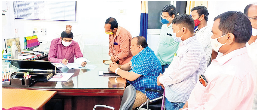
ଅତିରିକ୍ତ ଜିଲ୍ଲାପାଳଙ୍କୁ ଭେଟି ସ୍ୱାକୃତିପ୍ରାପ୍ତ କମ୍ପ୍ୟୁଟର ସଂସ୍ଥାର କର୍ମକାରୀମାନେ ଆଲୋଚନା କରୁଛନ୍ତି।