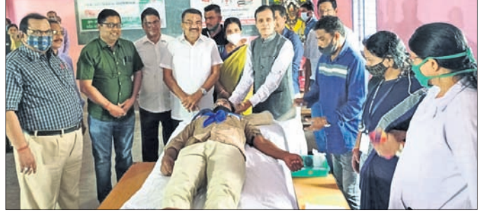
ରକ୍ତଦାନ ଶିବିରରେ ଉପସ୍ଥିତ ଅତିଥିବୃନ୍ଦ।