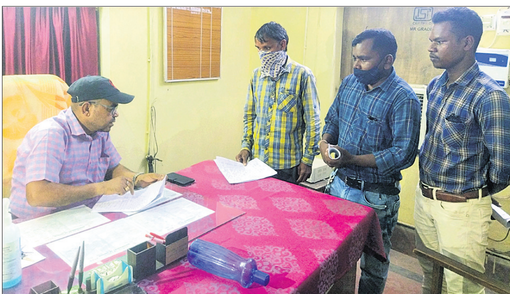
ଚାଷୀମାନେ ଏଆରସିଏସ୍ଙ୍କୁ ଦାବିପତ୍ର ପ୍ରଦାନ କରୁଛନ୍ତି।

ନୟାଗଡ଼ ଜିଲ୍ଲା ଦଶପଲ୍ଲୀ ବ୍ଲକ୍ ଚଢ଼େଇପଲ୍ଲୀ ସେବା ସମବାୟ ସମିତି ଲିଷ୍ଟରେ ଚାଷୀଙ୍କ ଅଜାଣତରେ ସେମାନଙ୍କ ନାମରେ କୃଷି ରଣ ଉଠୁଛି। ମଞ୍ଜିରେ ଧାନ ବିକ୍ରି କରାଯାଇ ନ ଥିଲେ ମଧ୍ୟ ଚାଷୀଙ୍କ ଆକାରକୁ ଚଳାଣି ଆସୁଛି। ଚାଷୀଙ୍କ ଅଜାଣତରେ ସମ୍ପାଦକ ଏପିଟି ଦୁର୍ନୀତି କରୁଥିବା ଅଭିଯୋଗ ହୋଇଛି। କାଗଜପତ୍ର ଯାଞ୍ଚ ନାଁରେ ଆକାରକୁ ଓ ଚେକ୍ ସମ୍ପାଦକ ନେଇ ଫେରାଉ ନ ଥିବାରୁ ଚାଷୀ ରଣ, ଧାନ ଚଳାଣି ସମ୍ପର୍କରେ ଜାଣି ପାରୁନାହାନ୍ତି। ପୁଣି ସାର ବ୍ୟବହାର ଦୁର୍ନୀତି ହୋଇଥିବାର ଅଭିଯୋଗ ହୋଇଛି। ଏନେଇ କେତେଜଣ ଚାଷୀ ମଙ୍ଗଳବାର ନୟାଗଡ଼ ସହକାରୀ ନିବନ୍ଧକ ସମୂହ (ଏଆରସିଏସ୍)ଙ୍କ ନିକଟରେ ଫେରାଦ ହୋଇ ଏହି ଦୁର୍ନୀତିର ତଦନ୍ତ ପାଇଁ ଦାବି କରିଛନ୍ତି।