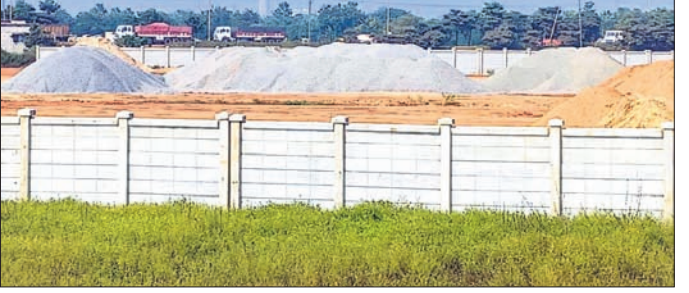
କଳିଙ୍ଗନଗର ଦିଗାୟତପୁର ଛକ ନିକଟରେ ଥିବା ଚିସ୍ ଯାତ।