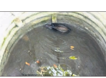
ଫସଲ ଉଚ୍ଚାଡ଼ି ଦେଉଥିବା ଅଭିଯୋଗ ହେଉଛି। ବାରୁହାକ ଉପଦ୍ରବ ଯୋଗୁ

ଜନସମିତି ଅଞ୍ଚଳକୁ ଚାଲି ଆସି ଫସଲ ନଷ୍ଟ କରୁଛନ୍ତି। ଖଣ୍ଡପଡ଼ା ଓ ଭାପୁର ବ୍ଲକ ଅଧୀନ ସିଧାମୁଲୀ, ବାଣପୁର, ପଥରକନ୍ଦା, ମାଧପୁର, କରବର ଆଦି ଅଞ୍ଚଳର ଚାଷୀମାନେ ନଦୀପଠା ଓ ଚନ୍ଦ୍ରସିଂହାଳ ଜମିରେ ଚିନାବାଦାମ, ପନିପରିବା ଚାଷ କରି ପରିବାର ଗୁଜରାଣ ମେଣ୍ଟାଇଥାନ୍ତି। ଏବେ ବାରୁହାକ ଯୋଗୁ ସବୁ ଫସଲ ନଷ୍ଟ ହେବାରେ ଲାଗିଛି। ମଙ୍ଗଳବାର ଏକ ବାରୁହା