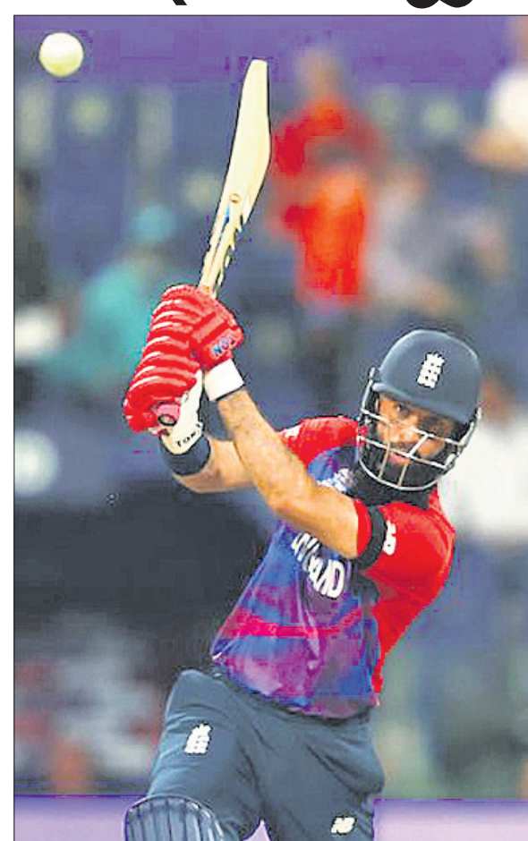
ଅର୍ଦ୍ଧଶତକୀୟ ଇନିଂସ ଅବସରରେ ଇଂଲଣ୍ଡର ମୋଇନ ଅଲୀ।

ତଳିତ ତିନି ଦିନ ବିଶ୍ୱକପର ଫାଇନାଲରେ ପ୍ରବେଶ କରିଛନ୍ତି ଦୁପିଲୀୟା। ରୁଧିର ଅନୁଷ୍ଠିତ ପ୍ରଥମ ସେମିଫାଇନାଲରେ ଦୁପିଲୀୟା ୫ ଉଚ୍ଚକେତରେ ଇଂଲଣ୍ଡକୁ ପରାସ୍ତ କରିଛନ୍ତି। ଇଂଲଣ୍ଡ ୨୦ ଓଭରରେ ୪ ଉଚ୍ଚକେତ ହରାଇ ୧୬୬ ରନ କରିଥିଲା। ଦୁପିଲୀୟା ଏକଦା ୧୩ ରନରେ ମାର୍ଟିନ ଗୁପ୍ଟିଲ ଓ ଅଧିନାୟକ କେନ୍ ଫ୍ରିଲିୟମସନଙ୍କ ଉଚ୍ଚକେତ ହରାଇ ବିପଦରେ ପଡିଥିଲେ ହେଁ ତାରିଲ ମିଡେଲ ଓ ଡେଭନ କନଫ୍ରେଙ୍କ ବିଶ୍ୱାସର ବ୍ୟାଟିଂ ସହାୟତାରେ ୧୯ ଓଭରରେ ୫ ଉଚ୍ଚକେତ ହରାଇ ୧୬୭ ରନ ସଂଗ୍ରହ କରି ନେଇଥିଲା। ମିଡେଲ ମ୍ୟାଚ ବିଜୟୀ ଇନିଂସ ଖେଳି ଦୁପିଲୀୟାକୁ ପ୍ରଥମଥରପାଇଁ ତିନିଦିନ ବିଶ୍ୱକପର ଫାଇନାଲରେ ପହଞ୍ଚାଇଥିଲେ। ସେ ୪୭ ବଲରୁ ୪ଟି ଲେଖାଏ ବୋଲି ଓ ଛକା ସହାୟତାରେ ୭୨ ରନରେ ଅପରାଜିତ ରହି ଗୋଟିଏ ଓଭର ବାକିଆଇ ମ୍ୟାଚର ପରିସମାପ୍ତି ଘଟାଇଥିଲେ। କନଫ୍ରେ ୩୮ ବଲରୁ ୫ ବୋଲି ଓ ୧ ଛକା ସହାୟତାରେ ୪୬ ଏବଂ ଜେମ୍ସ ନିଶାମ ୧୧ ବଲରୁ ୧ ବୋଲି ଓ ୩ ଛକା ସହ ୨୭ ରନର ଉପଯୋଗୀ ଇନିଂସ ଖେଳିଥିଲେ।