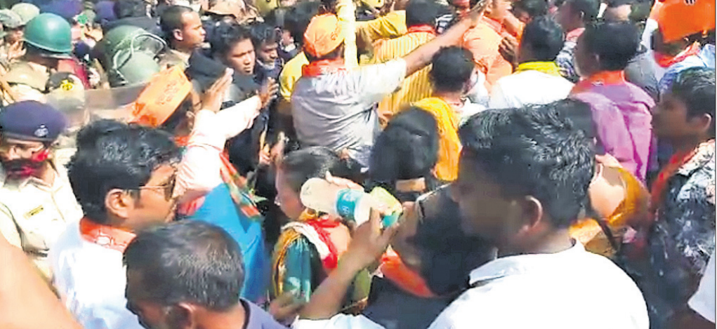
ବିକ୍ଷୋଭ ବେଳେ ଭାଜପା କର୍ମୀ- ପୋଲିସ୍ ଠେଲାପେଲା।

ବିଧାୟକଙ୍କ ସହ ବିକ୍ଷୋଭ ଭାଜପା ନେତୃତ୍ୱ ସମ୍ପୃକ୍ତ ଭେଡି ଦାବିପତ୍ର ପ୍ରଦାନ କରିବେ ବୋଲି କହିବାକୁ ପୋଲିସ୍ କର୍ମଚାରୀମାନେ ପ୍ରତିରୋଧ କରିଥିଲେ। ଏହାକୁ ନେଇ ଘଟଣାସ୍ଥଳରେ ବ୍ୟାରିକେଡ୍ ନିର୍ମାଣ କରାଯାଇ ପୋଲିସ୍ ଛାଡ଼ି କରାଯାଇଥିଲା।