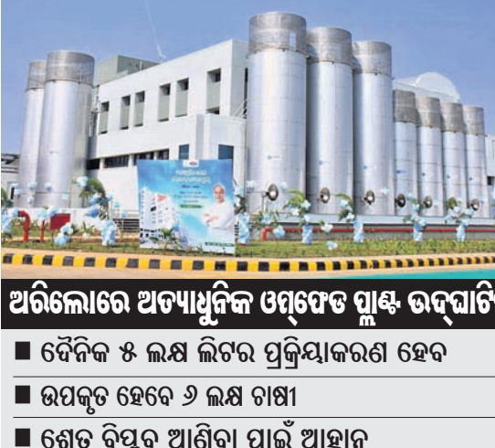
ଅଭିଳୋଚନାରେ ଅତ୍ୟାଧୁନିକ ଓମ୍‌ପ୍ରେକ୍‌ଡ ପ୍ଲାଣ୍ଟ ଉଦ୍ଘାଟନ କରାଯାଇଛି।