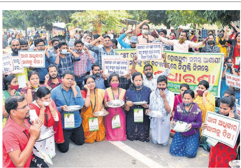
୬ ଦମ୍ପା ଦାବି ନେଇ ମିଳିତ ବସ୍ତି ଅଭିଯାନ ପକ୍ଷରୁ ରୁଧିରା କଟକ ଜିଲ୍ଲାପାଳଙ୍କ କାର୍ଯ୍ୟାଳୟ ସମ୍ମୁଖରେ ବିରୋଧ ।