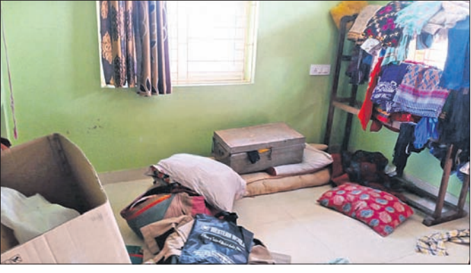
ଗ୍ୟାଙ୍ଗ ମୁଖ୍ୟ ବୁକୁକ କେନାକ ଘରେ ପୋଲିସ ଯାଞ୍ଚ ସମୟରେ ପଡିରହିଥିବା ସାମଗ୍ରୀ ।