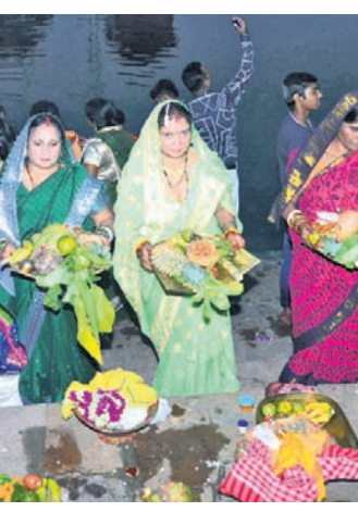
ପୁରୀ ନରେନ୍ଦ୍ର ପୁସ୍ତକାଳୟ ପରିସରରେ ରୁଧିରା ପୁରୀ ସମ୍ପ୍ରଦାୟର ମହିଳାମାନେ ଛବିପୂର୍ଣ୍ଣ ପାଳନ କରୁଛନ୍ତି।

ପୁରୀ ଜିଲ୍ଲା ଭଳି ଏହି ତାଲିକା ହୋଇଥିବା ସେ କହିଛନ୍ତି। ବାଲୁଆଁ ଏନ୍ଏସିରେ ୧୧ଟି ଖାର୍ଡ ରହିଛି।