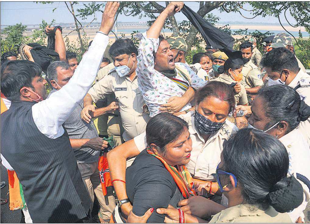
ମୁଖ୍ୟମନ୍ତ୍ରୀଙ୍କ ଗସ୍ତ ସମୟରେ କଳାପତାକା ପ୍ରଦର୍ଶନ କରୁଥିବା ଭାଜପା କର୍ମୀଙ୍କୁ ପୋଲିସ୍ ଗିରଫ କରିନେଇଛି।