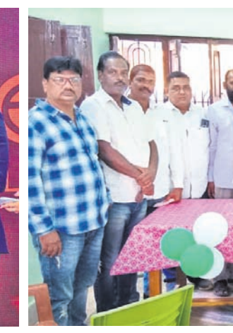
ଖୋର୍ଦ୍ଧା ବିଜେଡି ସାଙ୍ଗଠନିକ ବୈଠକରେ ବିଧାୟକ ଜ୍ୟୋତିରାମ୍ ନାଥ ମିତ୍ରଙ୍କ ସହ ଉପସ୍ଥିତ ନବନିଯୁକ୍ତ କର୍ମଚାରୀମାନେ।