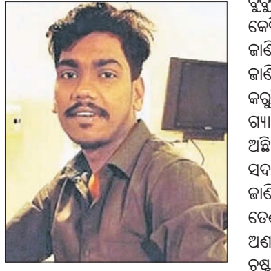
ବୁକୁକ ଫାଇଲ୍ ପରେ ।