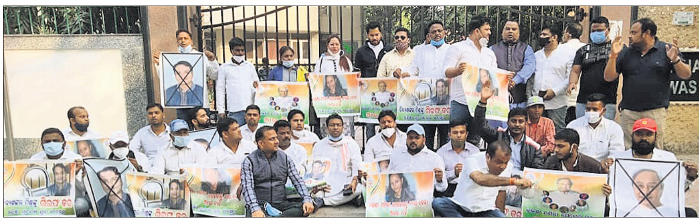
ଓଡ଼ିଶା ଯୁବ କଂଗ୍ରେସର ଶତାଧିକ କର୍ମୀ ରୁଧିର ଦିଲ୍ଲୀରେ ଓଡ଼ିଶା ସରକାରଙ୍କ ଆବାସିକ କର୍ମଚାରୀଙ୍କୁ କାର୍ଯ୍ୟାଳୟ ଯୋଗାଇ କରିଛନ୍ତି।

ଦୋଷୀଙ୍କୁ କଠୋର ଦଣ୍ଡ ଦେବା ପର୍ଯ୍ୟନ୍ତ କେବଳ କାରି ରଖିବା ପ୍ରତିବାଦ ସ୍ୱରୂପ ୧୧ ତାରିଖ ଗୁରୁବାର ଯତ୍ନମତ୍ତରଠାରେ ଗଣଧାରଣା ଦିଆଯିବ।