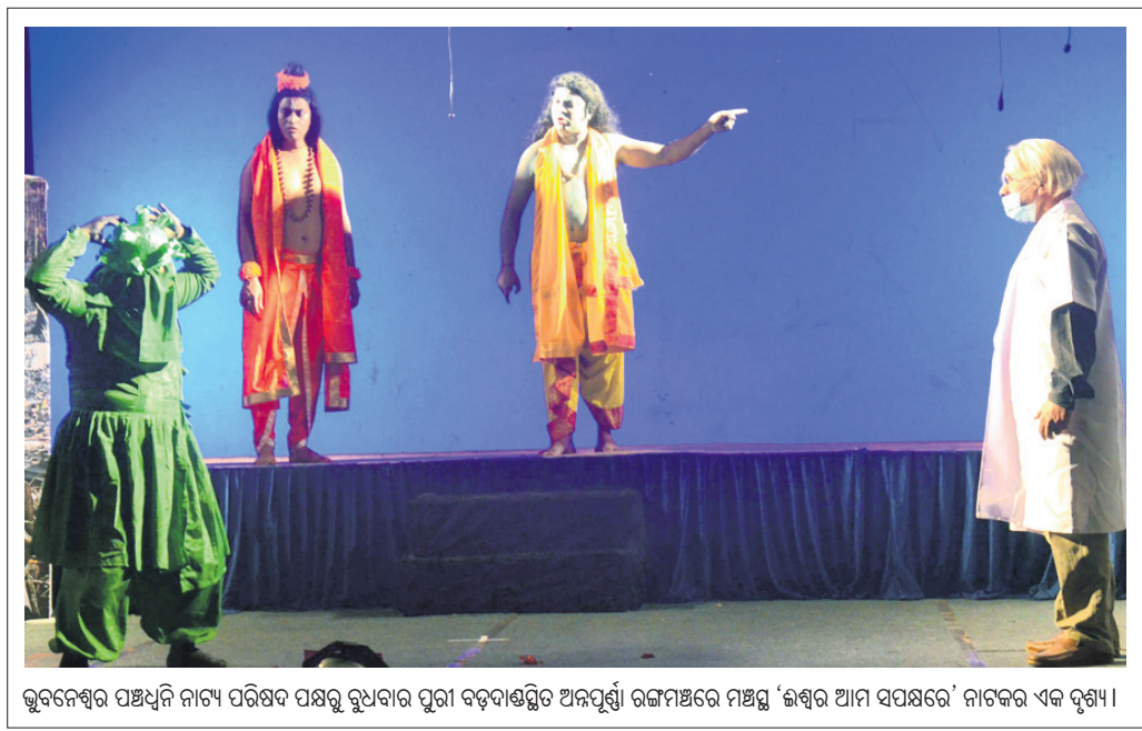
ଭୁବନେଶ୍ୱର ପଞ୍ଚମ ନାଟ୍ୟ ପରିଷଦ ପକ୍ଷରୁ ରୁଧିରା ପୁରୀ ବଡ଼ଦାଣ୍ଡରେ ଅନୁଷ୍ଠିତ ନଟ୍ୟମଣ୍ଡଳରେ ମଞ୍ଚସ୍ଥ 'ଶୃଙ୍ଖଳା ଆମ ସପକ୍ଷରେ' ନାଟକର ଏକ ଦୃଶ୍ୟ।

ଖୋର୍ଦ୍ଧା ଅଧିକାରୀ, ୧୦।୧୧ ବିଜେଡି ପୁସ୍ତକାଳୟ ଓ ଆରମ୍ଭ କରାଯାଇଛି। ଖୋର୍ଦ୍ଧା ବିଜେଡି ପୁସ୍ତକାଳୟ ଓ ଆରମ୍ଭ କରାଯାଇଛି। ଖୋର୍ଦ୍ଧା ବିଜେଡି ପୁସ୍ତକାଳୟ ଓ ଆରମ୍ଭ କରାଯାଇଛି।