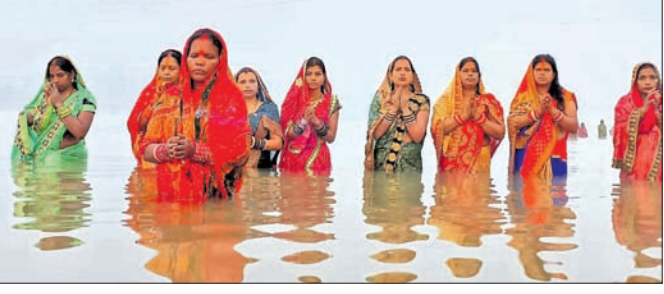
ବ୍ରତଧାରୀମାନେ ସୂର୍ଯ୍ୟକୁ ଅର୍ପଣ କରୁଛନ୍ତି ।

ରାଉରକେଲା ସ୍ମାର୍ତ୍ତସିଟିରେ ଗୁରୁବାର ଛତ୍ତପତ୍ରା ଅନୁଷ୍ଠିତ ହୋଇଛି । ଏହି କ୍ରମରେ ଭୋର ୪ଟାରେ ଶ୍ରୀକାଳୀମାନେ ସହରର ରୋପବନ୍ଧୁପାଳି ପୋଖରୀ ଘାଟ, ବାଲୁଘାଟ, ତିଏଳି ପୋଖରୀ ଘାଟ,