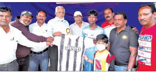
ଅତିଥିମାନେ କୃତା ଖେଳାଳିମାନଙ୍କୁ ପୁରସ୍କୃତ କରୁଛନ୍ତି ।

ସମ୍ବାଦପତ୍ରିକା ଜିଲ୍ଲାସ୍ତରୀୟ କ୍ଲବ୍ ଚୁନାମେଣ୍ଟରେ ଫାଇନାଲରେ ଫୁଟବଲ ପ୍ରଦେଶ କ୍ଲବ୍ ଓ ହିନ୍ଦ କ୍ଲବ୍ ବିଜୟୀ ହୋଇଛନ୍ତି । ଆୟୋଜକ ଏମ୍‌ସିସି ପେନ୍‌ସନ୍‌ପଡ଼ାର ୧୩ ତାରିଖରେ ବୀର ପୁରସ୍କୃତ ସାଧ୍ୟ ସ୍ମୃତିମ୍‌ସରେ ଏହିପ୍ରକାର ମଧ୍ୟରେ ଫାଇନାଲ ମ୍ୟାଚ ହେବ ।