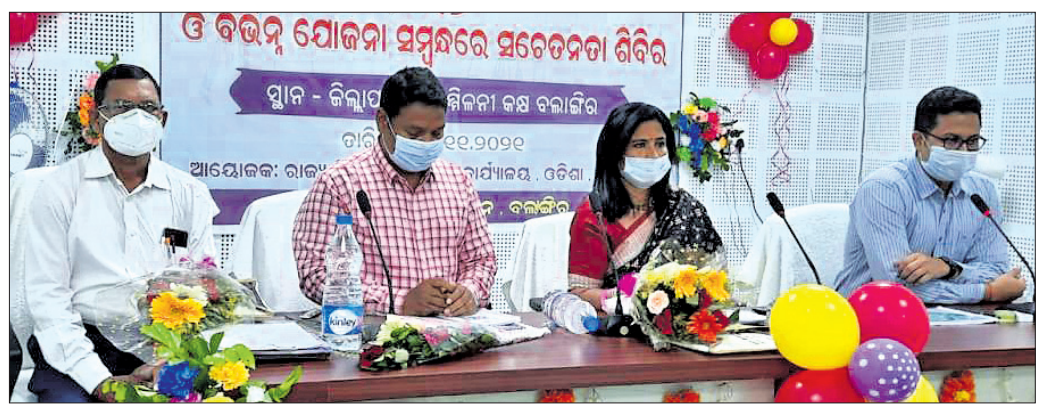
ଭିତ୍ତରେ ସଚେତନତା ଶିବିରରେ ଉପସ୍ଥିତ ଅତିଥି ବୃନ୍ଦ।