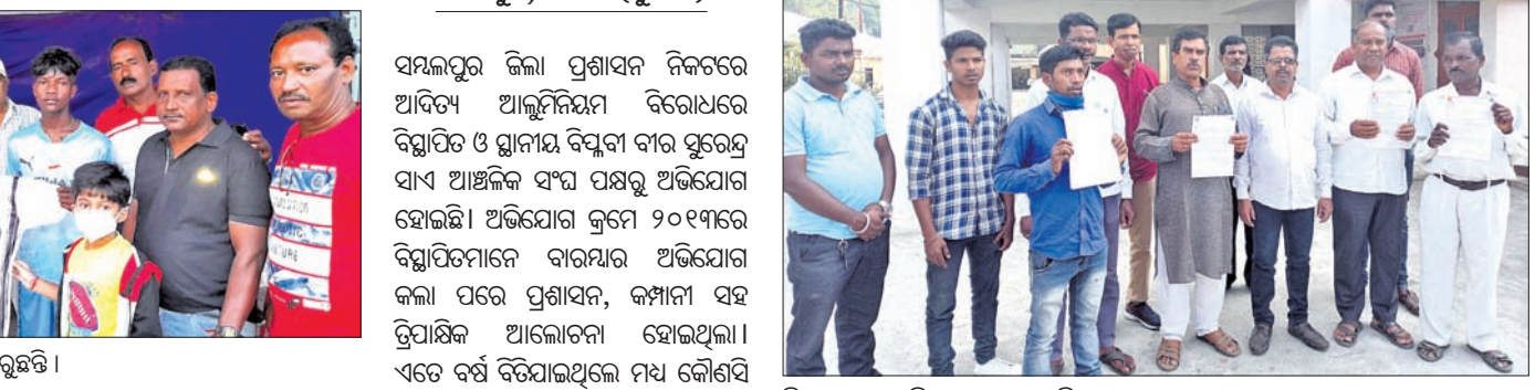
ଜିଲାପାଳଙ୍କ ଅଧିକାରୀଙ୍କୁ ଅଭିଯୋଗ କରାଯାଇଛି ।

ସମ୍ବାଦପତ୍ରିକା ଜିଲ୍ଲା ପ୍ରଶାସନ ନିକଟରେ ଆଦିତ୍ୟ ଆଲୁମିନିୟମ ବିରୋଧରେ ଦିଆଯାଇଥିବା ଉଲ୍ଲାପକୁ ବିଚାର କରିବା ପାଇଁ ଆନୁରୋଧ କରାଯାଇଛି ।