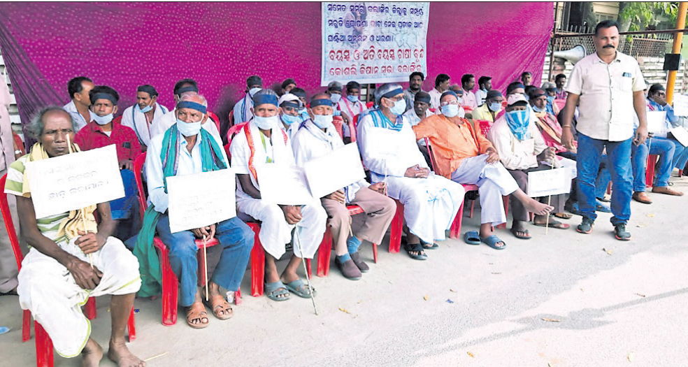
ଜିଲ୍ଲାପାଳଙ୍କ କାର୍ଯ୍ୟାଳୟ ସମ୍ମୁଖରେ କୋଶଳା କିଶୋରୀ ସଭା ପକ୍ଷରୁ ଧାରଣା ଦିଆଯାଇଥିଲା।

ବଲାଙ୍ଗୀର ଜିଲ୍ଲା ଲୋକସଭା ନିର୍ବାଚନ ମଣ୍ଡଳୀ ସହ ସମଗ୍ର ଜିଲ୍ଲାକୁ ସମ୍ପୂର୍ଣ୍ଣ ମରୁଡ଼ି ଘୋଷଣା ଦାବି ନେଇ କୋଶଳା କିଶୋରୀ ସଭା ପକ୍ଷରୁ ଗୁରୁବାର ଜିଲ୍ଲାପାଳ କାର୍ଯ୍ୟାଳୟ ସମ୍ମୁଖରେ ଧାରଣା ଦିଆଯାଇଥିଲା।