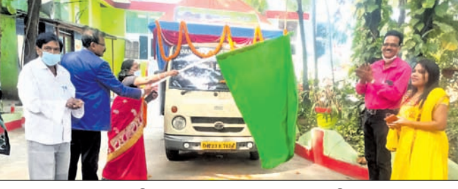
ସଚେତନତା ରଥକୁ ପୁଷ୍ପାଧିକାରୀ ପତାକା ଦେଖାଇ ଶୁଭାଚରଣ କରୁଛନ୍ତି ।

ବ୍ରଜରାଜନଗର ପୋଷ୍ୟ ସନ୍ତାନ ଗ୍ରହଣ କେନ୍ଦ୍ର ପକ୍ଷରୁ ଶିଶୁ ସୁରକ୍ଷା ନେଇ ଏକ ସଚେତନତା ରଥ ଗୁରୁବାର ବାହାରିଥିଲା ।