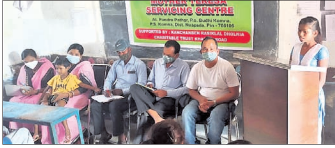
କାର୍ଯ୍ୟକ୍ରମରେ ଉପସ୍ଥିତ ଶିକ୍ଷୟିତ୍ରୀ, ଶିକ୍ଷକମାନେ।