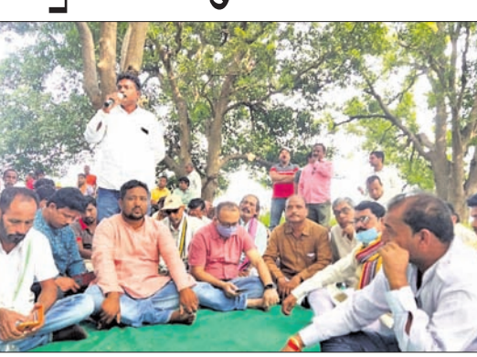
ସୁଲଭା କଂଗ୍ରେସ କର୍ମୀ ସମ୍ମିଳନୀରେ ଉପସ୍ଥିତ ବକ୍ତାମାନେ।

ସୁଲଭା କଂଗ୍ରେସ କର୍ମୀ ସମ୍ମିଳନୀରେ ଉପସ୍ଥିତ ବକ୍ତାମାନେ। ଏହି କାର୍ଯ୍ୟକ୍ରମରେ କଂଗ୍ରେସ କର୍ମୀ ସମ୍ମିଳନୀରେ ଉପସ୍ଥିତ ବକ୍ତାମାନେ।