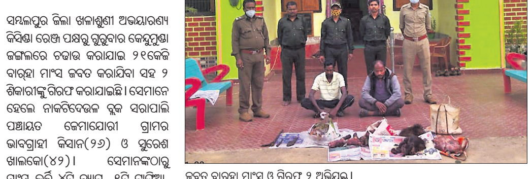
ଜବତ ବାରୁଆ ମାଂସ ଓ ଗିରଫ ୨ ଅଭିଯୁକ୍ତ ।