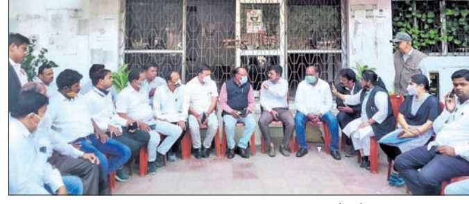
ତହସିଲ ଅଧିକାରୀଙ୍କୁ ଅଭିଯୋଗ କରାଯାଇଛି ।