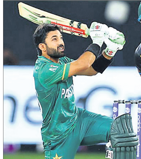
ଅର୍ଦ୍ଧଶତକୀୟ ଇନିଂସ ଅବସରରେ ପାକିସ୍ତାନ ମହମ୍ମଦ ରିଜପ୍ଟାନ।

ବୁବାଇ, ୧୧/୧୧ ଟି୨୦ କ୍ରିକେଟ ବିଶ୍ୱକପର ଗୁରୁତ୍ୱପୂର୍ଣ୍ଣ ଅଞ୍ଚଳିଆ ବିପକ୍ଷ ଦ୍ୱିତୀୟ ସେମିଫାଇନାଲରେ ପାକିସ୍ତାନ ମହମ୍ମଦ ରିଜପ୍ଟାନ ଓ ଫଖର ଜମାନ ଅର୍ଦ୍ଧଶତକ ହାସଲ କରିଛନ୍ତି। ଫଳରେ ପାକିସ୍ତାନ ୨୦ ଓଭରରେ ୪ ଉଇକେଟ ହରାଇ ୧୭୬ ରନ ସଂଗ୍ରହ କରିଛି।