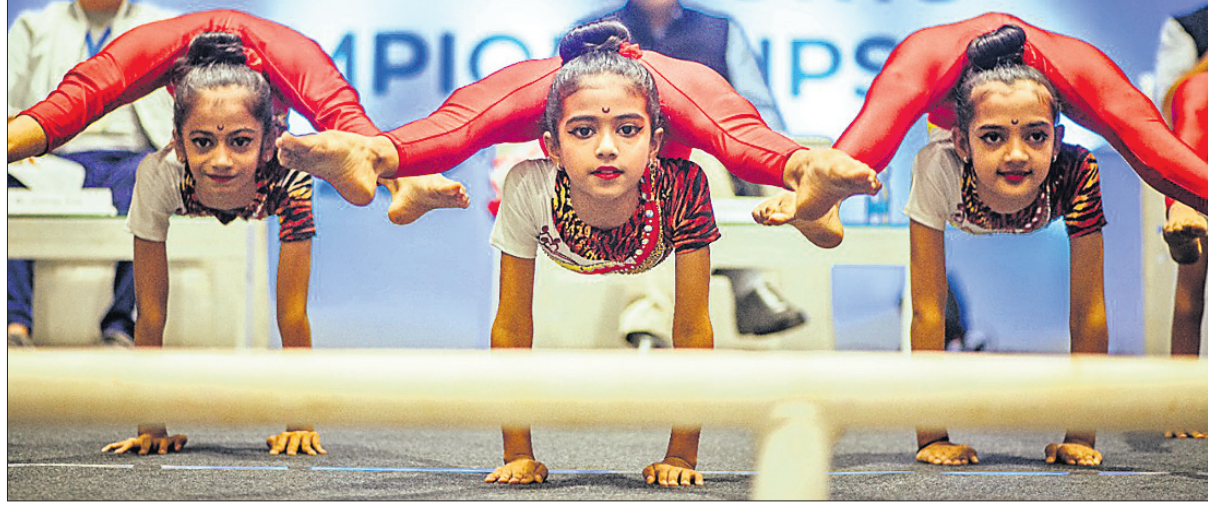
ଜାତୀୟ ଯୋଗାସନ ଚାମ୍ପିୟନଶିପ୍ ପ୍ରଥମ ଦିବସରେ ୩ ବାକିଲା ଯୋଗ ପ୍ରଦର୍ଶନ କରୁଛନ୍ତି ।