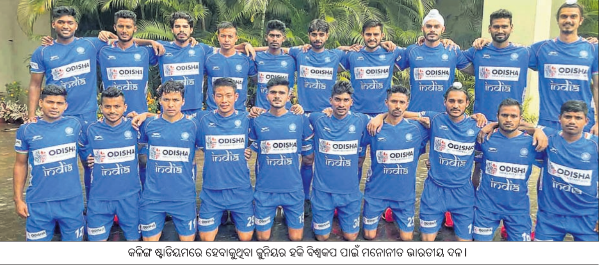
କଳିଙ୍ଗ ଷ୍ଟାଡ଼ିୟମରେ ହେବାକୁଥିବା ଭୁବନେଶ୍ୱର ହକି ବିଶ୍ୱକପ ପାଇଁ ମନୋନୀତ ଭାରତୀୟ ଦଳ ।