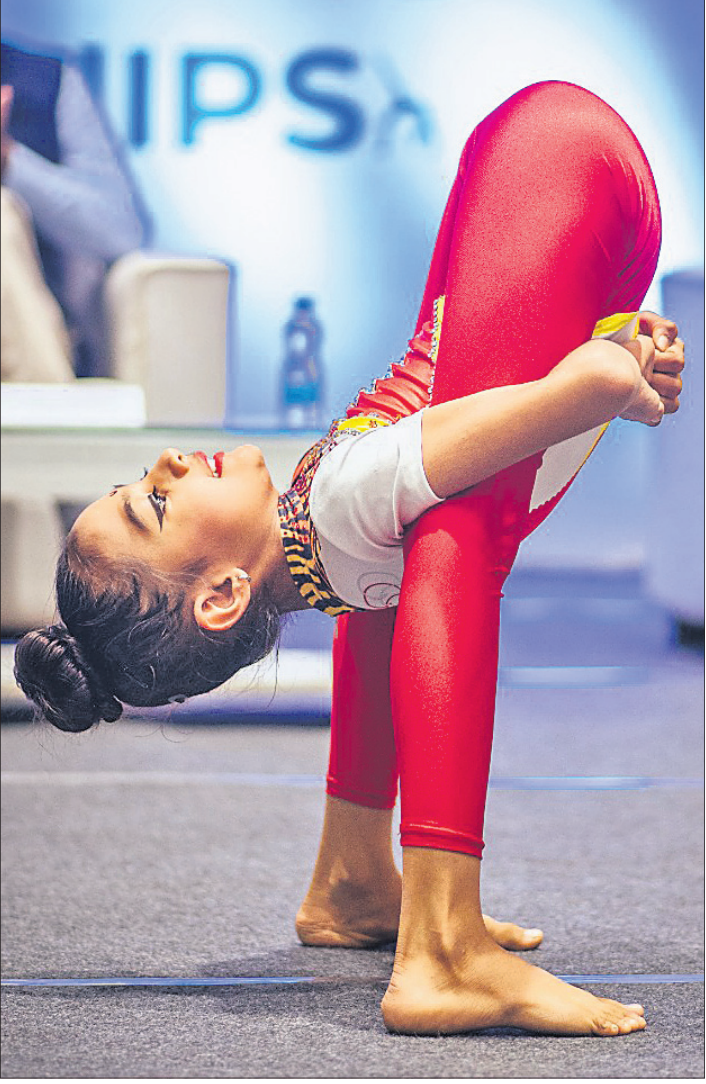
କିଟ୍ ବିଶ୍ୱବିଦ୍ୟାଳୟ ଇନ୍ଦ୍ରଦୋର ଷ୍ଟାଡ଼ିୟମରେ ଗୁରୁବାର ଉଦ୍‌ଘାଟିତ ଜାତୀୟ ଯୋଗାସନ ଚାମ୍ପିୟନସ୍‌ସ୍‌ପରେ ଜଣେ ପ୍ରତିଯୋଗୀ ଯୋଗ ପ୍ରଦର୍ଶନ କରୁଛନ୍ତି ।