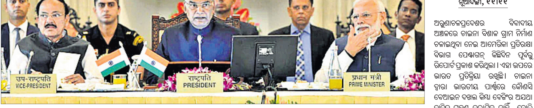
ରାଜ୍ୟପାଳ ସମ୍ମିଳନୀରେ ବାମରୁ ଉପରାଷ୍ଟ୍ରପତି ଏନ୍. ଭେଙ୍କାୟା ନାଜଡୁ, ରାଷ୍ଟ୍ରପତି ରାମନାଥ କୋବିନ୍ଦ ଓ ପ୍ରଧାନମନ୍ତ୍ରୀ ନରେନ୍ଦ୍ର ମୋଦି।

ନୂଆଦିଲ୍ଲୀ, ୧୧ ନଭେମ୍ବର (ପି.ଟି.): ରାଜ୍ୟପାଳମାନେ ସରକାର ଏବଂ ଜନସାଧାରଣଙ୍କ ପାଇଁ ବନ୍ଧୁ, ଦାମ୍ଭିକ ଓ ପଥ ପ୍ରଦର୍ଶକ ଭଳି ବୋଲି ସମ୍ବିଧାନ ପ୍ରଣେତାମାନେ ପରିକଳ୍ପନା କରିଥିଲେ। ତେଣୁ ସେମାନେ ରାଜ୍ୟଗୁଡ଼ିକ ପ୍ରତି ଯଥାସମ୍ଭବ ଅଧିକ ସମୟ ଦେବା ଏହା ଜନସାଧାରଣଙ୍କ ପ୍ରତ୍ୟକ୍ଷ ସମ୍ପର୍କରେ ରହିବା ଆବଶ୍ୟକ। ଗୁରୁବାର ରାଜ୍ୟପାଳ ଓ ଉପରାଜ୍ୟପାଳମାନଙ୍କ ଦିବସବ୍ୟାପୀ ସମ୍ମିଳନୀକୁ ଉଦ୍‌ବୋଧନ ଦେଇ