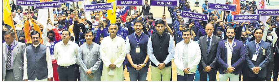
ଜାତୀୟ ଯୋଗାସନ କ୍ରୀଡ଼ା ଚାମ୍ପିୟନଶିପ୍ ଉଦ୍ଘାଟନା ଅବସରରେ ପ୍ରତିଯୋଗୀଙ୍କ ସହ ଅତିଥିମାନେ ।