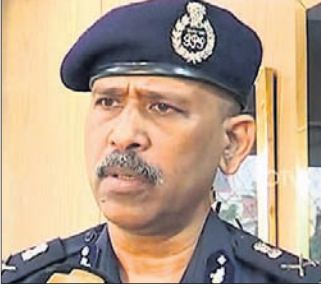
ନୂଆଦିଲ୍ଲୀ, ୧୧ ନଭେମ୍ବର

ଏସ୍.ଏନ୍. ପ୍ରଧାନ ହେଲେ ପୂର୍ଣ୍ଣକାଳୀନ ଏନ୍‌ସିଭି ଡିଭି