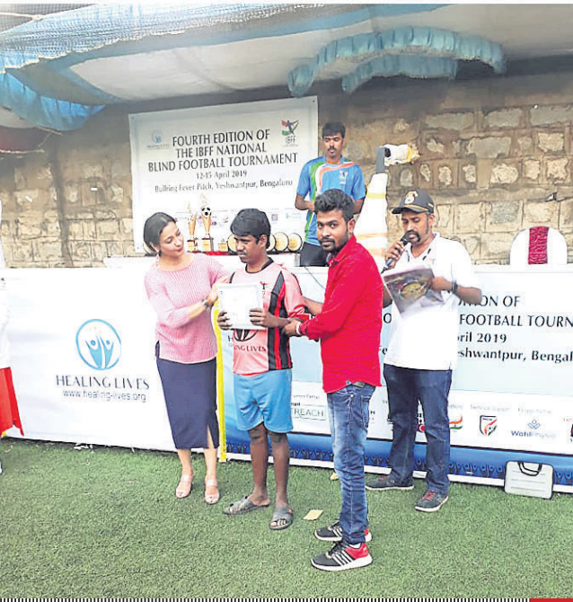
HEALING LIVES www.healinglives.org