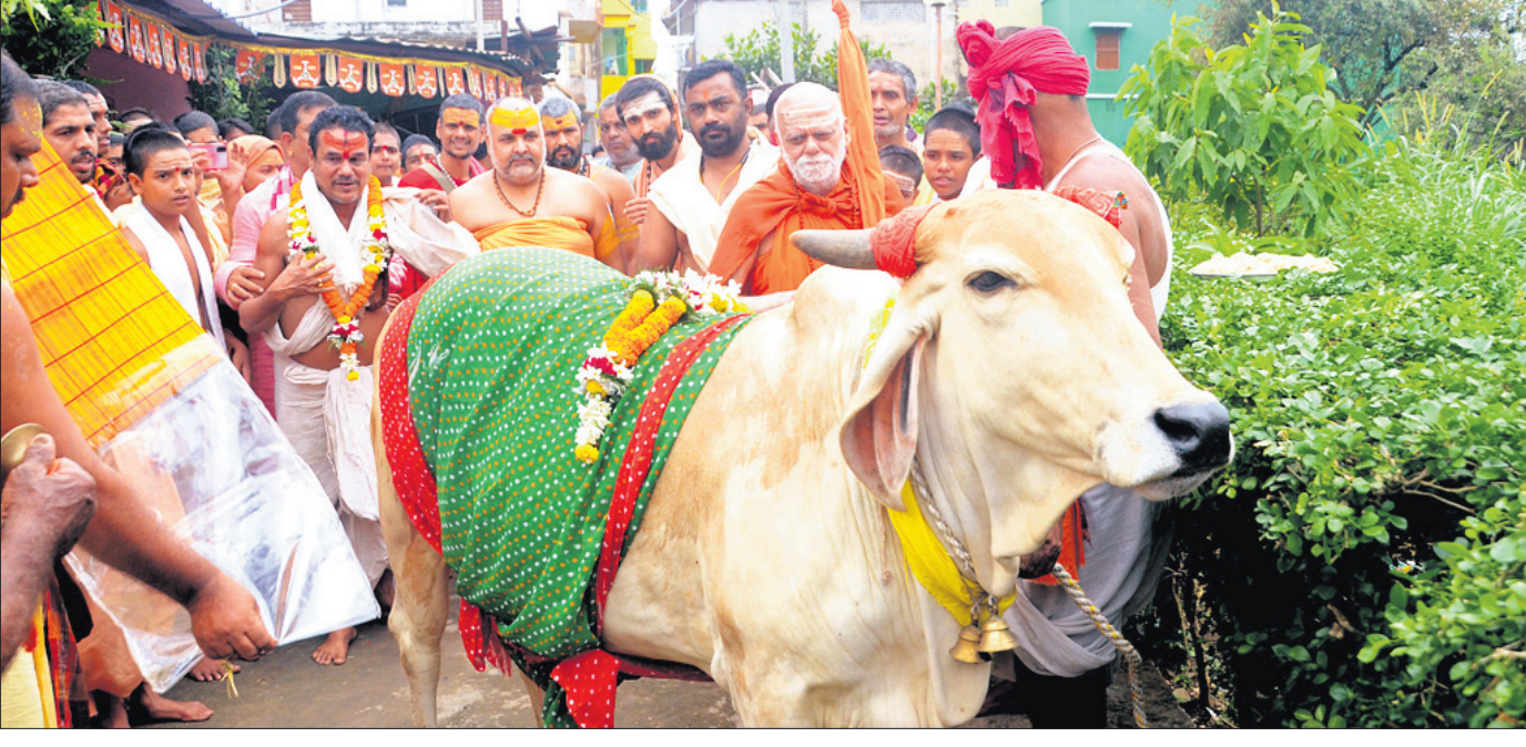
ଗୋଷ୍ଠାସ୍ଥଳୀ ଅବସରରେ ପୁରୀ ଗୋବର୍ଦ୍ଧନ ମଠ ପରିସରରେ ଶୁକ୍ରବାର ଜଗଦ୍ଗୁରୁ ଶଙ୍କରାଚାର୍ଯ୍ୟ ଗୋପୂଜା କରୁଛନ୍ତି ।

କଟକ ଅଫିସ, ୧୨.୧୧.୧୧: ଛାତ୍ରାଛାତ୍ରୀଙ୍କ ହାଇସ୍କୁଲ ସାର୍ଟିଫିକେଟରେ ତ୍ରୁଟି ଥିଲେ ସଂଶୋଧନ କରାଯାଇପାରିବ। ଏନେଇ ମାଧ୍ୟମିକ ଶିକ୍ଷା ପରିଷଦ (ବୋର୍ଡ) ପକ୍ଷରୁ କୃବନେଶ୍ୱର ବିଜ୍ଞପ୍ତି ପ୍ରକାଶ ପାଇଛି ।