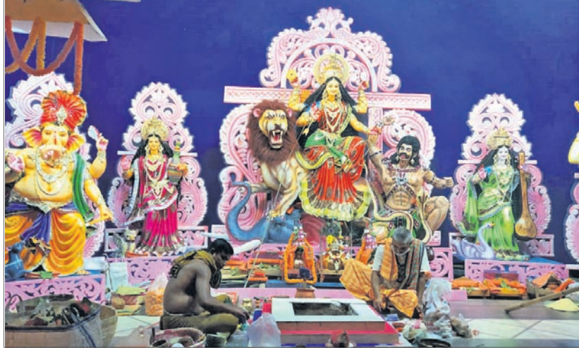
ଭଞ୍ଜପୁରରେ ମା' ଜଗନ୍ନାଥଙ୍କୁ ପୂଜା କରାଯାଉଛି।

ଭଞ୍ଜପୁରରେ ମା' ଜଗନ୍ନାଥଙ୍କୁ ପୂଜା କରାଯାଉଛି। ଏହି ଉତ୍ସବ ପାଳନ କରାଯିବ।