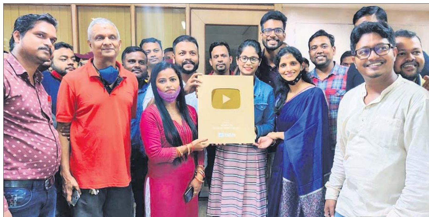
ଧରତ୍ରୀ ଲାଇଭ୍ ଟ୍ୟାଲେଣ୍ଟ ଲୋକପ୍ରିୟତା ଯୋଗୁ ଯୁକ୍ତମାନଙ୍କ ପକ୍ଷରୁ ମିଳିଥିବା 'ୟୁଟ୍ୟୁବ୍' କ୍ରିଏଟିଭ ଆର୍ଡ଼ର ରୋଲ୍‌ଓଫ୍ ପୁସ୍ତକ ଶୁକ୍ରବାର ଧରତ୍ରୀ କାର୍ଯ୍ୟାଳୟରେ ଉଦ୍ଘାଟନ ସହ ଗ୍ରହଣ କରାଯାଇଛି।