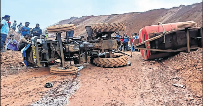
ଓଲଟି ପଡ଼ିଥିବା ପାଣି ଟ୍ୟାଙ୍କର ।

ତଳେ ଚାପି ହୋଇଯାଇଥିଲେ । ଦୁର୍ଘଟଣା ପରେ ଚାଳକ ଫୋରାର ହୋଇଯାଇଥିବା ବେଳେ ଖଣିରେ ଶ୍ରମିକ ଅଣ୍ଟା ଦେଖାଦେଇଥିଲା । ମୃତକଙ୍କ ପରିବାରକୁ ୩୦ଲକ୍ଷ ଟଙ୍କା କ୍ଷତିପୂରଣ ସହ ସେମାନଙ୍କ ପରିବାରକୁ ଜଣକ ନିଯୁକ୍ତି ପାଇଁ ଶ୍ରମିକମାନେ ଦାବି କରିଛନ୍ତି ।