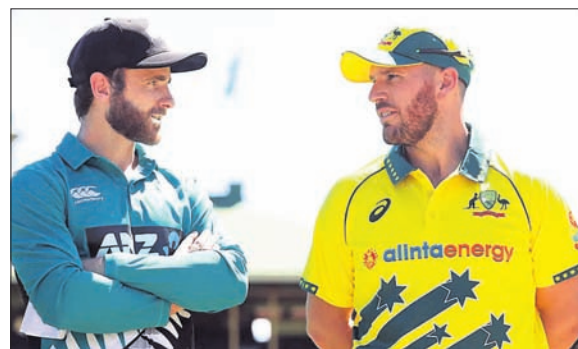
କେନ୍ ଡ୍ରୁଇୟମ୍ସ ଏବଂ ଅବୋର୍କା ଫିଲ୍ଡ

ବିଶ୍ଵକପ୍ ପାଇଁ ଫାଇନାଲ୍ ଖେଳିବାକୁ ଯୋଗ୍ୟତା ହାସଲ କରିଛି। ସପ୍ତକ ହେଲେ ୫୦ ଲକ୍ଷ ଲୋକସଂଖ୍ୟା ବିଶିଷ୍ଟ ଦୁଧିଲୀଳା ପାଇଁ ଏହା ଐତିହାସିକ ସାଧନ ହେବ।