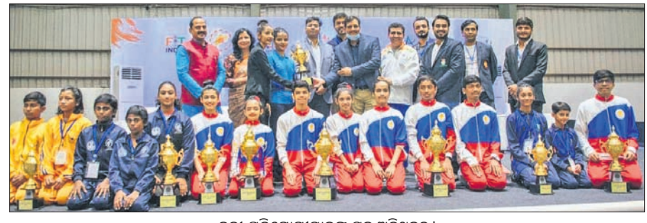
କୃତୀ ପ୍ରତିଯୋଗୀମାନଙ୍କ ସହ ଅତିଥିବୃନ୍ଦ ।