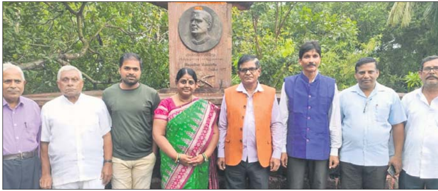
ଡ.ମାୟାଧର ମାନସିଂହଙ୍କ କନ୍ୟା ଉପଲକ୍ଷେ ସମାଧିପୀଠରେ ପୁଷ୍ପମାଳ୍ୟାର୍ପଣ ପରେ ଉପସ୍ଥିତ ଅଥିବାମାନେ ।