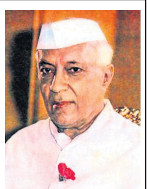
ବିଶିଷ୍ଟ ରାଷ୍ଟ୍ରନାୟକ ତଥା ଦେଶର ପ୍ରଥମ ପ୍ରଧାନମନ୍ତ୍ରୀ ଜବାହରଲାଲ ନେହେରୁଙ୍କ ଜନ୍ମଦିନରେ ଧରତ୍ରୀ ପରିବାର ପକ୍ଷରୁ ଶ୍ରଦ୍ଧାଞ୍ଜଳି।