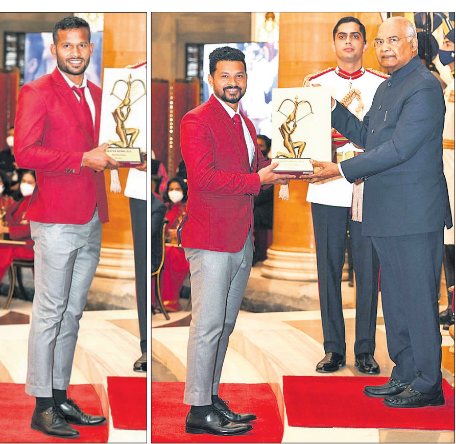
ରାଷ୍ଟ୍ରପତି ରାମନାଥ କୋବିନ୍ଦଙ୍କଠାରୁ ଅର୍ଜୁନ ପୁରସ୍କାର ଗ୍ରହଣ କରୁଛନ୍ତି ଅମିତ୍ ରୋହିଦାସ୍ ଓ ବୀରେନ୍ଦ୍ର ଲାଜୁ।

ପ୍ରଦର୍ଶନ କରିଛନ୍ତି। ଦୁହିଁ ଥରେ ସେ ଆଉ ଏକ ମ୍ୟାଚ୍ ବିଜୟୀ ଭାବେ ଖେଳିବେ ବୋଲି ଆଶା କରାଯାଉଛି। ସେହିପରି ଚେନ୍ନି ମ୍ୟାଟ୍ରେଲ୍ ଓ ଷ୍ଟିଭ୍ ହିଅର୍ ଅଧିକ ଭଲ ପ୍ରଦର୍ଶନ କରିବେ ବୋଲି ଆଶା କରାଯାଉଛି। ସେହିପରି ଲୋର୍ଡ୍ ହିଅର୍ ଆଡାମ୍ କାମ୍ପା ଏ ପର୍ଯ୍ୟନ୍ତ ଚୁନିମେଣ୍ଟରେ ୧୦.୯୧ ହାରରେ ୧୨ଟି ଉଲ୍ଲେଖନୀୟ ଘଟଣା କରିଛନ୍ତି। ମିଟେଲ୍ ଷ୍ଟ୍ରକ୍, ପ୍ୟାଟ୍ କୁମ୍ଭିର୍ ଓ କୋଶ୍ ହାଜେଲ୍‌ଉଡ୍ ନେଇ ଗଠିତ ଅଷ୍ଟ୍ରେଲିଆ ଦ୍ରୁତ ବୋଲିଂ ବିଭାଗ ଅପ୍ରତିଦ୍ଵନ୍ଦ୍ଵିତ ମନେ ହେଉଛନ୍ତି। ଏହି ୩ ଖେଳାଳି ପ୍ରଥମଥର ପାଇଁ ଦୁଧିଲୀଳା ବିପକ୍ଷରେ ଟି୨୦ ମ୍ୟାଚ୍ ଖେଳିବେ। ସେମିତି ଭଲ ପ୍ରଦର୍ଶନ କରିପାରି ନ ଥିବା କୋଶ୍ ହାଜେଲ୍‌ଉଡ୍ ଫାଇନାଲ୍ରେ ପ୍ରତ୍ୟାବର୍ତ୍ତନ କରିବେ ବୋଲି ଆଶା କରାଯାଉଛି।