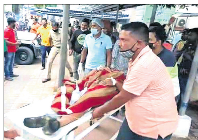
ବାପି ପାଣିକୁ ଭଦ୍ରକ ଜିଲା ବିକାଶକର୍ମକ୍ଷେତ୍ର ନିଆଯାଇଛି।

ଭଦ୍ରକ ଅଞ୍ଚଳ, ୧୩୧୧ ଭଦ୍ରକ ଜିଲା ବାସୁଦେବପୁର ବ୍ଲକ୍ ଅଧୀନ ଅଲବରା ଅଞ୍ଚଳର ଦୁର୍ଦ୍ଦାନ୍ତ ବାପି ପାଣିକୁ ଶନିବାର ଅପରାହ୍ଣରେ ଗ୍ରାମାଞ୍ଚଳ ଆନା ପୋଲିସ୍ ଏମ୍ବକାଉଣ୍ଟର କରିଛି।