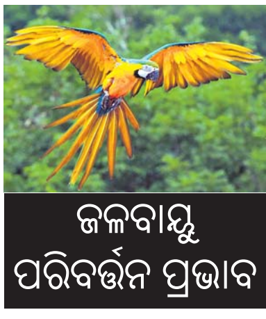
ଜଳବାୟୁ ପରିବର୍ତ୍ତନ ପ୍ରଭାବ

୪ ଦଶନ୍ଧି ଧରି ଜଳବାୟୁରେ ବିପଜ୍ଜନକ ପରିବର୍ତ୍ତନର ପ୍ରଭାବ ମଣିଷ ହାତପାଆନ୍ତକୁ ବହୁ ଦୂର ଓ ଘଞ୍ଚ ଜଙ୍ଗଲ ମଧ୍ୟରେ ଥିବା ପଶୁପକ୍ଷୀଙ୍କ ଉପରେ ମଧ୍ୟ ପଡ଼ିଛି । ଉଷ୍ଣ ଏବଂ ଶୁଷ୍କ ବାତାବରଣ ଯୋଗୁ ଆମାଜନ ଜଙ୍ଗଲ ପକ୍ଷୀଙ୍କ ଓଜନ କମୁଥିବାବେଳେ ତେଣୁ ବହୁଛି । ୧୯୮୦ରୁ ପ୍ରତି ଦଶନ୍ଧିରେ ଅଧିକାଂଶ ପ୍ରକାରିର ପକ୍ଷୀଙ୍କ ଓଜନ ପ୍ରାୟ ୨ ପ୍ରତିଶତ ହ୍ରାସ ହୋଇଛି । ପରିବର୍ତ୍ତନ ଜଳବାୟୁ ସହ ଖାପ ଖୁଆଇବା ନିମନ୍ତେ ଏଭଳି ବିବର୍ତ୍ତନ ହୋଇଥାଇପାରେ ବୋଲି ଅନୁସନ୍ଧାନକାରୀ ମତ ରଖୁଛନ୍ତି ।