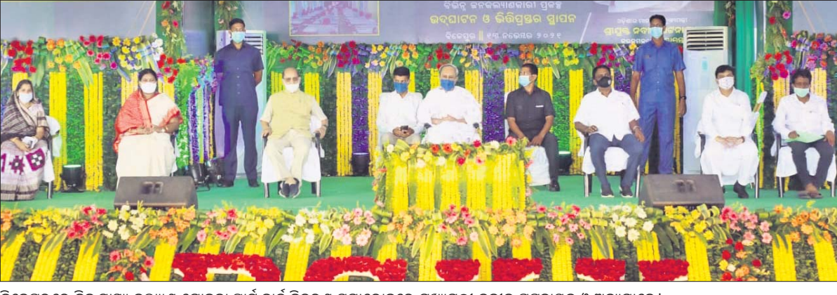
ବିଜେପୁରରେ ବିଜୁ ସ୍ୱାସ୍ଥ୍ୟ କଲ୍ୟାଣ ଯୋଜନା ସ୍ମାର୍ତ୍ତ କାର୍ତ୍ତି ବିତରଣ ସମାରୋହରେ ପୁଷ୍ପାମନ୍ତ୍ରୀ ନବୀନ ପଟ୍ଟନାୟକ ଓ ଅନ୍ୟମାନେ ।

ବରଗଡ଼ ଅପିଏ, ୧୩।୧୧ ତିଳିଆ ପାଇଁ ଟଙ୍କା ବାଧକ ସାଜିଥିଲା । ଏଥିପାଇଁ କେହି କମି ବିକ୍ରୟବାବେଳେ ଆଉ କିଏ ରଖି କରୁଥିଲେ । ଏଭଳିସ୍ଥିତି ପିଲାଙ୍କ ପାଠପଢ଼ା ମଧ୍ୟ ବାଧାପ୍ରାପ୍ତ ହେଉଥିଲା । ଏହାକୁ ହ୍ରାସକରିବା କରି ରାଜ୍ୟ ସରକାର ହିତାଧିକାରୀଙ୍କୁ ବିଜୁ ସ୍ୱାସ୍ଥ୍ୟ କଲ୍ୟାଣ ଯୋଜନା (ବିଏସ୍‌କେଏଲ୍) ସ୍ମାର୍ତ୍ତ କାର୍ତ୍ତି ବନ୍ଧନ କରୁଛନ୍ତି ଏବଂ ସାରା ଦେଶରେ ସ୍ୱାସ୍ଥ୍ୟକ୍ଷେତ୍ରରେ ଏହା ଏକ