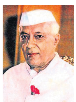
ବିଶିଷ୍ଟ ରାଷ୍ଟ୍ରନାୟକ ତଥା ଦେଶର ପ୍ରଥମ ପ୍ରଧାନମନ୍ତ୍ରୀ ଜବାହରଲାଲ ନେହେରୁଙ୍କ ଜନ୍ମଦିନରେ ଧାରତ୍ରି ପରିବାର ପକ୍ଷରୁ ଶ୍ରଦ୍ଧାଞ୍ଜଳି।