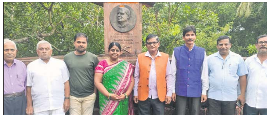
ଡ.ମାୟାଧର ମାନସିଂହଙ୍କ କନ୍ୟା ଉପଲକ୍ଷେ ସମାଧିପୀଠରେ ପୁଷ୍ପମାଳ୍ୟାର୍ପଣ ପରେ ଉପସ୍ଥିତ ଅତିଥିମାନେ ।