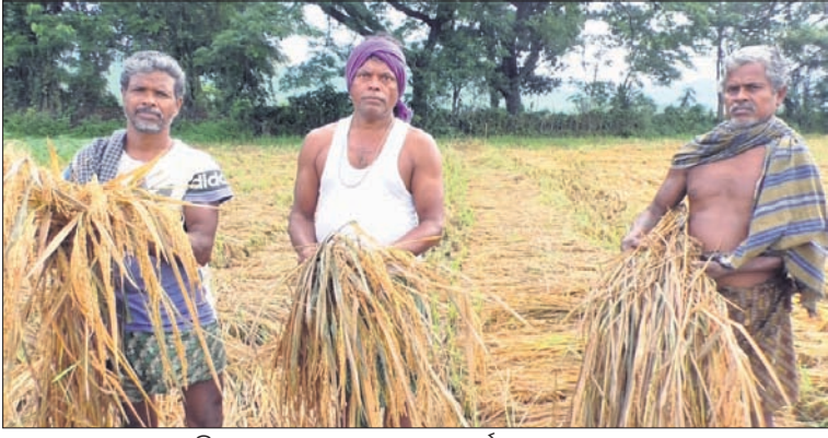
ରାୟଗଡ଼ା ଜିଲ୍ଲାର କାଦମ୍ବରାଗୁଡ଼ା ଗ୍ରାମରେ ବର୍ଷାରେ ନଷ୍ଟ ହୋଇଥିବା ଧାନ।

■ ଚାଷୀଙ୍କ ଅଣ୍ଟା ଭାଙ୍ଗିଦେଲା ଅଦିନିଆ ବର୍ଷା ■ ଧାନ, ଅଣଧାନ ଫସଲ କ୍ଷତିଗ୍ରସ୍ତ