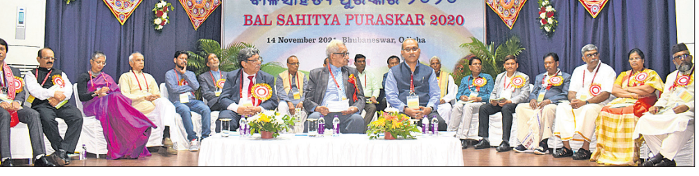
କେନ୍ଦ୍ର ସାହିତ୍ୟ ଏକାଡେମୀ ପକ୍ଷରୁ ଭୁବନେଶ୍ୱର ସୂଚନା ଭବନରେ ରବିବାର ବାଳ ସାହିତ୍ୟ ପୁରସ୍କାର ପ୍ରଦାନ ଉତ୍ସବରେ ପୁରସ୍କୃତ ପ୍ରତିଭା ଓ ଉପସ୍ଥିତ ଅତିଥି।