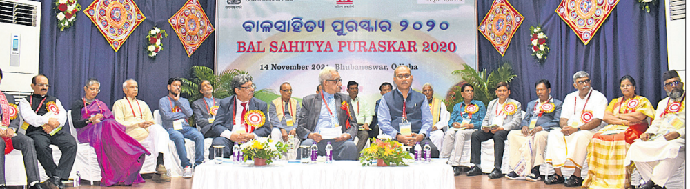
କେନ୍ଦ୍ର ସାହିତ୍ୟ ଏକାଡେମୀ ପକ୍ଷରୁ ଭୁବନେଶ୍ୱର ସୂଚନା ଭବନରେ ରବିବାର ବାଳ ସାହିତ୍ୟ ପୁରସ୍କାର ପ୍ରଦାନ ଉତ୍ସବରେ ପୁରସ୍କୃତ ପ୍ରତିଭା ଓ ଉପସ୍ଥିତ ଅତିଥି ।