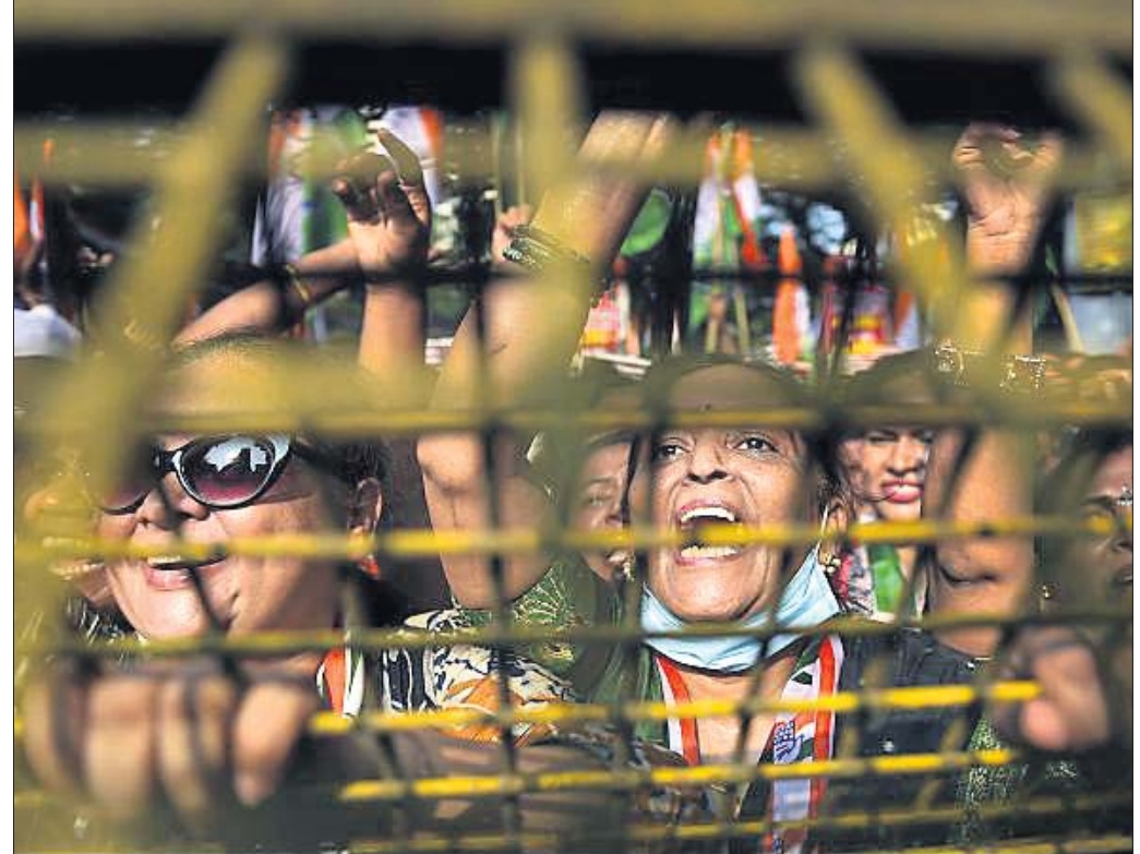
ମୁଖ୍ୟ: ପ୍ରତ୍ୟାକ୍ଷି, ଅଧ୍ୟାବଶ୍ୟକ ସାମଗ୍ରୀ ବରଦାନ ବୃଦ୍ଧି ଓ ବେକାରି ସମସ୍ୟା ପ୍ରତିବାଦରେ କେନ୍ଦ୍ର ସରକାରଙ୍କ ବିରୋଧରେ କଂଗ୍ରେସ କର୍ମୀମାନେ ବିଶୋଭ ପ୍ରଦର୍ଶନ କରୁଛନ୍ତି।

ଆୟକାରୀ ଦେଶଗୁଡ଼ିକରେ ୧୪ ପ୍ରତିଶତ ସ୍କୁଲ ପିଲାଙ୍କୁ ଇଣ୍ଟରନେଟ୍ ବ୍ୟବହାର ପ୍ରତିଷ୍ଠା ମିଳୁଛି। ତେବେ ଭାରତରେ କେତେ ପିଲା ଏହାକୁ ଶିକ୍ଷା ଓ ଅନ୍ୟ ଉଦ୍ଦେଶ୍ୟରେ ବ୍ୟବହାର କରୁଛନ୍ତି ତାହା ଜଣାପଡ଼ିନାହିଁ। ମାର୍ଡ଼ୋସ୍‌ଙ୍କ ମତରେ ସ୍କୁଲ ବନ୍ଦ ସହ ଲକ୍ଷ୍ମୀଭାଣ୍ଡ କଟକଣା ଯୋଗୁ ପିଲା ଘର ରହି ସାମାଜିକ ମିଳାମିଶାର ସୁଯୋଗ ପାଇଲେ ନାହିଁ। ଏହା ସେମାନଙ୍କ ମାନସିକ ସାମାଜିକ ସାମ୍ବନ୍ଧକୁ ପ୍ରଭାବିତ କଲା, ଯାହା ନିଷ୍ପତ୍ତା ଓ ବିଶ୍ୱାସିତ ବ୍ୟବହାର ମାନସିକତା ପୂର୍ଣ୍ଣ କଲା। ଇଣ୍ଟରନେଟରେ ସେମାନେ ଆପତ୍ତିଜନକ ବିଷୟ ଦେଖିବା ସହ ଖରାପ ରାସ୍ତାରେ ଯିବାକୁ ପ୍ରଭାବିତ ହେଲେ। ପିଲାମାନଙ୍କ ଡିଜିଟାଲ ଅଧିକାରକୁ ନେଇ ଇଣ୍ଟରନେଟ୍ ଗଭୀର ପଲିସି ଫୋର୍ମ୍‌ସ୍ ଓ ଶିଶୁ ସୁରକ୍ଷା ମଧ୍ୟରେ ସମନ୍ୱୟ ଆବଶ୍ୟକ। ଏଥିରେ ମହିଳା ଓ ଶିଶୁ ବିକାଶ ମନ୍ତ୍ରାଳୟର ଗୁରୁତ୍ୱପୂର୍ଣ୍ଣ ଭୂମିକା ରହିଛି ବୋଲି ମାର୍ଡ଼ୋସ୍ କହିଛନ୍ତି।