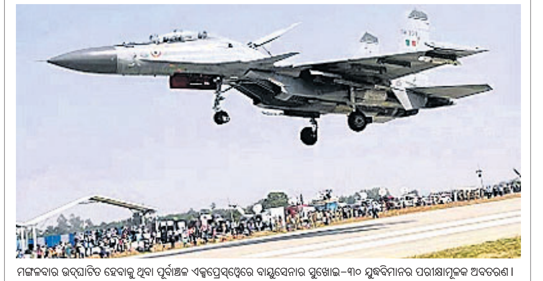
ମଙ୍ଗଳବାର ଉଦ୍‌ଘାଟିତ ହେବାକୁ ଥିବା ପୂର୍ବାଞ୍ଚଳ ଏକ୍ସପ୍ରେସ୍‌ରେ ବାୟୁସେନାର ସୁଖୋଇ-୩୦ ଯୁଦ୍ଧବିମାନର ପରୀକ୍ଷାମୂଳକ ଅବତରଣ।