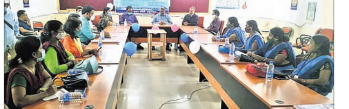
ଠେକେରେ ଜିଲା ସ୍ୱାସ୍ଥ୍ୟ ବିଭାଗର ଅଧିକାରୀଙ୍କ ସମେତ ଅନ୍ୟ କର୍ମଚାରୀମାନେ।