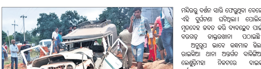
ପଦ୍ମପୁର ରାସ୍ତାର ଦୁର୍ଘଟଣାସ୍ଥଳୀ ଛକ ନିକଟରେ ଦୁର୍ଘଟଣାଗ୍ରସ୍ତ ପିକ୍‌ଅପ୍ ଭ୍ୟାନ୍ ।

କେନ୍ଦ୍ର ସାହିତ୍ୟ ଏକାଡେମୀ ପକ୍ଷରୁ ଭୁବନେଶ୍ୱର ସୂଚନା ଭବନରେ ରବିବାର ବାଳ ସାହିତ୍ୟ ପୁରସ୍କାର ପ୍ରଦାନ ଉତ୍ସବରେ ପୁରସ୍କୃତ ପ୍ରତିଭା ଓ ଉପସ୍ଥିତ ଅତିଥି ।