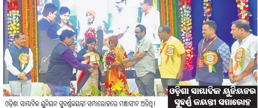
ଓଡ଼ିଶା ସାମ୍ବାଦିକ ଯୁନିୟନର ସୁବର୍ଣ୍ଣ ଜୟନ୍ତୀ ସମାରୋହ

ଯାଜପୁର ଗଭନ, ୧୫/୧୧(ଡି.ଏନ.ଏ.) ଖବରଦାତାଙ୍କ ସୁରକ୍ଷା ପାଇଁ ରାଜ୍ୟ ସରକାର ପ୍ରାଥମିକତା ଦେଉଛନ୍ତି।