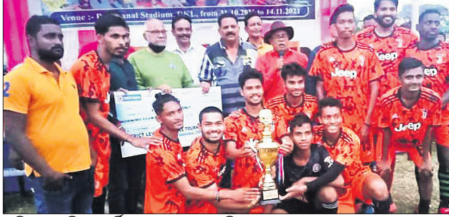
ଚ୍ରୀଟି ସହ ଚାମ୍ପିୟନ୍ ମର୍ଦ୍ଦିଂ କ୍ଲବ ଦଳର ଖେଳାଳିମାନେ। ଦେଢ଼ନାଳ ଅଫିସ, ୧୪।୧୧

ନାକ ଭଉଣୀ ଅଞ୍ଚଳବାସୀଙ୍କ ମଧ୍ୟରେ ସାଜିଥିଲା ପୁସ୍ତକ ପ୍ରତିବନ୍ଧକ। ବର୍ଷାଦିନେ ନାକ ଫୁଲରେ ଯାତାୟାତ ବିଚ୍ଛିନ୍ନ ରୂପ ନେଇଥିବାବେଳେ ଭଉଣୀଭାଇଙ୍କ ପାଖକୁ ଛୁଟୁଛି ପ୍ରଶଂସାର ସୁଅ। ସମ୍ବଲପୁର ଜିଲାର ନାକଟିଦେଉଳ ବୁକ ଅନ୍ତର୍ଗତ ବୁକାଳୀନା ଅଞ୍ଚଳବାସୀ ଆଞ୍ଚଳିକ ଆବେଦନ କରି ଅନୁଗୋଳ ଜିଲାର ଢେଉପଦା ବୁକ ଉପରେ ନିର୍ଦ୍ଧାରଣ କରିଆଣ୍ଡା। ତେବେ ନବଭାରତୀୟ ଚଳଚ୍ଚିତ୍ର 'ଅନୁଗୋଳ'ର ଗର୍ଭାବସ୍ଥା ଉପରେ ଉଦ୍ଘାଟନ କରାଯାଇଛି।