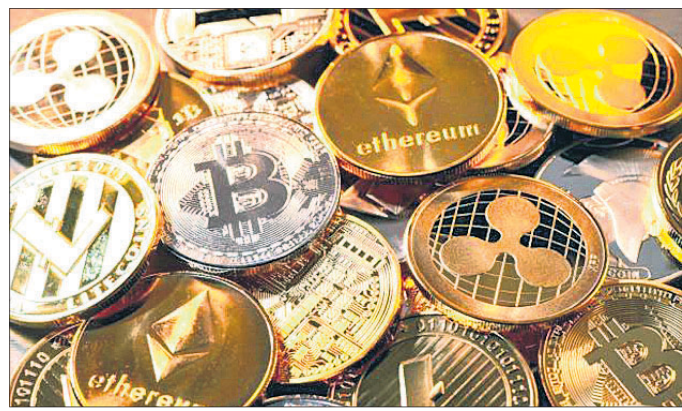
ପ୍ରକୃତ୍ୟ ଆରମ୍ଭ କଲା ଆର୍ବିଆଇ ମିଳିପାରେ ସର୍ତ୍ତମୂଳକ ମଞ୍ଜୁରୀ

ଭାରତରେ କ୍ରିପ୍ଟୋକରେନ୍ସି ବା ଭର୍ଚୁଆଲ କରେନ୍ସି କାରବାରକୁ ଏବେ ସୁଦ୍ଧା ସିଧା ଯୋଗ୍ୟ କରାଯାଇନାହିଁ। ତେବେ ଏଭଳି କାରବାରକୁ ସରକାର ଆଗାମୀ ଦିନରେ ଅନୁମତି ଦେଇପାରନ୍ତି। ଭାରତରେ କ୍ରିପ୍ଟୋକରେନ୍ସି କାରବାରକୁ ସର୍ତ୍ତମୂଳକ ଭାବେ ମଞ୍ଜୁରୀ ମିଳିପାରେ। ଗିଜକିଏ ଏକ ନିବେଶନ କ୍ରିପ୍ଟୋକରେନ୍ସି କ୍ଷେତ୍ରରେ ରହିଥିବା ପ୍ରମୁଖ ବ୍ୟବସାୟୀ ଏବଂ ଅଂଶଦାରଙ୍କ ସହ ଏକ ବୈଦିକ କରିଥିଲା।