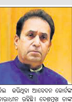
ଓଲିଲ କରିଥିବା ଆବେଦନ କୋର୍ଟଙ୍କ ବିଚାରଧାରୀ ରହିଛି । ଦେଶମୁଖ ତାଙ୍କ

ମନିଲଣ୍ଡର୍ ମାମଲାରେ ମହାରାଷ୍ଟ୍ରର ପୂର୍ବତନ ଗୃହମନ୍ତ୍ରୀ ଅନିଲ ଦେଶମୁଖଙ୍କୁ ସ୍ୱତନ୍ତ୍ର ପିଏଏମ୍‌ଏସ୍ କୋର୍ଟ ସୋମବାର ଦୁଇ ସପ୍ତାହ ପାଇଁ ବିଚାର ବିଚାଗାରୀ ହାଜତକୁ ପଠାଇ ଦେଇଛନ୍ତି । ଗତ ୨ ତାରିଖରେ ତାଙ୍କୁ ଗିରଫ କରାଯାଇଥିଲା । ଦୟାସାଧ୍ୟ ଏବଂ ଅସୁସ୍ଥତା କାରଣରୁ ଦେଶମୁଖଙ୍କ ଅନୁରୋଧକ୍ରମେ ଜେଲରେ ତାଙ୍କୁ ଔଷଧ ଓ ବେଡ୍ ଯୋଗାଇଦେବାକୁ କୋର୍ଟ ଅନୁମତି ଦେଇଛନ୍ତି । ତେବେ ଘରରକ୍ଷା ଖାଦ୍ୟ ପାଇଁ ଦେଶମୁଖଙ୍କ