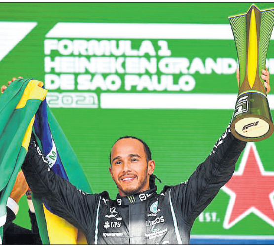
ତ୍ରୁପି ସହ ଲୁଇସ୍ ହାମିଲଟନ୍ ।

ସାଓପାଓଲୋ, ୧୫।୧୧ (ଏ.ପି.) ମସିହା ଡ୍ରାଇଭର ଲୁଇସ୍ ହାମିଲଟନ୍ ବ୍ରାଜିଲିଆନ ଫର୍ମୁଲା ଓ ଗ୍ରାଁ ପ୍ରି ମୋଟର ରେସ୍ ଜିତିଛନ୍ତି । ସେମାନଙ୍କୁ ଯୋଗୁ ଥର ବିଶ୍ୱ ଚାମ୍ପିୟନ ୧୦ମ ଗ୍ଲାସରୁ ରେସ୍ ଆରମ୍ଭ କରିଥିଲେ । ଏହାପରେ ସେ ଚଳିତ ସିଜନର ତାଙ୍କ ଫର୍ମୁଲା ଓ ଗଜଲକ୍ଷ ପ୍ରତିସ୍ପର୍ଦ୍ଧା ମାତ୍ର ଭର୍ଷାପେନ୍ଙ୍କୁ ପଛରେ ପକାଇ ଦେଇଥିଲେ । ୨୦୧୯ରେ ରେସ୍ ଗତ ସଂସ୍କରଣ ବିଜେତା ଭର୍ଷାପେନ୍ଙ୍କୁ ଦ୍ୱିତୀୟ ଗ୍ଲାସରେ ରହିଥିଲେ । ଫାଇନାଲ ଡ୍ରାଇଭର ଚାମ୍ପିୟନଶିପ୍ ଚେମ୍ପିୟନରେ ପ୍ରଥମ ଗ୍ଲାସରେ ରହିଥିବା ଭର୍ଷାପେନ୍ ଓ ହାମିଲଟନ୍ଙ୍କ ମଧ୍ୟରେ ପଏଣ୍ଟ ବ୍ୟବଧାନ ୧୪କୁ ହ୍ରାସ ପାଇଛି । ଚଳିତ ସିଜନର ଆଉ ମାଟି ରେସ୍ ବାକି ରହିଛି । ଏକ ରେସ୍ ବିଜେତାକୁ ୨୫ ପଏଣ୍ଟ ମିଳିଥାଏ । ଚଳିତ ସିଜନରେ ହାମିଲଟନ୍ଙ୍କର ରବିବାର ଥିଲା ୬୫ ବିଜୟ । ହାମିଲଟନ୍ଙ୍କ ଚମତ୍ତେଜ ଭାଲରେ ବିଜେତା ରେସ୍ରେ ତୃତୀୟ ହୋଇଥିବା ବେଳେ ରେଡ୍ବୁଲର ସର୍ଗି ଓ ପେରେଜ ୪ର୍ଥ ହୋଇଥିଲେ । ଫୋରାରି ଚାର୍ଲ୍ସ ଲେକରେକ୍ ଓ କାର୍ଲୋସ୍ ସେଞ୍ଚା ଯଥାକ୍ରମେ ୫ମ ଓ ୬ଷ୍ଠ ଗ୍ଲାସ ଅଧିକାର