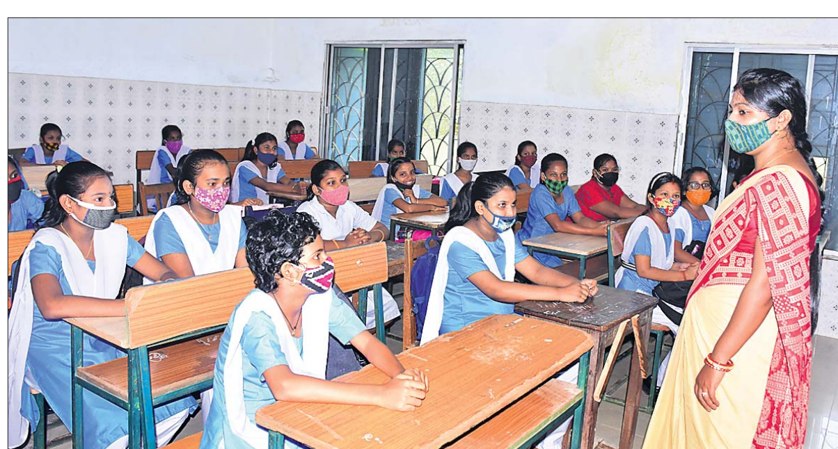
ସୋମବାର ସ୍କୁଲ ଖୋଲିବା ପରେ ଭୁବନେଶ୍ୱର ଯୁନିଟ୍-୯ ସରକାରୀ ବାଳିକା ବିଦ୍ୟାଳୟରେ ଷଷ୍ଠ ଶ୍ରେଣୀ ପିଲାଙ୍କୁ ପାଠ ପଢ଼ାଯାଉଛି।

କଲିଗତ ଖୁଲାଟି ବସ୍ ଅକ୍ସୟ କୁମାରଙ୍କ ପ୍ରତିଷ୍ଠାତ ମୂଳି 'ପୃଥ୍ବୀରାଜ'ର ଚିତ୍ର ରିଲିଜ ହୋଇଛି।