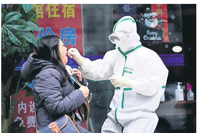
କେସ୍ ସାମ୍ବନ୍ଧୀୟ ଆସିଛି । ଚାଇନା ସହରକାର ଏହାକୁ ଗମ୍ଭୀରତାର ସହ ନେଇ ସଂକ୍ରମଣକୁ ନିୟନ୍ତ୍ରଣ ପରାମର୍ଶ ଏବଂ ସେମାନଙ୍କ ସଂସ୍ପର୍ଶରେ ଆସିଥିବା ବ୍ୟକ୍ତିଙ୍କୁ ଚିହ୍ନଟ କରିବାକୁ ଗୁରୁତ୍ୱ ଦେଇଛନ୍ତି । ଏଥିସହ ବିଭିନ୍ନ ସ୍ଥାନରେ କଠେନମେଣ୍ଟ ଜୋନ କରିବା ସହ ସେଠାରେ ସମସ୍ତ ପ୍ରକାର କାର୍ଯ୍ୟକ୍ରମ, ଜନଗହଳ, ଅତ୍ୟାବଶ୍ୟକ ନ ଥିଲେ ଏବଂ ସେମାନଙ୍କ ସଂସ୍ପର୍ଶରେ ଆସିଥିବା ବ୍ୟକ୍ତିଙ୍କୁ ଚିହ୍ନଟ କରିବାକୁ ଗୁରୁତ୍ୱ ଦେଇଛନ୍ତି । ଏଥିସହ ବିଭିନ୍ନ ସ୍ଥାନରେ

କୋରୋନା ସବୁ ମାତାମୂଳ ଡେଲ୍ଟା ଭାରିଆଖି ଚାଇନାର ଚିନ୍ତା ବଢ଼ାଇଛି । ଅକ୍ଟୋବର ୧୨ରୁ ନଭେମ୍ବର ୧୪ ମଧ୍ୟରେ ୧୩୦୮ ମାମଲା ରିକର୍ଡ କରାଯାଇଛି । ସଂକ୍ରମଣ ବୃଦ୍ଧିକୁ ଦୃଷ୍ଟିରେ ରଖି ଉତ୍ତରପୂର୍ବର କେତେକ ସହରରେ ଲକ୍ଷ୍ୟତାରନ ଭଳି କଟକଣା ଲଗାଯାଇଛି । ଗତ ସପ୍ତାହଠାରୁ ସଂକ୍ରମଣ ସାରା ଦେଶରେ ବୃଦ୍ଧିପାଇବାରେ ଲାଗିଛି । ଚଳିତ ବର୍ଷ ପ୍ରାୟ ୨୨୦୦ ମୋଟ ୧,୨୮୦ ମାମଲା ସାମ୍ବନ୍ଧୀୟ ଆସିଥିବାବେଳେ ଏବେ କମ୍ ସମୟ ମଧ୍ୟରେ ସଂକ୍ରମଣ ଏହି ସଂଖ୍ୟାକୁ ଅତିକ୍ରମ କରିଛି । ଏ ପର୍ଯ୍ୟନ୍ତ ଚାଇନାରେ ୯୮,୩୧୫ ମାମଲା ରିକର୍ଡ ହୋଇଛି । ଏଥିସହ ମୋଟ ୪,୨୩୬ ମୃତ୍ୟୁ ରେକର୍ଡ କରାଯାଇଛି । ୨୧ ଡିସେମ୍ବରରେ ଡେଲ୍ଟା ଭାରିଆଖି