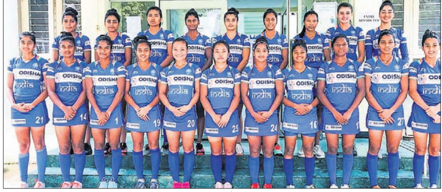
କୁନିୟର ମହିଳା ହକି ବିଶ୍ୱକପ ପାଇଁ ମନୋନୀତ ଭାରତୀୟ ଦଳ ।

କୁନିୟର ମହିଳା ହକି ବିଶ୍ୱକପ ■ ଅଲିମ୍ପିଆନ ଲାଲରେମସିଆମି ଦଳର ନେତୃତ୍ୱ ନେବେ ■ ଇଶିକା ଉପ-ଅଧିନାୟିକା