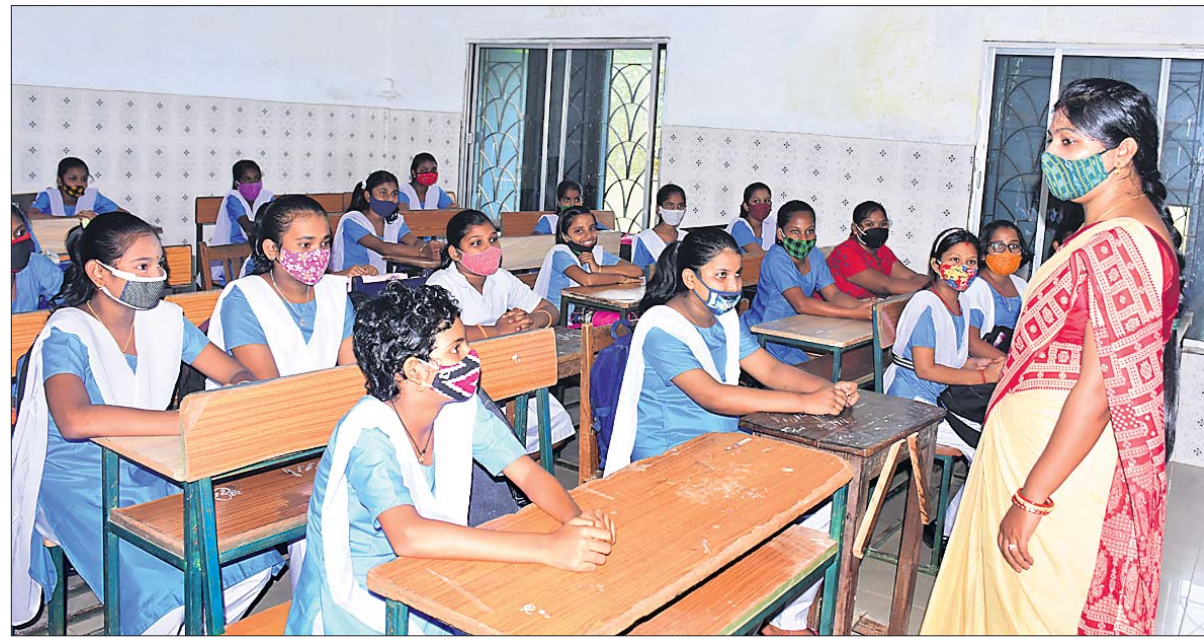
ସୋମବାର ସ୍କୁଲ ଖୋଲିବା ପରେ ଭୁବନେଶ୍ୱର ଯୁନିଟ୍-୯ ସରକାରୀ ବାଳିକା ବିଦ୍ୟାଳୟରେ ଷଷ୍ଠ ଶ୍ରେଣୀ ପିଲାଙ୍କୁ ପାଠ ପଢ଼ାଯାଉଛି।

ବଲିଉଡ ଖୁଲାଟି ବନ୍ଦ ଅକ୍ଷୟ କୁମାରଙ୍କ ପ୍ରତିଷ୍ଠାତ ମୂଳି 'ପୃଥ୍ୱୀରାଜ'ର ଚିତ୍ର ରିଲିଜ ହୋଇଛି।