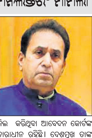
ଓଲିଲ୍ କରିଥିବା ଆବେଦନ କୋର୍ଟଙ୍କ ବିଚାରଧାରୀ ରହିଛି। ଦେଶମୁଖ ତାଙ୍କ

ମନିଲଣ୍ଡରିଂ ମାମଲାରେ ମହାରାଷ୍ଟ୍ରର ପୂର୍ବତନ ଗୃହମନ୍ତ୍ରୀ ଅନିଲ ଦେଶମୁଖଙ୍କୁ ସ୍ୱତନ୍ତ୍ର ପିଏଏମ୍‌ଏସ୍‌ଏ କୋର୍ଟ ସୋମବାର ଦୁଇ ସପ୍ତାହ ପାଇଁ ବିଚାର ବିଚାଗାରୀ ହାଜତକୁ ପଠାଇ ଦେଇଛନ୍ତି। ଗତ ୨ ତାରିଖରେ ତାଙ୍କୁ ଗିରଫ କରାଯାଇଥିଲା। ଦୟାସାଧ୍ୟ ଏବଂ ଅସୁସ୍ଥତା କାରଣରୁ ଦେଶମୁଖଙ୍କ ଅନୁରୋଧକ୍ରମେ ଜେଲରେ ତାଙ୍କୁ ଔଷଧ ଓ ବେଡ୍ ଯୋଗାଇଦେବାକୁ କୋର୍ଟ ଅନୁମତି ଦେଇଛନ୍ତି। ତେବେ ଘରରକ୍ଷା ଖାଦ୍ୟ ପାଇଁ ଦେଶମୁଖଙ୍କ