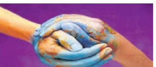
ଅନ୍ତର୍ଜାତୀୟ ସହନଶୀଳତା ଦିବସ

ସମସ୍ତଙ୍କୁ ସରପ୍ରାଞ୍ଜ ଦେବ ବୋଲି କୁହାଯାଇଛି। ଏହି ଚିତ୍ରକୁ ଯଶରାଜ ଫିଲ୍ମସର ସୁନ୍ଦର ଚ୍ୟାନେଲରେ ରିଲିଜ୍ କରାଯାଇଛି। ଏହାର ଆରମ୍ଭ ପୁଅରାଜଙ୍କ ଭବିତ୍ତ ଓ ମହାନତାକୁ ଦର୍ଶାଉଥିବା ତରଫରୁ ଆରମ୍ଭ କରାଯାଇଛି। ଏହାପରେ ଏକ ଖାର ସିନ ନଜର ଆସୁଛି। ଏଥିରେ ସଞ୍ଜୟ ଦତ୍ତ ମଧ୍ୟ ଆକ୍ଷୟ କୁମାରଙ୍କୁ ନଜର ଆସିଛି। ସୋନୁ ସୁଦ ଏଥିରେ ସମ୍ପୂର୍ଣ୍ଣ ଭିନ୍ନ ଅଭିନୟ ନଜର ଆସିଛନ୍ତି। ମାନ୍ୟ ଚିତ୍ରର ଏହା ତୃତୀୟ ମୂଲ୍ୟ ୨୦୨୨ ଜାନ୍ୟୁଆରୀରେ ପରଦାକୁ ଆସିବ।