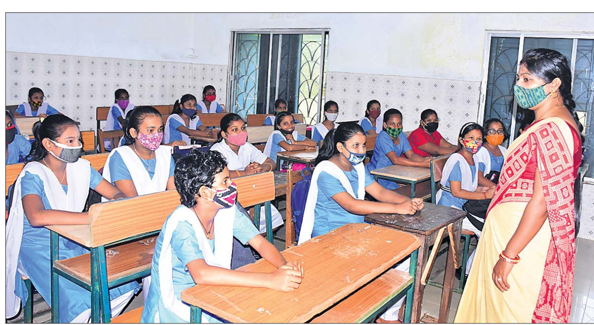
ସୋମବାର ସ୍କୁଲ ଖୋଲିବା ପରେ ଭୁବନେଶ୍ୱର ଯୁନିଟ୍-୯ ସରକାରୀ ବାଳିକା ବିଦ୍ୟାଳୟରେ ଷଷ୍ଠ ଶ୍ରେଣୀ ପିଲାଙ୍କୁ ପାଠ ପଢ଼ାଯାଉଛି।

ବଲିଉଡ ଖୁଲାଟି ବନ୍ଦ ଅକ୍ଷୟ କୁମାରଙ୍କ ପ୍ରତିଷ୍ଠାତ ମୂଳି 'ପୃଥ୍ବୀରାଜ'ର ଚିତ୍ର ରିଲିଜ ହୋଇଛି।