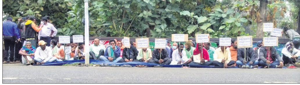
ଏସ୍ପି ଅଫିସ ସମ୍ମୁଖରେ ଧାରଣାରେ ଗ୍ରାମବାସୀ।