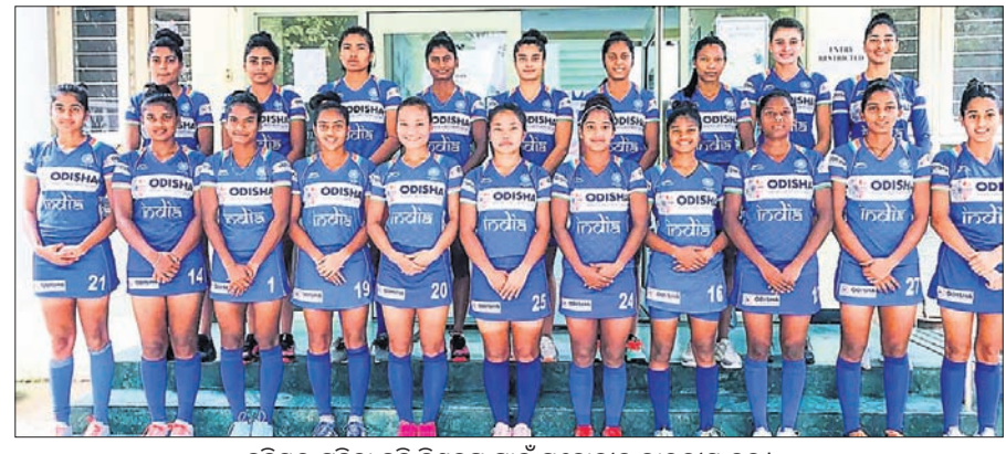
ଭୁବନେଶ୍ଵର ମହିଳା ହକି ବିଶ୍ଵକପ ପାଇଁ ମନୋନୀତ ଭାରତୀୟ ଦଳ ।

ଭୁବନେଶ୍ଵର ମହିଳା ହକି ବିଶ୍ଵକପ ■ ଅଲିମ୍ପିଆନ୍ ଲାଇରେମିଆମି ଦଳର ନେତୃତ୍ଵ ନେବେ ■ ଇଣିକା ଉପ-ଅଧିନାୟିକା