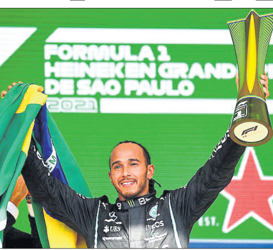
ଗ୍ରାଁ ପ୍ରି ସହ ଲୁଇସ ହାମିଲଟନ୍ ।

ସାଓପାଓଲୋ, ୧୫।୧୧ (ଏ.ପି.) ମସିହା ଗ୍ରାମିଣ୍ୟ ଲୁଇସ ହାମିଲଟନ୍ ବ୍ରାଜିଲିଆନ ଫର୍ମୁଲା ଓ ଗ୍ରାଁ ପ୍ରି ମୋଟର ରେସ୍ ଜିତିଛନ୍ତି । ସେମାନଙ୍କୁ ଯୋଗୁଁ ଥର ବିଶ୍ଵ ଚାମ୍ପିୟନ ୧୦ମ ଗ୍ଲାନରୁ ରେସ୍ ଆରମ୍ଭ କରିଥିଲେ । ଏହାପରେ ସେ ଚଳିତ ସିଜନର ତାଙ୍କ ଫର୍ମୁଲା ଓ ଗାଇଡଲ ପ୍ରତିସ୍ଵା ମାତ୍ର ଭର୍ଷ୍ଟାପେନ୍ସୁ ପଛରେ ପକାଇ ଦେଇଥିଲେ । ୨୦୧୯ରେ ରେସ୍ ଗତ ସଂସରଣ ବିଜେତା ଭର୍ଷ୍ଟାପେନ୍ସୁ ତୃତୀୟ ଗ୍ଲାନରେ ରହିଥିଲେ । ଫଳରେ ବ୍ରାଜିଲର ଚାମ୍ପିୟନଶିପ ଚେମ୍ପିୟନରେ ପ୍ରଥମ ଗ୍ଲାନରେ ରହିଥିବା ଭର୍ଷ୍ଟାପେନ୍ସୁ ଓ ହାମିଲଟନ୍ଙ୍କ ମଧ୍ୟରେ ପଏଣ୍ଟ ବ୍ୟବଧାନ ୧୪କୁ ହ୍ରାସ ପାଇଛି । ଚଳିତ ସିଜନର ଆଉ ମାଟି ରେସ୍ ବାକି ରହିଛି । ଏକ ରେସ୍ ବିଜେତାକୁ ୨୫ ପଏଣ୍ଟ ମିଳିଥାଏ । ଚଳିତ ସିଜନରେ ହାମିଲଟନ୍ଙ୍କର ରିବିଭାର ଥିଲା ୬ଶ ବିଜୟ । ହାମିଲଟନ୍ଙ୍କ ଚମତ୍କାର ଭାବରେ ବୋଗସ ରେସ୍ରେ ତୃତୀୟ ହୋଇଥିବା ବେଳେ ରେଡ୍ବୁଲର ସର୍ଗି ଓ ପେରେଜ ୪ର୍ଥ ହୋଇଥିଲେ । ଫେରାରୀ ଚାଲ୍ଡି ଲେକରେକ ଓ କାର୍ଲୋସ ସେଞ୍ଜା ଯଥାକ୍ରମେ ୫ମ ଓ ୬ଶ ଗ୍ଲାନ ଅଧିକାର