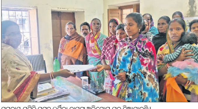
ସମବାୟ ସମିତି ସହଜ ଉର୍ଜ୍ଜ୍ୱା ବାସକ୍ ଅଭିଯୋଗ ପତ୍ର ଦିଆଯାଇଛି।

ବାଲେଶ୍ୱର ଜିଲ୍ଲା ନୀଳଗିରି ଲ୍ୟାଞ୍ଚସ ଅଧୀନ ସଜନାଗଡ଼ ସୋପାନଗଡ଼ରେ ରଣ ନ କବି ୪୦ରୁ ଉର୍ଦ୍ଧ୍ୱ ଲୋକଙ୍କ ମୁଣ୍ଡରେ ଏବେ ହଜାର ହଜାର ବ୍ୟକ୍ତିର ରଣ। ଏହାକୁ ନେଇ ଅସନ୍ତୋଷ ଚେତନାରେ ଲାଗିଛି। ଠକେଇ ଶିକାର ହୋଇଛନ୍ତି ସଜନାଗଡ଼ ପଞ୍ଚାୟତ ନୂଆସାହି ଓ ଜାମୁଡ଼ିଆସିର ଅନୁସୂଚିତ ଜନଜାତିର ଲୋକେ। ଜଣେ ଦଳାଇ ସର୍ବସିଦ୍ଧିରେ ରଣ କରାଇଦେବାକୁ କହି ସେମାନଙ୍କଠାରୁ ଆଧାରକାର୍ତ୍ତ ଓ ଫଟୋ ପରିଚୟପତ୍ର ନେଇଥିଲେ। ପରେ ସେମାନଙ୍କ ନାମରେ ରଣ ଉଠାଇ ଆତ୍ମହତ୍ୟା କରାଯାଇଥିବା ଅଭିଯୋଗ ହୋଇଛି।