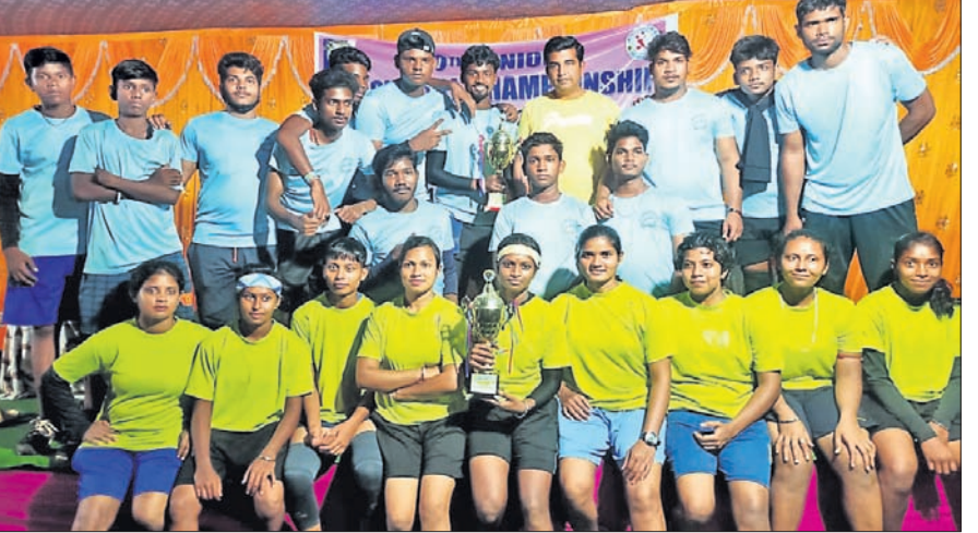
ରାଜ୍ୟସ୍ତରୀୟ ସିନିୟର ଥ୍ରୋ ବଲ୍ ପ୍ରତିଯୋଗିତାର ମହିଳା ଓ ପୁରୁଷ ବିଭାଗରେ ଚାମ୍ପିୟନ ହୋଇଥିବା ପୁରୀ ଦଳ।

ଭୁବନେଶ୍ୱର, ୧୫.୧୧ (ଗ୍ରୀଷ୍ମ ପ୍ରତିନିଧି) ଜଗନ୍ନାଥ କ୍ରିଡିଆରାଠାରେ ୩୦ତମ ରାଜ୍ୟସ୍ତରୀୟ ସିନିୟର ଥ୍ରୋ ବଲ୍ ପ୍ରତିଯୋଗିତା ଅନୁଷ୍ଠିତ ହୋଇଯାଇଛି। ଏଥିରେ ପୁରୀ ଦଳ ଉଭୟ ମହିଳା ଓ ପୁରୁଷ ବିଭାଗରେ ଚାମ୍ପିୟନ ହୋଇ ଡବଲ ଟାଇଟଲ ହାସଲ କରିଛି। ପୁରୀ ମହିଳା