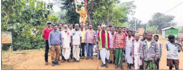
ସାରସକଣାଠାରେ ଶହାଦ ବିସ୍ୱାମୁଖାଙ୍କୁ ଶ୍ରଦ୍ଧାଞ୍ଜଳି ଅର୍ପଣ କରାଯାଇଛି।

ବାରିପଦା ଅଫିସ/ଉପକଳା/ ସାରସକଣା/କୁଆମରା/ କସ୍ତୁରୀ, ୧୫।୧୧(ଡି.ଏନ.ଏ.)