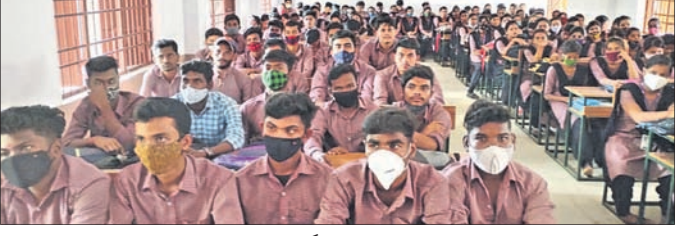
ମତଦାନ କରିପାରିବେ ସେ ନେଇ ପରାମର୍ଶ ଦିଆଯାଇଛି। ମତଦାନ କରିପାରିବେ ସେ ନେଇ ପରାମର୍ଶ ଦିଆଯାଇଛି। ମତଦାନ କରିପାରିବେ ସେ ନେଇ ପରାମର୍ଶ ଦିଆଯାଇଛି।

ମତଦାନ ସମ୍ପର୍କରେ ସଚେତନତା କାର୍ଯ୍ୟକ୍ରମ କରାଯାଇଛି। ମତଦାନ ସମ୍ପର୍କରେ ସଚେତନତା କାର୍ଯ୍ୟକ୍ରମ କରାଯାଇଛି। ମତଦାନ ସମ୍ପର୍କରେ ସଚେତନତା କାର୍ଯ୍ୟକ୍ରମ କରାଯାଇଛି।