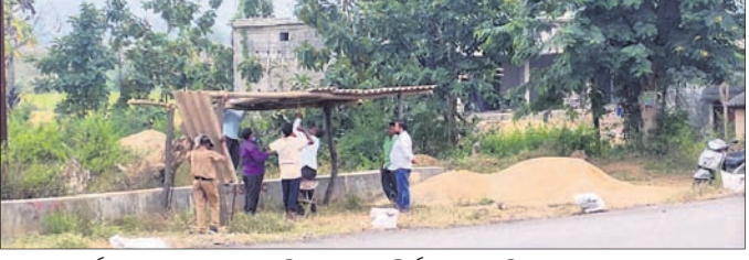
କଲେଜ କର୍ମଚାରୀମାନେ ଅଣ୍ଡା ଓ ଚାଉଳ ବିତ୍ତାଣ କରିବାକୁ ଲାଗିଛନ୍ତି।