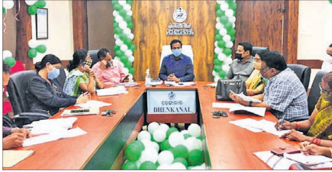
କୋଭିଡ୍ ପରିଚାଳନା ସମୀକ୍ଷା ବୈଠକରେ ଉପସ୍ଥିତ ଅଧିକାରୀମାନେ।