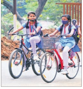
କ୍ଲାସ୍ କରାଯାଇଥିବା ଶିକ୍ଷା ବିଭାଗ ପକ୍ଷରୁ କୁହାଯାଇଛି। ଏଥିସହ ପୂର୍ବପଠାର ଦୂରତ୍ଵ ସହ ସାବୁନରେ ହାତ ଧୋଇବା ଓ ସାନିଟାଇଜର, ମାସ୍କ ବ୍ୟବହାର କରିବାକୁ ବୁଝାଯାଇଥିଲା। ପ୍ରଥମେ ଓଭିଏକ୍ସେଣ୍ଡ

ଅନୁଗୋଳ ଅଫିସ୍, ୧୫.୧୧- ଅନୁଗୋଳ କିଲ୍ଲାରେ ସାମାଜିକ ଓ ୭୧ ଶ୍ରେଣୀ ପିଲାଙ୍କ ପାଇଁ ସ୍କୁଲ ଖୋଲିଥିବାରୁ ପ୍ରଥମ ଦିନରେ ୫୦ ପ୍ରତିଶତ ଉପସ୍ଥାନ ଦେଖିବାକୁ ମିଳିଛି। ଦୀର୍ଘ ଦିନ ପରେ ବିଦ୍ୟାଳୟ ଖୋଲୁଥିବାରୁ ଛାତ୍ରଛାତ୍ରୀଙ୍କ ମଧ୍ୟରେ ଉତ୍ସାହ ଦେଖିବାକୁ ମିଳୁଥିଲା। ଛାତ୍ରଛାତ୍ରୀମାନେ ସ୍କୁଲରେ ପହଞ୍ଚିବା ପରେ କରୋନା ସମ୍ପର୍କରେ ସେମାନଙ୍କୁ ପ୍ରଥମେ ଅବଗତ କରାଯାଇଥିଲା। ଗୁପ୍ତରେ ବିଭାଜନ କରି କରୋନା ନିୟମ ଅନୁଯାୟୀ ସାମାଜିକ ଦୂରତ୍ଵ ସହ ସାବୁନରେ ହାତ ଧୋଇବା ଓ ସାନିଟାଇଜର, ମାସ୍କ ବ୍ୟବହାର କରିବାକୁ ବୁଝାଯାଇଥିଲା। ପ୍ରଥମେ ଓଭିଏକ୍ସେଣ୍ଡ