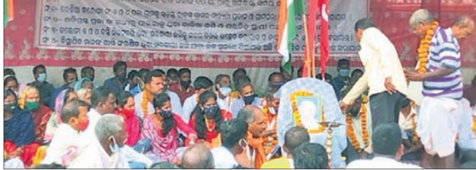
କର୍ମଚାରୀମାନେ କୁଳ କାର୍ଯ୍ୟାଳୟ ସମ୍ମୁଖରେ ଅନୁଶନ କରୁଛନ୍ତି।