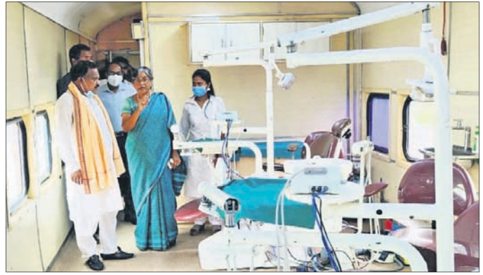
ଟ୍ରେନ୍ ଭିତରେ ରୋଗୀ ସେବା ବ୍ୟବସ୍ଥାକୁ ଅତିଥି ଅନୁଧ୍ୟାନ କରୁଛନ୍ତି।