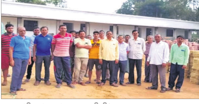
ଗ୍ରାମବାସୀ ବିଭାଗୀୟ ଯନ୍ତ୍ରୀଙ୍କୁ ଘେରାଇ କରୁଛନ୍ତି।