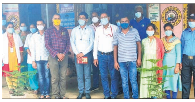
ବଜଣ୍ଡା ସ୍ଵାସ୍ଥ୍ୟକେନ୍ଦ୍ର ପରିବର୍ତ୍ତନରେ ଆସିଥିବା ପ୍ରତିନିଧି ଦଳ।

କିଲ୍ଲା ବ୍ଲକ୍ ଆସ୍ପାୟରା କମିଟି ପକ୍ଷରୁ ଏକ ପ୍ରତିନିଧି ଦଳ ସାମାଜିକ ବିଶାଳନଗର ବ୍ଲକ୍ ବଜଣ୍ଡା ସ୍ଵାସ୍ଥ୍ୟକେନ୍ଦ୍ର ପରିବର୍ତ୍ତନ କରିଛନ୍ତି। ପ୍ରତିନିଧି ଦଳ ପ୍ରଥମେ ମେଡିକାଲ ଔଷଧ ବିତରଣ ଗୃହ, ଲେବର ରୁମ୍ ସମେତ ମେଡିକାଲ ସମସ୍ତ କୋର୍ଟ ପରିବର୍ତ୍ତନ କରିଥିଲେ। ସର୍ବଦା ସ୍ଵାସ୍ଥ୍ୟକେନ୍ଦ୍ର ପରିଷ୍କାର ରଖିବା ପାଇଁ କର୍ମଚାରୀମାନଙ୍କୁ ପରାମର୍ଶ ଦେଇଥିଲେ। ପରେ ସ୍ଵାସ୍ଥ୍ୟକେନ୍ଦ୍ର ନିର୍ମାଣ ହେଉଥିବା ନୂତନ ଗୃହ ଯାଞ୍ଚ କରୁଥିଲେ। ସେହିପରି ମେଡିକାଲ ଚକ୍ଷୁପାର୍ଶ୍ଵରେ ପାଚେରି ନିର୍ମାଣ ପାଇଁ