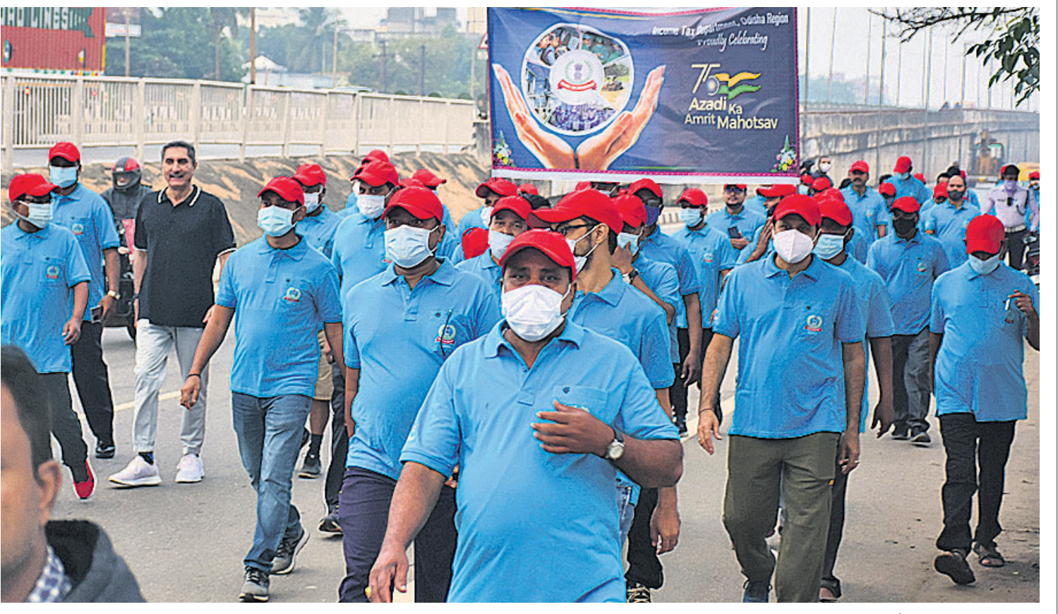
ଆୟକର ବିଭାଗ ପକ୍ଷରୁ ବୁଧବାର ଭୁବନେଶ୍ୱରରେ ଆୟୋଜିତ ଚାକ୍ଷୀପତ୍ରରେ ଭାଗ ନେଇଥିବା ପ୍ରତିପାଳ ଚିଫ୍ କମିଶନର ପରମାତ ବିଂ ସର୍ବଦେବ...