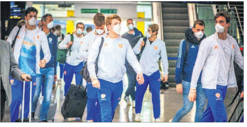
ଭୁବନେଶ୍ୱରରେ ଆଜେଷ୍ଟିନା, ନେଦରଲାଣ୍ଡ, ଫ୍ରାନ୍ସ ଦଳ

ଭୁବନେଶ୍ୱର, ୧୭।୧୧ (କ୍ରୀଡ଼ା ପ୍ରତିଧ୍ୱଜ) ଭାରତୀୟ ଅନ୍ତର୍ଜାତୀୟ ହକି ଫେଡେରେଶନ (ଏଫଆଇଏଚ୍), ହକି ଇଣ୍ଡିଆ ଓ ଓଡ଼ିଶା ସରକାରଙ୍କ ମିଳିତ ଉଦ୍ୟୋଗରେ ଆୟୋଜନ ହେବାକୁ ଯାଉଥିବା ପ୍ରତିଯୋଗିତା ପାଇଁ ଶୁଭ ଉଦ୍ଦେଶ୍ୟ ବଢ଼ାଇବା ପ୍ରାନ୍ତ ପୁଲ ବିରେ ଆୟୋଜକ ଭାବେ ସହିତ ସ୍ଥାନ ପାଇଛି। ଏହି ପୁଲ ବିରେ ଆଉ