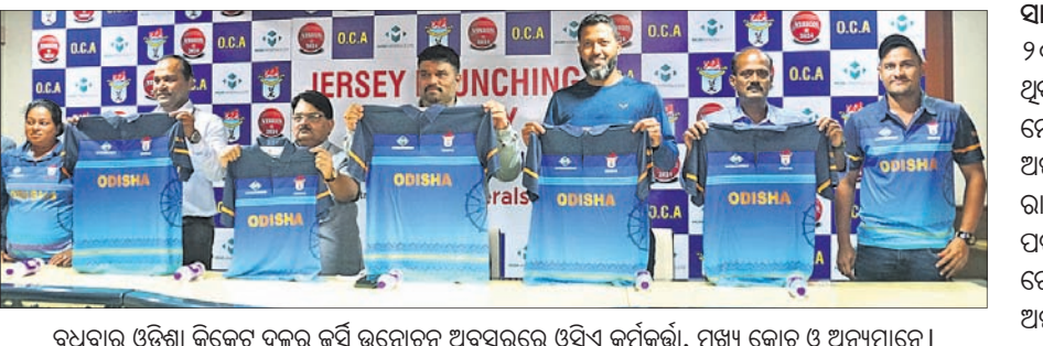
ରୁଧିରା ଓଡ଼ିଶା କ୍ରିକେଟ ଦଳର ଜର୍ସି ଉନ୍ମୋଚନ ଅବସରରେ ଓସିଏ କର୍ମକର୍ତ୍ତା, ମୁଖ୍ୟ କୋଚ୍ ଓ ଅନ୍ୟମାନେ।

ଭୁବନେଶ୍ୱର, ୧୭।୧୧ (କ୍ରୀଡ଼ା ପ୍ରତିଧ୍ୱଜ) ଓଡ଼ିଶା କ୍ରିକେଟ ଆସୋସିଏସନ (ଓସିଏ) ପକ୍ଷରୁ ଏହାର କର୍ମଚାରୀଙ୍କୁ ହକିରେ ରୁଧିରା ଓଡ଼ିଶା କ୍ରିକେଟ ଦଳର ଜର୍ସି ଉନ୍ମୋଚନ କାର୍ଯ୍ୟକ୍ରମ ଅନୁଷ୍ଠିତ ହୋଇଯାଇଛି। ଏମିତିଏମ୍ ନିନେରାଲୁଲିମିଟେଡ଼ ଓଡ଼ିଶା କ୍ରିକେଟ