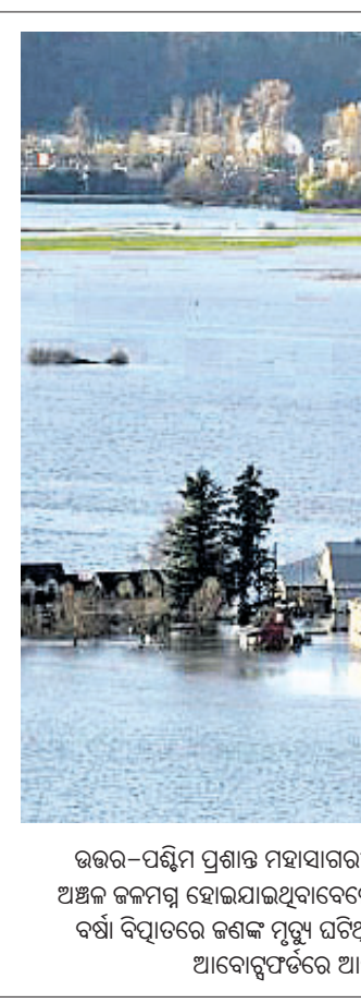
ଉତ୍ତର-ପଶ୍ଚିମ ପ୍ରଶାନ୍ତ ମହାସାଗରୀୟ ଝଡ଼ କାନାଡା ଡିଭିଜନ କଲମିଆକୁ ବିପତ୍ତି ଡାକିଆଣିଛି। ଲଗାଣ ବର୍ଷା ଯୋଗୁ ବହୁ ଅଞ୍ଚଳ ଜଳମୟ ହୋଇଯାଇଥିବାବେଳେ ଘରଘାର ବୁଡ଼ି ଯାଇଛି। ରେଳ ଯୋଗାଯୋଗ ଓ ବିଦ୍ୟୁତ୍ ସରବରାହ ବିଚ୍ଛିନ୍ନ ହୋଇଛି। ବର୍ଷା ବିପ୍ଳବରେ ଜଣକ ମୃତ୍ୟୁ ଘଟିଥିବା କୁହାଯାଉଥିବାବେଳେ ପ୍ରକୃତ ସଂଖ୍ୟା ତେଜ ଦେଖି ବୋଲି ଆଶଙ୍କା କରାଯାଇଛି। ଆବୋହୁଏଟରେ ଆସନ୍ତା ୨୩ ତାରିଖ ପର୍ଯ୍ୟନ୍ତ ଜଳପ୍ରବାହ ନିରୀକ୍ଷଣ କରାଯାଇଛି।