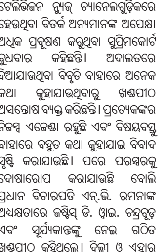
ବରଷା ଆଇନକାରୀ ଅଭିଯୋଗ ମନୁ ସିପାଲି ଉପସ୍ଥିତ ରହି ପ୍ରଦୃଷଣ ପାଇଁ କେନ୍ଦ୍ରରାଜ୍ୟ ରୁଷାର ମେହେରା ତିଲି ଦିତର୍କ କଥା ଉଠାଇଥିଲେ। ବାୟୁ