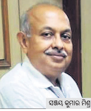
ସଞ୍ଜୟ କୁମାର ମିଶ୍ର

ନୂଆଦିଲ୍ଲୀ, ୧୭୧୧: କେନ୍ଦ୍ର ସରକାର ଅଧ୍ୟାୟୋଗୀ ଭାବେ ପ୍ରବର୍ତ୍ତନ ନିର୍ଦ୍ଦେଶନାକାର୍ଯ୍ୟ (ଇତି) ନିର୍ଦ୍ଦେଶକ ସଞ୍ଜୟ କୁମାର ମିଶ୍ରଙ୍କ କାର୍ଯ୍ୟକାଳକୁ ଗୋଟିଏ ବର୍ଷ ପାଇଁ ବୃଦ୍ଧି କରାଯାଇଛି। ଗୁରୁବାର ସେ ଅବସର ନେଇଯାଆନ୍ତେ। ନୂଆ ନିର୍ଦ୍ଦେଶନାମା ବଳରେ ସେ ୨୦୨୨ ନଭେମ୍ବର ୧୮ ପର୍ଯ୍ୟନ୍ତ ଇତି ମୁଖ୍ୟ ଦାୟିତ୍ଵରେ ରହିବେ। ପୂର୍ବରୁ ସିବିଆର ଏବଂ ଇତି ମୁଖ୍ୟଙ୍କ କାର୍ଯ୍ୟକାଳ ୯ ବର୍ଷ ପର୍ଯ୍ୟନ୍ତ ବୃଦ୍ଧି କରାଯାଇପାରୁଥିଲା। ଅଧ୍ୟାୟୋଗୀ ବଳରେ ଏହାକୁ ୫ ବର୍ଷ ପର୍ଯ୍ୟନ୍ତ ବୃଦ୍ଧି କରାଯାଇପାରିବ। ଦୁଇ ବର୍ଷ ଶେଷ କଲା ପରେ ସେମାନଙ୍କ କାର୍ଯ୍ୟ ସମୟ ୧ ବର୍ଷ ଲେଖାଏଁ ୩ ଥର ବଢ଼ାଯାଇପାରିବ ବୋଲି ଅଧ୍ୟାୟୋଗୀରେ ବ୍ୟବସ୍ଥା ରହିଛି। ଗତବର୍ଷ ନଭେମ୍ବର ୧୩ରେ ସଞ୍ଜୟଙ୍କ କାର୍ଯ୍ୟକାଳ ବୃଦ୍ଧି କରାଯିବାରୁ ଏହାକୁ ସୁପ୍ରିମକୋର୍ଟରେ ଚ୍ୟାଲେଞ୍ଜ କରାଯାଇଥିଲା। ଏଥିରେ ହସ୍ତକ୍ଷେପ କରିବାକୁ ବିଚାରପତିମାନେ ମନା କରିଥିଲେ। କେବଳ ବିଚଳ ମାମଲାରେ କାର୍ଯ୍ୟକାଳ ବୃଦ୍ଧି କରାଯାଇପାରିବ ବୋଲି ଖଣ୍ଡପୀଠ କହିଥିଲେ। ଗତ ରବିବାର ଲାଗୁ ହୋଇଥିବା ଅଧ୍ୟାୟୋଗୀ ସୁପ୍ରିମକୋର୍ଟରେ ଚ୍ୟାଲେଞ୍ଜ କରାଯାଇଛି।