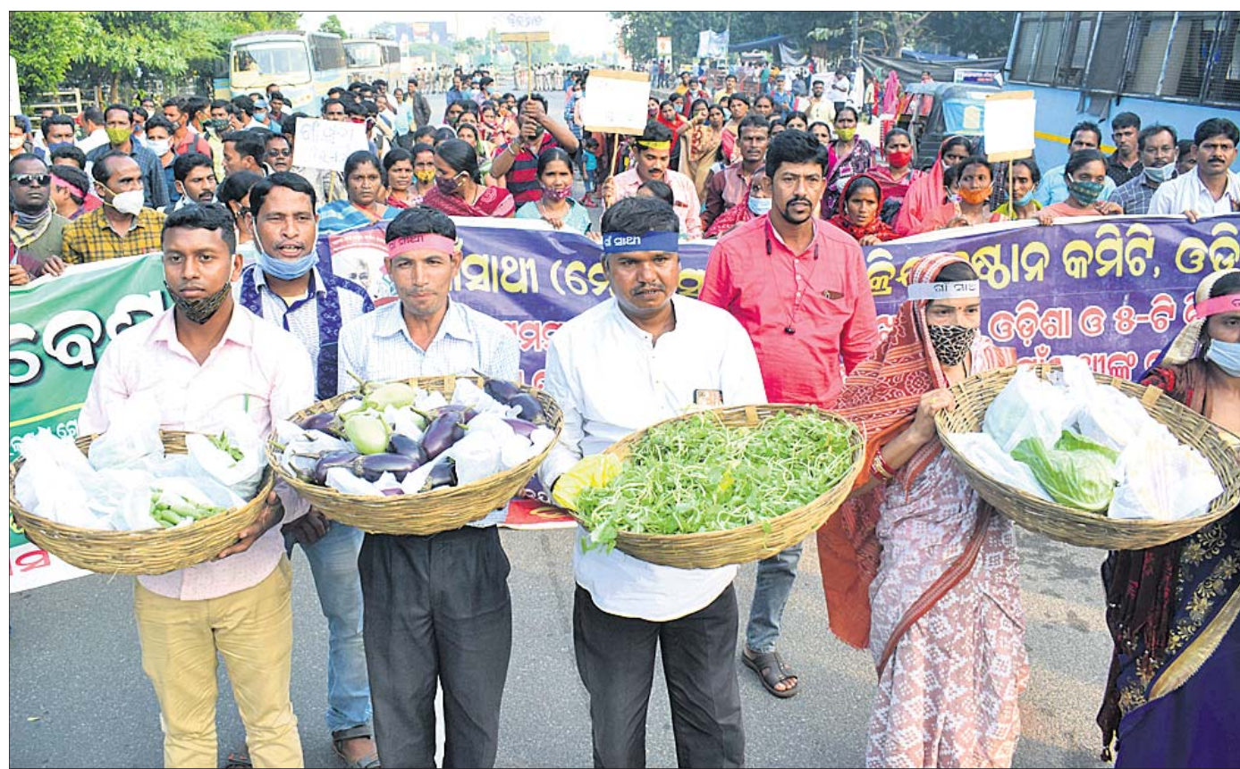
ମାସିକ ପ୍ରୋତ୍ସାହନ ରାଶି ୮ ହଜାରରୁ ଉର୍ଦ୍ଧ୍ଵ କରିବା, କୋଭିଡ୍ ସହାୟତା ଓ ବେରୋଜଗାରୀ ଭଣ୍ଡା ପ୍ରଦାନ ସହ ୫ ବଦା ଦାବି ନେଇ ଗାଁ ସାଥୀ (ମେଟ୍) ସଂଘ ମିଳିତ କ୍ରିୟାକ୍ରମ କମିଟି ପକ୍ଷରୁ ବୁଧବାର ଭୁବନେଶ୍ଵର ଲୋକସଭା ବିଧାନସଭା ପରିସରରେ ଧରି ଅଭିନବ ବିରୋଧ କରାଯାଇଛି।