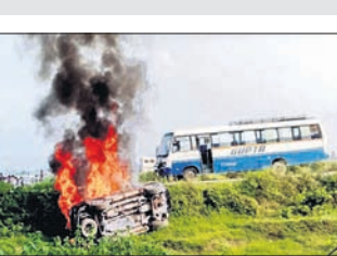
ନେଇ ସାରା ଦେଶରେ ପ୍ରତିକ୍ରିୟା ପ୍ରକାଶ ପାଇଥିବାବେଳେ ଉତ୍ତରପ୍ରଦେଶ ପୋଲିସ ଦ୍ୱାରା ତପନ୍ତ ନିରୋଧପତ୍ର ଉପରେ ପ୍ରଶ୍ନବାଚୀ ସୃଷ୍ଟି ହୋଇଥିଲା । ମାମଲା ସୁପ୍ରିମକୋର୍ଟରେ ପହଞ୍ଚିବା ପରେ ବାହାର ରାଜ୍ୟ ହାଇକୋର୍ଟର ଦିବ୍ୟାପିନ