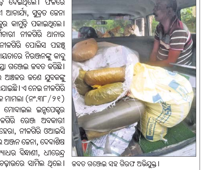
କଟକ ଗଞ୍ଜେଇ ସହ ଗିରଫ ଅଭିଯୁକ୍ତ ।