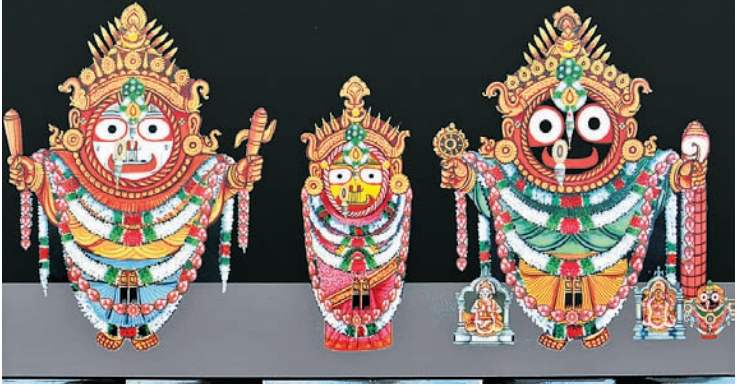
ବସୁ ଜତ୍ୟାଦିରେ ଭୂଷିତ କରାଯାଇଥିଲା। କମ୍ପୂତ ପ୍ରିୟା ମହନ୍ତ ମହାରାଜା ରାମ ଜୟନ୍ତୀ ଦାସଙ୍କ ଅଧିକ, ଏହି ବେଶ ଅତିବଡ଼ା ସମ୍ପ୍ରଦାୟର ଅତ୍ୟନ୍ତ ପ୍ରାଚୀନ ହୋଇଛି।

ପଞ୍ଚକର ତୃତୀୟ ଦିବସ କୁଧିରା ଶ୍ରୀମନ୍ଦିରରେ ମହାପ୍ରଭୁଙ୍କ ତ୍ରିବିକ୍ରମ (ଆଡ଼କିଆ) ବେଶ ସମ୍ପନ୍ନ ହୋଇଛି। ଏହି ବେଶ ଦର୍ଶନ ପାଇଁ ଶ୍ରଦ୍ଧାଳୁଙ୍କୁ ରହିଛି ହୋଇଥିଲା।