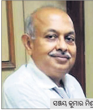
ପଞ୍ଚମ କୁମାର ମିଶ୍ର

ନୂଆଦିଲ୍ଲୀ, ୧୭୧୧: କେନ୍ଦ୍ର ସରକାର ଅଧ୍ୟାୟୋଗୀ କରିବା ପରେ ପ୍ରବର୍ତ୍ତନ ନିର୍ଦ୍ଦେଶନାକ (ଇତି) ନିର୍ଦ୍ଦେଶକ ସଞ୍ଜୟ କୁମାର ମିଶ୍ରଙ୍କ କାର୍ଯ୍ୟକାଳକୁ ଗୋଟିଏ ବର୍ଷ ପାଇଁ ବୃଦ୍ଧି କରାଯାଇଛି । ଗୁରୁବାର ସେ ଅବସର ନେଇଯାଉଛନ୍ତି । ନୂଆ ନିର୍ଦ୍ଦେଶନାମା ବଳରେ ସେ ୨୦୨୨ ନଭେମ୍ବର ୧୮ ପର୍ଯ୍ୟନ୍ତ ଇତି ମୁଖ୍ୟ ଦାୟିତ୍ୱରେ ରହିବେ । ପୂର୍ବରୁ ସିଏ ଆର ଏବଂ ଇତି ମୁଖ୍ୟଙ୍କ କାର୍ଯ୍ୟକାଳ ୨ ବର୍ଷ ପର୍ଯ୍ୟନ୍ତ ବୃଦ୍ଧି କରାଯାଇପାରୁଥିଲା । ଅଧ୍ୟାୟୋଗୀ ବଳରେ ଏହାକୁ ୫ ବର୍ଷ ପର୍ଯ୍ୟନ୍ତ ବୃଦ୍ଧି କରାଯାଇପାରିବ । ତୁଳନାତମ୍ଭେବେ ପରେ ସେମାନଙ୍କ କାର୍ଯ୍ୟ ସମୟ ୧ ବର୍ଷ ଲେଖାଏଁ ୩ ଥର ବଢ଼ାଯାଇପାରିବ ବୋଲି ଅଧ୍ୟାୟୋଗୀ ଦେବସ୍ଥା ରହିଛି । ଗତବର୍ଷ ନଭେମ୍ବର ୧୩ରେ ସଞ୍ଜୟଙ୍କ କାର୍ଯ୍ୟକାଳ ବୃଦ୍ଧି କରାଯିବାରୁ ଏହାକୁ ସୁପ୍ରିମକୋର୍ଟରେ ଚ୍ୟାଲେଞ୍ଜ କରାଯାଇଥିଲା । ଏଥିରେ ହସ୍ତକ୍ଷେପ କରିବାକୁ ବିଚାରପତିମାନେ ମନା କରିଥିଲେ । କେବଳ ବିଚାର ମାମଲାରେ କାର୍ଯ୍ୟକାଳ ବୃଦ୍ଧି କରାଯାଇପାରିବ ବୋଲି ଖଣ୍ଡପୀଠ କହିଥିଲେ । ଗତ ରବିବାର ଲାଗୁ ହୋଇଥିବା ଅଧ୍ୟାୟୋଗୀଙ୍କୁ ସୁପ୍ରିମକୋର୍ଟରେ ଚ୍ୟାଲେଞ୍ଜ କରାଯାଇଛି ।