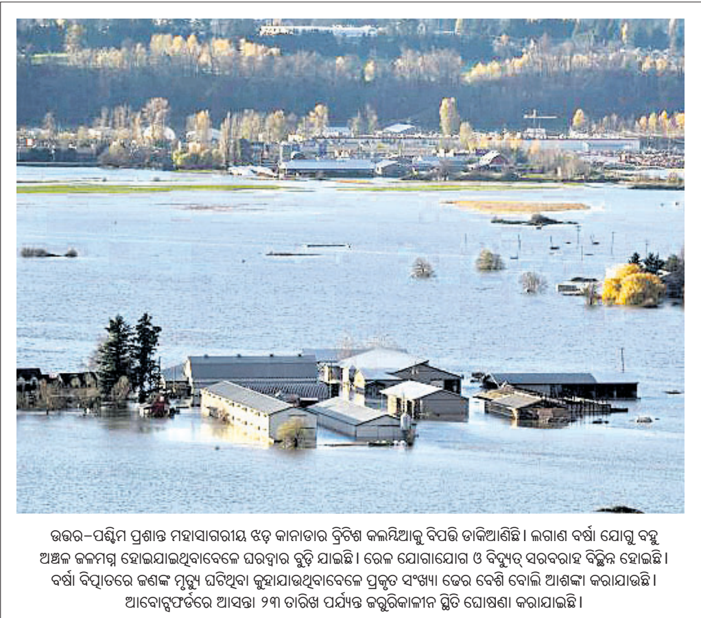
ଉତ୍ତର-ପଶ୍ଚିମ ପ୍ରଶାନ୍ତ ମହାସାଗରୀୟ ଝଡ଼ କାନାଡାଠାରୁ ବିଚ୍ଛିନ୍ନ କଲିଫର୍ଣ୍ଣିଆକୁ ବିପତ୍ତି ଚାଲିଅଣାଇଛି । ଲଗାଏ ବର୍ଷ ଯୋଗୁ ବହୁ ଅଞ୍ଚଳ କଳମହ ହୋଇଯାଇଥିବାବେଳେ ଘରବାର ବୁଡ଼ି ଯାଇଛି । ରେଳ ଯୋଗାଯୋଗ ଓ ବିଦ୍ୟୁତ୍ ସରବରାହ ବିଚ୍ଛିନ୍ନ ହୋଇଛି । ବର୍ଷା ବିପତ୍ତିରେ ଜଣେ ମୃତ୍ୟୁ ଘଟିଥିବା କୁହାଯାଇଥିବାବେଳେ ପ୍ରକୃତ ସଂଖ୍ୟା ତେଜ ବେଶି ବୋଲି ଆଶଙ୍କା କରାଯାଇଛି । ଆବୋହୁଡ଼ରେ ଆସନ୍ତା ୨୩ ତାରିଖ ପର୍ଯ୍ୟନ୍ତ ଜରୁରୀକାଳୀନ ସ୍ଥିତି ଘୋଷଣା କରାଯାଇଛି ।

ବରିଷ୍ଠ ଆଇନଜୀବୀ ଅଭିଷେକ ମନ୍ଦୁ ସିଂହଲି ଉପସ୍ଥିତ ରହି ପ୍ରଦୃଷ୍ଟାଣ ପାଇଁ ନୂଆ ପୋଡ଼ି ଘଟଣାକୁ ଦାୟୀ କରିଥିଲେ । ଏହାର ସମାଧାନ ପାଇଁ କେନ୍ଦ୍ର ସରକାର