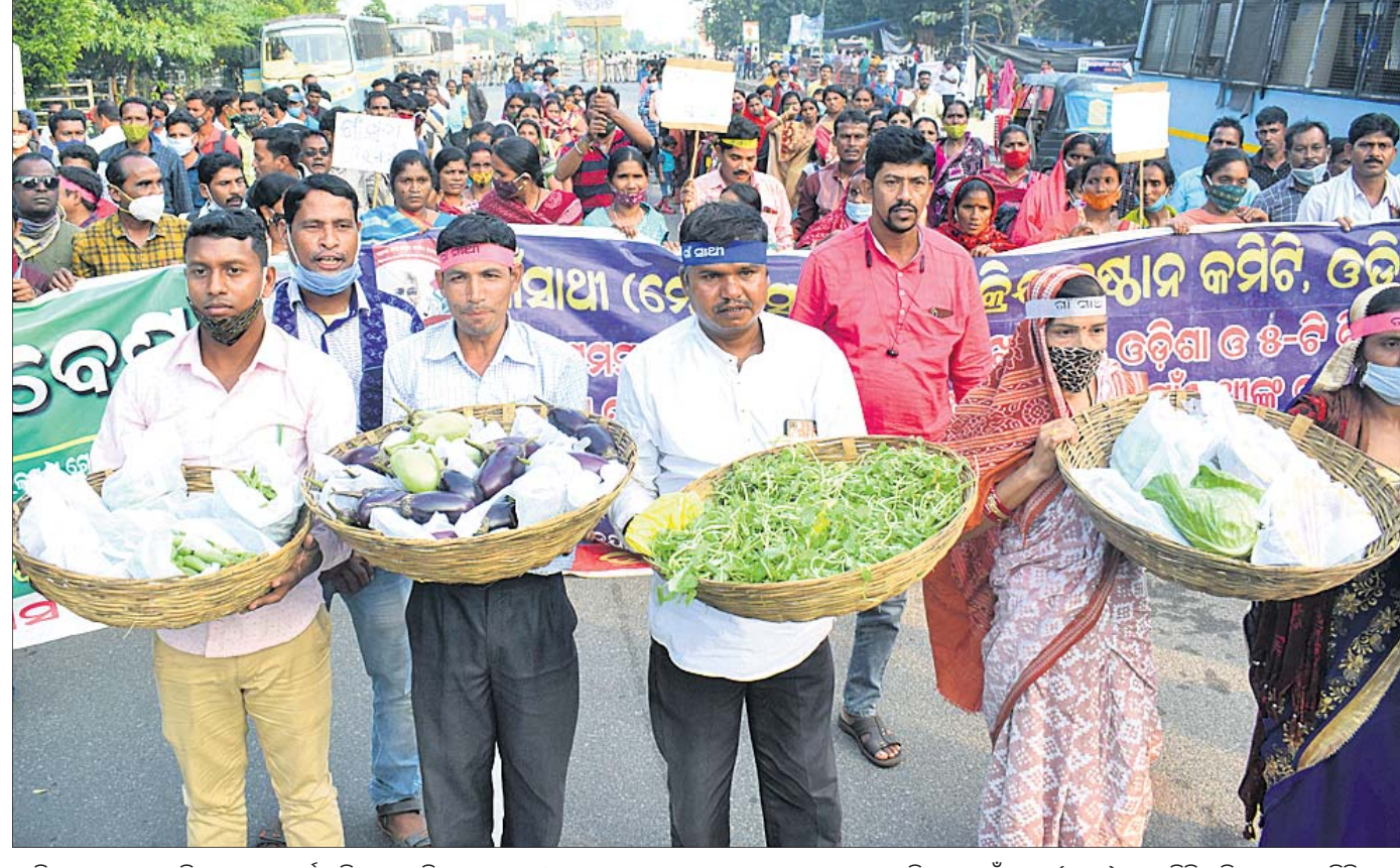
ମାସିକ ପ୍ରୋତ୍ସାହନ ରାଶି ୮ହଜାରରୁ ଉର୍ଦ୍ଧ୍ୱ କରିବା, କୋଭିଡ୍ ସହାୟତା ଓ ବେରୋଜଗାରୀ ଭଣା ପ୍ରଦାନ ସହ ୫ ବର୍ଷା ବାବୁ ନେଇ ଗାଁସାଥୀ (ମେଠ) ସଂଘ ମିଳିତ କ୍ରିୟାକ୍ରମରେ କର୍ମିତ ପକ୍ଷରୁ ରୁଧିରାଭିଳାଷୀ ଲୋକସଭା ସମ୍ବଳିତ ଭାବେ ଧରି ଅଭିନବ ବିରୋଧ କରାଯାଇଛି।

ବଜନାଗଡ଼, ୧୭/୧୧ (ଡି.ଏନ.ଏ.) ଚଢ଼ାଉ କରିବାକୁ ଆସିଥିବା ଅବକାରୀ କର୍ମଚାରୀମାନଙ୍କ ଉପରକୁ ନିଜ ପୋଷା କୁକୁର ଛାଡ଼ିଦେଇଛନ୍ତି ଗଞ୍ଜେଇ ବେପାରୀ। ଫଳରେ କୁକୁର କାମୁଡ଼ାରେ ୩ ଅବକାରୀ କର୍ମଚାରୀ ଆହତ ହୋଇଛନ୍ତି। ଚଢ଼ାଉ ରୋକିବା ପାଇଁ ଗଞ୍ଜେଇ ବେପାରୀ ଗଣକ ଏଭଳି ପକ୍ଷୀ ଆପଣାଇଥିଲେ ହେଁ ସେ ବିଫଳ ହୋଇଛନ୍ତି। ତାଙ୍କୁ ଗିରଫ କରାଯିବା ସହ ତାଙ୍କଠାରୁ ୪୩ କେଜି ଗଞ୍ଜେଇ ଜବତ ହୋଇଛି। ଘଟଣା ଘଟିଛି ବାଲେଶ୍ୱର ଜିଲ୍ଲା ନାଳଗିରି ଏନ୍‌ଏସ୍