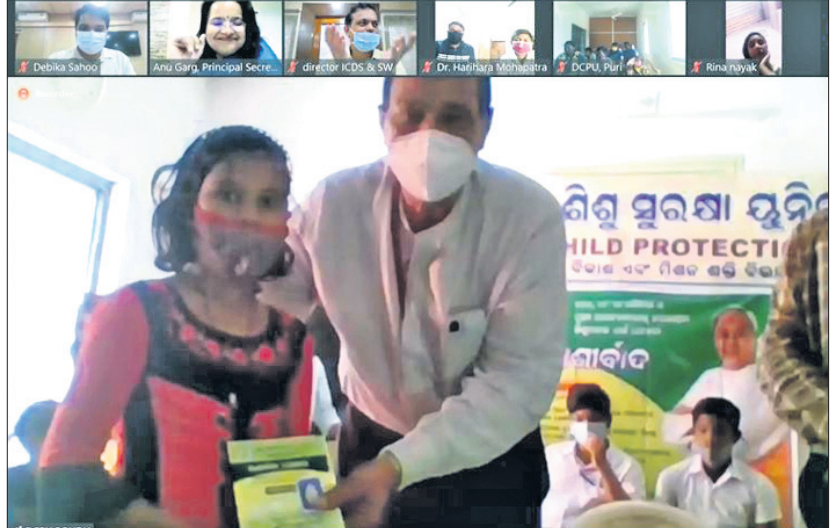
'ଆଶୀର୍ବାଦ' ଯୋଜନାର ସଫଳ ପରିଚାଳନା ଲାଗି ପ୍ରସ୍ତୁତ ସ୍ୱତନ୍ତ୍ର ପୋର୍ଟାଲର ଶୁଭାରମ୍ଭ କରାଯାଇଛି।

କାର୍ଯ୍ୟକ୍ରମରେ ସମନ୍ୱିତ ଶିଶୁ ବିକାଶ ନିର୍ଦ୍ଦେଶକ ଅଧିକାରୀ ପ୍ରଦାନ କରାଯାଇଛି। ସହାୟତା ରାଶି ସେମାନଙ୍କ ନିକଟରେ ଠିକ୍ ସମୟରେ ପହଞ୍ଚିବା ପାଇଁ, ଏହି ପୋର୍ଟାଲ ମାଧ୍ୟମରେ ପରିଚାଳନା କରାଯିବ।