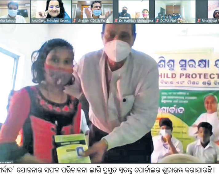
'ଆଶୀର୍ବାଦ' ଯୋଜନାର ସଫଳ ପରିଚାଳନା ଲାଗି ପ୍ରସ୍ତୁତ ସ୍ୱତନ୍ତ୍ର ପୌରାଣିକ ଶୁଭାରମ୍ଭ କରାଯାଇଛି ।

At: Kansaripada, P.O./Dist.- Bolangir. E-mail address: rmcbsgr@rediffmail.com. No. 15/RMC Date: 16.11.2021. QUOTATION CALL NOTICE. Sealed quotations in plain paper/letter paid are invited by the Chairman RMC, Bolangir from the reputed Manufacturer / Authorized Dealer / Stockist for supply, installation, commissioning along with AMC charges of following grading equipment according to specification communicated vide letter No. 3252 Dt.30.10.2018 of OSAM Board, Bhubaneswar for use in paddy procurement operation 2021-22.