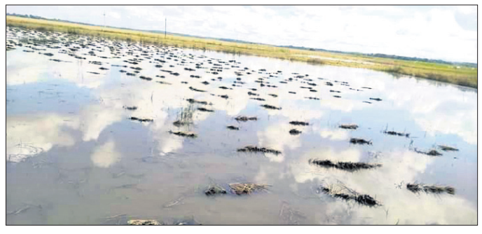
ବାସକପିରେ ବର୍ଷାକଳରେ ବୁଡ଼ି ରହିଥିବା କଟାଧାନ ।

କୋଟପାଡ଼ ଜିଲ୍ଲା କୋଟପାଡ଼ ଅଞ୍ଚଳରେ ଗତ ଦୁଇ ଦିନ ଲଗାଣ ବର୍ଷା ଯୋଗୁ ଚାଷୀଙ୍କ ଅମଳ ଧାନ କଟାହୋଇ ବିଲରେ ପଡ଼ି ନଷ୍ଟ ହେଉଥିବା ବେଶ୍ ସମ୍ଭାବନା ମିଳିଛି ।