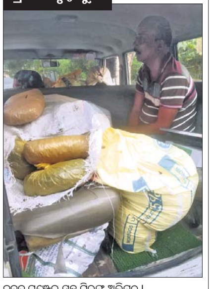
କବଚ ଗଞ୍ଜେଇ ସହ ଗିରଫ ଅଭିଯୁକ୍ତ।