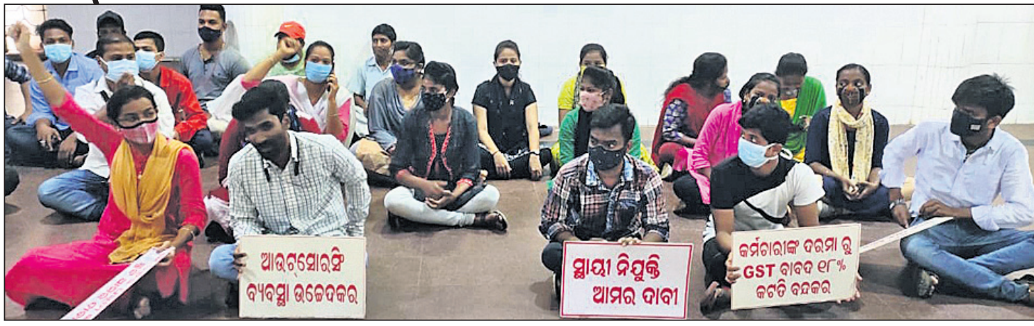
ଆରମ୍ଭରେ ବସିଥିବା ଟି.କେ. କାର୍ଯ୍ୟକାରୀ କରିବା ପାଇଁ ଆରମ୍ଭ ହେଉଛି।