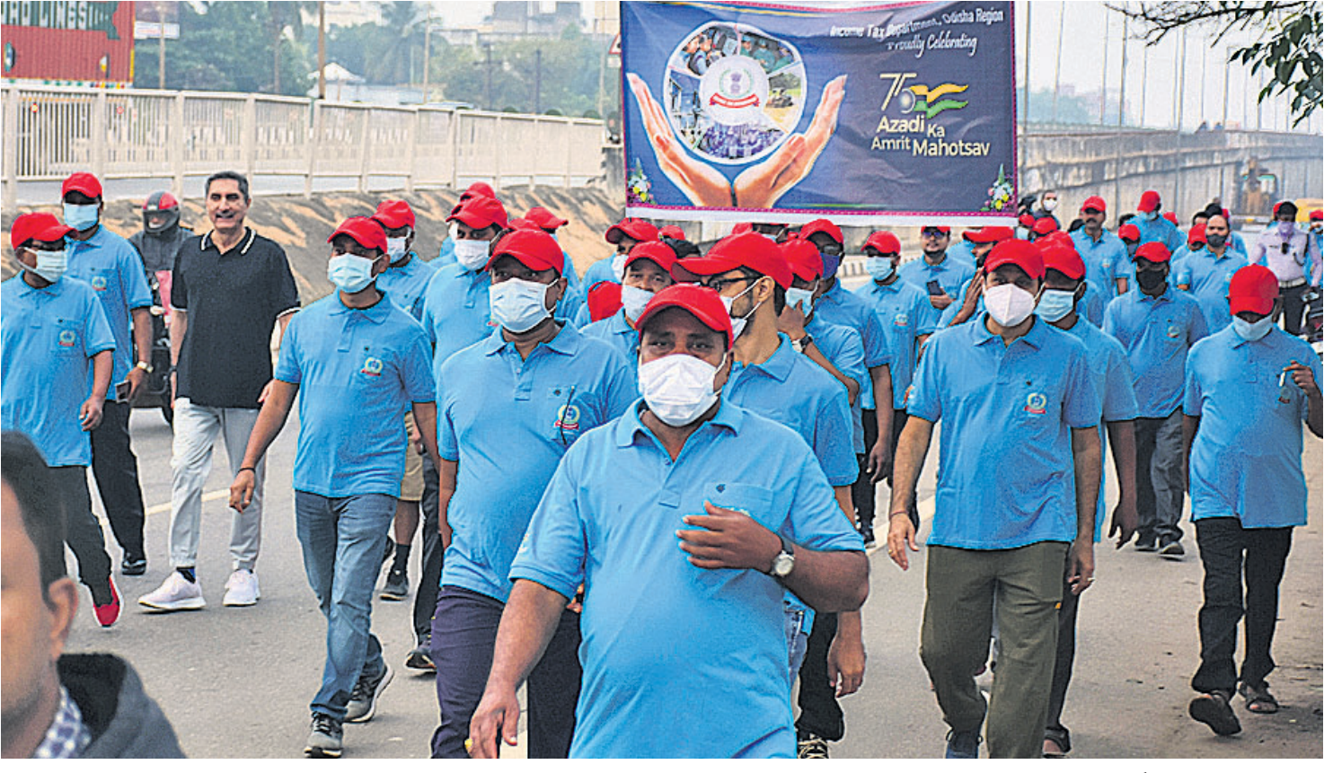
ଆୟକର ବିଭାଗ ପକ୍ଷରୁ ରୂପବାର ଭୁବନେଶ୍ୱରରେ ଆୟୋଜିତ ଓଡ଼ିଆ ଚଳଚ୍ଚିତ୍ରରେ ଭାଗ ନେଇଥିବା ପ୍ରିତିପାଳ ଚିଫ୍ କମିଶନର ପରମାତ୍ମା ସର୍ବଦେବ, ବିଭାଗୀୟ ଅଧିକାରୀ, କର୍ମଚାରୀ, ସାଧାରଣ ଜନତା।