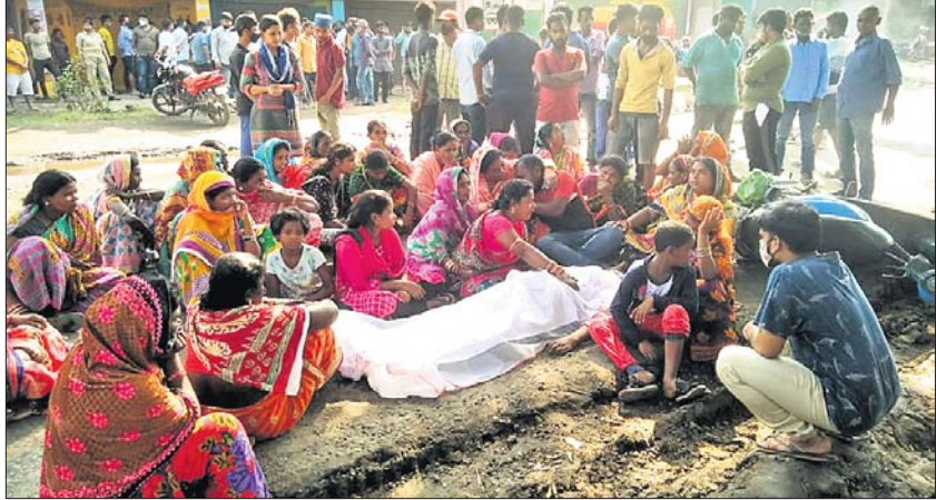
ପରିବାର ଲୋକେ ମୃତଦେହ ରଖି ଆନ୍ଦୋଳନ କରୁଛନ୍ତି।