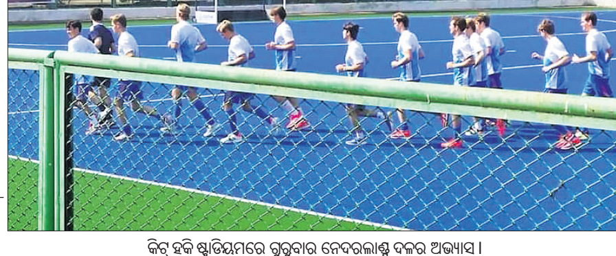
କିର୍ ହକି ଷ୍ଟାଡ଼ିୟମରେ ଗୁରୁବାର ନେଦରଲାଣ୍ଡ ଦଳର ଅଭ୍ୟାସ।