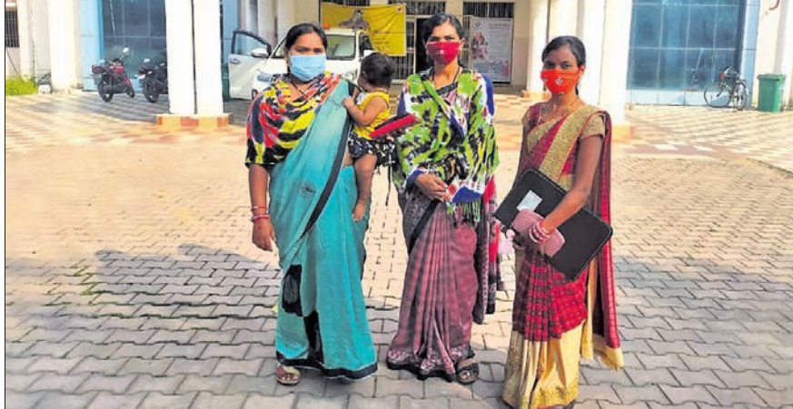
ମହିଳାମାନେ ଜିଲ୍ଲାପାଳଙ୍କୁ ଦାବିପତ୍ର ଦେବା ପାଇଁ ଆସିଛନ୍ତି।

ଦୁଆପଡ଼ା ଅର୍ଥିକ, ୧୮.୧୧ ଦୁଆପଡ଼ା ଜିଲ୍ଲା ସିନାପାଲି କୁଳ ଖର୍ଚ୍ଚେଇ ପଞ୍ଚାୟତ ଦୈନାପତା ଗାଁର ବାଗପତାରେ ଅଜ୍ଞାନତା କର୍ମା ନିୟୁକ୍ତି ପ୍ରକ୍ରିୟାରେ ତଦନ୍ତ ପାଇଁ ରୁକୁବାର କେତେଜଣ ଆଶାୟୀ ପ୍ରାର୍ଥୀ ଜିଲ୍ଲାପାଳ ସ୍ୱାଧୀନବେଦ ହୋଇଛନ୍ତି।