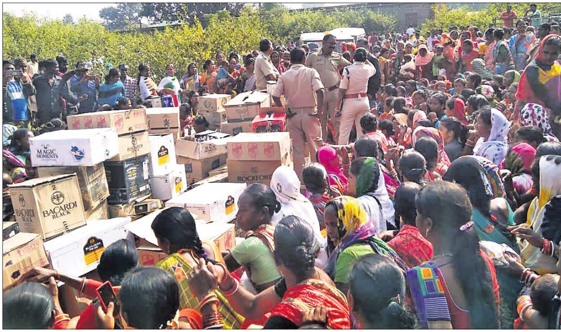
କେନ୍ଦୁଝର ଜିଲ୍ଲା ହାଟପଦାରେ ମଦ ଦୋକାନକୁ ବିରୋଧ କରି ଗୁରୁବାର ଭଙ୍ଗାଗୁଡ଼ା କରୁଥିବା ମହିଳା ବିଶୋଭକାରୀଙ୍କୁ ପୋଲିସ୍ ବୁଝାଶୁଝା କରୁଛି।