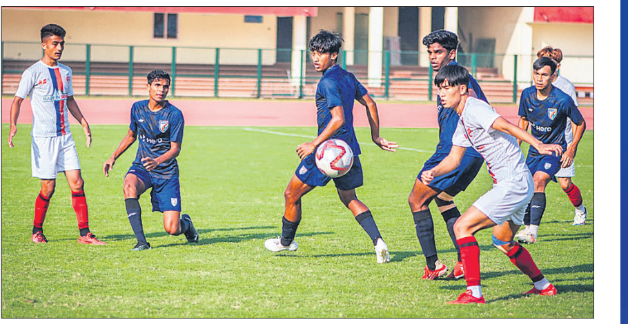
ଇଣ୍ଡିଆନ ଆରୋଲ ଓ ସିଲିନ ଦଳ ମଧ୍ୟରେ ଗୁରୁବାର ଅନୁଷ୍ଠିତ ମ୍ୟାଚ।

ଭୁବନେଶ୍ୱର, ୧୮।୧୧ (ଗ୍ରୀଡ଼ା ପ୍ରତିନିଧି) ଜାତୀୟ ପୁରୁଷ ଟୁର୍ନାମେଣ୍ଟ ସନ୍ତୋଷ ଟ୍ରଫି ପୂର୍ବରୁ ପ୍ରଭୃତି କ୍ୟାମ୍ପର ଅଂଶବିଶେଷ ଭାବେ ଓଡ଼ିଶା ସିରିଜର ପୁରୁଷ ଦଳ, ସିଲିନ ଦଳ ଏବଂ ଇଣ୍ଡିଆନ ଆରୋଲ ୧୯ ବର୍ଷରୁ କମ୍ ଭାରତୀୟ ଦଳ ମଧ୍ୟରେ ଏକ ବହୁଦୃଶ୍ୟ ତ୍ରିଦଳୀୟ ସିରିଜ କଳିଙ୍ଗ ଷ୍ଟାଡ଼ିୟମରେ ଅନୁଷ୍ଠିତ ହୋଇଛି। ରାଜ୍ୟ ସରକାରଙ୍କ କ୍ରୀଡ଼ା ଓ ଯୁବ ବ୍ୟାପାର ବିଭାଗ ଏବଂ ପୁରୁଷ ଆସୋସିଏସନ ଅଫ୍ ଓଡ଼ିଶା (ଫାଓ) ଆନୁକୁଲ୍ୟରେ ଏହି ସିରିଜ ଚଳିତ ମାସ ୧୧ ତାରିଖରୁ ଆରମ୍ଭ ହୋଇଛି। ସନ୍ତୋଷ ଟ୍ରଫି ପୂର୍ବରୁ ଏହି ସିରିଜ ମଧ୍ୟରେ କୋର୍ମାନ୍ଦେ ଖେଳାଳି ଚୟନ ପାଇଁ ଦଳରେ ପରୀକ୍ଷା ନିରୀକ୍ଷା କରିବା ସହ ଯୁବ ଖେଳାଳି, ଭ୍ରମଣକାରୀ ଦଳ ଏବଂ ଓଡ଼ିଶା ଖେଳାଳିଙ୍କ କୌଶଳକୁ ପରଖିବାର ସୁଯୋଗ