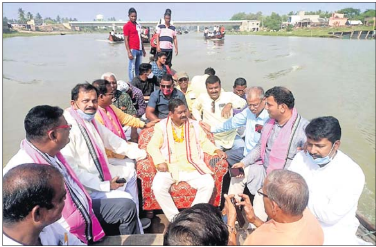
ଡଙ୍ଗାରେ ବସି ମନ୍ତ୍ରୀ ବିଶେଷକରି ଗୁରୁ ଚିଲିକା ମୁହାଣ ପରିଦର୍ଶନ କରୁଛନ୍ତି।