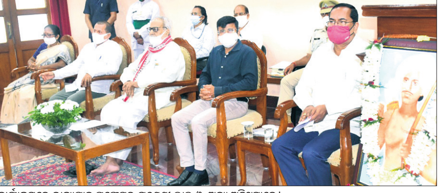
କାର୍ଯ୍ୟକ୍ରମରେ ରାଜ୍ୟପାଳ ପ୍ରଫେସର ଲାଲ ଓ ଅନ୍ୟ ଅତିଥିମାନେ।