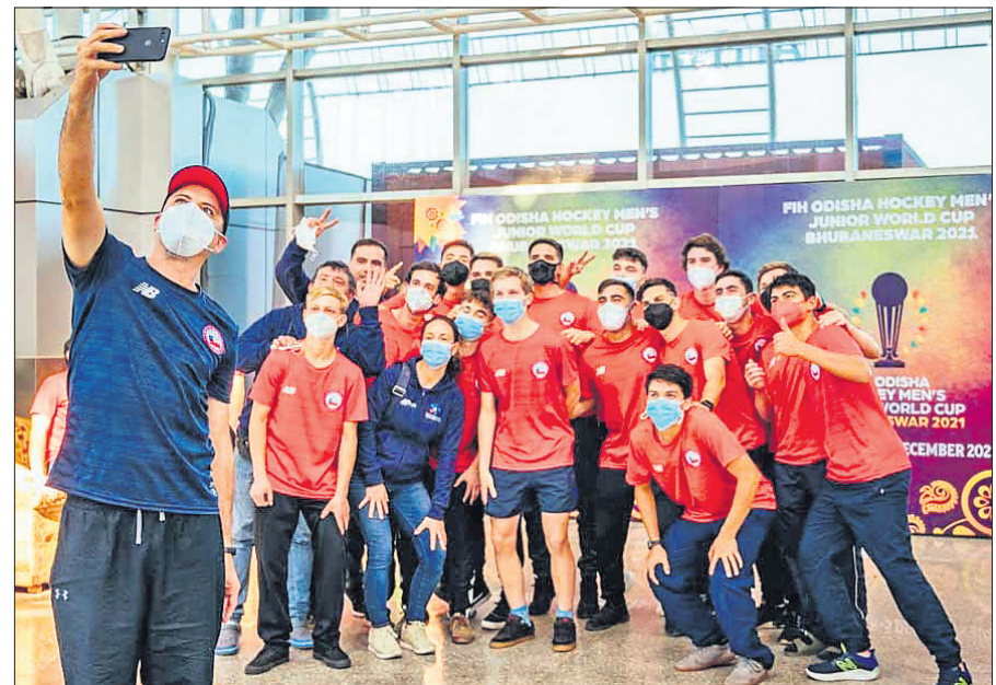
ଗୁରୁବାର ଭୁବନେଶ୍ୱର ବିମାନ ବନ୍ଦରରେ ପହଞ୍ଚିବାପରେ ଚିଲି ଖେଳାଳିଙ୍କ ସେଲଫି।