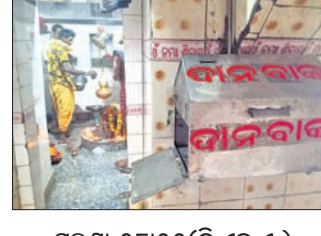
ସରଣା, ୧୮।୧୧