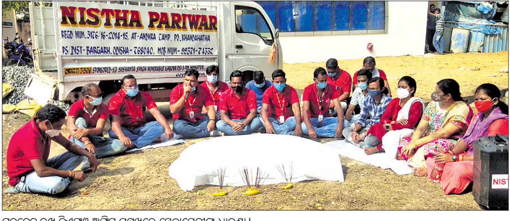
ମୃତଦେହ ରଖି ଡିଏଫଓ ଅଫିସ୍ ସମ୍ମୁଖରେ ସ୍ୱେଚ୍ଛାସେବୀଙ୍କ ଧାରଣା ।

ବରଗଡ଼ ସହରରେ ଶବଦାହ ପାଇଁ କାଠ ମିଳୁନି । ଏଥିପାଇଁ ଅନେକ ସମୟରେ ଲୋକଙ୍କୁ ହତହତାର ସମ୍ମୁଖୀନ ହେବାକୁ ପଡୁଛି । ବାରମ୍ବାର ପ୍ରଶ୍ନାବଳୀ ଦୃଷ୍ଟି ଆକର୍ଷଣ ସତ୍ତ୍ୱେ କୌଣସି ପୁଫାକ ମାଳୁନାହିଁ । ଏହାକୁ ନେଇ ଜନ ଅସନ୍ତୋଷ ବଢି ଚାଲିଛି । ତେବେ ଅଜଣା ଲୋକଙ୍କ ମୃତଦେହ ସକ୍ୱାର ସମୟରେ ଏହି ସମସ୍ୟା ବହୁଗୁଣିତ ହୋଇ ପଡୁଛି । ସ୍ୱେଚ୍ଛାସେବୀମାନେ ଶବଦାହ ପାଇଁ ଆଗେଇ ଆସୁଛନ୍ତି, ମାତ୍ର କାଠ ଅଭାବ ଶବଦାହରେ ବାଧକ ସାଜିଛି । ଏହାକୁ ନେଇ ସ୍ୱେଚ୍ଛାସେବୀଙ୍କ ମଧ୍ୟରେ ଅସନ୍ତୋଷ ଟେକିଛି । ଗୁରୁବାର ବରଗଡ଼ର ସ୍ୱେଚ୍ଛାସେବୀ ଅନୁଷ୍ଠାନ ନିଷ୍ଠା ପରିବାର ବରଗଡ଼ ବନଖଣ୍ଡ ଅଧିକାରୀଙ୍କ କାର୍ଯ୍ୟାଳୟରେ ଜଣେ ଅଜଣା ଲୋକଙ୍କ ମୃତଦେହ ରଖି ପ୍ରତିବାଦ କରିଥିଲେ । ସହକାରୀ ବନ