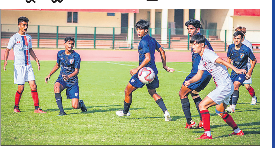
ଇଣ୍ଡିଆନ ଆରୋଲ ଓ ସିଲିନ ଦଳ ମଧ୍ୟରେ ଗୁରୁବାର ଅନୁଷ୍ଠିତ ମ୍ୟାଚ।

ଭୁବନେଶ୍ୱର, ୧୮।୧୧ (ଗ୍ରୀଡ଼ା ପ୍ରତିନିଧି) ଜାତୀୟ ପୁରୁଷ ଟୁର୍ନାମେଣ୍ଟ ସନ୍ତୋଷ ଟ୍ରଫି ପୂର୍ବରୁ ପ୍ରସ୍ତୁତି କ୍ୟାମ୍ପର ଅଂଶବିଶେଷ ଭାବେ ଓଡ଼ିଶା ସିରିଜର ପୁରୁଷ ଦଳ, ସିଲିନ ଦଳ ଏବଂ ଇଣ୍ଡିଆନ ଆରୋଲ ୧୯ ବର୍ଷରୁ କମ୍ ଭାରତୀୟ ଦଳ ମଧ୍ୟରେ ଏକ ବହୁତପୂର୍ଣ୍ଣ ତ୍ରିଦଳୀୟ ସିରିଜ କଳିଙ୍ଗ ଷ୍ଟାଡ଼ିୟମରେ ଅନୁଷ୍ଠିତ ହେଉଛି। ରାଜ୍ୟ ସରକାରଙ୍କ କ୍ରୀଡ଼ା ଓ ଯୁବ ବ୍ୟାପାର ବିଭାଗ ଏବଂ ପୁରୁଷ ଆସୋସିଏସନ ଅଫ୍ ଓଡ଼ିଶା (ଫାଓ) ଆନୁକୁଲ୍ୟରେ ଏହି ସିରିଜ ଚଳିତ ମାସ ୧୧ ତାରିଖରୁ ଆରମ୍ଭ ହୋଇଛି। ସନ୍ତୋଷ ଟ୍ରଫି ପୂର୍ବରୁ ଏହି ସିରିଜ ମଧ୍ୟରେ କୋର୍ମାନ୍ଦେ ଖେଳାଳି ଚୟନ ପାଇଁ ଦଳରେ ପରୀକ୍ଷା ନିରୀକ୍ଷା କରିବା ସହ ଯୁବ ଖେଳାଳି, ଭ୍ରମଣକାରୀ ଦଳ ଏବଂ ଓଡ଼ିଶା ଖେଳାଳିଙ୍କ କୌଶଳକୁ ପରଖିବାର ସୁଯୋଗ