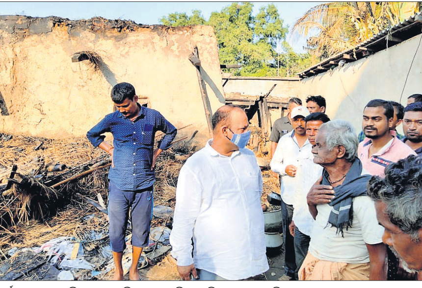
ପର୍ଯ୍ୟଟନ ଓ ସଂସ୍କୃତି ମନ୍ତ୍ରୀ ଜ୍ୟୋତି ପ୍ରକାଶ ପାଣିଗ୍ରାହୀ ବିପଦକୁ ଭେଟୁଛନ୍ତି।

ଖଜୁରା, ୧୮.୧୧ (ଡି.ଏନ.ଏ.) ଖଜୁରା, ଚିରିଧାରୀ ବନ୍ଧୁ ଓ ଜଗବନ୍ଧୁ କ୍ଷେତ୍ରମୋହନ ବନ୍ଧୁ ଓ ଜଗବନ୍ଧୁ ବନ୍ଧୁଙ୍କର ୧୩ ବର୍ଷରା ଜଳିଗଲା।