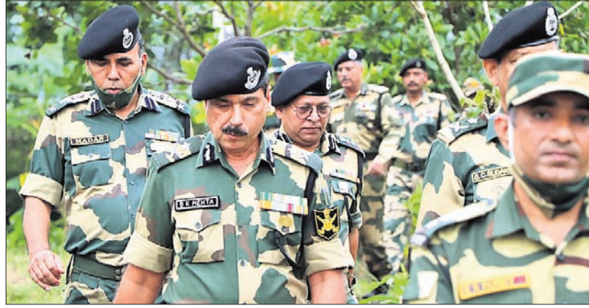
କୋରାପୁଟକୁ ଆସିଥିବା ବିଏସ୍‌ଏସ୍ ଅଧିକାରୀମାନେ।