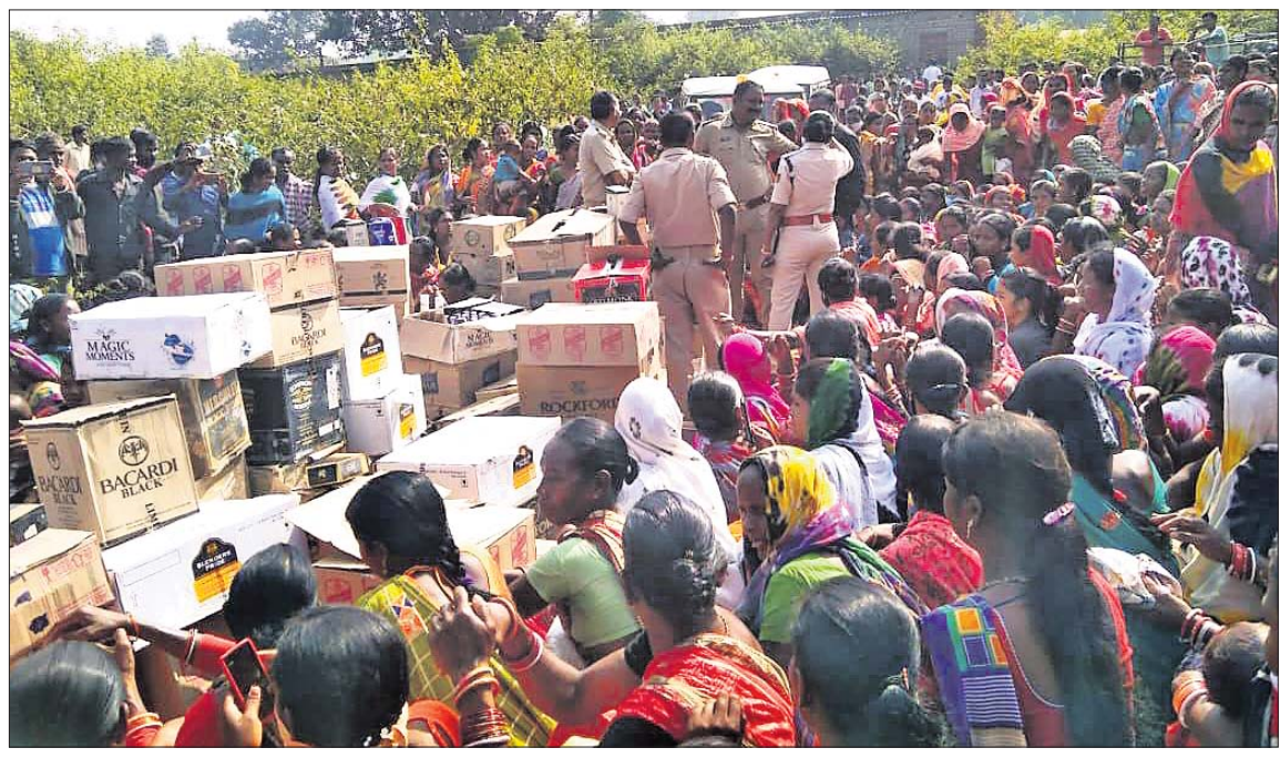
କେନ୍ଦୁଝର ଜିଲ୍ଲା ହାଟପଦାରେ ମଦ ଦୋକାନକୁ ବିରୋଧ କରି ଗୁରୁବାର ଭଙ୍ଗାଗୁଡ଼ା କରୁଥିବା ମହିଳା ବିଶୋଭକାରୀଙ୍କୁ ପୋଲିସ୍ ବୁଝାଶୁଝା କରୁଛି।