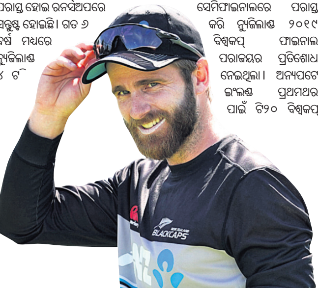
କେନ୍ଦ୍ର ଓଡ଼ିଶା ସମ୍ବନ୍ଧୀୟ

ଫାଇନାଲରେ ପ୍ରବେଶ କରିଥିଲେ ମଧ୍ୟ ଘରୋଇ ଅଷ୍ଟ୍ରେଲିଆଠାରୁ ପରାସ୍ତ ହୋଇ ରନସିପ ହୋଇଥିଲା।