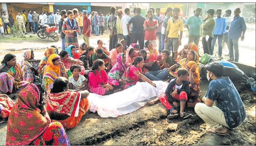
ପରିବାର ଲୋକେ ମୃତଦେହ ରଖି ଆୟୋଜନ କରୁଛନ୍ତି।

ସେଠାରେ ତୀବ୍ର ଭରଜନା ଦେଖାଦେଇଥିଲା। ଶ୍ରତିପୂରଣ ସହ ମୃତକଙ୍କ ପରିବାରର ଜଣେ ସଦସ୍ୟଙ୍କୁ ନିୟୁତ୍ତି ଦାବିରେ ପୂର୍ବାହ୍ନୁ ୧୧ଟାରେ ଅପରାହ୍ନୁ ୫ଟା ପର୍ଯ୍ୟନ୍ତ ରାଜପଥ ଅବରୋଧ କରାଯାଇଥିଲା।