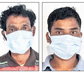
ଗିରଫ ୨ ଅଭିଯୁକ୍ତ।

ଭୁବନେଶ୍ୱର, (ଭୁବନୋ)/ବାଲିଗୁଡ଼ା, ୧୮.୧୧.୨୧ (ଡି.ଏନ୍.ଏ.)