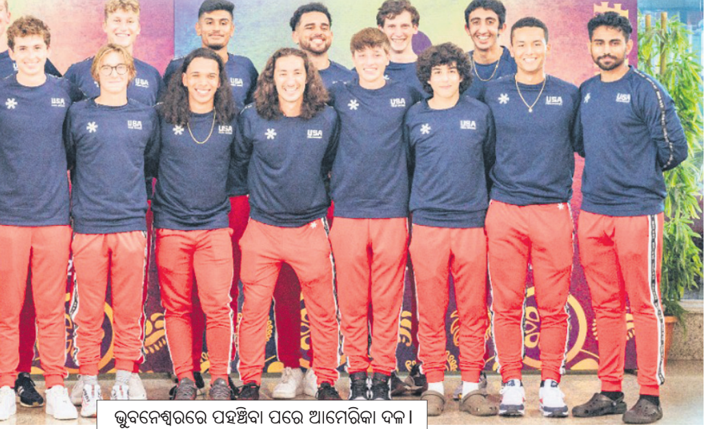
ଭୁବନେଶ୍ୱରରେ ପହଞ୍ଚିବା ପରେ ଆମେରିକା ଦଳ।

ଫାଇନାଲରେ ପ୍ରବେଶ କରିଥିଲେ ମଧ୍ୟ ଘରୋଇ ଅଷ୍ଟ୍ରେଲିଆଠାରୁ ପରାସ୍ତ ହୋଇ ରନସିପ ହୋଇଥିଲା।