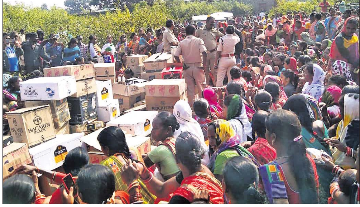
କେନ୍ଦୁଝର ଜିଲ୍ଲା ହାଟପଦାରେ ମଦ ଦୋକାନକୁ ବିରୋଧ କରି ଗୁରୁବାର ଭଙ୍ଗାଗୁଡ଼ା କରୁଥିବା ମହିଳା ବିଶୋଭକାରୀଙ୍କୁ ପୋଲିସ୍ ବୁଝାଶୁଣା କରୁଛି।