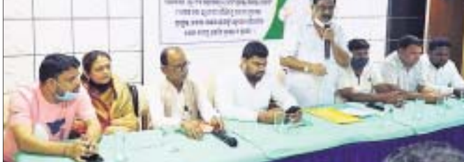
ଖବରଦାତା ସମ୍ମିଳନୀରେ ବିଜେଡି କର୍ମକର୍ମୀମାନେ ।

ଅନୁଗୋଳ ରସ୍ତାରେ ଆସିବା ପୂର୍ବରୁ ମୁଖ୍ୟମନ୍ତ୍ରୀ ନବୀନ ପଟ୍ଟନାୟକଙ୍କ ମୁଖ୍ୟମନ୍ତ୍ରୀ କର୍ମୀ ତରଫର ଯୋଜନା(ପୂର୍ଣ୍ଣ)ରେ ସହରର ଉନ୍ନୟନ କାର୍ଯ୍ୟ ପାଇଁ ୭ କୋଟି ୮୦ ଲକ୍ଷ ଟଙ୍କା ଅନୁମୋଦନ କରିଛନ୍ତି । ଏହି ଅର୍ଥ ବ୍ୟୟରେ ଓପେଡି ଜିଏସ୍ ସହ ଖଳି ଗ୍ରାଉଁ ଡେଭେଲପମେଣ୍ଟ ଲୋଡ୍ ଆଦି କରାଯିବ । ଗତ ସପ୍ତାହରେ ଭିଡିଓ କନଫରେନ୍ସ ଯୋଗେ ହୋଇଥିବା ବୈଠକରେ ନଗର ବିଜେଡି ପକ୍ଷରୁ ଏହି ପ୍ରସ୍ତାବ ଦିଆଯାଇଥିଲା । ତେବେ ୭ ଦିନ ନ ପୁରୁଣୁ ମୁଖ୍ୟମନ୍ତ୍ରୀ ଏହାକୁ ଅନୁମୋଦନ କରିଥିବାରୁ ଏକ