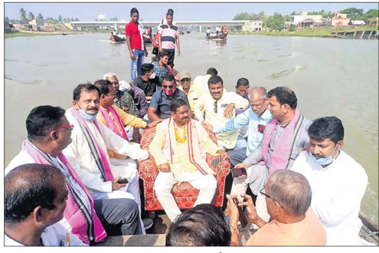
ଡଙ୍ଗାରେ ବସି ମନ୍ତ୍ରୀ ବିଶେଷର ରୁଚ୍ଛୁ ତିଳିକା ମୁହାଣ ପରିଦର୍ଶନ କରୁଛନ୍ତି।

କଟକ, ୧୮।୧୧ (ସ.ପ୍ର.): ଯୋଗୁ ଜଳନିଷାସନ ହୋଇ ନ ପାରି ଅନେକ ଧନକାରୀଙ୍କ ଶ୍ରତିଗ୍ରସ୍ତ ହେଉଛି। ବିଶେଷ କରି କଣାସ ସମେତ ଆଖପାଖ ତେଲଙ୍ଗା, ପିପିଲି, ବ୍ରହ୍ମଗିରି, ସତ୍ୟବାଦୀ ଭଳି ମଧ୍ୟ ରାଜ୍ୟର, ଜନସାଧାରଣ ଅଧିକ ଶ୍ରତି ସହୁଛନ୍ତି।