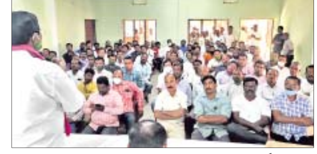
ମାନବୋର ଛକ ନିକଟ ସଭାଘରେ ଅନୁଷ୍ଠିତ ବୈଠକରେ ନେତା ଓ କର୍ମୀମାନେ ।