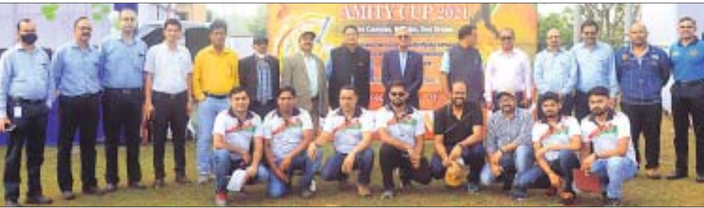
ଉଦ୍ଘାଟନା ଅବସରରେ ପ୍ଲକ୍ସ ଅଧିକାରୀ ଓ ଅନ୍ୟମାନେ ।

ଉଦ୍ଘାଟନା କରିଥିଲେ । ଉଦ୍ଘାଟନା ମ୍ୟାଚ୍ ଜେଏସ୍ପିଏଲ ଏବଂ ଏସ୍ପିଏଲ୍ ଷ୍ଟିଲ ମଧ୍ୟରେ ଖେଳାଯାଇଥିଲା । ଏସ୍ପିଏଲ୍ ଷ୍ଟିଲ ପ୍ରଥମେ ବ୍ୟାଟିଂ କରି ୯୩ ରନ କରିଥିଲା । ଜବାବରେ ଜେଏସ୍ପିଏଲ୍ ଷ୍ଟିଲ ୨ ଓଭରରେ ୫୫ ରନ କରି ଲକ୍ଷ୍ୟ ହାସଲ କରିଥିଲା । ସେହିଭଳି ଦ୍ଵିତୀୟ ମ୍ୟାଚ୍ ଜେଏସ୍ପିଏଲ୍ ଓ ଜିଏମ୍ଆର୍ ମଧ୍ୟରେ ଖେଳା ଯାଇଥିଲା । ପ୍ରଥମେ