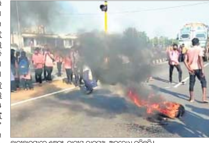
ଛାତ୍ରଛାତ୍ରୀମାନେ ୫୩୩. କାତାୟ ରାଜପଥ ଅବରୋଧ କରିଛନ୍ତି ।