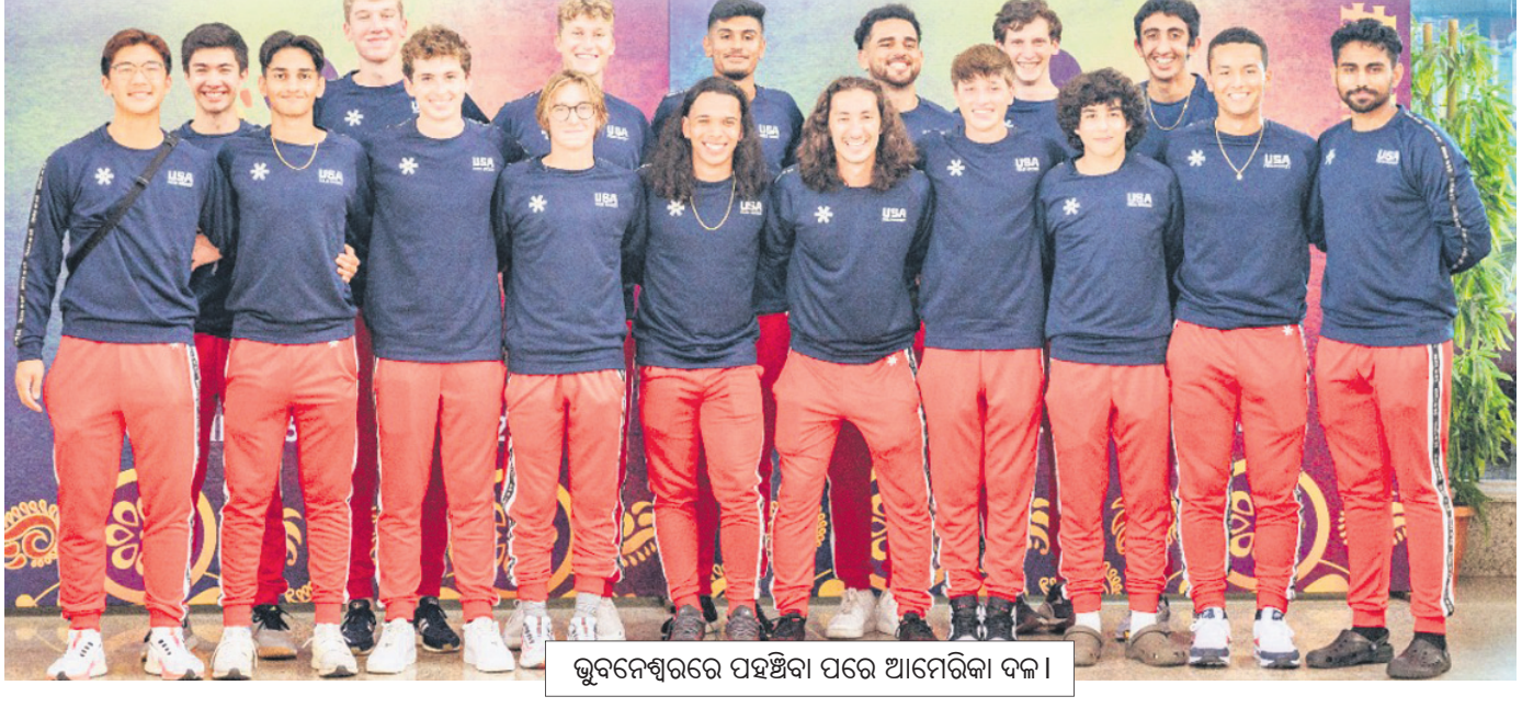
ଭୁବନେଶ୍ୱରରେ ପହଞ୍ଚିବା ପରେ ଆମେରିକା ଦଳ।

ଓଡ଼ିଶାରେ ଆୟୋଜନ ହେବାକୁ ଯାଉଛି ଆଉ ଏକ ମେଗା ଇଭେଣ୍ଟ। କୁନିୟର ପୁରୁଷ ହକି ବିଶ୍ୱକପର ଦ୍ୱାଦଶ ସଂସ୍କରଣ କଳିଙ୍ଗ ଷ୍ଟାଡ଼ିୟମ ହକି କମ୍ପ୍ଲେକ୍ସରେ ଆସନ୍ତା ୨୪ରୁ ଆରମ୍ଭ ହୋଇ ଡିସେମ୍ବର ୫ ତାରିଖରେ ଶେଷ ହେବ। ୪ଟି କନ୍ଫେଡେରେଶନ ଶ୍ରେଣ୍ଡ ୧୨ଟି ଦଳ ଏଥିରେ ଅଂଶଗ୍ରହଣ କରିବେ। କାନାଡା, ଫ୍ରାନ୍ସ, ପୋଲାଣ୍ଡ ସମେତ ଡିଫେଣ୍ଡିଂ ଚାମ୍ପିୟନ ଭାରତ ଗ୍ରୁପ୍ 'ବି'ରେ ସାମିଲ ହୋଇଛି।