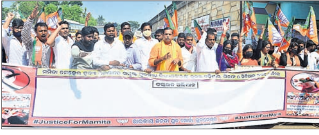
ଭୁବନେଶ୍ୱର, ୧୮।୧୧ (ଭୁବେ)