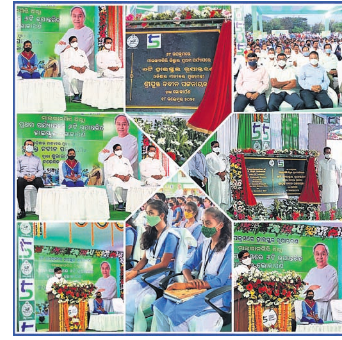
ମାଲକାନଗିରି ଜିଲାର ରୂପାନ୍ତରିତ ସ୍କୁଲ।

ଇଞ୍ଜିନିୟର ହେବାର ସ୍ୱପ୍ନ ଯେପରି ସାକାର ହୋଇପାରିବ, ସେଥିପାଇଁ ରାଜ୍ୟ ସରକାର ସେମାନଙ୍କ ପାଇଁ ୧୫ ପ୍ରତିଶତ ଆୟନ ସଂରକ୍ଷିତ କରିଛନ୍ତି। ମୁଖ୍ୟମନ୍ତ୍ରୀ କହିଛନ୍ତି, ସ୍କୁଲରେ ତିଆରି ହୁଏ ଦେଶର ଭବିଷ୍ୟତ, ଜାତିର ଭବିଷ୍ୟତ। କଥାରେ ଅଛି, ପିଲାମାନେ ଆମ ଜନସଂଖ୍ୟାର ଏକ ତୃତୀୟାଂଶ ହେଲେ ବି ସେମାନେ ଆମର ପୂରା ଭବିଷ୍ୟତ। ସ୍କୁଲ ସମୟ ପିଲାମାନଙ୍କ ଜୀବନର ସବୁଠାରୁ ଗୁରୁତ୍ୱପୂର୍ଣ୍ଣ ସମୟ। ଏ ସମୟରେ ପିଲାମାନଙ୍କୁ ସେମାନଙ୍କର ପ୍ରତିଭାର ବିକାଶ ପାଇଁ ସୁଯୋଗ ସୃଷ୍ଟି କରିବା ଆମର ଦାୟିତ୍ୱ। ପୂର୍ବ ଚାହେଁ ମୋ ରାଜ୍ୟର ପିଲା ସବୁ କ୍ଷେତ୍ରରେ ଆଗୁଆ ହୁଅନ୍ତୁ। ପାଠ ସହ କ୍ରୀଡ଼ା, ସଂଗୀତ ସବୁ କ୍ଷେତ୍ରରେ ଓଡ଼ିଶାର ଗୌରବ ବଢ଼ାନ୍ତୁ। ନୂଆ ନୂଆ ଜ୍ଞାନକୌଶଳ ବିଷୟରେ ଜାଣନ୍ତୁ। ବଡ଼ ବଡ଼ ସ୍ୱପ୍ନ ଦେଖନ୍ତୁ ଓ ଜୀବନର ସବୁ ଚ୍ୟାଲେଞ୍ଜକୁ ସାମନା କରିବା ପାଇଁ ଆତ୍ମବିଶ୍ୱାସ ସହ ଆଗକୁ ବଢ଼ନ୍ତୁ। ଏହା ହିଁ ହେଉଛି ସ୍କୁଲ ରୂପାନ୍ତର ଲକ୍ଷ୍ୟ।