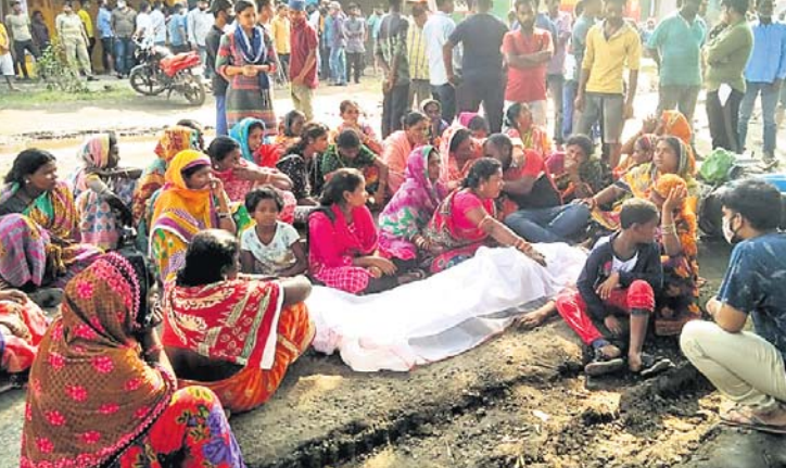
ପରିବାର ଲୋକେ ମୃତଦେହ ରଖି ଆନ୍ଦୋଳନ କରୁଛନ୍ତି।