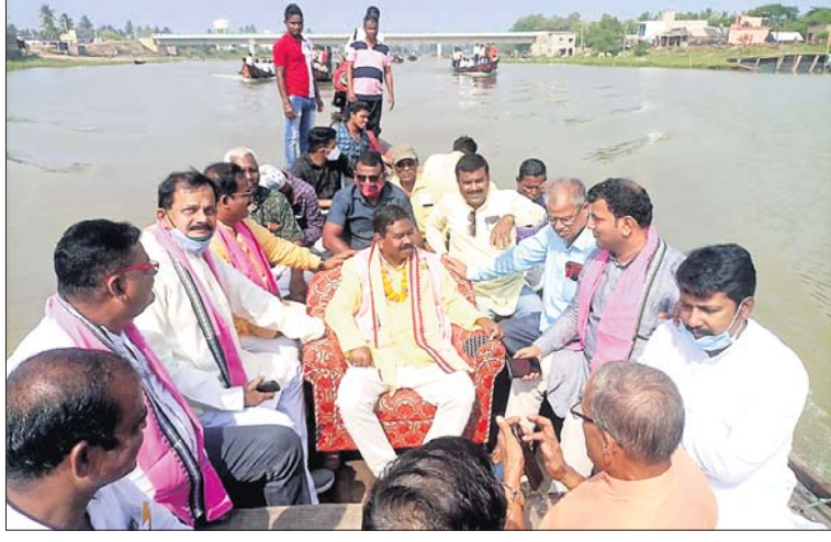
ଡଙ୍ଗାରେ ବସି ମନ୍ତ୍ରୀ ବିଶେଷର ରୁଚ୍ଛୁ ତିଳିକା ମୁହାଣ ପରିଦର୍ଶନ କରୁଛନ୍ତି।