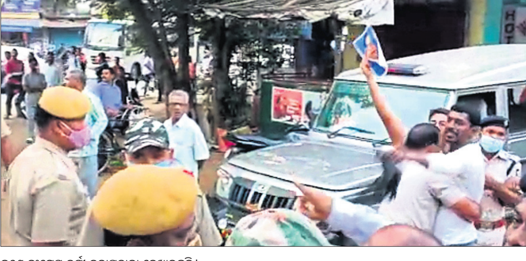
ଜଣେ କଂଗ୍ରେସ କର୍ମୀ କଳାପତାକା ଦେଖାଉଛନ୍ତି।