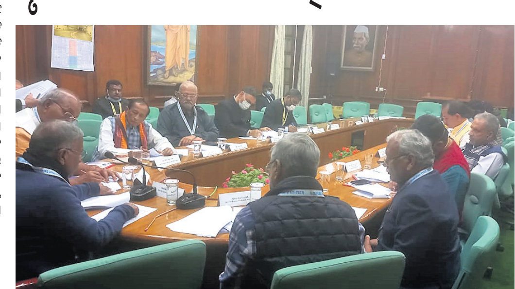
ସମ୍ମିଳନୀରେ ଓଡ଼ିଶା ବିଧାନସଭା ବାଚସ୍ପତି ସୂର୍ଯ୍ୟନାରାୟଣ ପାତ୍ର ଓ ଅନ୍ୟମାନେ।