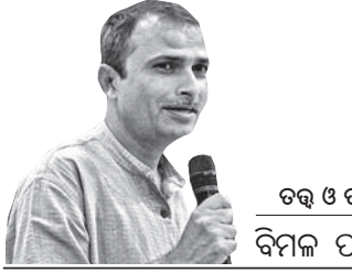
ଚର୍ଚ୍ଚ ଓ ଚର୍ଚ୍ଚ ବିମଳ ପାଣିଆ