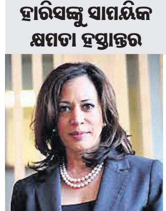
କମଲା ହାରିସ୍ କଲୋନୋଷ୍ଠାପି କୁହାଯାଏ। ୨୦୦୨ ଏବଂ ୨୦୦୭ରେ ଚଳାକାଳୀନ ରାଷ୍ଟ୍ରପତି ଜର୍ଜ୍‌ତୁକୁ ସୁଖିକର କଲୋନୋଷ୍ଠାପି ବେଳେ ସେ ଉପରାଷ୍ଟ୍ରପତିଙ୍କୁ କ୍ଷମତା ହସ୍ତାନ୍ତର କରିଥିଲେ।

ଓଶିଂଟନ, ୧୯।୧୧ ଆମେରିକା ରାଷ୍ଟ୍ରପତି ଜୋ ବାଲତେନ କଲୋନୋଷ୍ଠାପି ପାଇଁ ହସ୍ପିଟାଲରେ ଭର୍ତ୍ତି ହୋଇଛନ୍ତି ଓ ତାଙ୍କୁ ଆନାଲ୍‌ସ୍ତେସିଆ ଦିଆଯାଇଛି। କଲୋନୋଷ୍ଠାପି ପୂର୍ବରୁ ଶୁକ୍ରବାର ସେ ଉପରାଷ୍ଟ୍ରପତି କମଲା ହାରିସଙ୍କୁ ସାମୟିକ ଭାବେ କ୍ଷମତା ହସ୍ତାନ୍ତର କରିଥିବା ସ୍ଵାଇଚ୍ ହାତ୍‌ସ୍ ପକ୍ଷରୁ କୁହାଯାଇଛି। ଏହି ସମୟରେ ହାରିସ ନିଜ ଫ୍ରେଣ୍ଡ୍ ଫ୍ରେଣ୍ଡ୍ ଅଫିସରୁ କାର୍ଯ୍ୟ କରିବେ ବୋଲି ସ୍ଵାଇଚ୍ ହାତ୍‌ସ୍ ପ୍ରେସ୍ ସଚିବ ଜେନ୍ ସାଜି କହିଛନ୍ତି। ଦୁହେଁଙ୍କୁ ଭିତରକୁ ପରୀକ୍ଷା କରି ଦେଖିବା ପାଇଁ ଏହା ଭିତରେ ଏକ ଫ୍ଲୁଇଦ୍ କ୍ୟାମେରା ଖଞ୍ଜା ଯାଇଥିବା। ଏହା ବ୍ଵାରା ଦୁହେଁଙ୍କୁ ରକ୍ତକ୍ଷରଣ, ପୋଲିସ୍ ଏବଂ କେଲୋନ କ୍ୟାମେରା ଲକ୍ଷଣ ସମ୍ପର୍କରେ ଜଣାପଡ଼ିଥିବା। ଏହି ପରୀକ୍ଷାକୁ