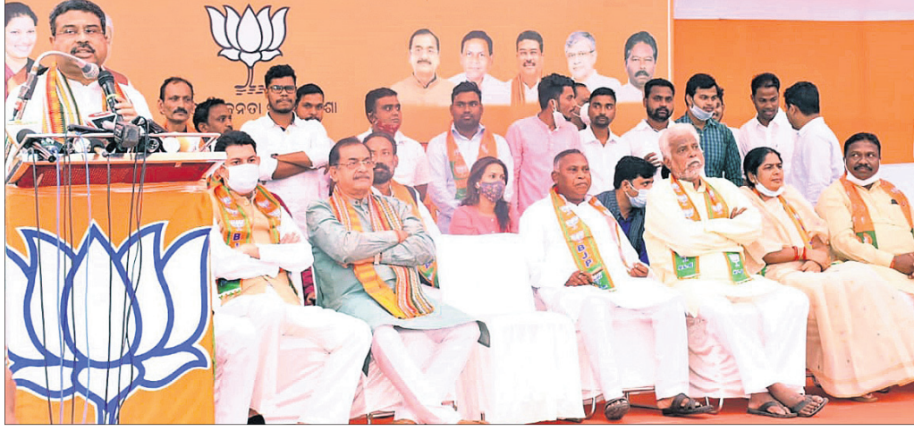
ଭାଜପା ରାଜ୍ୟ କାର୍ଯ୍ୟକ୍ରମରେ ଶୁକ୍ରବାର ଆୟୋଜିତ କାର୍ଯ୍ୟକ୍ରମରେ କେନ୍ଦ୍ରମନ୍ତ୍ରୀ ଧର୍ମେନ୍ଦ୍ର ପ୍ରଧାନ ଉଦ୍‌ବୋଧନ ଦେଉଛନ୍ତି।