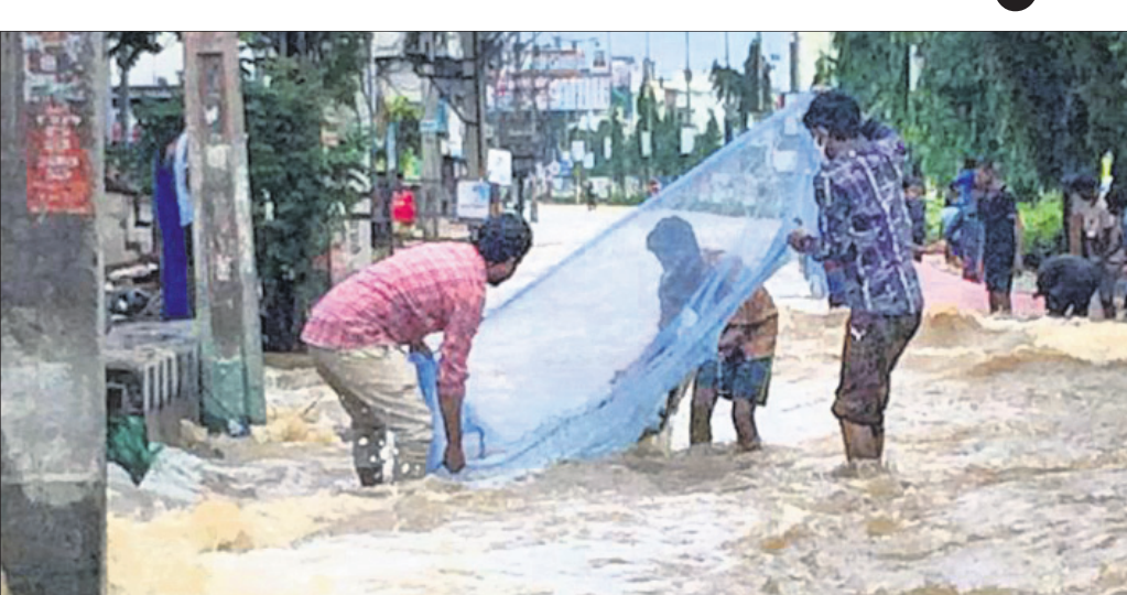
ତିରୁପତିଠାରେ ଲୋକେ ପାଣିଭର୍ତ୍ତି ରାସ୍ତାକୁ ମାଛ ଧରୁଛନ୍ତି।

ଶତାଧିକ ନିଖୋଜ ତିରୁପତି, ୧୯।୧୧ ବଙ୍ଗୋପସାଗରରେ ସୃଷ୍ଟି ଲଘୁଚାପ ପ୍ରଭାବରେ ଆନ୍ତପ୍ରଦେଶର ବିଭିନ୍ନ ଜିଲ୍ଲାରେ ପ୍ରବଳ ବର୍ଷା ଲାଗିରହିଛି। ରାୟାଲସୀମା ଅନ୍ତର୍ଗତ ୪ ଜିଲ୍ଲାରେ ବର୍ଷା ଓ ବନ୍ୟାରେ ଶୁକ୍ରବାର ୧୭ ଜଣଙ୍କ ମୃତ୍ୟୁ ଘଟିବା ସହ ଶତାଧିକ ନିଖୋଜ ହୋଇଯାଇଛନ୍ତି। ତେଣୁ ମୁତ ନଦୀରେ ବନ୍ୟା ଆଦି ଅନେକ ଗ୍ରାମ ଜଳାଶୁବ୍ଧ ହୋଇଥିବାବେଳେ ନନ୍ଦାଲୁରଠାରେ ଥିବା ସ୍ଵାମୀ ଆନନ୍ଦ ମନ୍ଦିର ପାଣିରେ ବୁଡ଼ିଯାଇଛି। କଟପା ଜିଲ୍ଲାର ରାଜମପେଟ ଓ ଅନ୍ୟ ଅଞ୍ଚଳ ବନ୍ୟାସ୍ଵାଦିତ ହୋଇଛି। ରିଲିଫ୍ ଓ ଉଦ୍ଧାର କାର୍ଯ୍ୟରେ ଅଗ୍ନିଶମ, ଏନ୍‌ଡିଆର୍‌ଏଫ୍ ଏବଂ ଏସ୍‌ଆଇଏଫ୍ ଚମ୍ପୁ ନିୟୋଜିତ କରାଯାଇଛି। ଗଞ୍ଜଲୁରୁ ଅଞ୍ଚଳରୁ ୬ ମୃତଦେହ ମିଳିଥିବା ବେଳେ ରାୟାଲସୀମାରେ ୩୩ ଏବଂ ମଝପାଲି ନିକଟରୁ ୨ ଜଣଙ୍କ ମୃତଦେହ ମିଳିଛି। ମଝପାଲି, ଆକେପାଡ଼ି, ନନ୍ଦାଲୁରୁ ଅଞ୍ଚଳରୁ ୩୦ ଜଣ ବନ୍ୟାରେ ଭାସିଯାଇଛନ୍ତି। ବିଭିନ୍ନ ସ୍ଥାନରେ ଜାତୀୟ ରାଜପଥ ଓ ରେଳଲାଇନ ପାଣିରେ ବୁଡ଼ିଯାଇଛି। କଟପା ବିମାନ ବନ୍ଦରକୁ ୨୫ ତାରିଖ ଯାଏ ବନ୍ଦ କରାଯାଇଥିବାବେଳେ ନନ୍ଦାଲୁର-ରାଜାପେଟ ମଧ୍ୟରେ ଚଳାଚଳ କରୁଥିବା ୧୦ଟି ଟ୍ରେନ୍‌ର ରୁଟ୍ ପରିବର୍ତ୍ତନ ହୋଇଛି। ଲଘୁଚାପ ଯୋଗୁ ଆନ୍ତପ୍ରଦେଶର