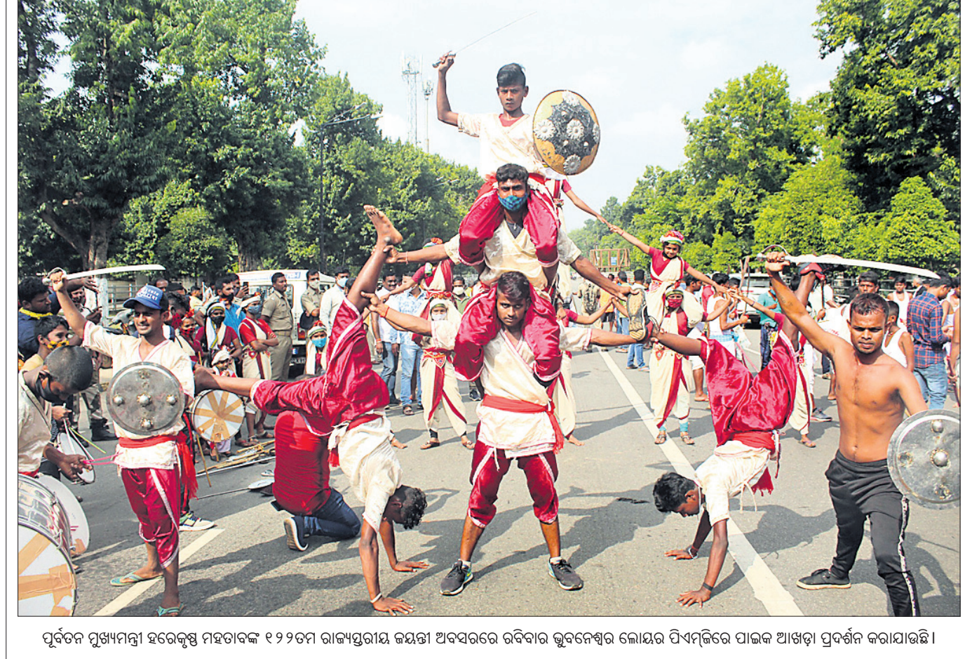
ପୂର୍ବତନ ମୁଖ୍ୟମନ୍ତ୍ରୀ ହରେକୃଷ୍ଣ ମହତାବଙ୍କ ୧୨୭ତମ ରାଜ୍ୟସ୍ତ୍ରୀୟା ଇନ୍ଦ୍ରା ଅବସରରେ ରବିବାର ଭୁବନେଶ୍ୱର ଲୋକସଭା ପରିସରରେ ପାଇକ ଆଖଡ଼ା ପ୍ରଦର୍ଶନ କରାଯାଇଛି ।

ଶ୍ରେଷ୍ଠ ୧୦ରେ ଓଡ଼ିଶାର ପୁର ଆଦର୍ଶ ବିଦ୍ୟାଳୟ ସମ୍ମାନ ପାଇଛି । ଶ୍ରେଷ୍ଠ ୧୦ରେ ଓଡ଼ିଶାର ପୁର ଆଦର୍ଶ ବିଦ୍ୟାଳୟ ସମ୍ମାନ ପାଇଛି । ଶ୍ରେଷ୍ଠ ୧୦ରେ ଓଡ଼ିଶାର ପୁର ଆଦର୍ଶ ବିଦ୍ୟାଳୟ ସମ୍ମାନ ପାଇଛି ।