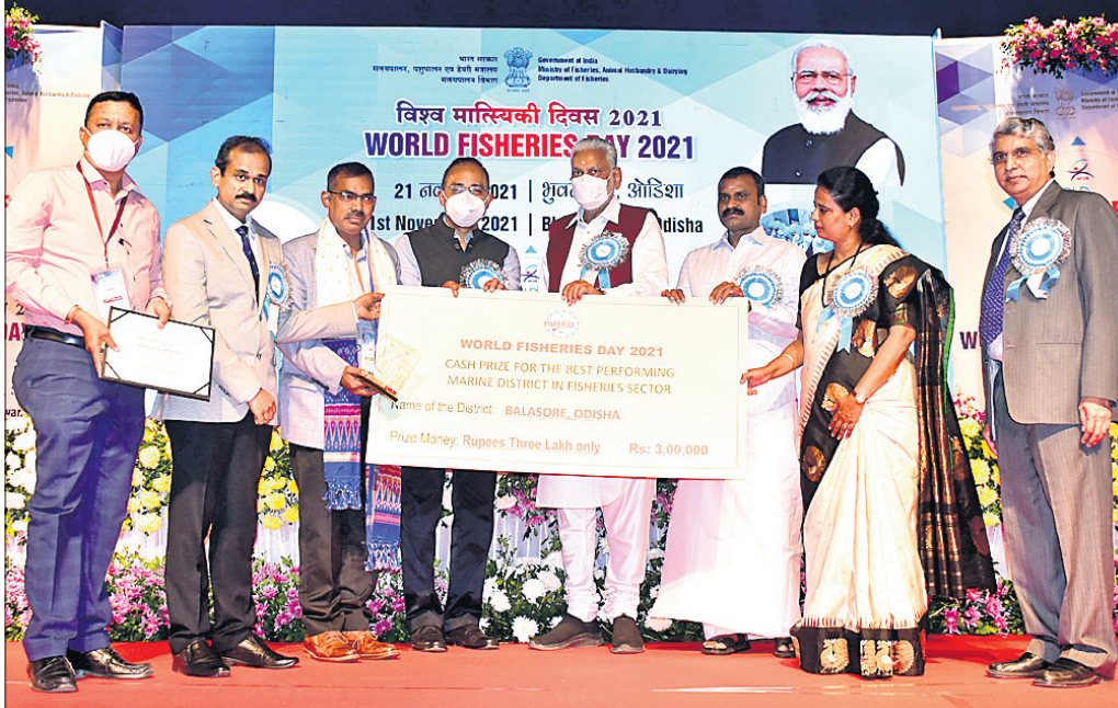
ବାଲେଶ୍ୱର ଜିଲ୍ଲାକୁ ପୁରସ୍କାର ପ୍ରଦାନ ଅବସରରେ କେନ୍ଦ୍ରମନ୍ତ୍ରୀ ପୁରୁଷୋତ୍ତମ ଚୁପାଳା ଓ ଅନ୍ୟମାନେ ।

ବିଧାନସଭାରେ ଶୀଘ୍ର ଅଧିବେଶନ ଆରମ୍ଭ ହେବ । ବିଧାନସଭାରେ ଶୀଘ୍ର ଅଧିବେଶନ ଆରମ୍ଭ ହେବ । ବିଧାନସଭାରେ ଶୀଘ୍ର ଅଧିବେଶନ ଆରମ୍ଭ ହେବ । ବିଧାନସଭାରେ ଶୀଘ୍ର ଅଧିବେଶନ ଆରମ୍ଭ ହେବ ।