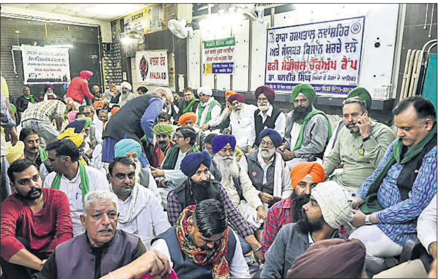
ବିକାର ସିଂଗୁ ସାମାଜିକ ସଂକଳ୍ପରେ ବିଭିନ୍ନ ଚାଷୀ।

ନୂଆଦିଲ୍ଲୀ, ୨୧।୧୧ କେନ୍ଦ୍ରର ୩ ବିବାଦୀୟ କୃଷି ଆଇନ ପ୍ରତ୍ୟାହାର ସହ ଉତ୍ପାଦିତ ସାମଗ୍ରୀର ସର୍ବନିମ୍ନ ସହାୟକ ମୂଲ୍ୟ (ଏମ୍‌ଏସ୍‌ପି) ପ୍ରଦାନ ପାଇଁ ସରକାର ଗ୍ୟାରେଣ୍ଟି ଦିଅନ୍ତୁ ବୋଲି ରବିବାର କୃଷକ ସଙ୍ଗଠନଗୁଡ଼ିକ ପକ୍ଷରୁ ଦାବି କରାଯାଇଛି। ଚାଷୀମାନେ ନିଜ ଦାବିରେ ଅଡ଼ିବସିଥିବାବେଳେ କୃଷି ଆଇନ ପ୍ରତ୍ୟାହାର ସମ୍ପର୍କିତ ବିଲକୁ ରୁଧିବାର କେନ୍ଦ୍ର କ୍ୟାବିନେଟ ମଞ୍ଜୁରୀ ଦେଇପାରେ। କ୍ୟାବିନେଟ ଅନୁମୋଦନ ପରେ ୨୯ରେ ଆରମ୍ଭ ହେବାକୁ ଥିବା ପାର୍ଲିାମେଣ୍ଟର ଶୀତ ଅଧିବେଶନରେ ଉପସ୍ଥାପନ କରାଯିବ ବୋଲି ସରକାରୀ ସୂତ୍ରରୁ ଜଣାପଡ଼ିଛି। ଉତ୍ତର ପ୍ରଦେଶ, ଉତ୍ତରାଖଣ୍ଡ, ପଞ୍ଜାବ, ଗୋଆ ଓ ମଣିପୁରରେ ଆସନ୍ତା ବର୍ଷ ଫେବୃୟାରୀ-ମାର୍ଚ୍ଚ ଆଡ଼କୁ ବିଧାନସଭା ଭୋଟ ହେବ। ନିର୍ବାଚନରେ ପରାଜୟ ଭୟରେ ପ୍ରଧାନମନ୍ତ୍ରୀ ନରେନ୍ଦ୍ର ମୋଦି ଆନ୍ଦୋଳନର ଚାଷୀଙ୍କ ଦାବି ଆଗରେ ମୁଣ୍ଡ ନୁଆଁଇ ୩ କୃଷି ଆଇନ ପ୍ରତ୍ୟାହାର କରାଯିବ ବୋଲି ଶୁଣ୍ଠିବାର ଚିତ୍ତିରେ ଘୋଷଣା କରିଥିଲେ। ହେଲେ ମୋଦିଙ୍କ ଘୋଷଣାକୁ ଆନ୍ଦୋଳନର କୃଷକମାନେ ବିଶ୍ୱାସକୁ