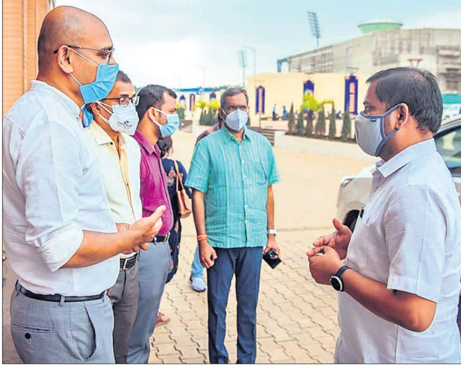
କୁନିୟର ହକି ବିଶ୍ୱକପ ଆୟୋଜନ ପାଇଁ କଳିଙ୍ଗ ଷ୍ଟାଡ଼ିୟମରେ ପ୍ରସ୍ତୁତି ସମୀକ୍ଷା ଅବସରରେ ରବିବାର କ୍ରୀଡ଼ାମନ୍ତ୍ରୀ ତୁଷାରକାନ୍ତି ବେହେରା କ୍ରୀଡ଼ା ବିଭାଗର କର୍ମକର୍ତ୍ତା ଓ ହକି ଲଢ଼ିଆର ଅଧିକାରୀଙ୍କ ସହ ଆଲୋଚନା କରୁଛନ୍ତି।