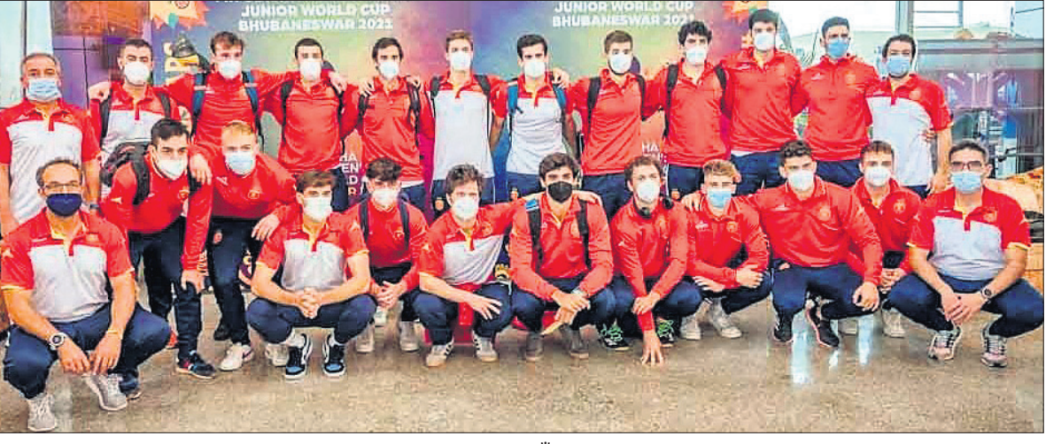
ଏଫଆଇଏଚ୍ ଓଡ଼ିଶା ହକି କୁନିୟର ବିଶ୍ୱକପ ଖେଳିବା ପାଇଁ ରବିବାର ଭୁବନେଶ୍ୱରରେ ପହଞ୍ଚିଥିବା ସ୍ନେହ ଦଳ।

ଭୁବନେଶ୍ୱର, ୨୧।୧୧ (କ୍ରୀଡ଼ା ପ୍ରତିନିଧି): ଆଗାମୀ ଏଫଆଇଏଚ୍ ଓଡ଼ିଶା ହକି କୁନିୟର ବିଶ୍ୱକପ ଖେଳିବା ପାଇଁ ଶେଷ ବିବେଚନା ଦଳଭାବେ ସ୍ନେହ ରବିବାର ଭୁବନେଶ୍ୱରରେ ପହଞ୍ଚିଲେ। ପୂର୍ବରୁ ଅନ୍ୟ ୧୪ଟି ଦଳ ପହଞ୍ଚି ସାରିଛନ୍ତି। ତେଣୁ ଆୟୋଜକ ଭାବେ ସମସ୍ତ ଅଂଶଗ୍ରହଣ କରିବାକୁ ଯାଉଥିବା ସମସ୍ତ ୧୬ଟି ଯାକ ଦଳ ଏବେ ଭୁବନେଶ୍ୱରରେ ଏକାଠି ହୋଇଛନ୍ତି। ତଳିତ ମାସ ୨୪ରୁ ତିସେମ୍ବର ୫ ପର୍ଯ୍ୟନ୍ତ ହେବ କୁନିୟର ହକି ବିଶ୍ୱକପର ଦ୍ୱାଦଶ ସଂସ୍କରଣ। ରାଜ୍ୟ ସରକାରଙ୍କ ପକ୍ଷରୁ ସମସ୍ତ ପ୍ରସ୍ତୁତି ଶେଷ ହୋଇଛି। କଳିଙ୍ଗ ଷ୍ଟାଡ଼ିୟମ ପ୍ରସ୍ତୁତ, ଏବେ କେବଳ ଚଳିତ ମାସ ୨୪ରୁ ହେବ କୁନିୟର ହକି ବିଶ୍ୱକପର ଦ୍ୱାଦଶ ସଂସ୍କରଣ।